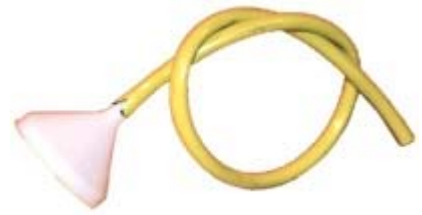
mànega amb embut