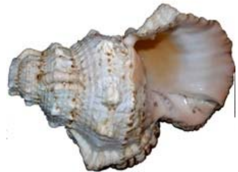
Cargol de mar