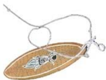
girador de vent