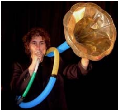
Tuba de tub