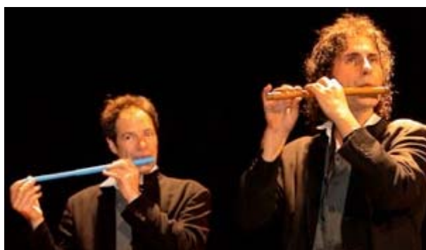
flauta d'èmbol i flauta travessera