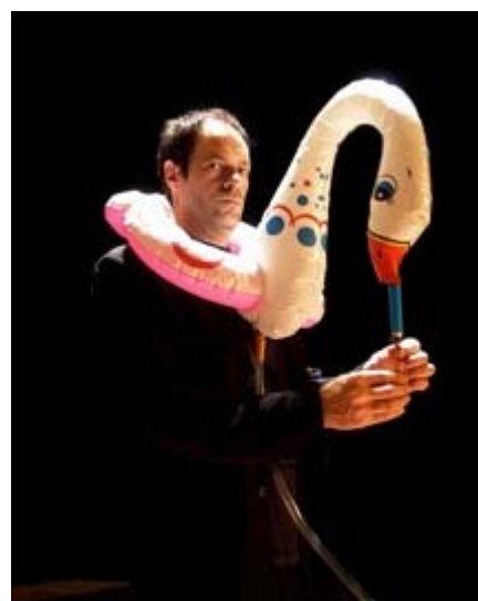
cigne de gemecs