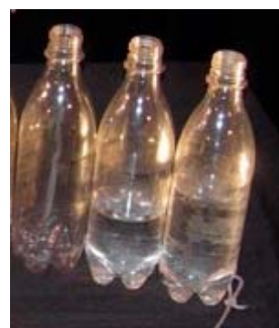
Ampolles amb aigua