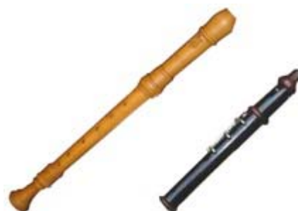
flauta dolça i flabiol