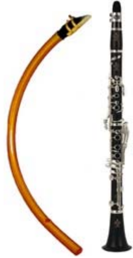
mànega i clarinet