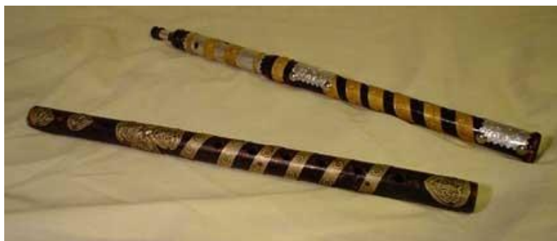
Flautes de l'Afganistan