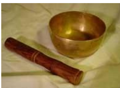
Bol del Tibet