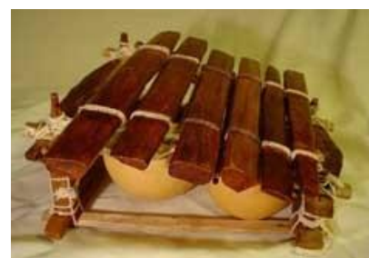
Xilòfon del Senegal