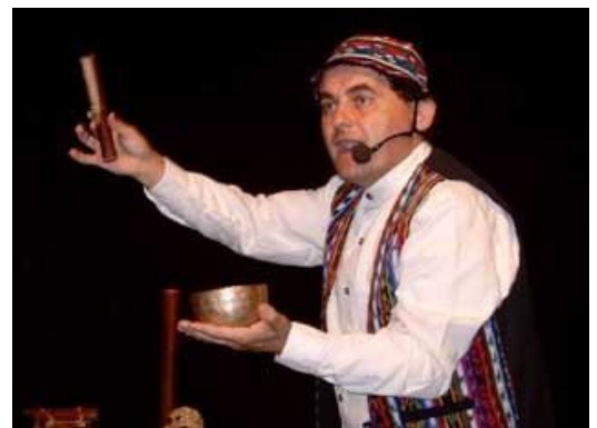
Tocant el bol del Tibet