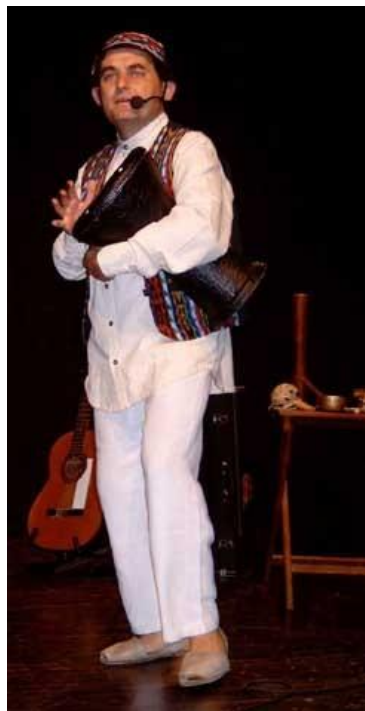
Tocant el jembé