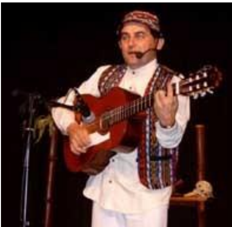
Tocant la guitarra

Tots aquests instruments es presentaran acompanyats de cançons que s'ensenyaran als nens i quees cantaran amb la guitarra espanyola.