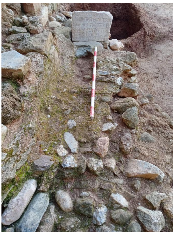
Foto: tomba monumental atribuïda a Ermomir amb la seva làpida sepulcral, abans d'obrir.

La troballa situa el jaciment altmedieval i l'assentament de Castellar Vell en el mapa arqueològic europeu, en un context amb pocs exemples de descobriments similars. A més, hi concorre una particularitat excepcional: s'han pogut identificar les persones enterrades. Es tractaria de dos magnats esposos del segle X, Ermomir i Riquil·la, un dels quals disposa d'una làpida funerària de marbre associada.