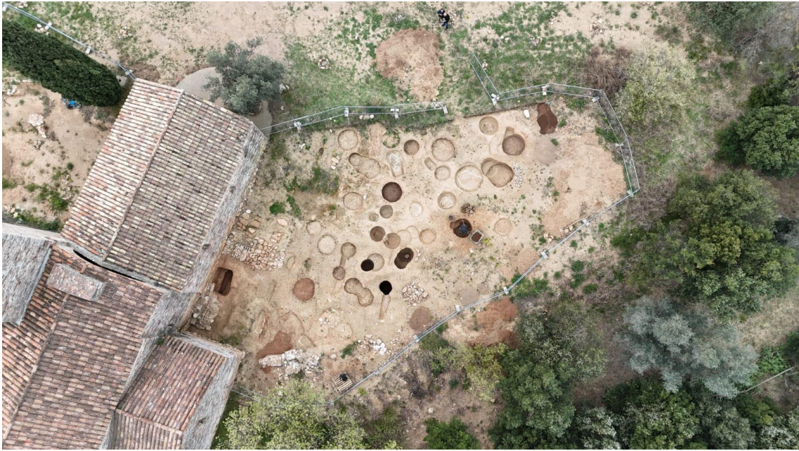
Vista aèria del sector nord del jaciment de Castellar Vell on es poden visualitzar diverses sitges de gra i enterraments. Les dues tombes monumentals del segle X estan situades de manera adjacent a la paret nord de l'església

Aquest treball es planteja en col·laboració amb el Centre d'Estudis de Castellar – Arxiu d'Història, amb qui l'Ajuntament ja ha desenvolupat projectes de divulgació patrimonial com el Centre d'Interpretació del Nucli Antic de Castellar, el CINAC, situat a la Casa Ribas.