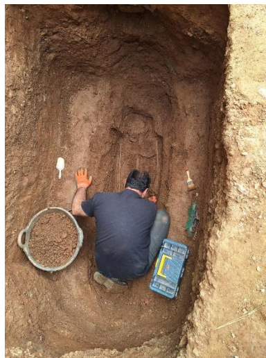
Fotos: imatges dels sepulcres dels magnats del segle X. A l'esquerra, el cos femení, i a la dreta el cos masculí, que correspon a Ermomir.