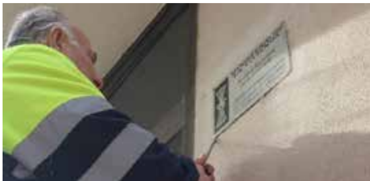
Retirant el 2017 de plaques de l'antic Instituto Nacional de la Vivienda.