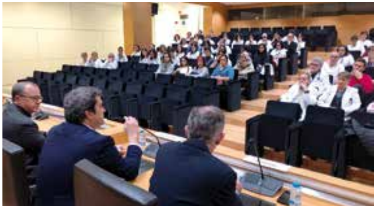
Reunió que CatSalut va mantenir amb professionals del Taulí. || CATSALUT

L'alcalde es mostra crític amb la supressió del servei i Junts per Castellar considera que Som de Castellar-PSC fa "electoralisme" del tancament