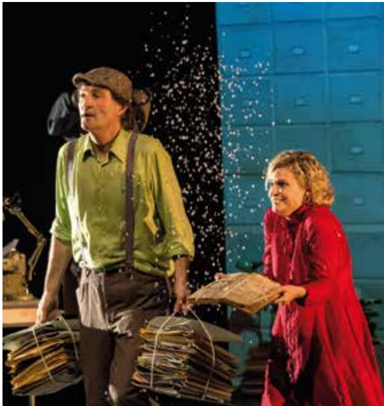
Moment de l'espectacle 'La nena dels pardals', de Teatre al Detall.

L'obra s'acompanya de la música en directe de La Tresca i la Verdesca