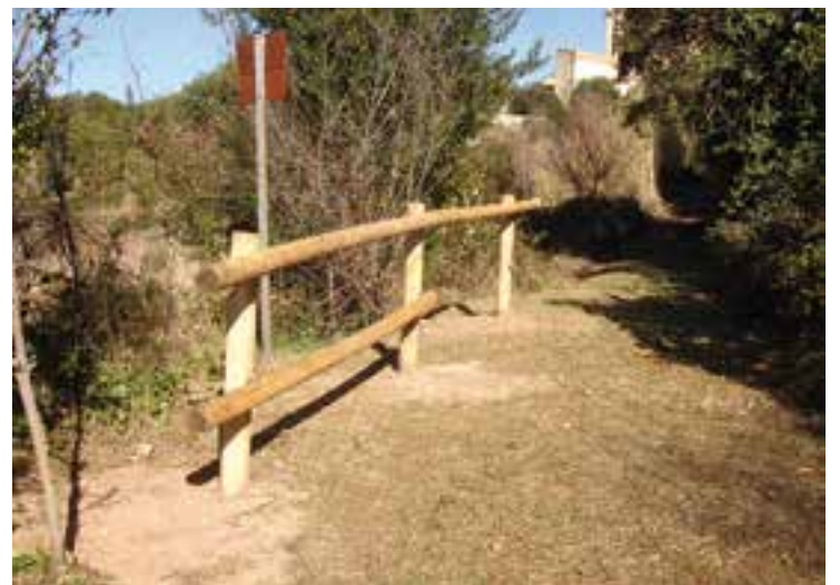
Un dels trams de la tanca de fusta arreglat al camí de l'horta del Brunet.

Totes aquestes actuacions, que tenen un pressupost de 29.700 euros (IVA inclòs), les està duent a terme l'empresa Naturalea SL i finalitzaran en el termini aproximat d'un mes. || REDACCIÓ