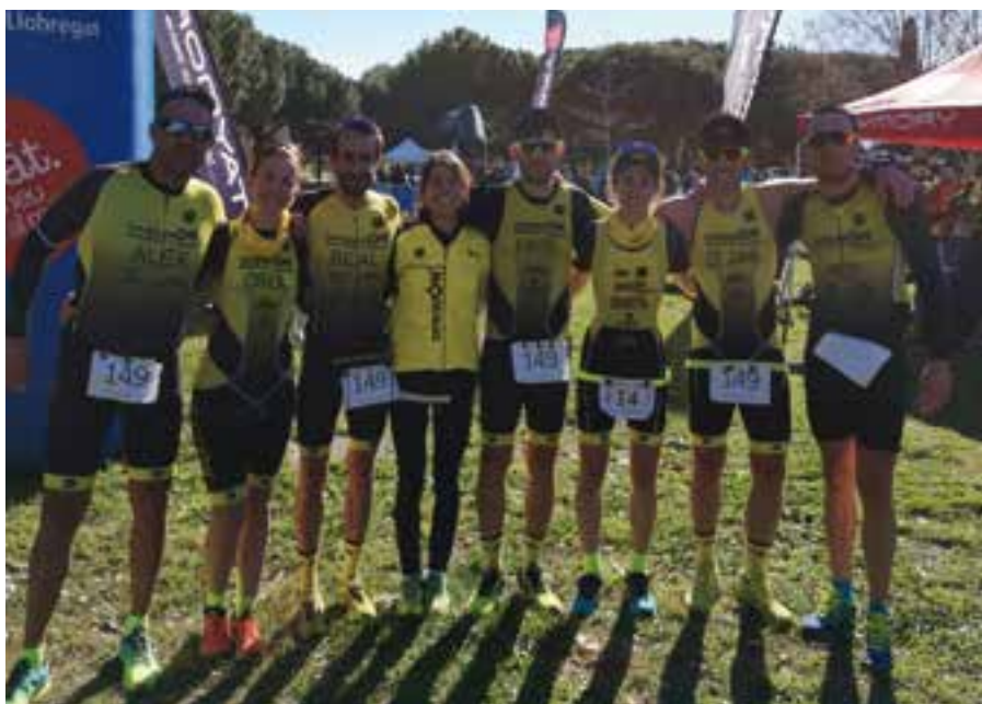
Els integrants del club que van participar en la duatló del Prat de Llobregat.

09:00 Martinenc - prebenjamí B 11:00 CH Ripollet - juvenil B 13:00 CP Corbera - fem