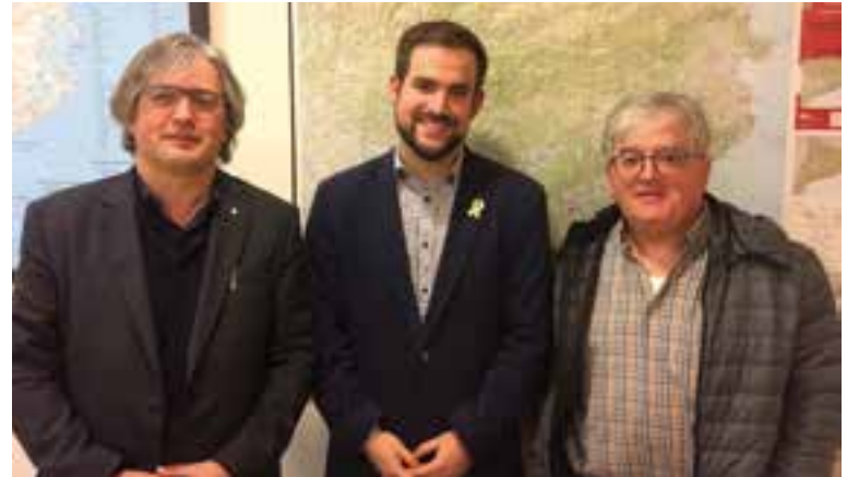
El Director General de Protecció Civil, Castellví, i Altarriba a la conselleria.