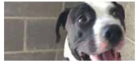
LOGAN // creuat · Jove · Mascle · Pèl curt En adopció des de març de 2018