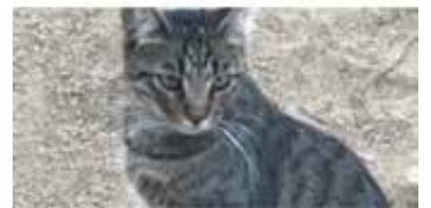
TEMENUZKA//europea · Jove · Femella Pèl curt · En adopció des de maig de 2018