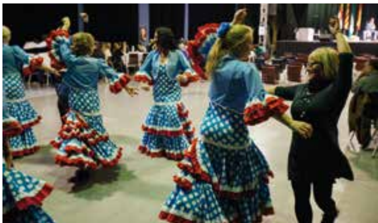
Moment de la celebració del Dia d'Andalusia, l'any passat.

Aquest dissabte, a partir de les 10 hores del matí i a la Sala Blava del recinte firal de l'Espai Tolrà, tindrà lloc la celebració de la festivitat del Dia d'Andalusia, una proposta organitzada per la Casa de Andalusia de Castellar del Vallès. De moment, s'hi preveu l'assistència d'unes 150 persones.