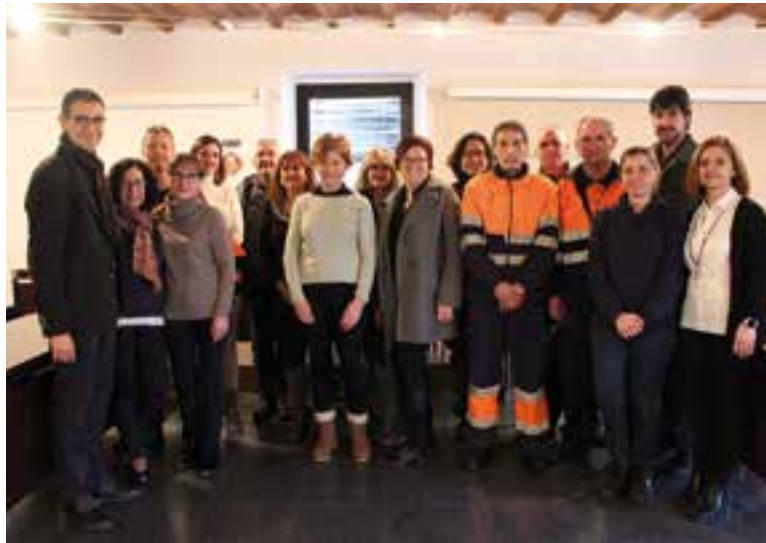
L'alcalde i els regidors Creus i Màrmol amb les 15 persones que s'han incorporat.