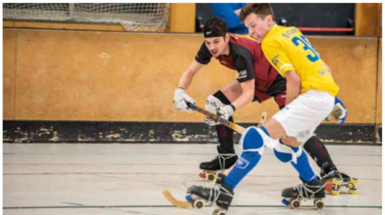
L'HC Castellar va aconseguir una lluitada victòria. A partir d'ara, tot seran finals si vol salvar la categoria.

L'equip necessita, com a mínim, guanyar 5 partits per evitar el descens directe