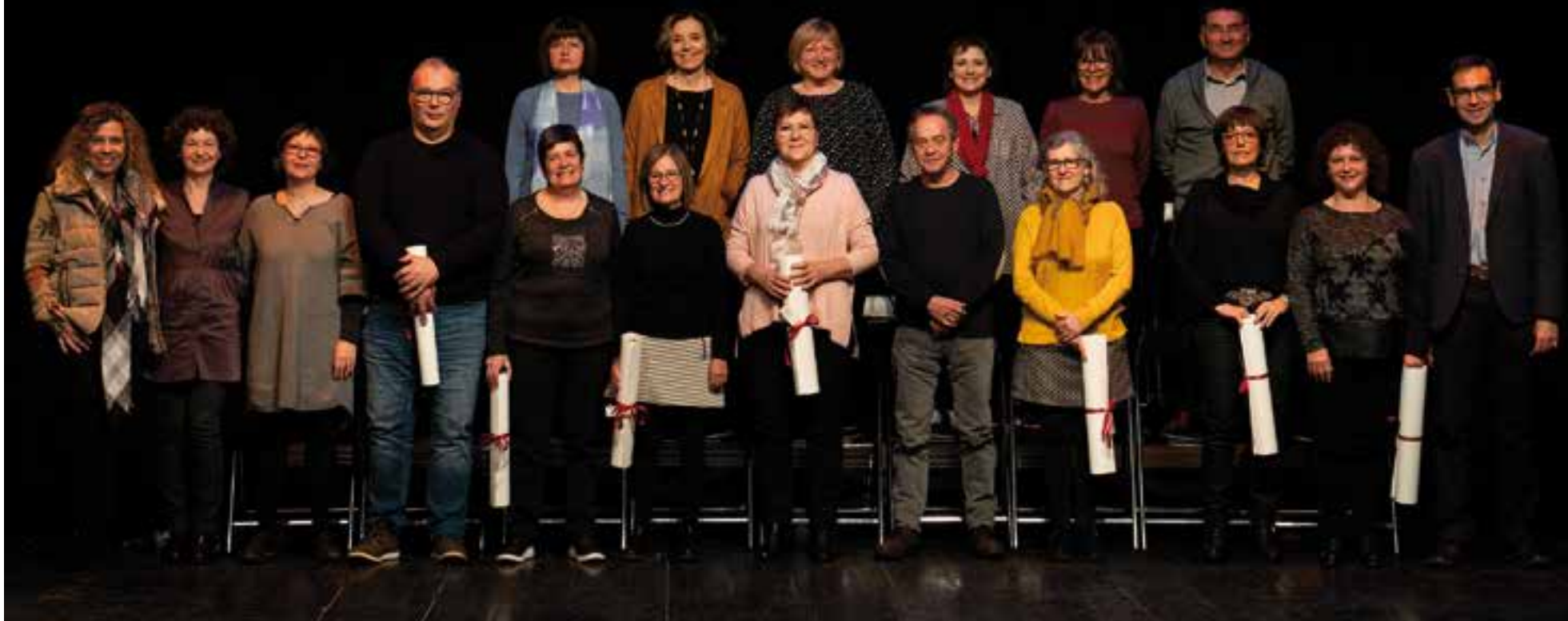
L'acte de reconeixement al grup de mestres i professors que s'han jubilat recentment va tenir lloc dimecres passat a l'Auditori Municipal. || Q. PASCUAL

Reconeixement públic a 24 mestres i professors que s'han jubilat