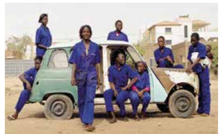
Fotograma d'"Ouaga Girls", el DocsBarcelona del Mes de febrer. || CEDIDA

FEDAC Castellar acull l'exposició '90 anys d'Obra Social Benèfica'. Aquesta mostra es podrà veure durant tot el mes de febrer i s'acull a aquesta escola perquè ja fa uns anys que els alumnes porten a terme un projecte de servei a la comunitat amb la residència, fet que implica alumnes i avis durant un període de temps, realitzant activitats conjuntes. + || M.A.