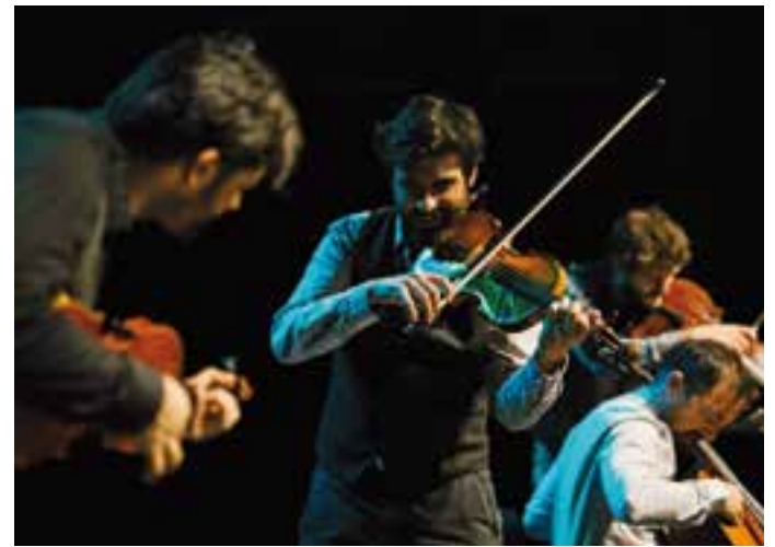
Un moment d'el'espectacle d'Aupa Quartet a l'Auditori. || Q. PASCUAL