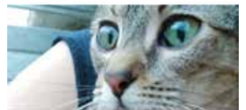
TRAKIA//creuada · Jove · Femella · Pèl curt · En adopció des de maig de 2018