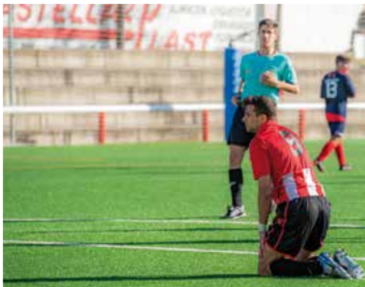
El Castellar ha encaixat 10 gols en dos partits. || A. SAN ANDRÉS