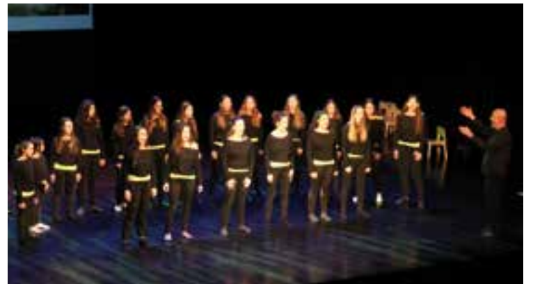
Actuació del Cor Sant Esteve a Espoo, Finlàndia.

A més dels assajos conjunts, les noies del Cor Sant Esteve han conviscut amb les cantaires i famílies fineses, han visitat diversos espais d'interès i han fet activitats lúdiques pròpies de l'hivern: patinar sobre gel, baixar en trineu, caminar sobre el mar gelat, etc. Per a les cantaries, els intercanvis són activitats molt enriquidores, tant des del vessant musical com humà. "Conviure amb una família que també estima el cant és una manera bonica de conèixer un país, la seva llengua i la seva cultura" , apunta Jaume Sala, director del Cor Sant Esteve. ↗ || REDACCIÓ