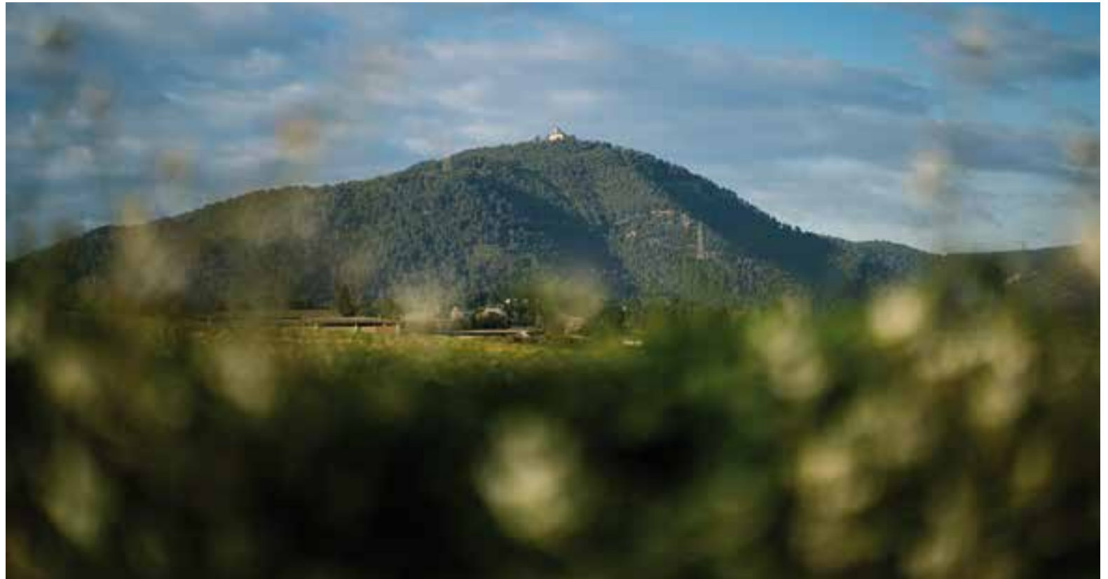
Una imatge recent del cim del Puig de la Creu on es pot veure la verdor de la vegetació després de les darreres pluges caigudes.

En aquest sentit, el 2018 trenca amb la tònica dictada pels tres anys anteriors. "2015, 2016 i 2017 van ser tres anys amb dèficit de pluja. El 2015 va ser l'any més sec dels últims trenta, amb només 388 litres de pluja acumulada", puntualitza el meteoròleg. Tres anys després, el 2018, els registres de pluja acumulada a Castellar del Vallès gairebé s'han triplicat.