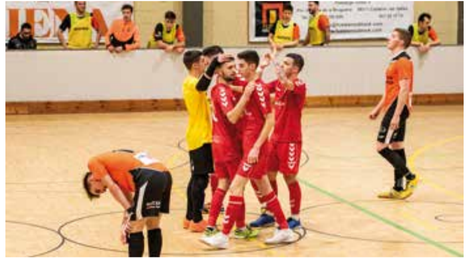
L'FS Castellar va acabar desbordat davant l'efectivitat golejadora del rival a la primera part.

L'FS Farmàcia Yangüela Castellar va tastar disabte passat la seva pròpia medicina, ja que va caure per 1 a 6 contra el Monistrol FS, un equip amb el mateix estil de joc i perfil de jugadors que el conjunt de Darío Martínez.