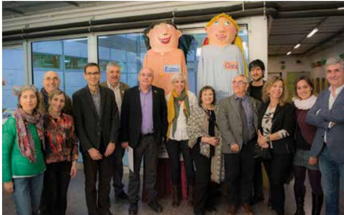
Autoritats municipals i educatives amb el conseller Bargalló, en la visita a l'escola Sant Esteve, dimecres passat.