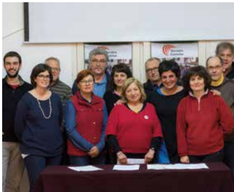
Membres de Decidim a la roda de premsa que van fer dilluns passat.

En el seu comiat, Decidim Castellar va reivindicar el seu caràcter crític i les propostes dels eixos programàtics, i va recordar l'atenció incisiva que va mostrar l'espai polític respecte a la gestió de l'aigua, reclamant que "retorni a mans de l'administració pública". D'altra banda, el manifest subratlla que "un altre dels pals de paller de Decidim" ha estat l'habitatge, així com "la lluita per la justícia social".