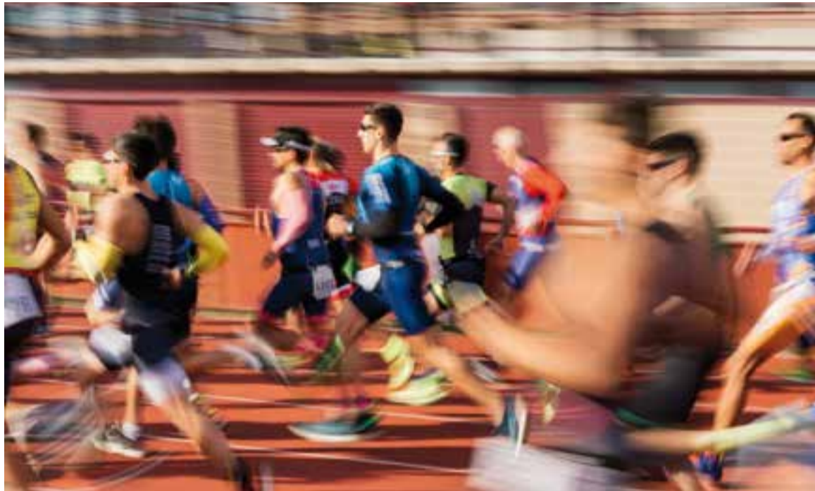
Els participants de la prova van destacar un any més, l'èxit organitzatiu per part del club DimensionTri.