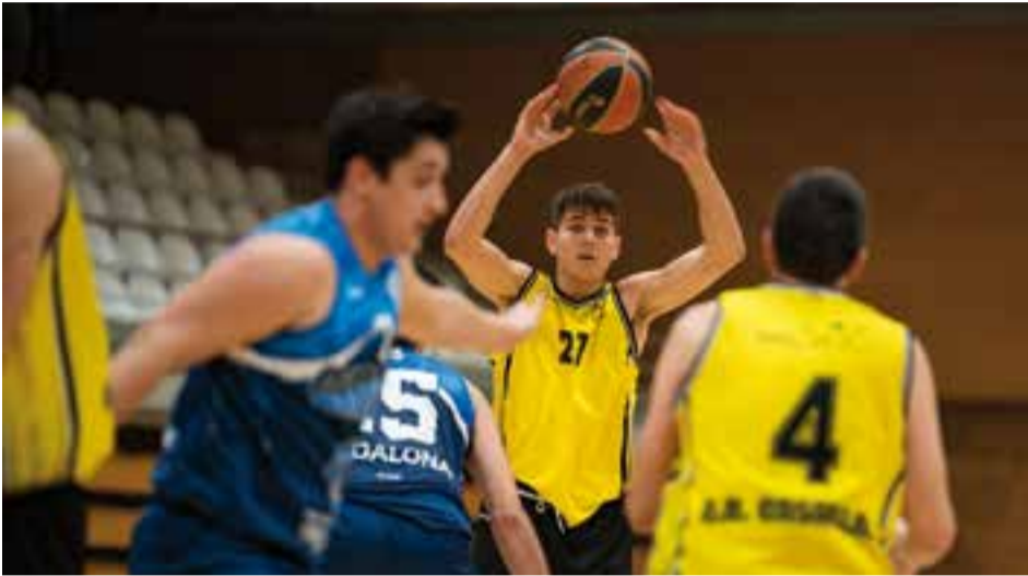
El CB Castellar també va haver de lluitar a la segona part contra l'arbitratge.