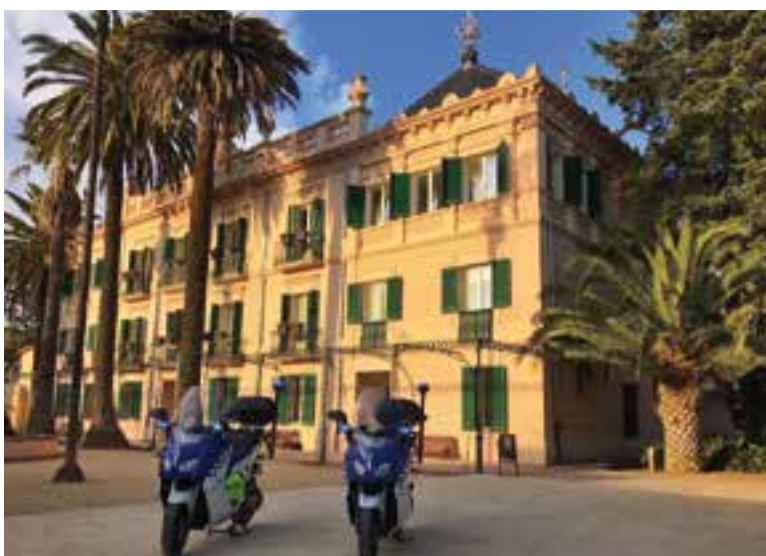
Les dues motos elèctriques que ha incorporat la policia local.