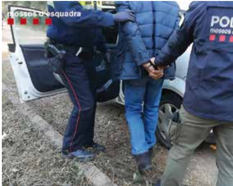
Imatge d'una de les detencions.

La investigació es va iniciar el 14 d'octubre, quan es va tenir coneixement d'un robatori en un bar