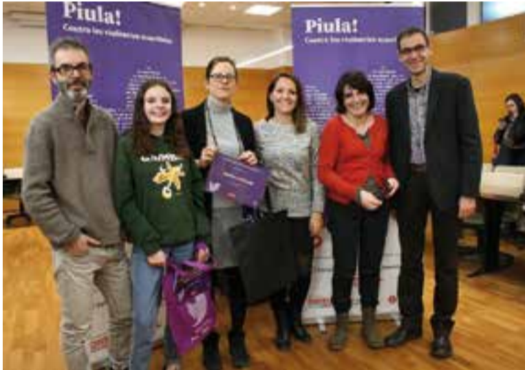
Els guardonats de l'INS Castellar del concurs al Consell Comarcal.

És el centre vallesà que ha fet més piulades contra la violència masclista