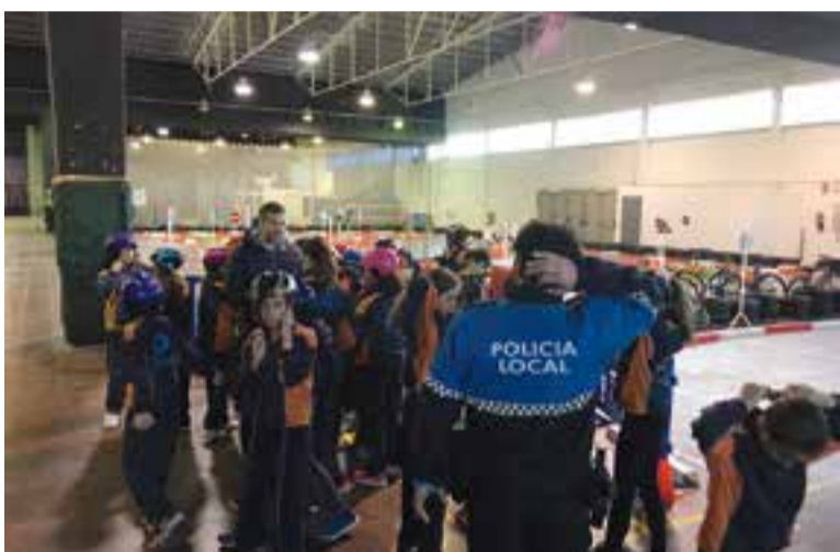
Alumnes del Bonavista després de participar en el curs de d'educació viària.