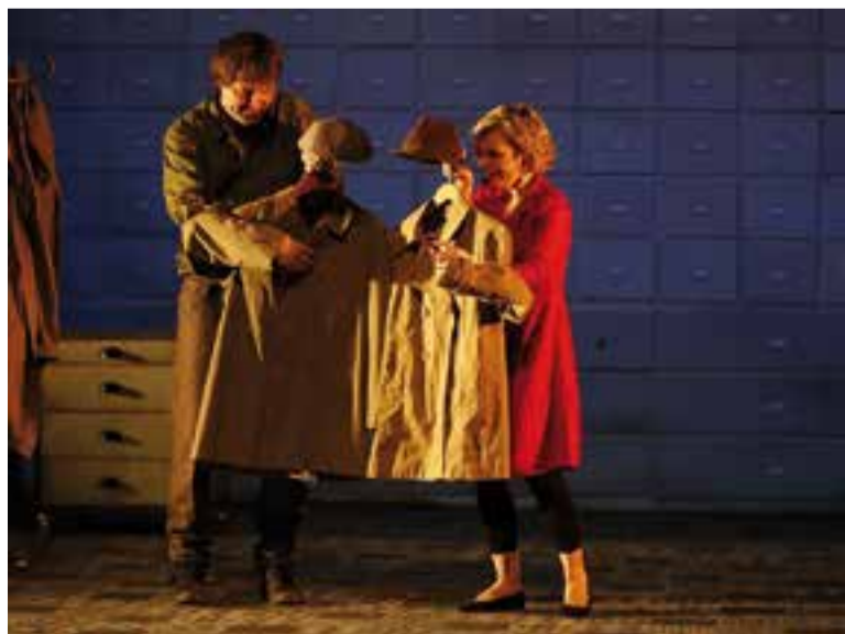
Moment de 'La nena dels pardals', de Teatre al Detall.

La companyia va pujar a l'escenari, diumenge, amb 'La nena dels pardals'