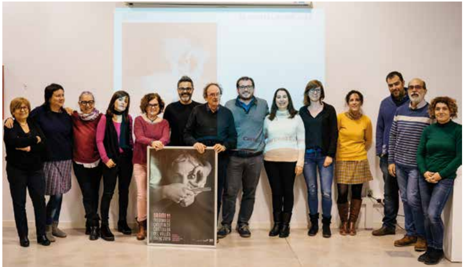
Foto de grup de les persones que fan possible l'edició 2019 del BRAM! en la presentació de la mostra dimarts passat.

Dimecres 13 s'ha programat EnFemme , una pel·lícula dirigida per Alba Barbé “que tracta la temàtica trans amb tota normalitat”. Dijous 14 s'ha previst El silencio de otros , una pel·lícula dirigida per Isaki Lacuesta.