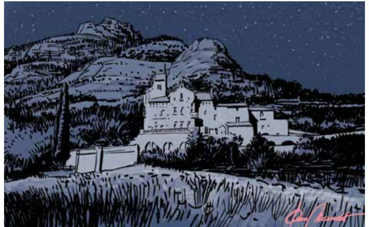
© Cant de grills al Marquet. || JOAN MUNDET

bada d'intel·lectuals i artistes (Josep Carner i Puig-Oriol (Barcelona, 9 de febrer de 1884 - Brussel·les (Bèlgica); Carles Riba Bracons (Barcelona, 23 de setembre de 1893 - 12 de juliol de 1959); Jaume Bofill i Mates (Olot, la Garrotxa, 30 d'agost de 1878 - Barcelona, 2 d'abril de 1933), que es signava Guerau de Liost, etc.), hi organitzava vetllades literàries amb el grup d'escriptors conegut com la 'Colla de Sabadell'.