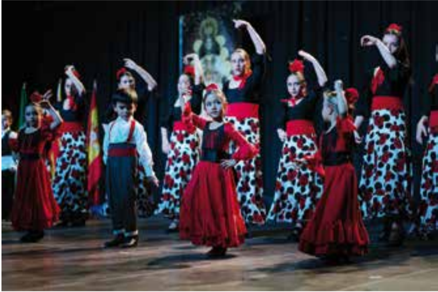
Una de les actuacions de la festa del Dia d'Andalusia a la Sala Blava de l'Espai Tolrà.