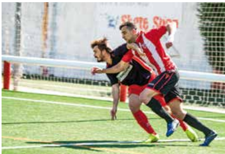
El Castellar va tornar a topar amb un rival al Joan Cortiella. || A. SAN ANDRÉS

L'equip A, integrat per Àlex Béjar, Èrik Jiménez, Rubén Perea, Guillem Milla i Dídac Segovia van emportar-se la victòria final, després del correcte recompte de vots -inicialment van quedar segons a mig punt dels guanyadors-, i també van aconseguir l'accés a la fase final del campionat d'Espanya de Getafe, que es disputarà al mes de maig. L'equip B va acabar en sisena posició, mentre que el C va ser setè i el D, vuitè. En categoria femenina, l'A va quedar-se a les portes del podi en quart lloc i el B, en 7a plaça. ✦ || A.S.A.