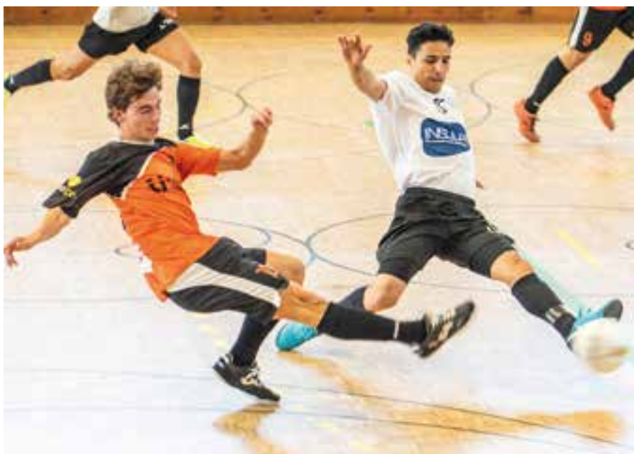
L'FS Castellar va exhibir-se al Joaquim Blume contra l'Olímpic Floresta B. || A.S.A.