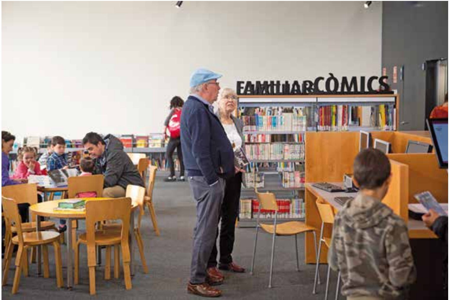
Nou aspecte de la biblioteca municipal Antoni Tort durant les portes obertes de dissabte passat.

La reobertura es va continuar celebrant amb més cultura, també per als més petits. Va organitzar-se una sessió de l'Hora del Conte Infantil, batejada "El Puig i la Mola, un amor infinit", i un taller de punts de llibre, anomenat "Un drac a Sant Llorenç del Munt", a més de l'espai Juguem en Família. Al mateix temps, a la Ludoteca Municipal Les 3 Moreres també es va organitzar una activitat dirigida als infants.