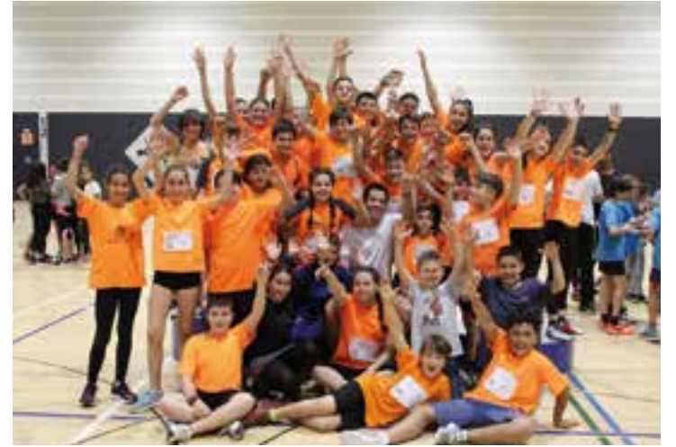
Els alumnes de l'Escola Sant Esteve al 'Jugando al atletismo'.

El col·legi Sant Esteve va aconseguir la victòria en els campionats de Catalunya escolars de 'Jugando al atletismo', amb una participació total de 30 alumnes de l'escola, repartits en quatre equips masculins i dos femenins.