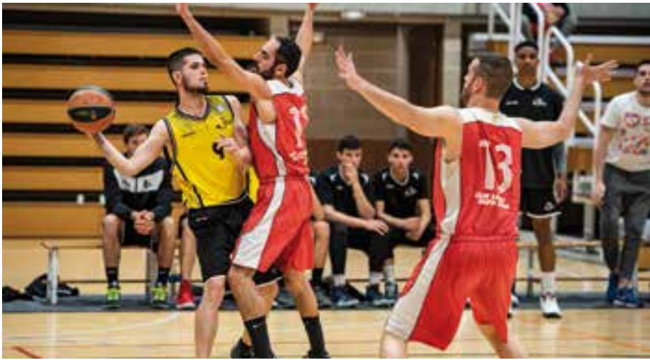
El CB Castellar no va aconseguir superar el CB Santa Coloma.