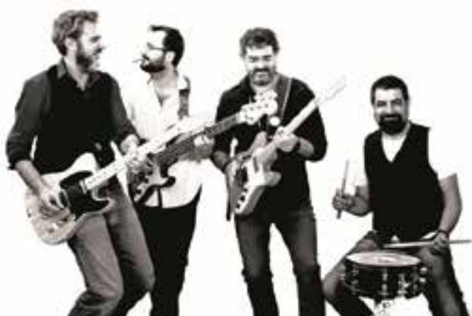
Els PIK actuaran el dia 17 de maig al Casterockfest'19, a la Sala Blava. || CEDIDA

Aquest és "un festival de música fet per músics de Castellar i per a músics de Castellar", afirma Rovira. L'objectiu és, principalment, "que al poble es facin concerts per la gent d'aquí". ➔ || MARINA ANTÚNEZ