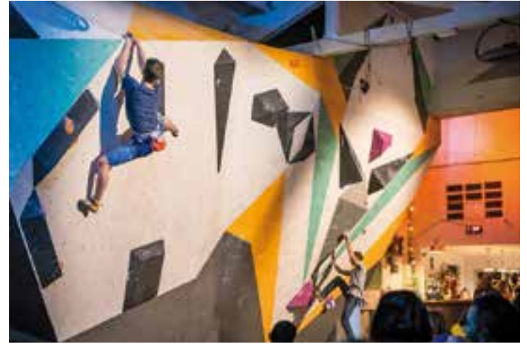
Un dels moments de la competició d'escalada al Canglomerat.

El local d'escalada Canglomerat, del carrer Sant Feliu 11, va ser novament la seu de l'Open Boulder per celebrar el segon aniversari de l'entitat. L'afluència de dissabte va ser de més d'un centenar de participants i un altre d'assistents, que en moments puntuals de la competició van fer quedar petit el recinte.