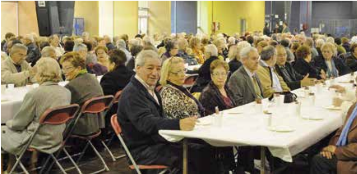
Moment d'un àpat a la Festa de la Gent Gran.

Dissabte, a l'Espai Tolrà; diumenge, a l'església i la plaça del Mercat