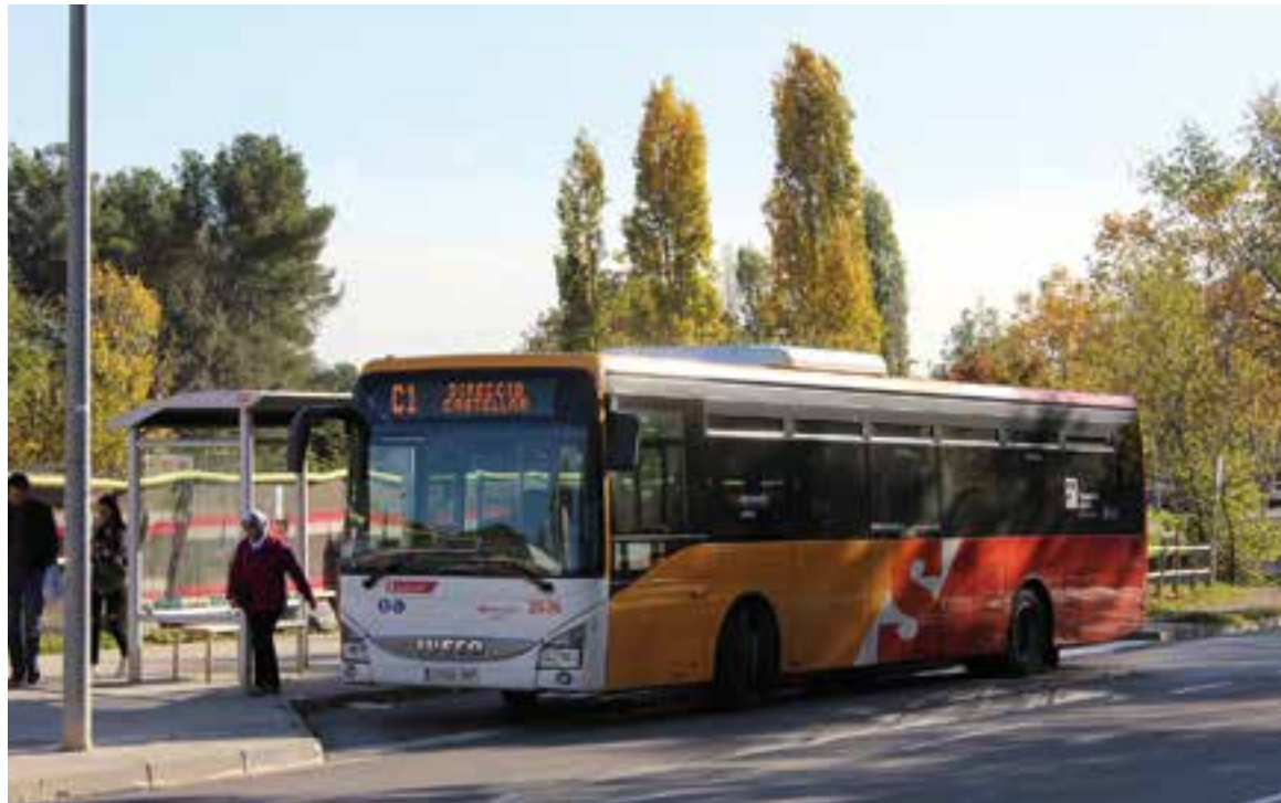
Imatge d'arxiu d'un autobús de la línia C1 en una parada de la ronda de Llevant.

En canvi, la línia C4, que uneix el nucli urbà, El Balcó de Sant Llorenç i Sant Feliu del Racó, va comptar amb un total de 36.082 viatgers, 768 menys que l'any anterior, el que suposa una disminució del 2,08%. Comptabilitzant totes les línies, el transport públic de Castellar del Vallès va registrar l'any 2018 una mitjana de 103.937 viatgers mensuals, 9.484 més respecte el 2017.