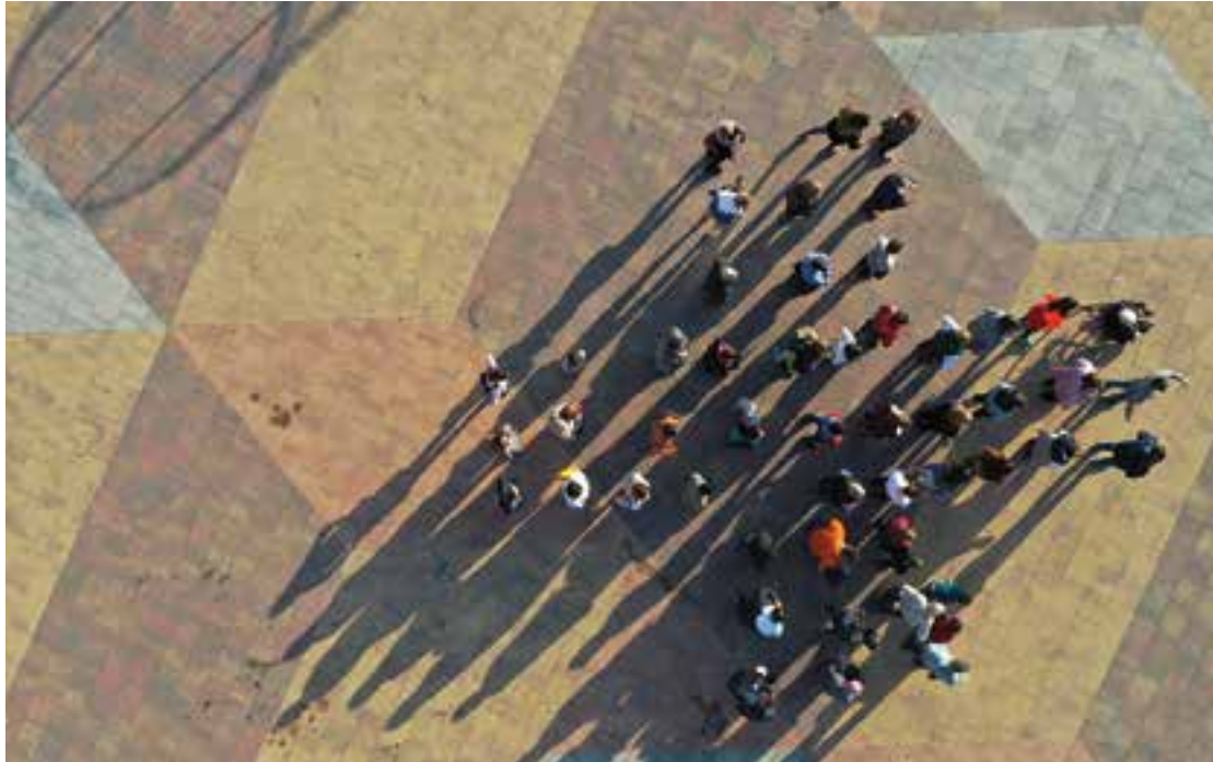
Diversos representants de les comissions organitzatives de la Marató de la Diversitat formen el símbol de Suma+.

Val a dir que per tal d'establir prioritats a l'hora d'assignar els fons que es recaptin a la Marató, s'ha creat una co-