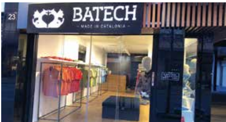
La nova botiga de Batech es troba al carrer Migdia, en ple eixample de Girona.