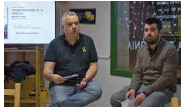
Rafa Homet, l'alcalde d'ERC, i el polític Joan Cuevas.