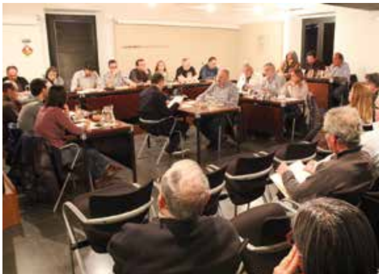
Imatge general del ple de març, celebrat dimarts passat.

S'aprova una subvenció per a la rehabilitació de pisos a canvi que els propietaris els posin a la Borsa de Lloguer Social