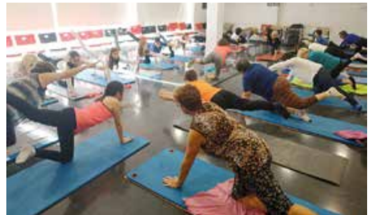
Sessió de pilates al Casal Catalunya amb gent gran i alumnes del Sant Esteve.

Com a cloenda del projecte, el 28 de març es va fer una caminada per les rodalies de Castellar en què van participar 51 alumnes de l'escola, conjuntament amb la gent gran que participa al projecte "Vine i camina +60" cada mes i amb els avis i àvies dels propis alumnes. Alguns d'aquests van venir de ciutats com Badia del Vallès, Barcelona i Sabadell, entre d'altres. En total, hi va haver més d'una vuitantena de participants. A la sortida s'han intercanviat vivències, s'ha gaudit de la natura i fins i tot s'ha fet un Mannequin Challenge ben divertit. Tant les mestres com tot l'equip de professionals del casal Catalunya i l'Ajuntament valoren molt positivament el fet de compartir espais i moments intergeneracionals. + || REDACCIÓ