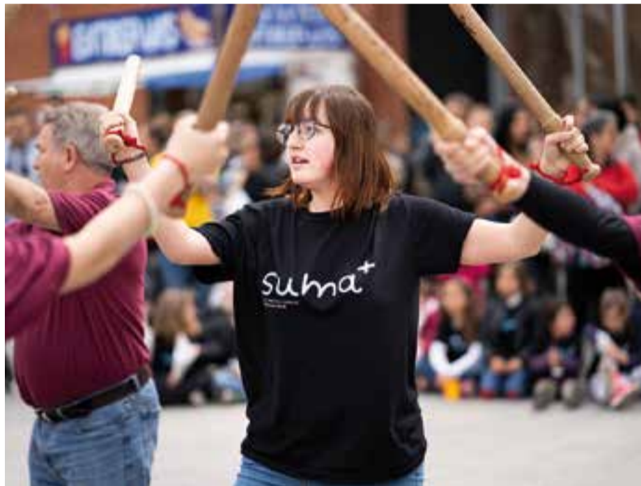
Entre les moltes entitats que van aportar el seu gra de sorra es va comptar amb Ball de Bastons.

És la xifra que va recaptar de divendres a diumenge la Marató i que es destinarà a fer les aules inclusives