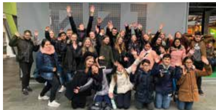
Els protagonistes del programa internacional Erasmus+.

Del 10 al 17 de març, cinc alumnes de secundària d'El Casal i les dues professores coordinadores del programa internacional Erasmus+ del centre, van viatjar a Rotterdam per participar en les activitats programades dins del projecte Unity in Diversity finançat per la Unió Europea. Segons expliquen des d'El Casal, "la trobada va comptar amb alumnes de Dinamarca, Turquia, Holanda i Catalunya" que es van distribuir en famílies acollidores. Els alumnes van poder desenvolupar, a banda d'activitats lúdiques, activitats sobre la diversitat al Gemini College, el centre que els va acollir. "El Programa Erasmus+ permet que l'alumnat dels diferents països de la Unió Europea que hi participen coneguin millor els respectius trets culturals, allò que ens fa ser iguals i allò que ens fa ser únics, valorar les diferents cultures i llengües com quelcom que ens enriqueix i reconèixer que malgrat que els sistemes educatius de cada país són molt diferents, els joves i les joves d'arreu d'Europa encara tenen moltes coses en comú", expliquen des del centre escolar castellarenc. Però sobretot, des de El Casal, ens senten "contents de formar part d'aquesta experiència on hem après un munt, hem crescut i hem fet nous amics". Després de l'emotiu comiat, el proper mes de maig, l'escola El Casal serà l'amfitriona d'una nova trobada internacional. + || REDACCIÓ