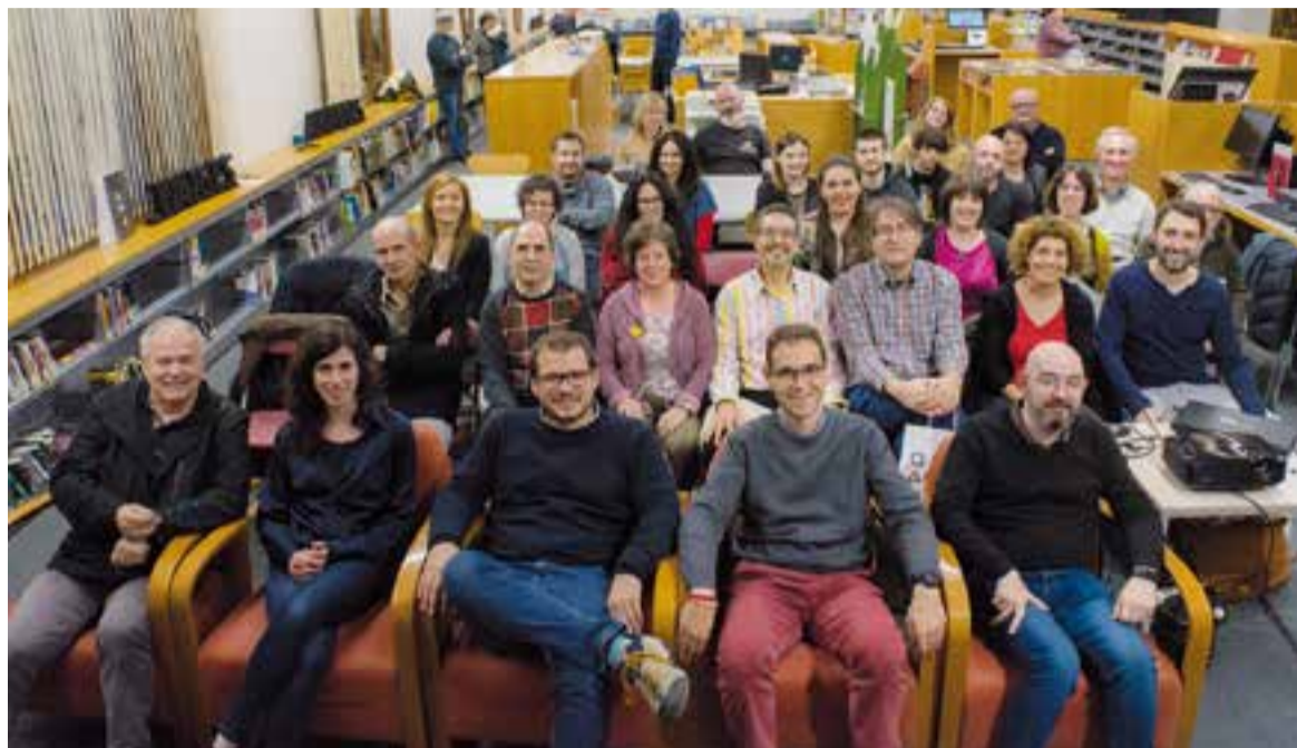
Foto de família amb bona part dels autors i autores dels versos seleccionats i autoritats municipals.

29 passos de vianants tindran frases creades per la ciutadania