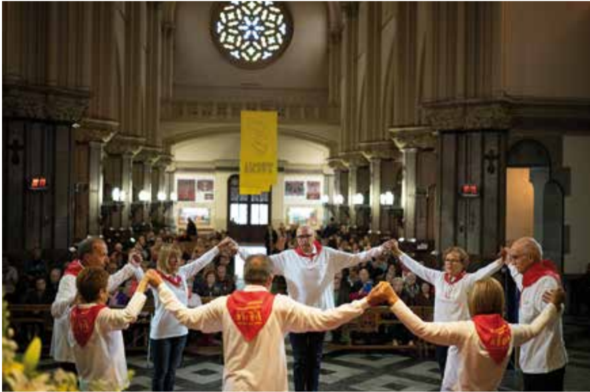
És la primera vegada que es dansen sardanes a l'església de Sant Esteve.