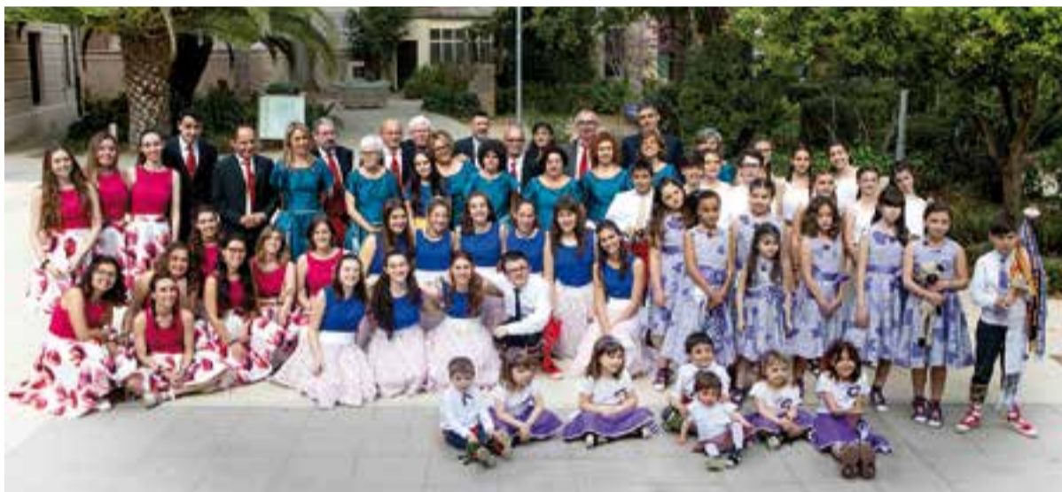
Foto de família del Ball de Gitanes de Castellar, als jardins del Palau tolrà. || FOTOPRIX - ESTUDI SANDRA GALERA

La jornada festiva finalitzarà amb tots els grups tocant junts “El gegant del Pi”. Tots els assistents podran acompanyar rítmicament els Atabalats amb els tabals de l'escola Sant Esteve. Els infants que hagin fet un capgròs al taller podran sortir a ballar juntament amb les altres colles. + || M. ANTÚNEZ