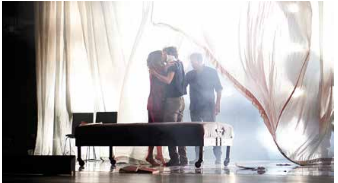
Un dels moments culminants de la representació, divendres passat a l'Auditori.

L'espectacle muntat per la Sala Beckett i amb la direcció d'Andrés Lima és un regal per als espectadors de principi a fi. La història