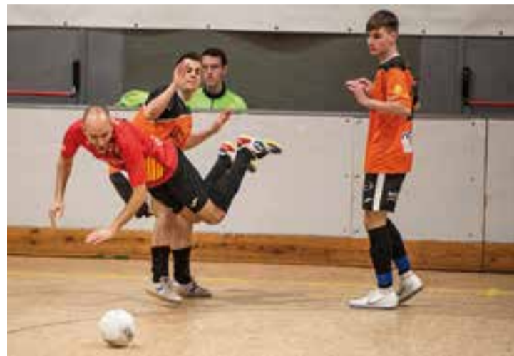
L'FS Castellar no va poder amb el Bosco Rocafort.

L'esport castellarenc ha viscut una jornada negra amb la derrota de tots els equips sènior de la vila, i una d'elles va ser la derrota per golejada de l'FS Farmàcia Yangüela Castellar per 8 a 3 contra l'FS Bosco Rocafort, segon classificat a la lliga.