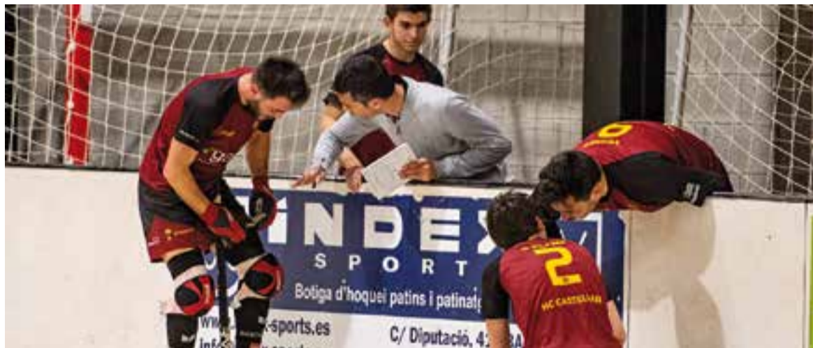
L'HC Castellar ho va intentar tot a Palafrugell, contra un rival molt dur. || A. SAN ANDRÉS

La derrota per 6 a 3 contra el Palafrugell deixa l'HC Castellar en una situació complicada, en què ja no depenen d'ells mateixos per salvar la categoria. L'actuació arbitral va privar els de Ramón Bassols poder lluitar per la victòria i trenquen així la ratxa de tres jornades seguides puntuant.