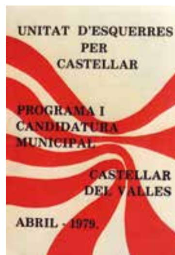
Cartells electorals de CiU i Unitat d'Esquerres de la campanya de Castellar de les primeres eleccions municipals després de la dictadura, la d'abril de 1979.

dies després de les eleccions que es van celebrar el 3 d'abril. Durant l'acte, que serà transmès en directe per Ràdio Castellar i via streaming a través del canal de YouTube de L'Actual , es podrà veure una projecció de fotografies dels 40 anys d'ajuntaments democràtics. +