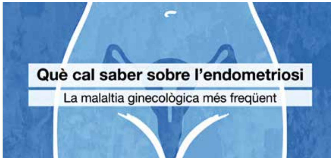
Imatge de la campanya de conscienciació del Departament de Salut.