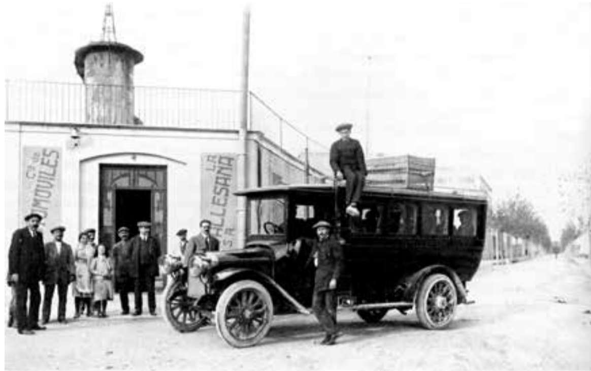
Un dels primers òmnibus de Castellar a la parada del Passeig de La Vallesana als anys vint.

Les fotografies del llibre, editat per l'Editorial Efadós amb la col·laboració de l'Ajuntament de Castellar del Vallès, el Centre d'Estudis de Castellar - Arxiu d'Història i l'Arxiu Municipal, han estat triades d'entre el fons de més de 5.000 imatges que molts castellarencs i castellarenques van cedir fa cinc anys a la mateixa editorial per a l'elaboració de L'Abans de Castellar del Vallès .