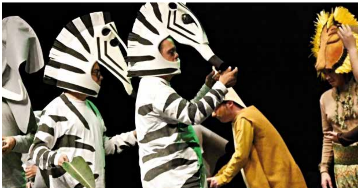
L'obra de TEB Castellar va omplir l'Auditori en la representació del desembre de 2018.