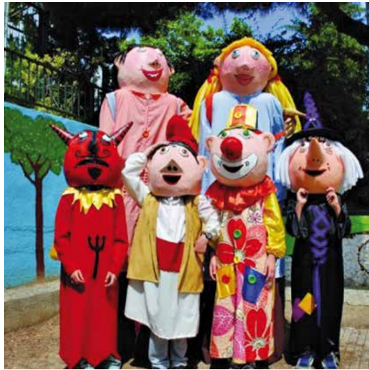
Els gegants i capgrossos de l'escola Sant Esteve proposen el segon Dia Gegant. || C.

d'un capgròs, una activitat que l'any passat, a la primera edició, ja va tenir molt bona acollida i que es repetirà enguany.