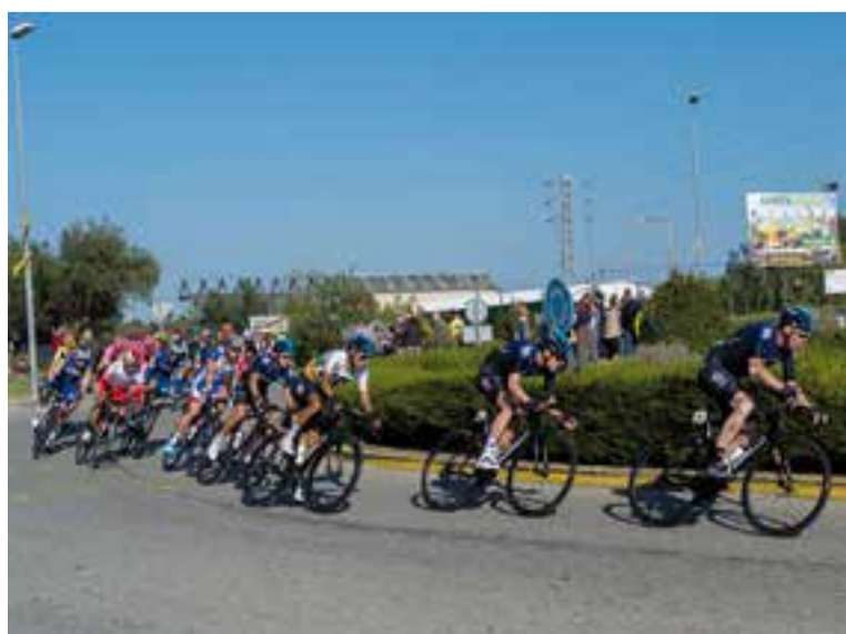
La 99a edició de la Volta a Catalunya al seu pas per Castellar.

Amb tret de sortida a Puigcerdà i arribada a Sant Cugat del Vallès, Schachmann es convertia en protagonista després d'escapar-se en el descens de la Collada de Toses amb Andrey Amador (Movistar), Tejay van Garderen (Education First-Drapac) i Bert-Jan Lindeman (Jumbo-Visma), i arribar amb un avantatge de 13 segons a la meta de Sant Cugat, on López aconseguia mantenir el liderat de la prova que guanyaria dos dies després a la Ciutat Comtal.