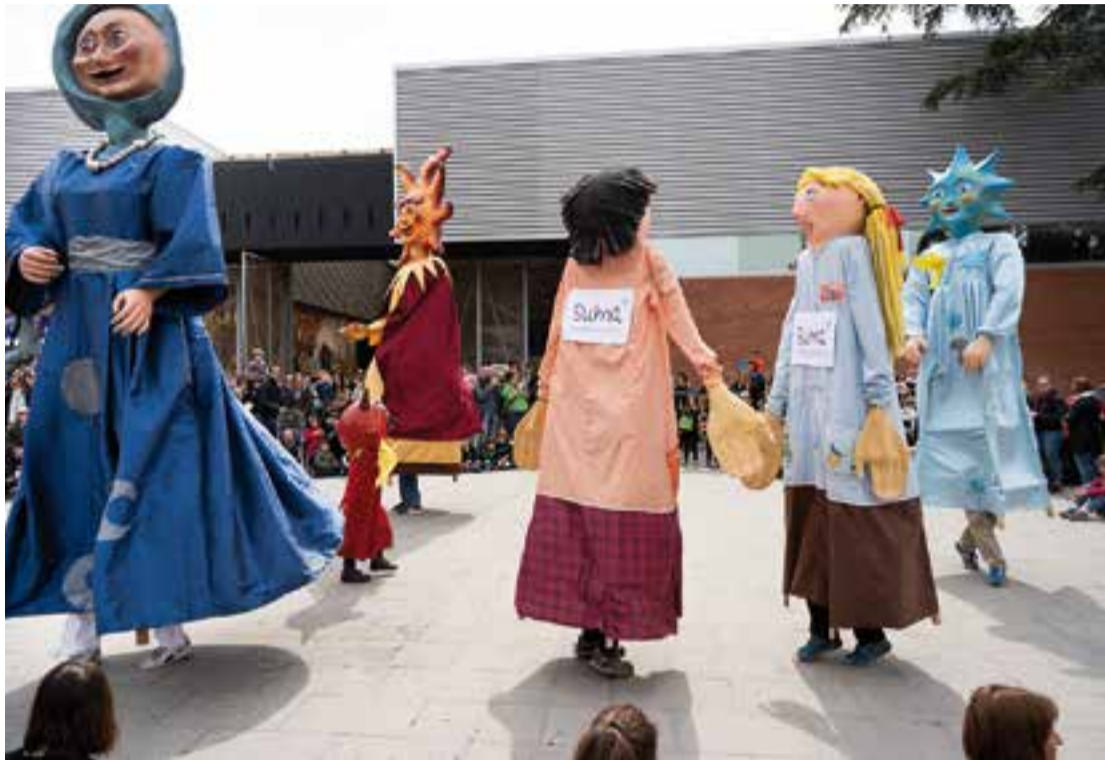
La participació dels gegants de l'Esbart Teatral es va fer a les fotes de l'Espai Tolrà.

L'Espai Tolrà, que durant el cap de setmana ha bullit de gent, ha estat el cor de la festa. En total, hi han participat gairebé un centenar de voluntaris i la plaça es va tenyir de samarretes venudes per la causa. I al llarg dels tres dies, s'han dut a terme gairebé una trentena d'activitats, des d'esport fins a actuacions culturals, àpats o concerts. El més multitudinari, el de les Macedònia. El grup, atenant la causa solidària, va oferir una privilegiada actuació dissabte a la tarda. El recinte firal es va omplir de gom a gom per gaudir del tastet musical.