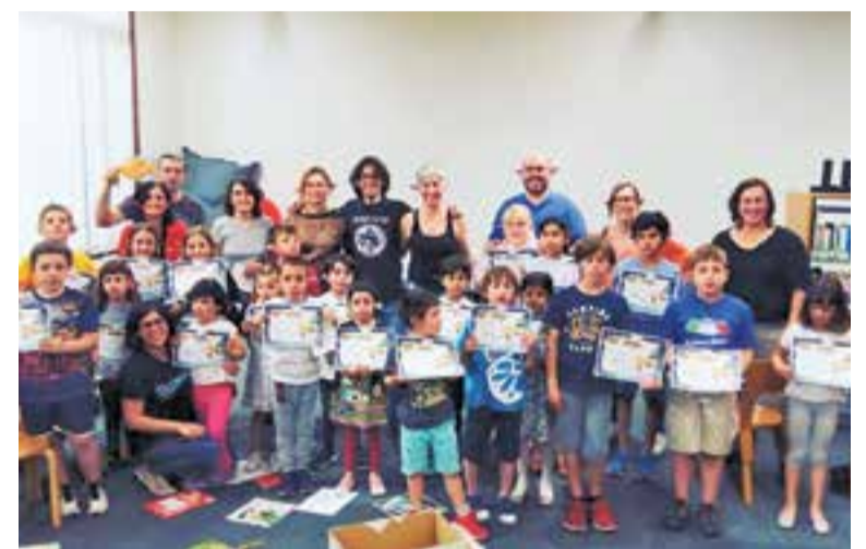
Participants de la #Supernit a la Biblioteca Municipal Antoni Tort.. || BIBLIOTECA

El Super3 i el Departament de Cultura de la Generalitat de Catalunya van organitzar la "Supernit a les biblioteques" públiques, per promoure la lectura entre el públic infantil. La #Supernit té per objectiu fer arribar als més petits la importància de la lectura ➔ || M. A.