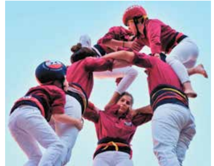
Actuació dels Capgirats a Santpedor.