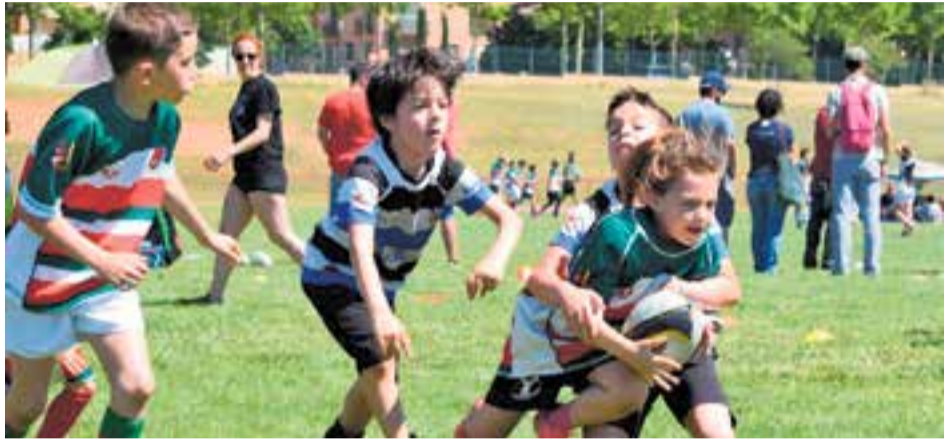
Partit entre dos dels equips del Torneig El Mussol, durant la jornada de dissabte

20 equips de sis clubs diferents i 250 jugadors van prendre part en la I edició del torneig 'El Mussol' d'escoles de rugbi, organitzat a Colobrers pel Rugby Club Castellar i l'Escola de Rugbi del Vallès.