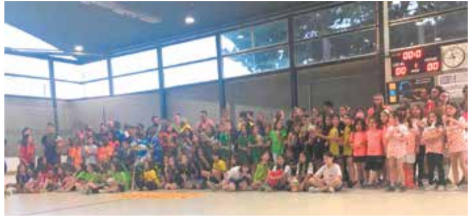
Les participants a la VII festa del MiniFem al pavelló Dani Pedrosa de Castellar.

En època estiuenca, els torneigs són la millor sortida per mantenir activa la tensió competitiva en els equips de base i una manera excel·lent d'allargar la temporada. L'hoquei patins, un esport en auge en els últims mesos, també vol aprofitar la tirada de l'esport femení gràcies a la televisió per promocionar una categoria d'iniciació, on l'HC Castellar no va perdre l'oportunitat d'organitzar la VII Festa del MiniFem al Dani Pedrosa.