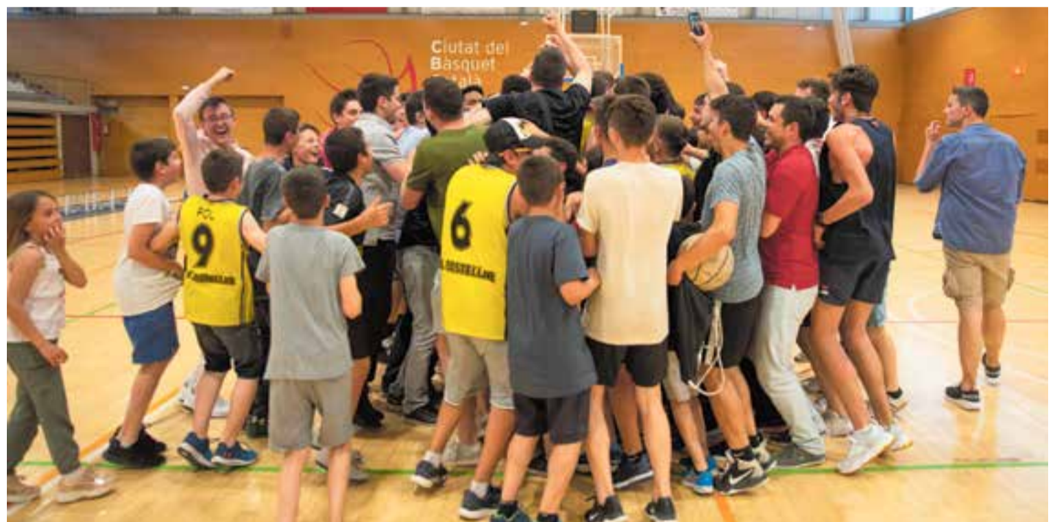
Jugadors i afició del CB Castellar celebren la permanència al pavelló Puigverd, després d'un final antològic.