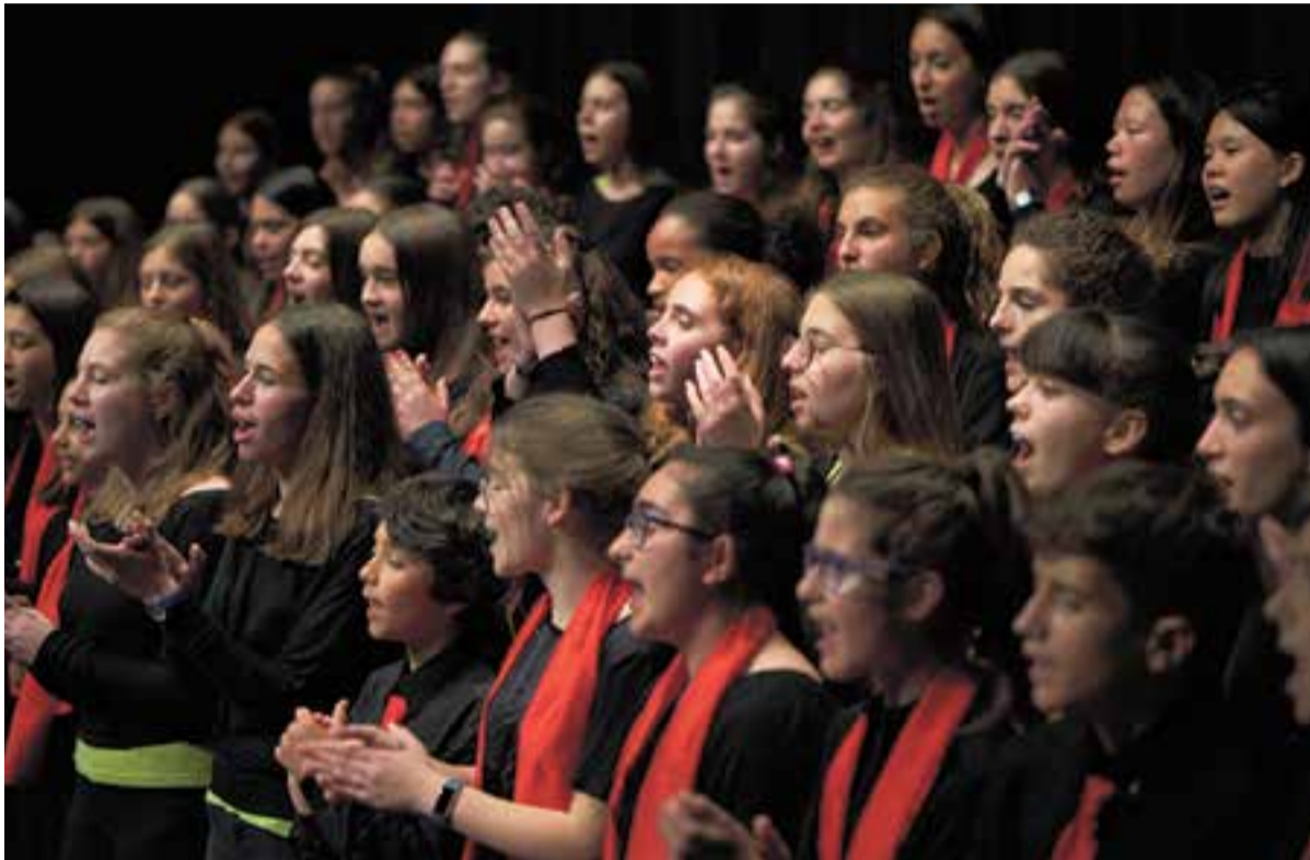
Un moment de l'actuació conjunta de les dues corals en el concert de dissabte passat a l'Auditori

Aquest dissabte, l'Auditori Miquel Pont va acollir un concert conjunt del Cor Sant Esteve i el Cor Infantil de l'Orfeó Català