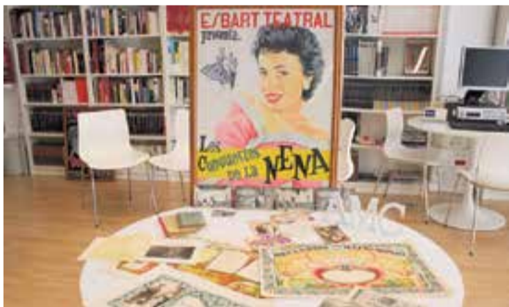
Material que s'exposarà en motiu del Dia Internacional dels Arxius. || M. A.