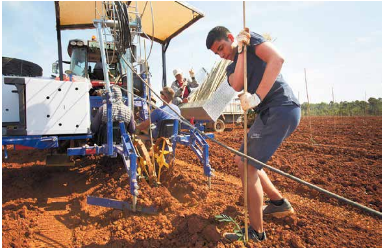
Les operaris de la propietat treballen en la plantació d'oliveres a la zona de Can Moragues, en una imatge de dimarts passat.

L'especialitat d'oliva que s'ha escollit és l'arbequina, de mida petita, perquè és la que dona oli de millor qualitat. I és que la intenció, a llarg termini, és poder produir oli. “Si tot funciona bé, que poden passar mil coses, la idea és que d'aquí tres anys puguem