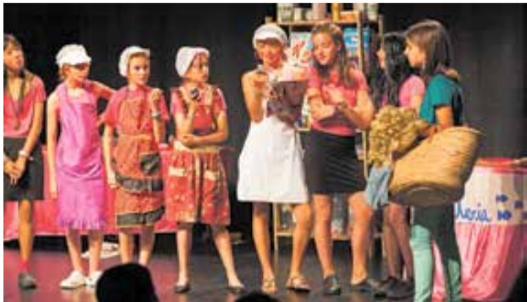
Edició anterior de la Mostra de teatre infantil i juvenil a la Sala de Petit Format. || Q. P.