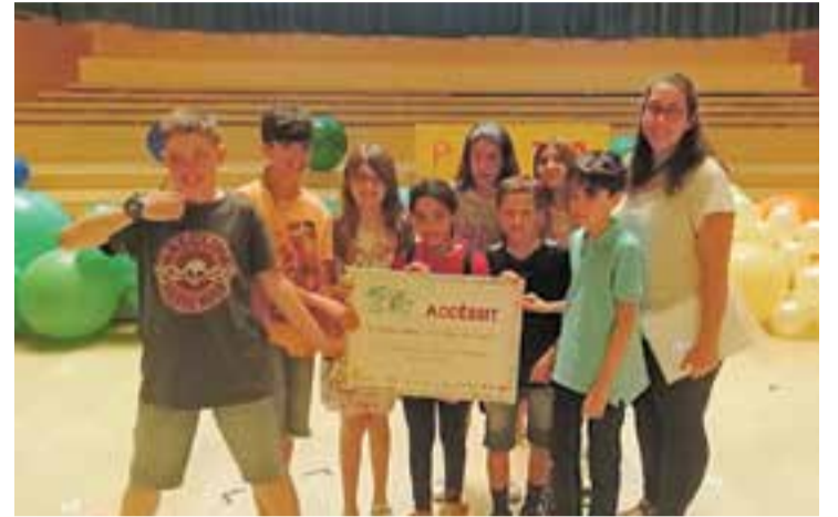
Els alumnes de l'escola amb l'accessit que els van donar a l'Auditori.

JOCS EN CATALÀ | PLATAFORMA PER LA LLENGUA