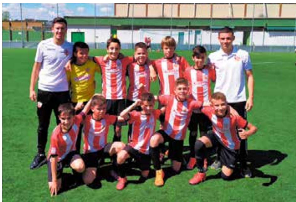
L'aleví A de la UE Castellar a Badia, el dia de la consecució de l'ascens.

Pavelló Puigverd 15:00 Torneig intern final temporada de voleibol, fins les 22 h