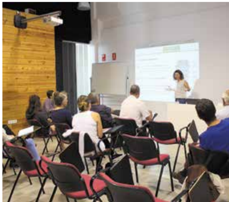
La Sala Lluís Valls Areny va acollir dilluns passat un taller d'autocompostatge || R.G.