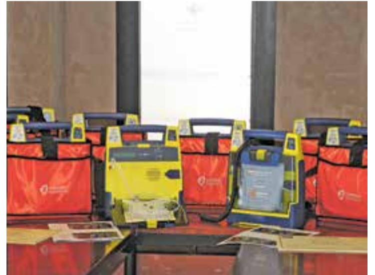
Castellar compta amb 21 desfibril·ladors repartits pel municipi.