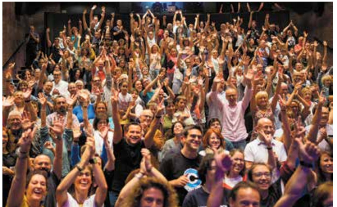
El concert de Blaumut, del 29 de setembre de 2018, va atraure 308 espectadors.

Algunes de les propostes que han superat els 200 espectadors són: En Ralph destrueix Internet (cinema familiar), amb 345 espectadors; Campeones (cinema), amb 318 espectadors; El chico de la última fila , teatre programació municipal, amb 308 espectadors; el concert Equilibri de Blaumut, amb 308 espectadors; Un tret al cap , teatre a l'Auditori, amb 308 espectadors; Les noies de Mossbank Road , amb 308 espectadors; Step Up , espectacle musical, amb 304 espectadors; Terra Baixa , amb 298 espectadors; Immortal , amb 296 espectadors; El regreso de Mary Poppins (cinema), amb 292 espectadors; Superlópez , amb 282 espectadors; Els increíbles 2 , amb 281 espectadors; Smallfoot , amb 267 espectadors; Green Book . Diumenge d'estrena (cinema). 259 espectadors; Dumbo , amb 238 espectadors; Sopa de pollastre amb ordi (teatre), amb 235 espectadors; Solitutes , teatre amb 226 espectadors; El mejor verano de mi vida (cinema), amb 215 espectadors; La nena dels pardals , espectacle familiar, amb 211 espectadors; Cabaret A , amb 210 espectadors; El fotógrafo de Mauthausen , amb 200 espectadors. +