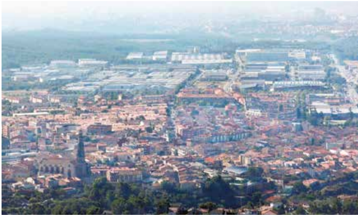
Vistes aèries de Castellà del Vallès. Al fons, Sabadell. ||ARXIU