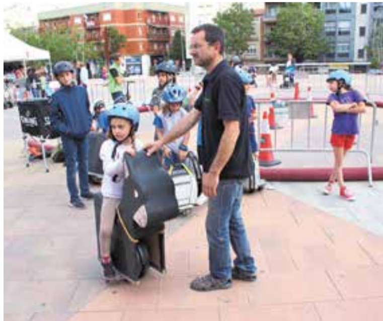
Una de les activitats que va atraure més, el circuit de vehicles elèctrics. || G.PLANS

Aquest tipus d'adob natural és una manera de tancar el cicle de la matèria orgànica, de retornar al sòl els nutrients amb els mateixos residus que generem. De fet, la matèria orgànica representa la fracció més important dels residus generats a les llars, i suposa aproximadament un 40% del pes total dels residus. +