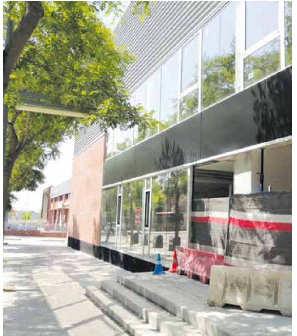
Aquests dies encara s'estan fent les obres del Casal de Joves que tindrà l'Espai Tolrà.

Us donem la benvinguda a una nova etapa per a Castellar. Us hi apuntem?