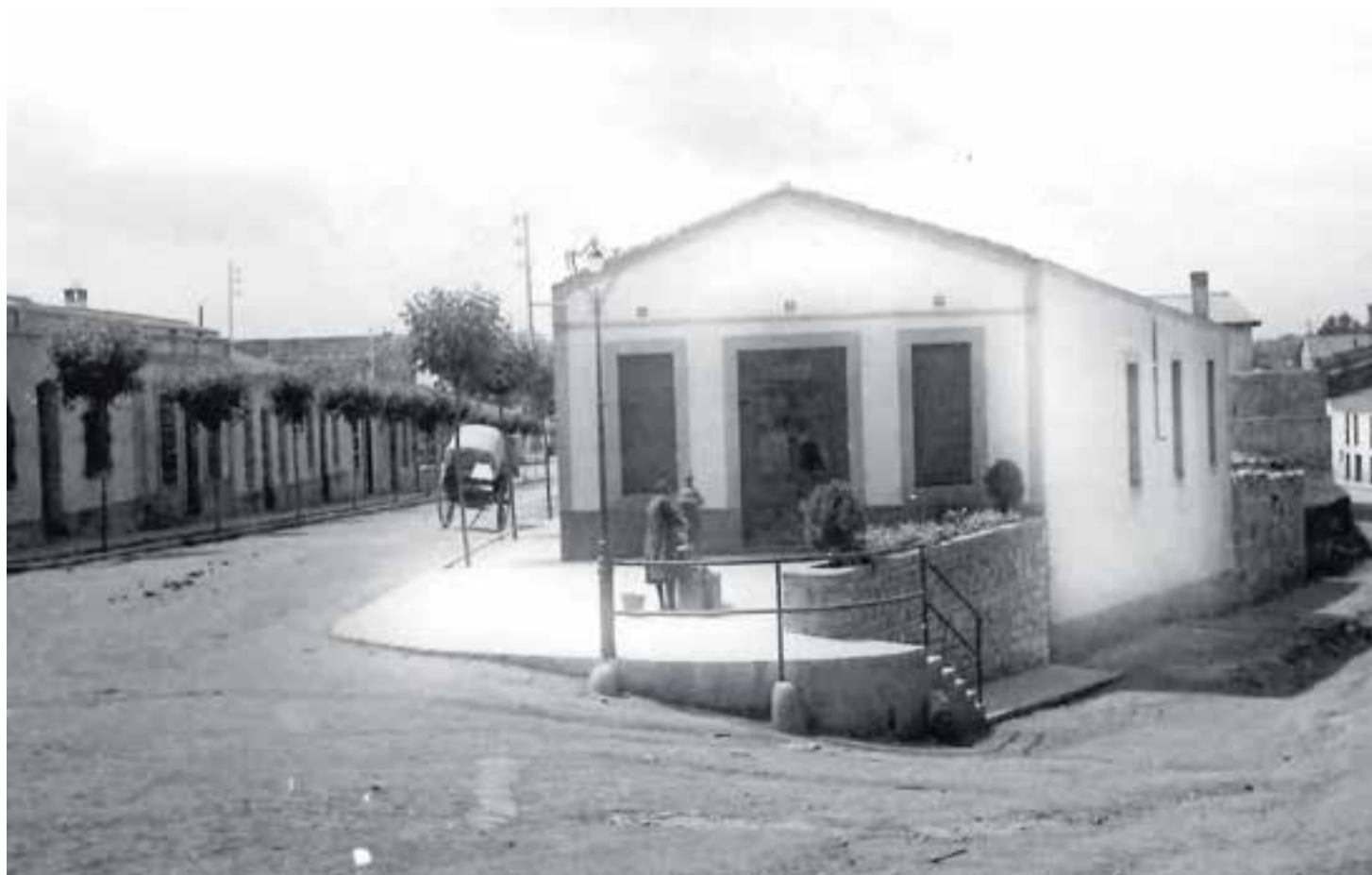
Vista del carrer Francesc Layret, cantonada amb el carrer Molí, conegut com "Cal Butxaques", en una imatge dels anys 30.

No ens volem ficar en temes polítics, però hauríem de ser conscients de com va començar el franquisme, quina classe de discursos promovien i què va significar per tots els nostres antecessors per tal que no torni a passar.