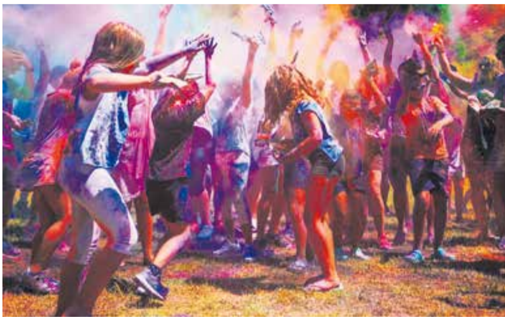
La festa Holi, una de les activitats més animades per als més petits.