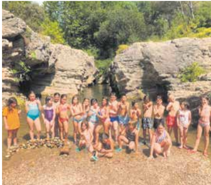
La natura protagonitza les activitats del casal de Can Juliana.

Finalment, l'escola de robòtica, programació i noves tecnologies, Codelearn Castellar, també ofereix un casal d'estiu per estimular l'aprenentatge i competències computacionals i de les TIC dels més menuts, com un dels pilars per al desenvolupament educatiu. ✦