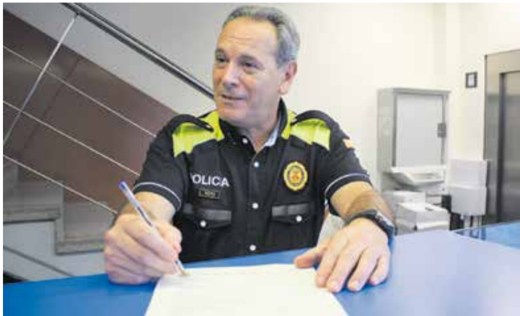
Un agent de la Policia Local mostra a un vilatà el document que ha d'emplenar per fer efectiu el servei.

Al document, a més, s'hauran d'especificar altres aspectes com les dades del vehicle, en cas que es tingui, i si aquest es troba estacionat al garatge o al carrer. També s'haurà d'indicar si es tenen o no animals de companyia, si es té contractat algun sistema de seguretat, o si durant el període assenyalat hi haurà alguna persona que realitzi feines domèstiques al domicili. En cas afirmatiu, s'hauran d'especificar també les dates i horaris en què aquesta persona serà a la llar assenyalada. En els darrers dos anys, una setantena d'unitats familiars han fet servir aquest servei. “Sobretot es busca la tranquil·litat del ciutadà, que davant de qualsevol situació, no només de robatori, sinó d'una incidència en el subministrament de llum o aigua,