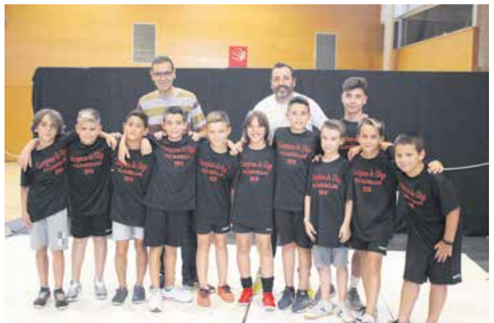
EL BENJAMÍ DE L'FS CASTELLAR, CAMPIÓ DE LLIGA L'equip benjamí del Futbol Sala Castellar va ser guardonat per aconseguir el Campionat de Lliga al grup 4 de promoció, assegurant un bon planter per al futur.