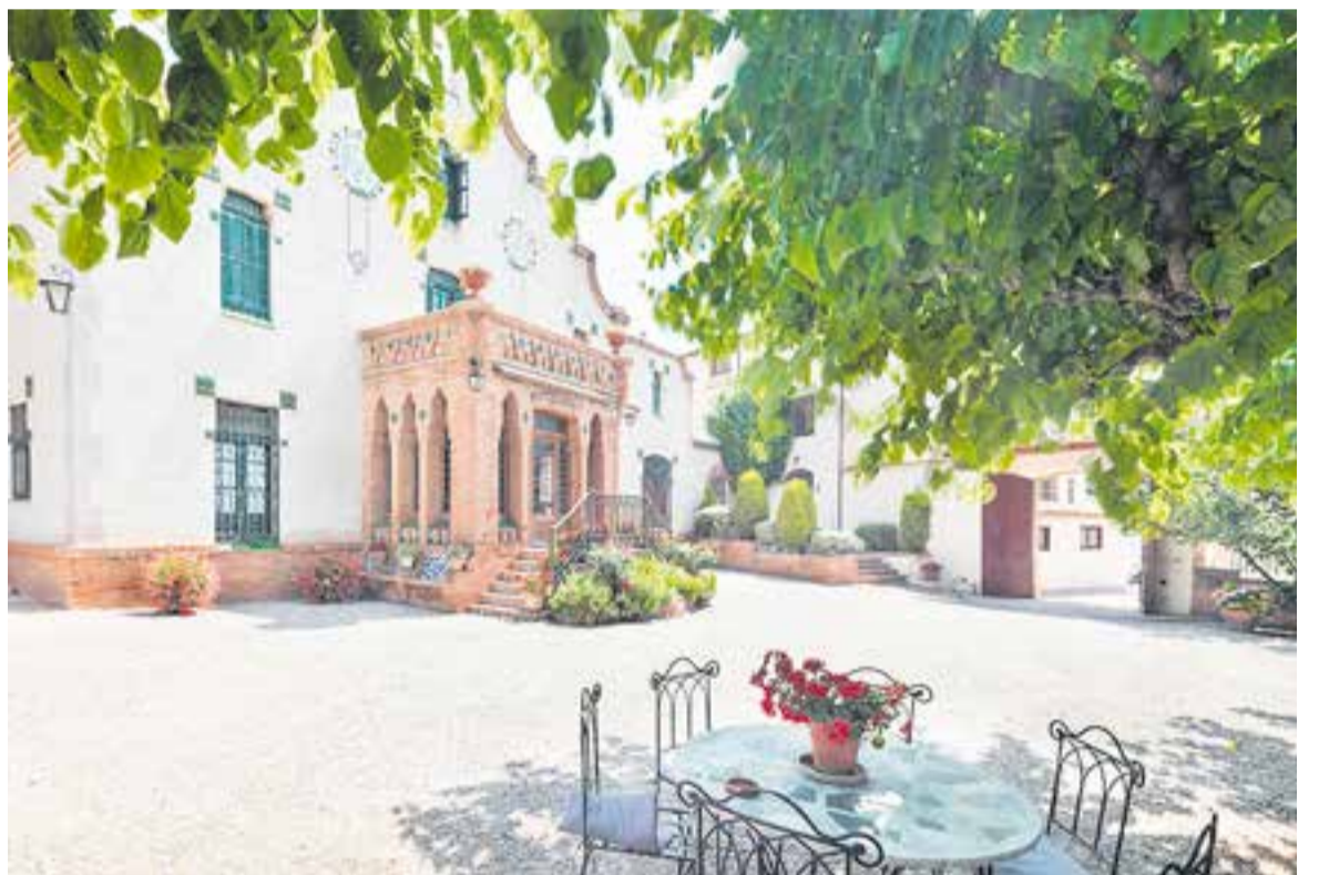
La masia modernista de Can Borrell, situada al quilòmetre 9,2 de la B-124, vista des de l'era