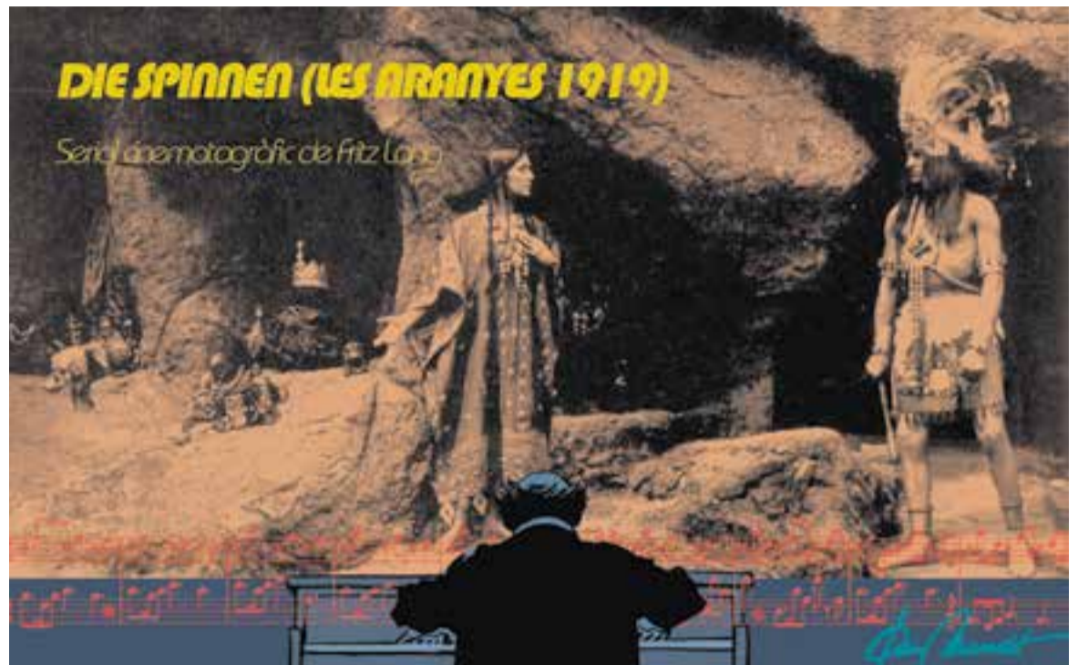
© Serials de fa cent anys amb piano. || JOAN MUNDET

ri que el negoci s'està diversificant i adaptant a cada país i cultura, el que comporta que sigui un fenomen d'anada i tornada. Ara, les sèries nacionals com Arde Madrid o La casa de papel guanyen premis fora i es converteixen en èxits de públics diversos. Les sèries han deixat de ser un producte audiovisual de segona en què un actor o actriu només sortia quan a la indústria del cinema no hi comptava. Ara, actors, actrius, directors i directores es barallen per ser-hi. Si no ets en una sèrie d'èxit o en una plataforma digital no ets visible i tots ho saben i ho sabem. Ara, el consumidor decideix què veu, com ho veu i quan ho veu i, precisament per aquest motiu, la competència és cada cop més dura. I això és dolent per un costat perquè l'oferta