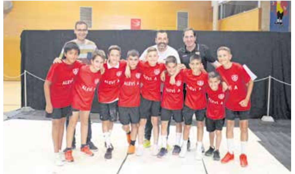
L'ALEVÍ A DE LA UE CASTELLAR, CAMPIÓ DE LLIGA

L'aleví A i l'infantil femení de la UE Castellar, l'Escola de Trial 'ELBIXU', els Lince's Kenpo Karate, el taekwondo World o el pàdel del CT Castellar van ser alguns dels clubs que també van desfilars pel Puigverd. †