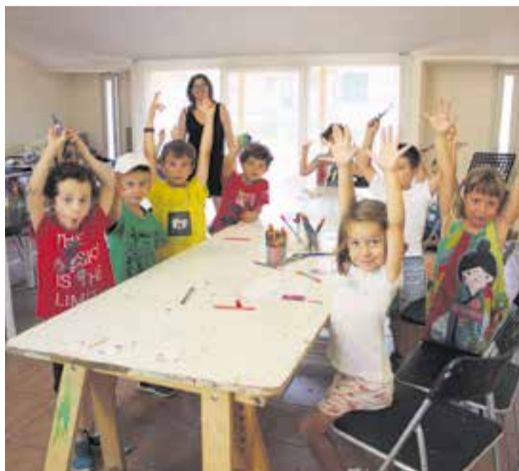
Taller de plàstica del casal d'estiu d'Artcàdia.