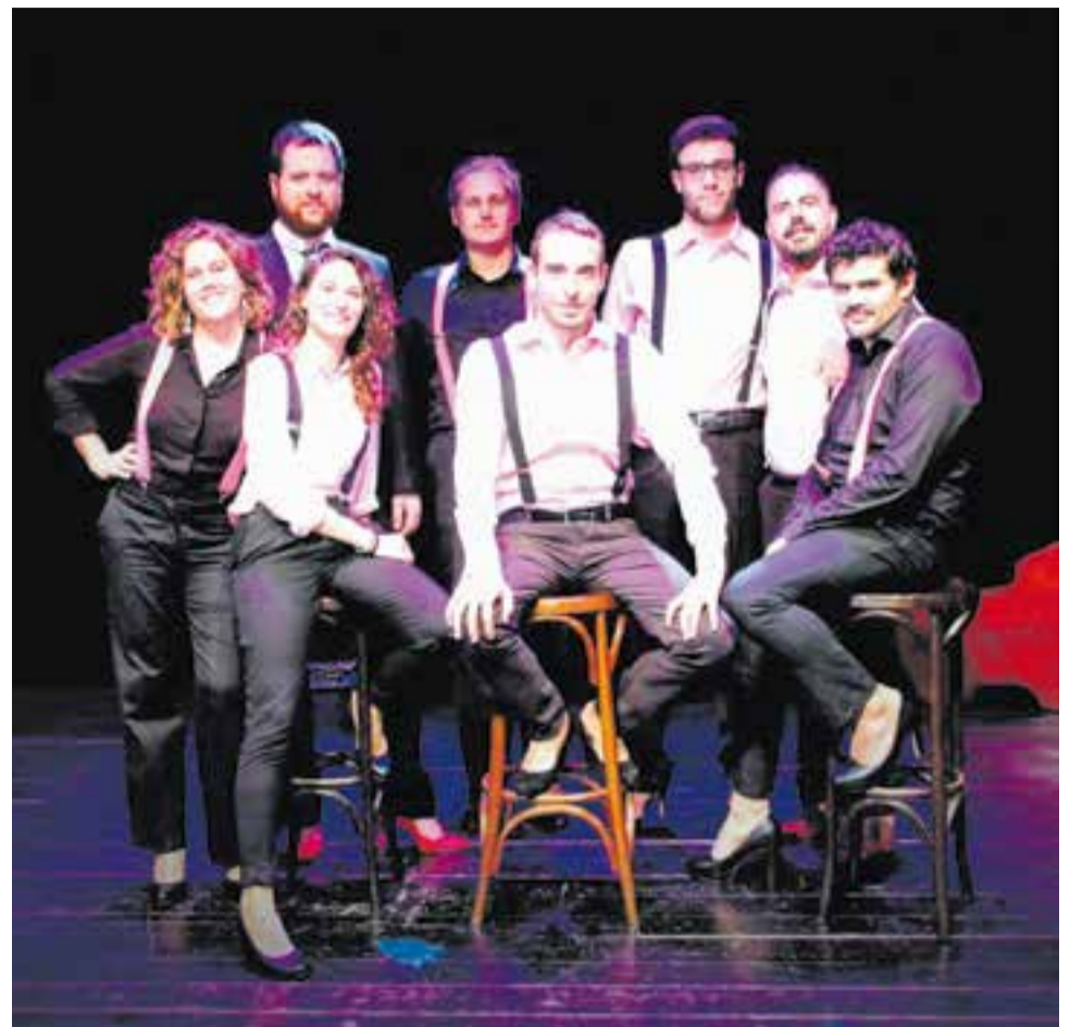
Els components d'Eròtic Giust actuen aquest divendres, als Jardins del Palau Tolrà.

Tots els textos mostren diferents tipus de passions que poden despertar les relacions humanes en totes les seves formes i colors. Els textos són obra de diferents lletristes i poetes de vàlua reconeguda com Jaume Ayats, Miquel Desclot, Pep Albanell, Jaume Arnella i Assumpta Margenat, entre d'altres, que van acceptar el repte de vestir melodies amb textos que tenen en comú la mètrica i el tractament poètic de l'eroticisme en qualsevol de les seves expressions. La proposta de Casellas explora la composició musical i escènica a partir de dos conceptes: la lletra explícita dels seus versos i l'estructura rítmica de les seves cançons, el giusto sil·làbic. ➔