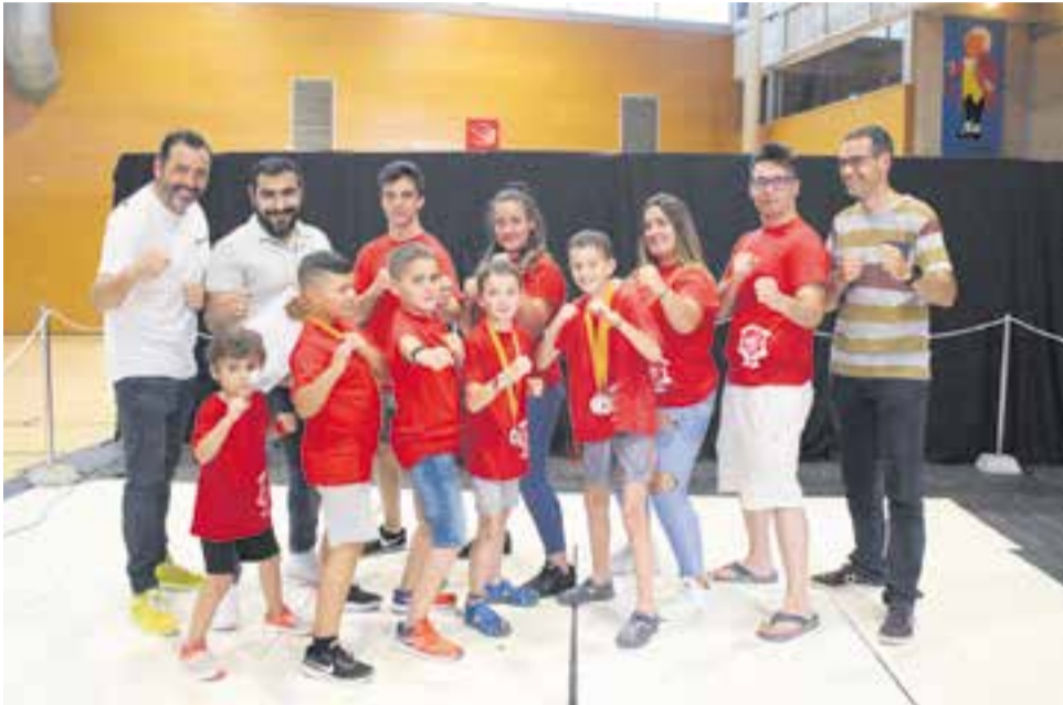
EL LINES KARATE KENPO CASTELLAR HA ACONSEGUIT DIVERSES MEDALLES Or, plata i bronze en els campionats de Catalunya FCK i DA en combat, tècniques i formes i Campionat d'Espanya AKA en tècniques de defensa personal i formes per al Kenpo Karate.