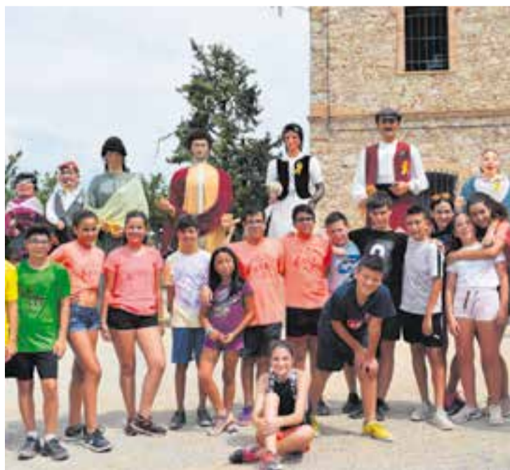
Sortida del moviment de Colònies i Esplai Xiribec d'aquest estiu. || A.P.