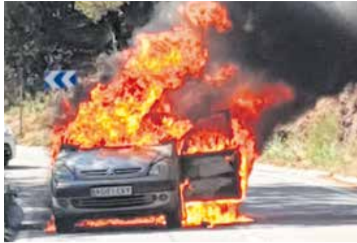
El cotxe va cremar totalment a la C-1415a, dimarts.