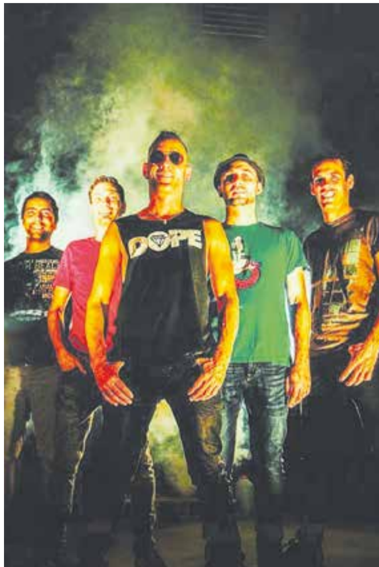
Mucca Failate actuarà a l'aniversari de Radio Teletaxi.

A més, fins aquest dia, qui vulgui pot trucar a Radio Teletaxi, al 93 466 18 19 perquè posin una de les cançons de la formació vallesana, a triar entre "Rota" i "Bonita melodía". +