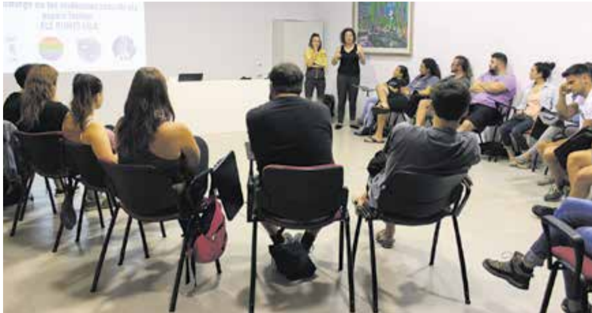
La formació sobre violències sexuals als espais festius es va fer en la Sala Lluís Valls Arenys d'El Mirador.

A banda del contingut més teòric, es van fer dinàmiques i jocs pràctics,