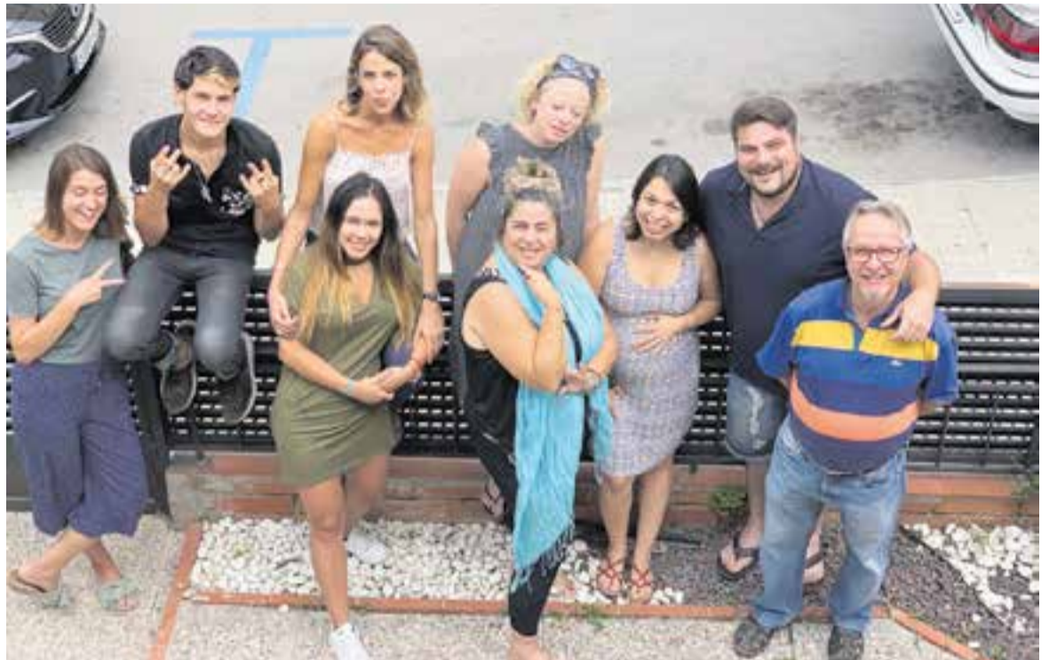
L'equip plurinacional de Catalunya Casas, agència de lloguer temporal de cases, castells i viles de vacances, amb seu a Castellar

D'altra banda, ha entrat en servei un nou mapa-visor per localitzar empreses i espais naturals amb la Carta Europea de Turisme Sostenible. Permet localitzar empreses a cinc dels set espais naturals, entre aquests el Parc Natural de Sant Llorenç i de l'Obac, gestionat per la Diputació. +