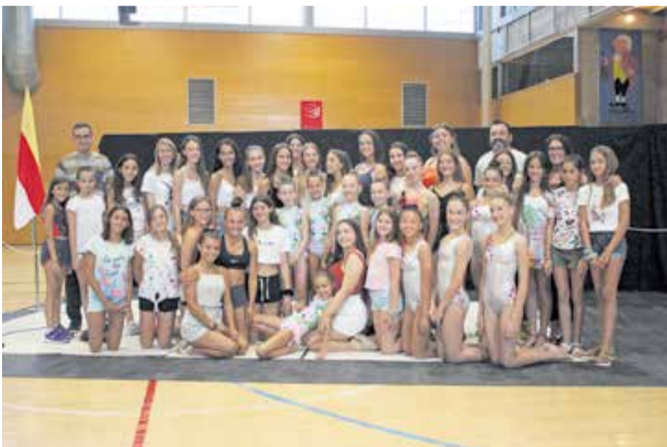
EL CLUB RÍTMICA CLAU DE SOL, CAMPIONES DE CATALUNYA A més de ser les estrelles de la presentació, el Club Rítmica Clau de Sol va rebre diversos premis dels campionats de Catalunya aconseguits durant la temporada. || foto: R. GÓMEZ