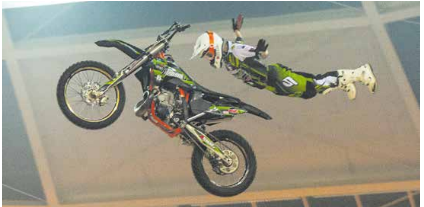
El Xavi coneix bé l'estructura del sostre del Tarraco Arena.

Breaking.com, organitzador de l'esdeveniment, va comptar amb un cartell de luxe a Tarragona, amb la presència del sempre estimat