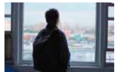
Documental 'Push'.

A través de la Leilani Farha, relatora especial en habitatge de l'ONU, viatjarem per diferents països tractant entendre qui està sent expulsat de les ciutats, conversant amb persones de l'àmbit polític com Ada Colau, la reputada sociòloga Saskia Sassen, l'economista Joseph Stiglitz i el periodista italià autor de Gomorra, Roberto Saviano. †