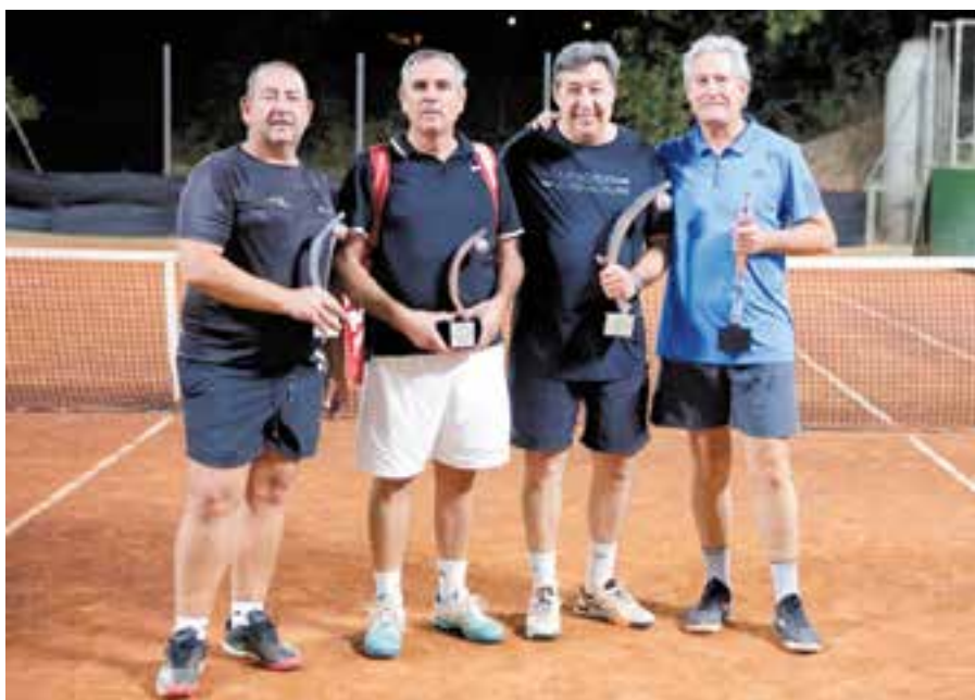
Els quatre finalistes del Torneig Memorial Josep Maria Germà amb els trofeus aconseguits.