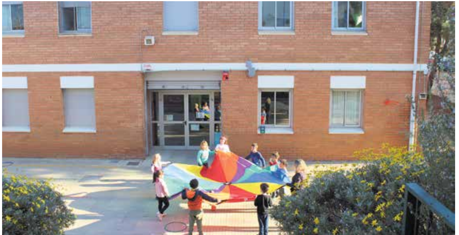
Una imatge del curs passat de l'escola Sant Esteve, que aquest curs ja ha arrencat com a institut escola i necessita una ampliació.

Tot i que el nou institut escola es pot considerar la inversió estrella de cara al 2020, també cal destacar la partida de 300.000 euros que es destinaran al projecte de la nova piscina municipal descoberta, que s'haurà d'anar perfilant en els pròxims mesos però que, segons ha transcedit en l'audiència de pressupostos, no s'optarà per ampliar la de Sigüe. També cal tenir en compte que la via pública i l'espai públic també s'emporten una part molt important dels 3 milions del pressupost destinat a inversions, que inclouen 1,4 milions del superàvit dels comptes de l'any 2018. En con-