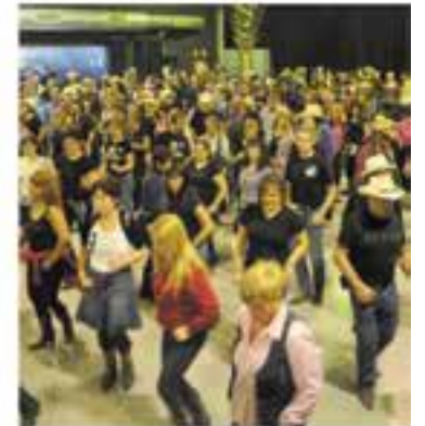
Amics del Ball de Saló

+INFO: a/e tothicapcastellar@gmail.com , com: tel. 649 54 58 03 (tardes)