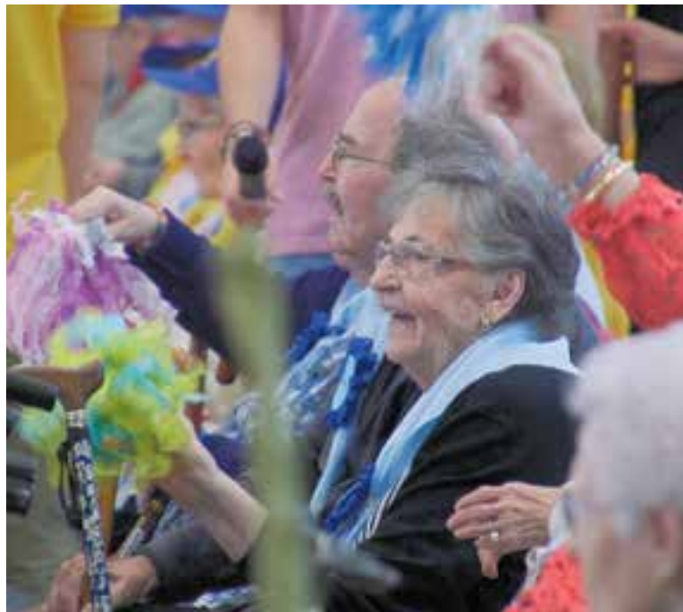
Les Resiolimpiades van omplir el Pavelló Puigverd, diumenge passat.

Les cinc proves, realitzades simultàniament, van consistir en relleus de pilota, tir de bitlles, audició de música, psicomotricitat amb taps de colors i tir a la diana. "Tots els avis i àvies que hi participen se senten acompanyats, tenen la possibilitat de trobar-se amb altres companys de residències i, tots ells, tenen una gran jornada