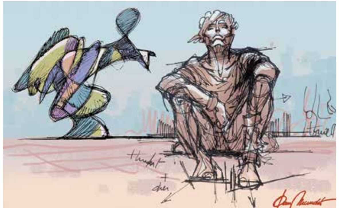
© Anda o revienta. || JOAN MUNDET

Escriure un poema i pujar-lo a YouTube, Instagram, Facebook, Wattpad, Blogger o WordPress, forma part d'aquest "nou joc". I sense que ens adonéssim del que estava passant, va néixer la Poesia Urbana; poemes d'amor, feministes o reivindicatius, escrits per joves que, gràcies