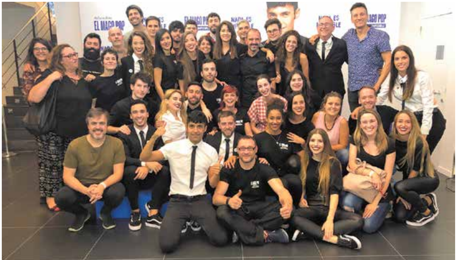
Equip del Teatre Victòria amb alguns dels components de Castellar del Vallès i el Mago Pop al centre, que estrena 'Nada es imposible'.

El teatre fa el ple cada dia, de dimecres a diumenge, el cap de setmana i festius, amb doble funció. La capacitat de l'auditori del Victòria és de prop de 1.200 localitats per funció. "Esperem que se-