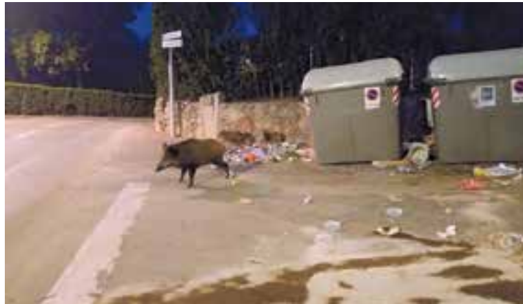
Senglars al voltant de contenidors a Sant Feliu del Racó.