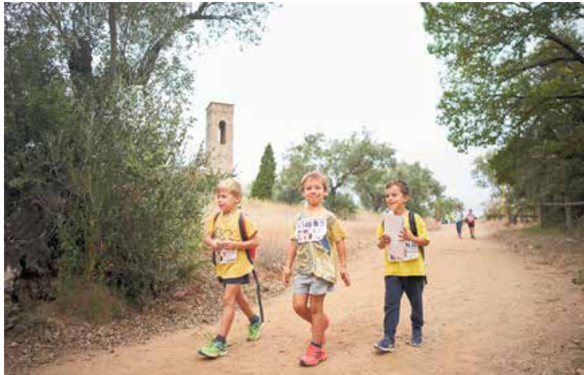
Tres participants de la 58a Marxa Infantil, després d'esmorzar, al control de pas de Castellar Vell.

La primera sortida es va fer a les 8.30 h i, correlativament, les diverses parelles van anar sortint segons el dorsal, que marcava l'hora de sortida per parella. A primera hora, la meteorologia era inestable, i fins i tot van arribar a caure quatre gotes