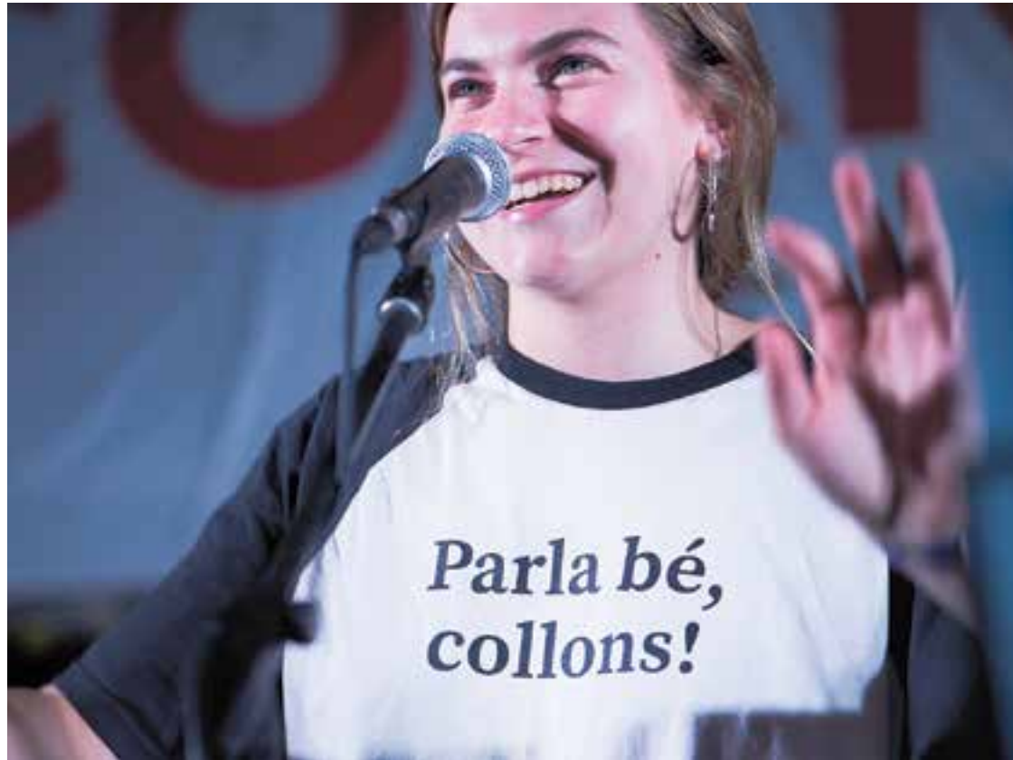
La cantant del grup castellarenc Lòxias lluint una samarreta de La Incorrecta durant la seva actuació al Correllengua.

El Correllengua homenatja cada any la vida d'escriptors, artistes i activistes. Aquesta edició, va ser Pere Calders, que ha esdevingut un referent de la literatura catalana gràcies a, sobretot, la imaginació que desbordaven els seus contes. “L'essència màgica de les coses”, destaca de l'escriptor el Correllengua d'aquest any. Aquesta edició, es complien 25 anys de la seva mort.