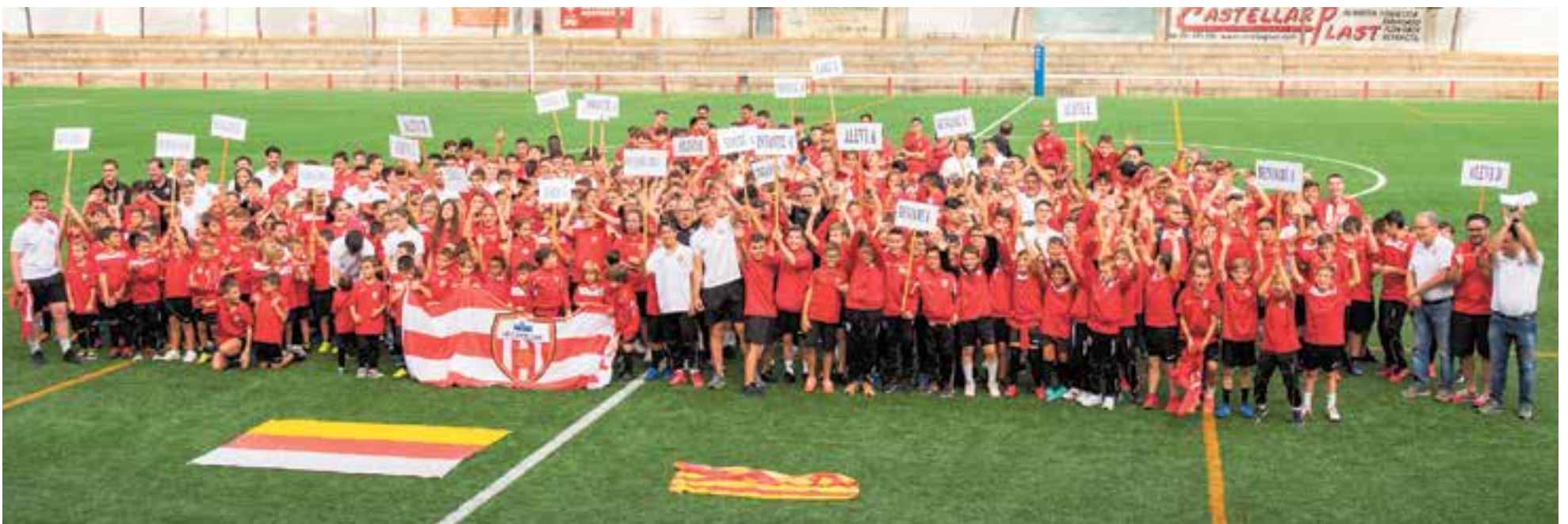
Els equips que formen la UE Castellar, junts sobre la gespa, després de la desfilada de dissabte a la tarda al Joan Cortiella - Can Serrador.

Dia gran dels equips de la Unió Esportiva al Joan Cortiella, que acaba amb la cinquena victòria del primer equip