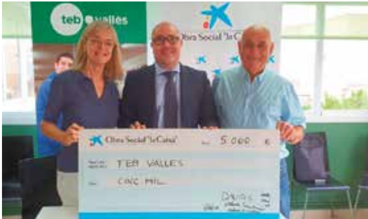
El director de l'oficina de CaixaBank amb responsables de TEB Vallès.