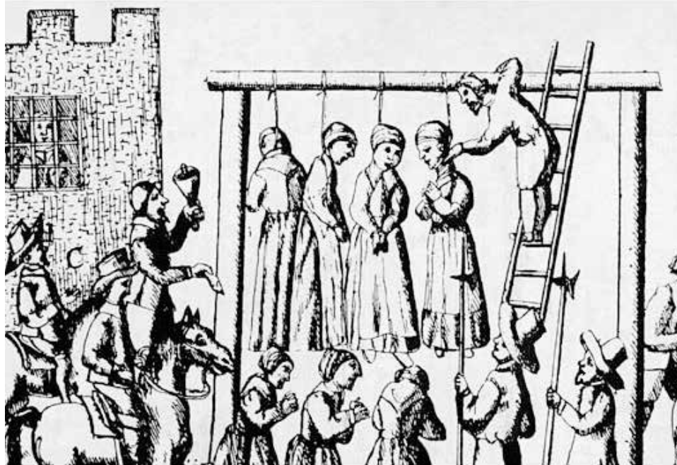
Una reproducció de l'època amb una execució de bruixes.

La segona activitat programada és una visita a la masia de Can Pèlags (també anomenada Can Pèlachs o Can Pèlacs), que tindrà lloc dissabte 12 d'octubre, des de les 9.30 h i fins a les 13 h aproximadament. Els assistents a aquesta proposta podran entrar a l'interior de la masia, documentada des del segle XIII, i conèixer-ne tant l'origen medieval com les etapes constructives, els canvis d'usos des de la seva funció com a fortificació medieval fins a convertir-se en una masia moderna, i