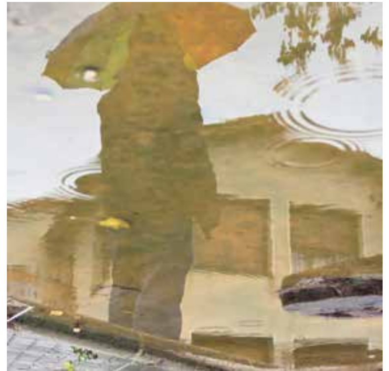
L'estiu ha tingut contrastos: onada de calor i pluges intenses.

Tot i l'episodi de precipitacions intenses de l'estiu, el cert és que a hores d'ara Castellar acumula un dèficit important de pluja. Des del mes de gener i fins al setembre, la vila ha registrat 320 l/m 2 de pluja acumulada, mentre que l'any passat "en aquests moments ja havíem sobrepassat els 800 l/m 2 ". La mitjana anual de pluja acumulada a Castellar se situa al voltant dels 650 l/m 2 . "L'any passat va ploure molt més del que toca-