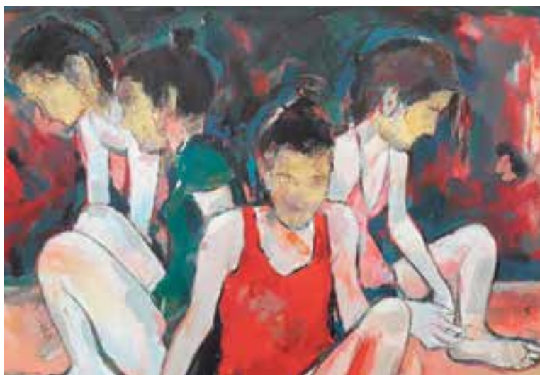
'Quatre figures assegudes', títol del quadre d'E. Prat a la M. Contemporary Art Gallery.

Sí, de fet això és un primer pas, depèn de com vagi segurament en sortiran d'altres. De fet, sense ni tan sols haver fet l'exposició ja m'han sortit altres oferiments tant de Nova York com de París per participar en un Saló Internacional, i possiblement, sortiran altres oportunitats per poder donar més visibilitat a la meua obra. ➔