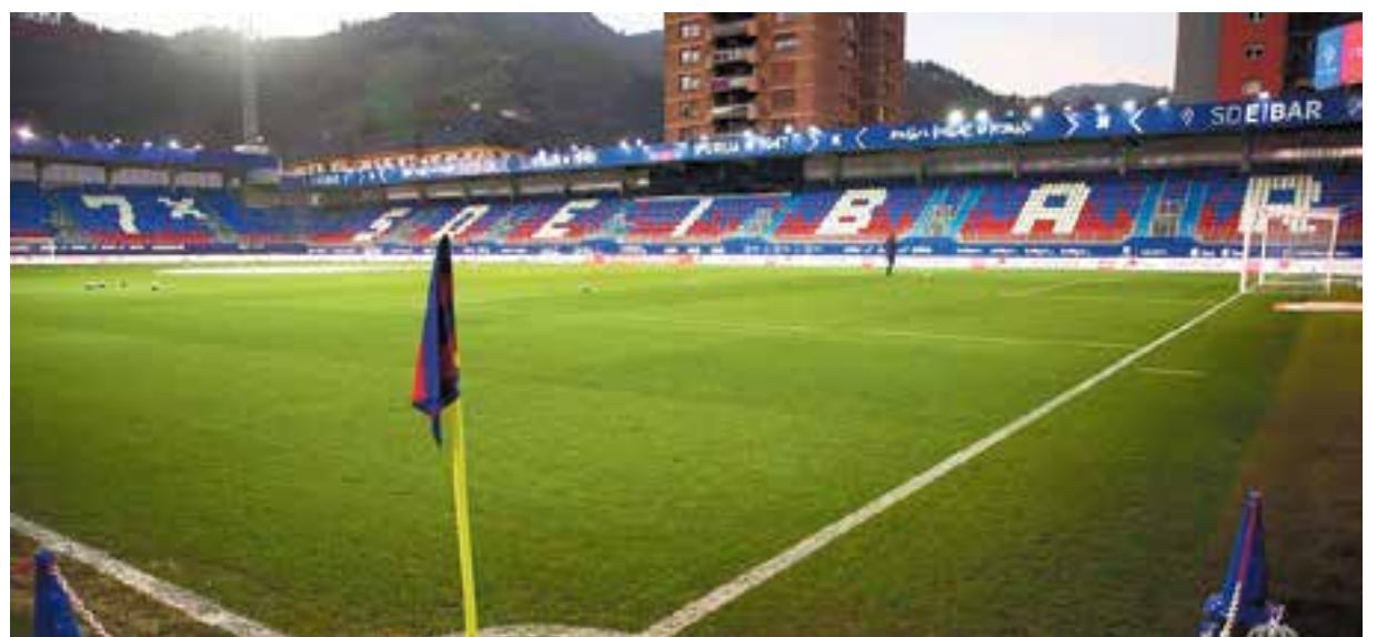
L'estadi d'Ipurua completament buit abans del partit de l'Eibar i la Reial Societat, el primer d'aquesta setmana a porta tancada.

El món de l'esport ha estat un dels més colpejats per la incertesa del Covid-19 i on més canvis s'han produït en les últimes dues setmanes. El Ministeri de Cultura i Esports del Govern d'Espanya va publicar aquest dimarts un document d'acord amb el qual "totes les competicions professionals i no professionals d'àmbit estatal i internacional s'han de celebrar a porta tancada, fins a nou avís, com a mesura preventiva de contagi del coronavirus SARS-CoV-2". Durant la jornada de dimecres, les quatre federacions catalanes on l'esport castellarenc es veu involucrat més massivament -futbol, bàsquet, hoquei i atletisme- han decidit cancel·lar per un període de 15 dies totes les activitats esportives en resposta a les directives estatals per a fer front l'expansió del coronavirus. És per aquest motiu, que cap dels equips de qualsevol de les categories disputarà les jornades planificades durant aquest cap de setmana i el següent. + || A.S.A.