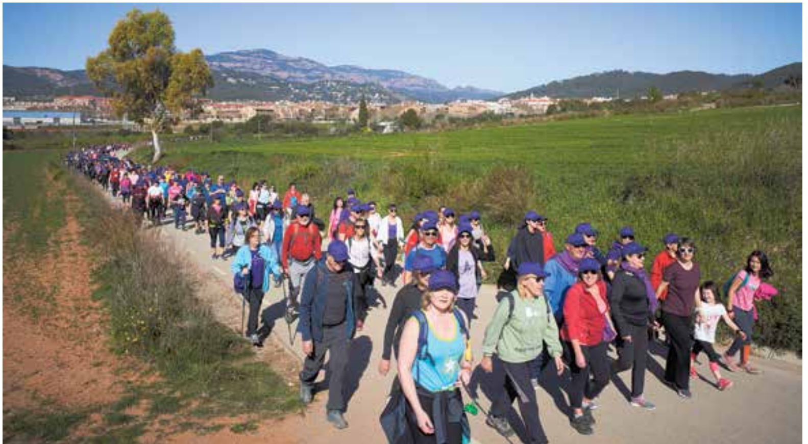
Centenars de persones es van mobilitar en l'activitat del 8M, 'Fem passes per la dona'. En la imatge, el capdevant de la caminada amb Castellar i la Mola de fons.

El manifest, alhora, tenia un vessant interseccional, ja que as-