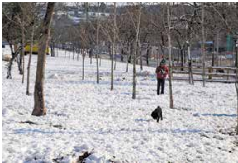
Imatge de la nevada a la zona del carrer Arbreda, l'endemà del 8 de març del 2010

El meteoròleg de L'ACTUAL, Jordi Moré, va recordar aleshores que la nevada tenia com a precedent immediat comparable a la del 1993, que també va ser al març. De