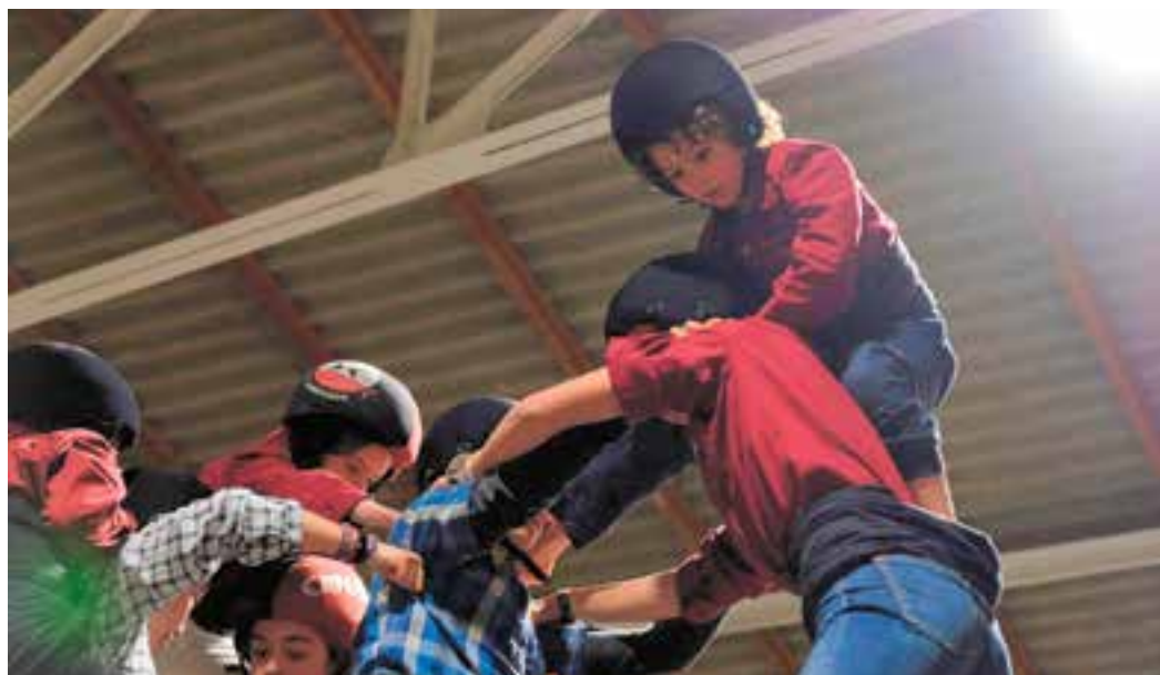
Assaig dels Castellers de Castellar, divendres passat a l'Espai Tolrà.