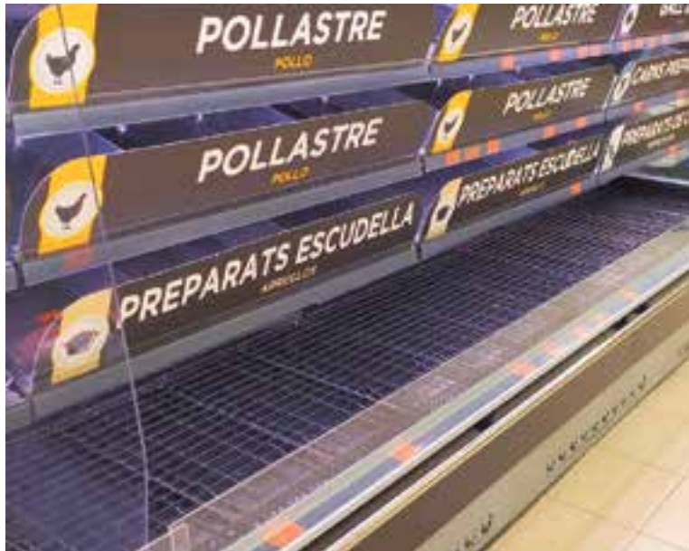
Una línia de productes d'un súper de Castellar buida, dimecres passat.

A aquesta decisió se sumen els tancaments de la gran majoria d'equipaments municipals de Castellar, mesura que inclou la clausura dels casals d'avis i del complex esportiu Puigverd que gestiona Sige. El Comitè municipal de seguiment de l'emergència sanitària generada pel coronavirus que es va constituir dimarts passat ha pres mesures contundents de prevenció i precaució que són efectives des d'ahir dijous i que es perllongaran fins al 26 de març. Sí es mantindran oberts el Servei d'Atenció Ciutadana d'El Mirador, els serveis de Salut Pública i