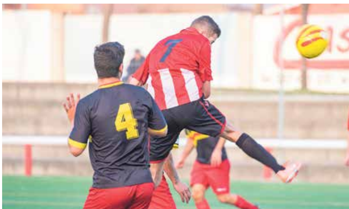
Després d'un gran inici de Lliga, la UE Castellar passa per un moment difícil amb tres derrotes en quatre partits.

La imatge que es va veure des de la grada durant la segona part va ser lamentable: un equip sense recursos i sense ganes de tenir-los. I tot després d'una bona primera part, en què l'equip