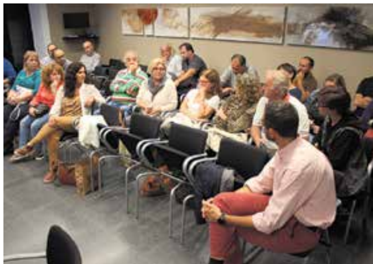
L'audiència pública dels pressupostos participatius celebrada l'any passat.

Les tretze propostes acceptades, que enguany es distribueixen de nou en dues categories: propostes d'inversió al nucli urbà i propostes d'inversió a Sant Feliu del Racó. Dins de la primera categoria, s'inclouen 11 propostes: 'Replantem Castellar'; 'Castellar en miniatura, maqueta històrica i urbanística del poble'; 'Excursions inclusives amb la Joëlette'; 'Condicionament acústic del pavelló Dani Pedrosa'; 'Gaudim del parc de Canyelles'; 'L'ADF amb vista de dron: prevenció i protecció'; 'Skatepark-our'; 'Espai públic, espai de trobada'; 'Àrea de serveis per a autocaravanes'; 'Aules multisensorials a les escoles, millorem l'aprenentatge'; i 'Pista poliesportiva a l'Espai Tolrà'. Les dues propostes d'inversió pre-