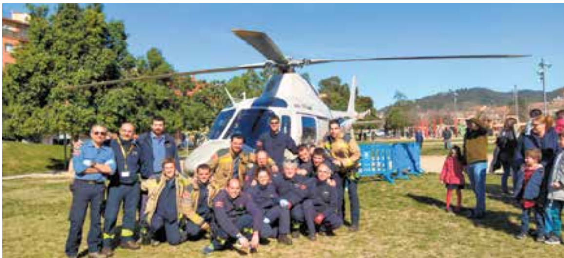
Uns quants bombers davant de l'helicòpter que ha aterrat aquest matí a l'Espai Tolrà.

Com l'any passat, es va instal·lar una barra com la que hi ha als parcs de bombers per baixar de planta llicant ràpidament. També, per als més petits, durant tot el matí hi va haver un inflable gegant. A més del servei de bar, es va repartir xocolata calenta entre la mainada. +