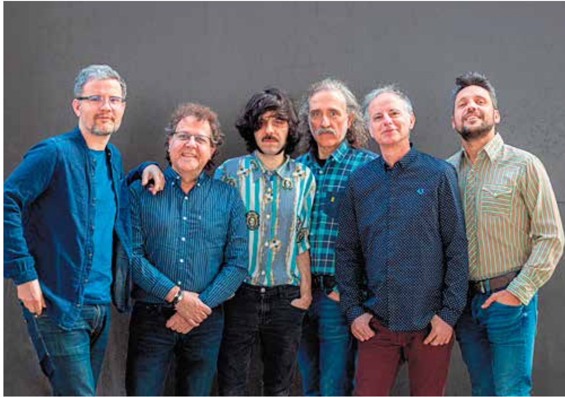
Imatge promocional de la gira 20/20 del 35è aniversari de Els Pets.