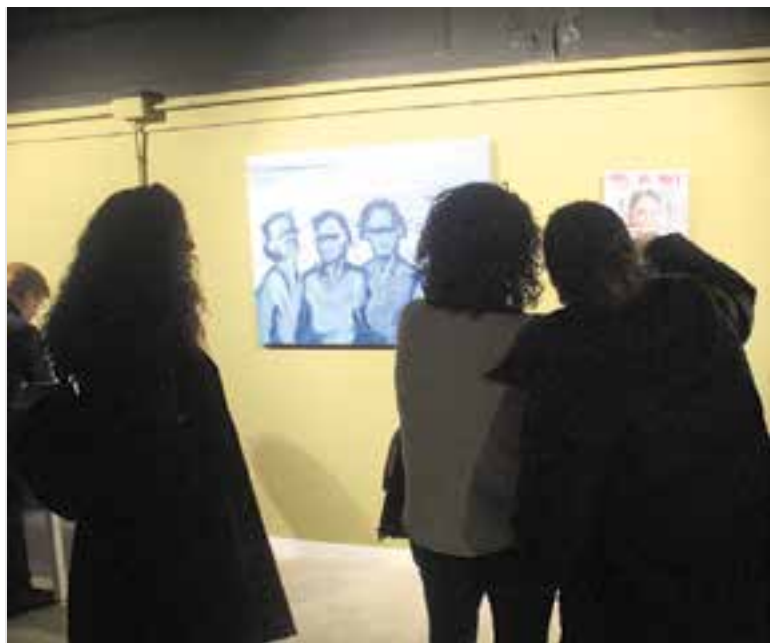
Moment de la inauguració de 'Nadryv' a la Sala d'Exposicions d'El Mirador. || I. VIZUETE

Deu dones castellanques mostren les seves creacions artístiques fins al 20 de març