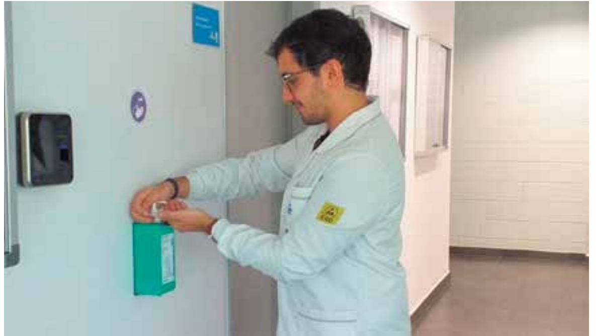
A l'empresa DigiProces del polígon de la Bruguera s'han pres diverses mesures d'higiene per evitar contagis.

També s'estan fent arribar recomanacions de higiene: rentar-se les mans, aplicar-se desinfectant i evitar grans concentracions de persones. +