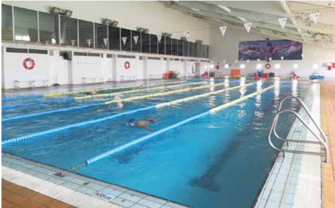
A la piscina del complex esportiu Sige Sport Puigverd s'ha fet un nou sistema de tractament de l'aigua, la cloració salina.

La millora per fer-hi una cloració salina no es podrà gaudir en les properes 2 setmanes per l'ordre de tancar equipaments per culpa del coronavirus