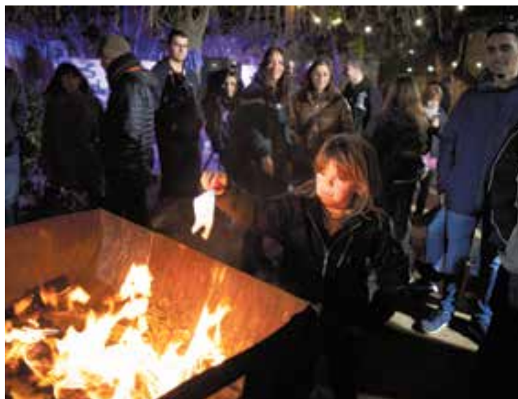
Una nena crema un missatge patriarcal a l'akelarre de les Carnera.