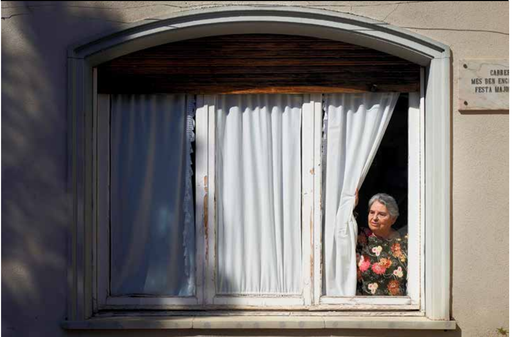
Una resident de l'Obra Social Benèfica (OSB) mira per la finestra de l'accés principal. Les residències de gent gran han restringit dràsticament les visites per prevenir contagis en la població de risc.