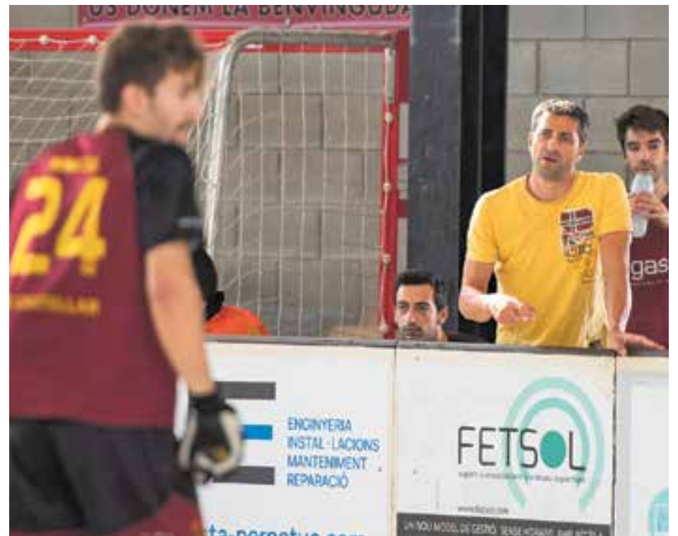
Als granes els queda molta feina si volen jugar la promoció d'ascens. || A. SAN ANDRÉS