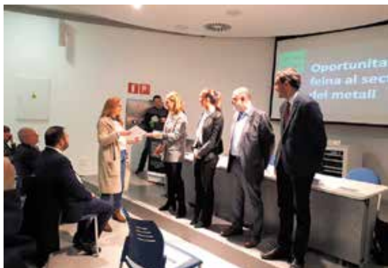
La cloenda del programa MetallVallès dimecres passat a Sabadell.

De les 22 empreses castellarenques, 11 s'han incorporat per primera vegada en aquesta tercera edició del MetallVallès. Cal dir també que les 45 persones participants en aquesta tercera edició 26 s'han pogut inserir laboralment. Totes elles han dut a terme accions de formació, que en aquesta edició s'han adreçat especialment a les dones i que han inclòs per primera vegada continguts de metrologia. Els participants també han pogut realitzar tutories de se-