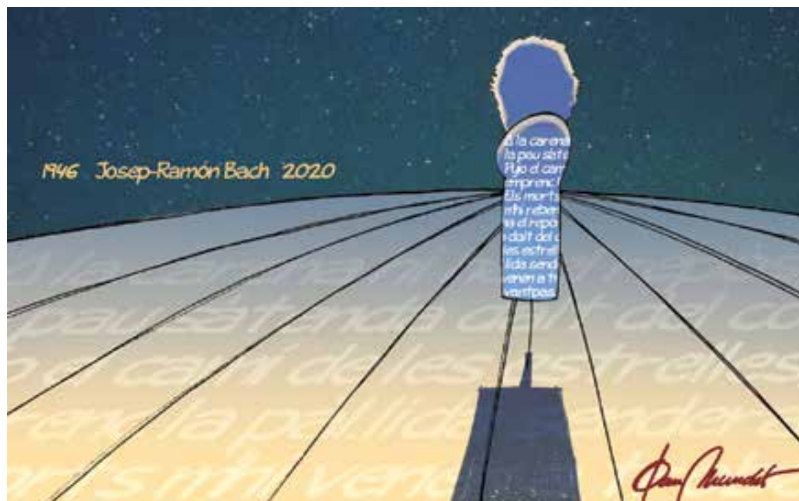
© Adeu nocturn, Josep-Ramon Bach. || JOAN MUNDET

Quan era allà va arribar l'equip mèdic i, per a sorpresa meua, no em van fer fora, de manera que em vaig quedar en qualitat de quasi familiar, al costat de la Mercè. El metge en cap, un home de mitjana edat que em va semblar particularment amable i enraonat, va intentar parlar amb tu, però només aconseguia arrencar-te