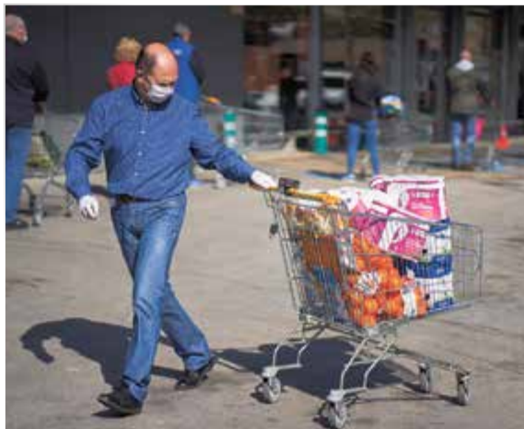
Un castellarenc amb un carro de súper. Al fons, cues amb distància social.