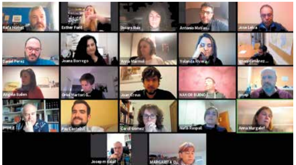
Els 21 components del consistori castellarenc van poder fer el ple per via telemàtica, dimarts passat.