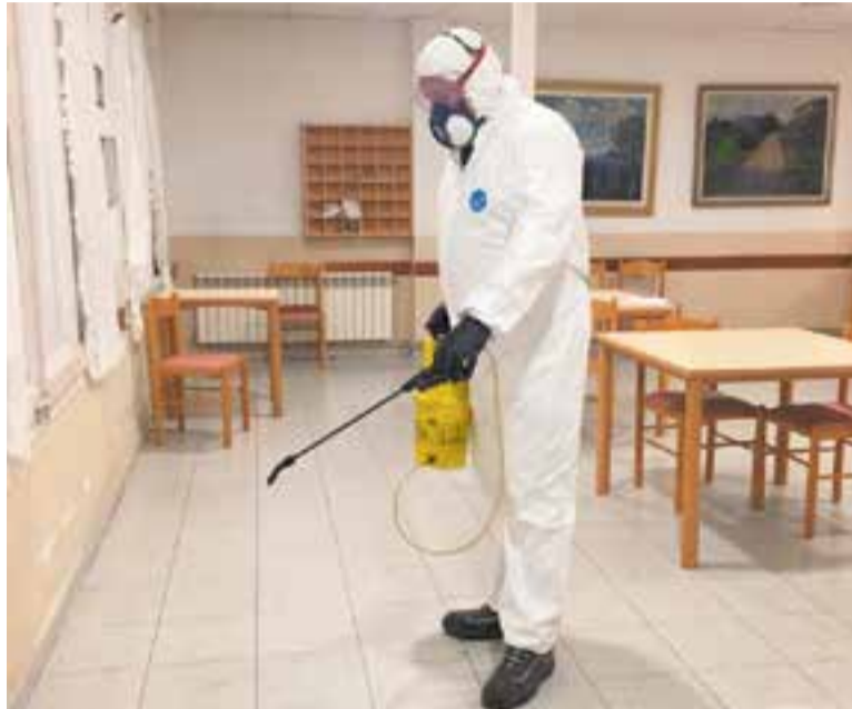
El cap de setmana passat es van desinfectar les cinc residències de Castellar.

El que sí preocupa especialment, és la situació de Sant Llorenç Savall, municipi amb qui es comparteix àrea bàsica de salut -el CAP de la vila-. Hi