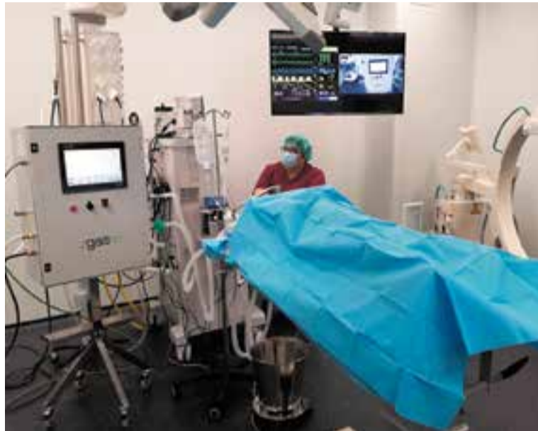
L'empresa GasN2 ha aconseguit l'homologació del seu respirador.

Tan aviat com va sorgir la idea, la setmana de Sant Josep, l'equip de I+D+i va dissenyar una primera proposta en dos dies. Al cap de dos dies més ja tenien una primera versió construïda i amb software propi. La setmana següent ja van entrar en contacte amb CatSalut i es van realitzar unes primeres proves a l'Hospital Mútua de Terrassa. Després van venir més testos i assajos a l'Hospital Clínic de Barcelona i al Germans Trias i Pujol. "Estem preparats per a produir fins a cinquanta unitats diàriament a les nostres instal·lacions", afegeix Tulleuda. L'empresa ha donat cinc respiradors a la unitat de cures intensives de l'Hospital Universitari Mútua de Terrassa. +