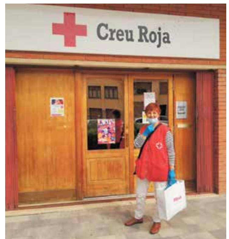
Els voluntaris de la Creu Roja han fet un curs específic sobre la covid-19