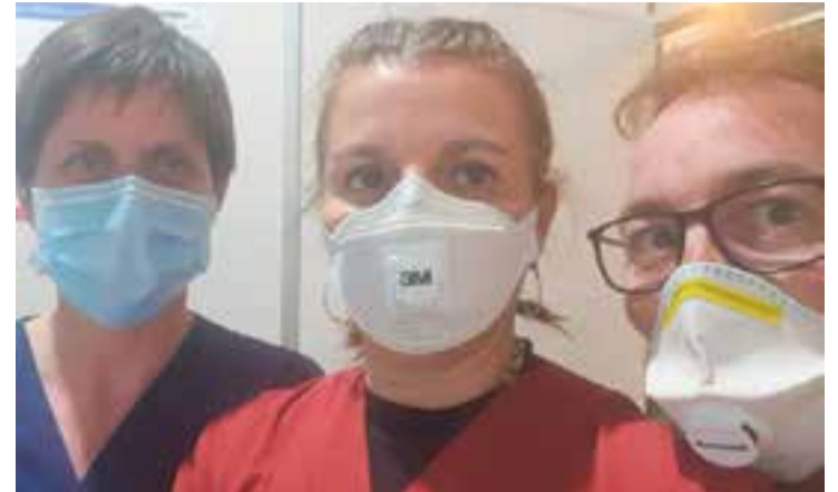
L'equip de Bitxos en una foto de fa pocs dies.