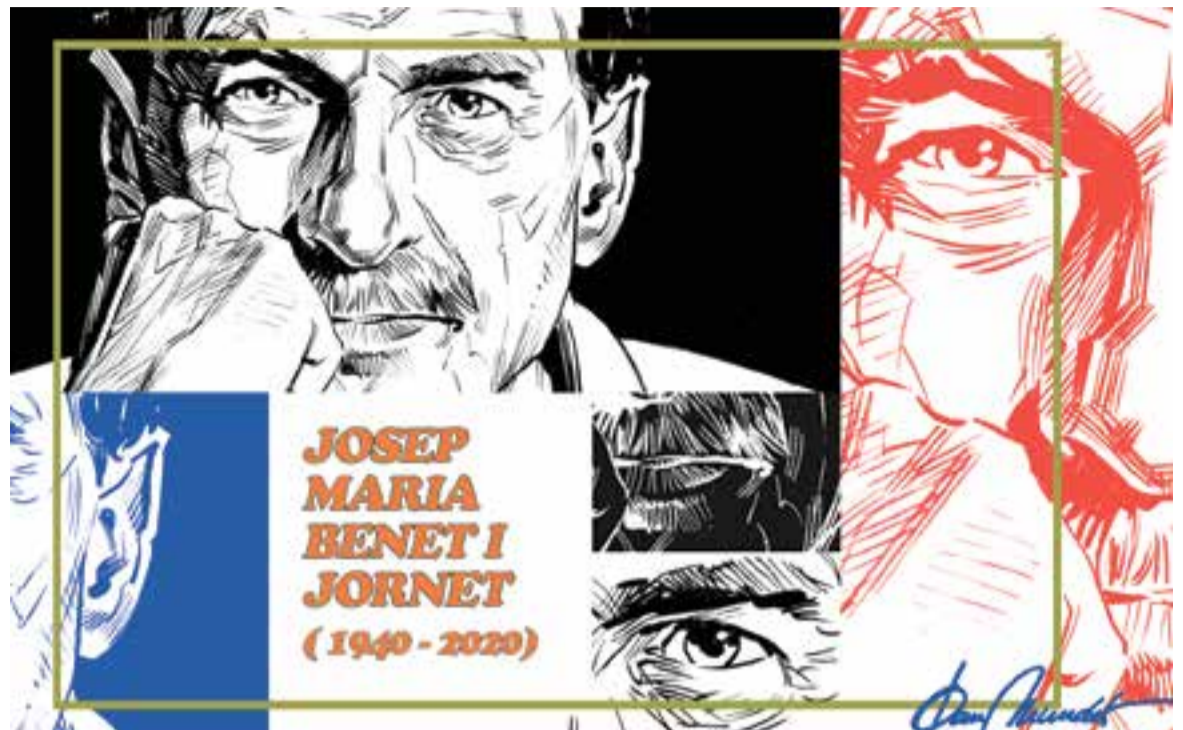
© Josep Maria Benet i Jornet (1949-2020).

Un dels grans valors de la seva obra teatral és haver persistit en la idea i confirmació de continuïtat literària que necessitava el teatre català. Davant dels pessimistes que no han cregut mai en l'existència d'una tradició dramàtica catalana i en les seves opcions de futur, Benet i Jornet va apostar des del primer moment per la recuperació dels nostres clàssics