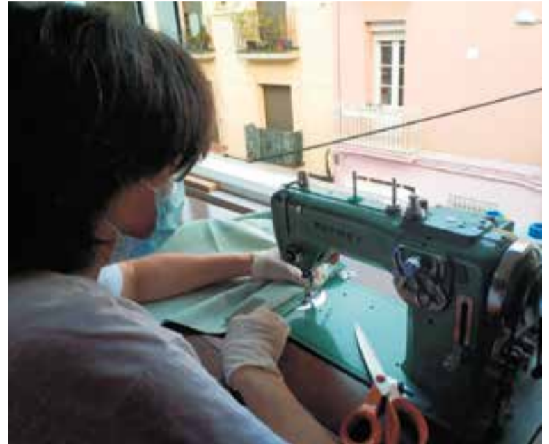
Una cosidora voluntària fa bates per a sanitaris.

Una de les mesures més importants de combat contra la pandèmia es va dur a terme el cap de setmana passat a les cinc residències de la vila: l'Ajuntament, en col·laboració amb la Generalitat, van encarregar a una empresa especialitzada la desinfecció d'aquests equipaments especialment sensibles en aquests moments on els contagis són especialment virulents.