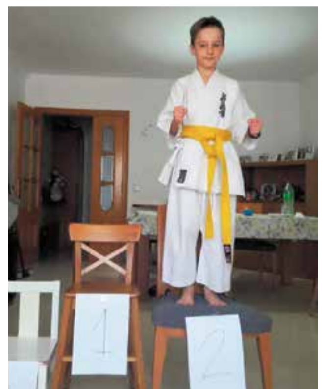
Dos dels participants d'aquesta primera experiència competitiva feta des de casa.

de la Covid-19, un virus convertit en assistent virtual que feia de presentador de l'acte i anava cridant els competidors al tatami central. L'acte de presentació fins i tot va tenir unes paraules de l'alcalde Ignasi Giménez per inaugurar la prova. Una vegada vist el vídeo de l'actuació, els àrbitres el visualitzaven i puntuaven l'acció.