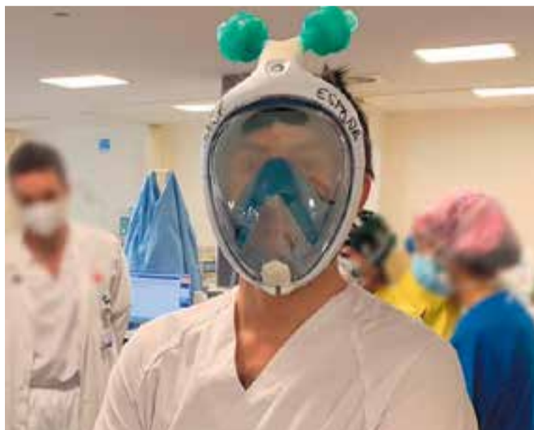
Un exemple de la conversió de les màscares d'snorkel Decathlon en EPI.