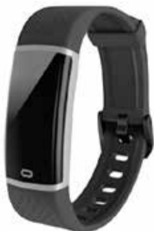
Imatge de polsera Covid 19 ble wristband

El dispositiu fa una reconstrucció de les persones amb les que ha tingut contacte un infectat