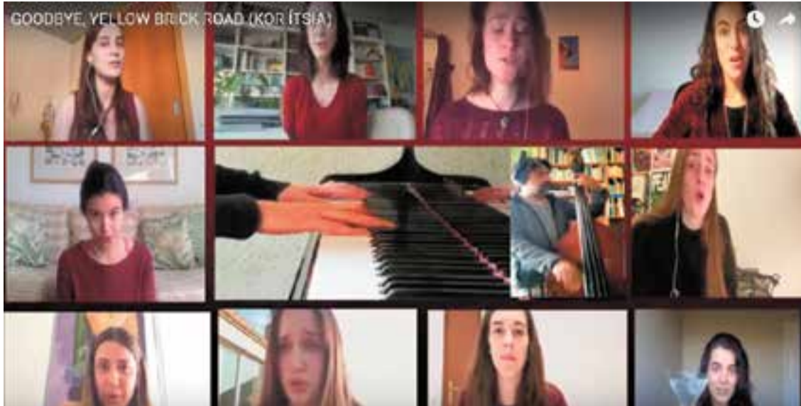
Interpretació del tema a càrrec de les components del Kor Ítsia a la xarxa YouTube. || YOUTUBE