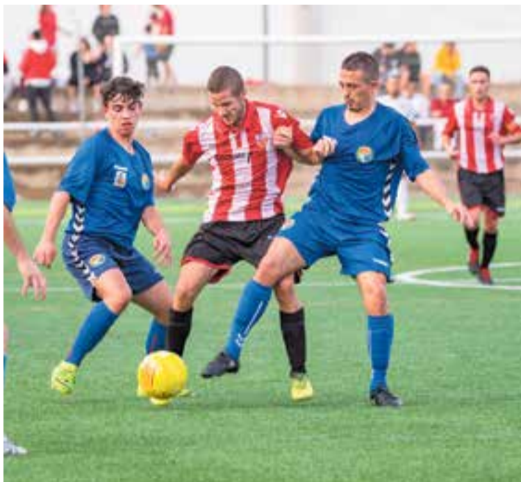
La UE Castellar haurà d'esperar per a veure si aconsegueix l'ascens.

Segons va anunciar la Federació Catalana de Futbol el passat divendres 24 d'abril, queden oficialment suspeses totes les competicions sota el seu aixopluc. La mesura és aplicable al futbol II i el futbol sala, en totes les categories possibles des de la Primera Catalana en el cas del futbol i la Divisió d'Honor de futsal, fins a tots els equips de base.