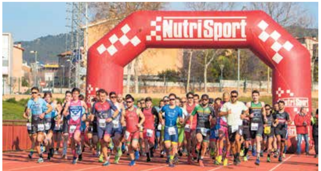
Per a tornar a fer esport amb seguretat s'ha de tenir en compte la situació física durant el confinament.

Els que no han tingut opció de seguir amb un programa adaptat de preparació i activitat física durant el confinament patiran més l'aturada "hauran de tornar a fer activitat física d'una