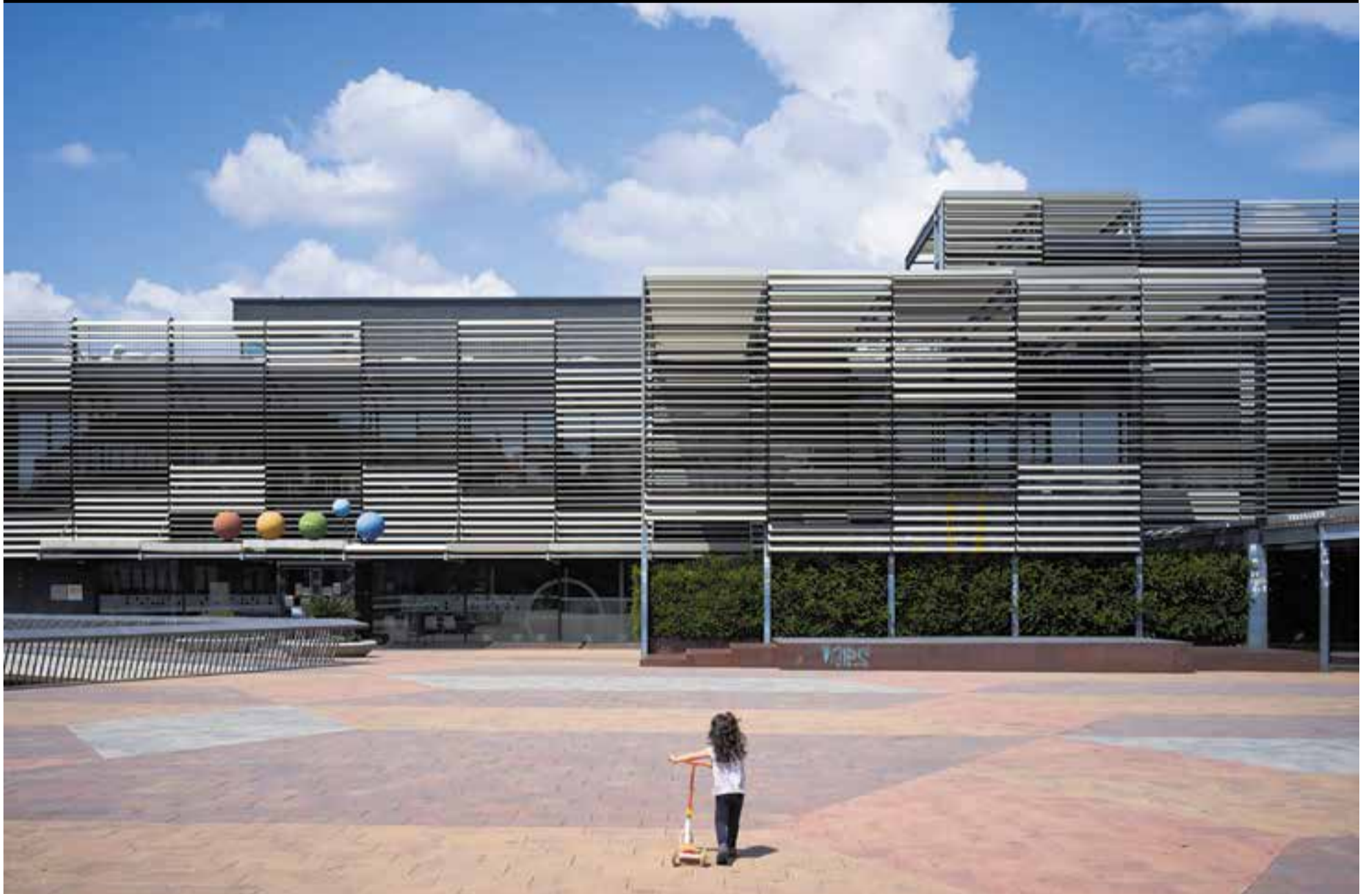
Una nena juga amb un patinet a la plaça d'El Mirador en una imatge de diumenge passat al matí, primera sortida dels menors de 14 anys als carrers i espais públics després de sis setmanes de confinament.