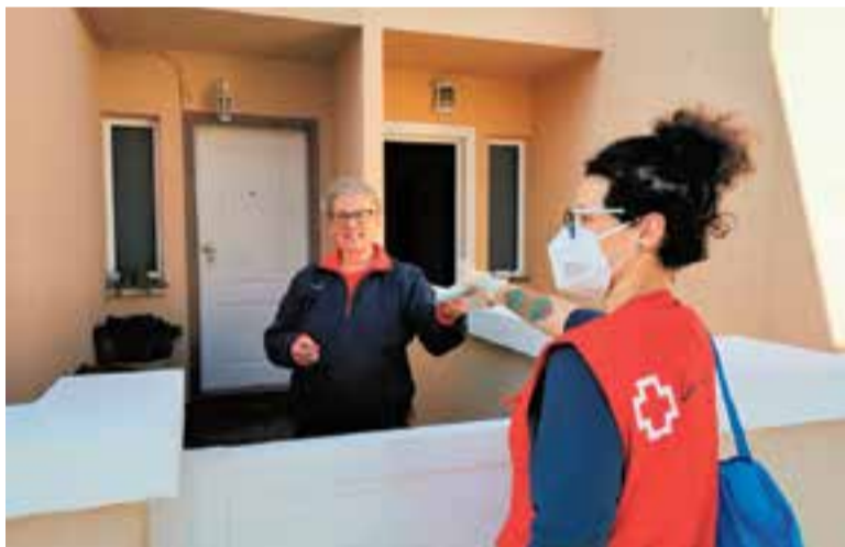
La setmana passada es va fer repartiment per a la gent gran. || A.J. CASTELLAR

Aquestes 78.500 noves unitats se sumen a les 10.000 cedides per la ciutat xinesa de Mianyang que ja s'han distribuït entre les persones de més de 65 anys i els serveis essencials i a les 4.600 provinents del Ministeri de l'Interior repartides a les cinc residències de gent gran de la vila. En aquest sentit, en el ple telemàtic d'abril, l'equip de govern i els diversos grups municipals van agrair la implicació dels voluntaris que estan ajudant en aquests moments tan complicats a ensobrar i repartir mascaretes, com ja es va fer amb les e la gent gran. L'Ajuntament compta ara amb 298 persones apuntades a la borsa de voluntariat, de les quals més d'un centenar ja han participat en diferents programes que s'estan posant en marxa. +