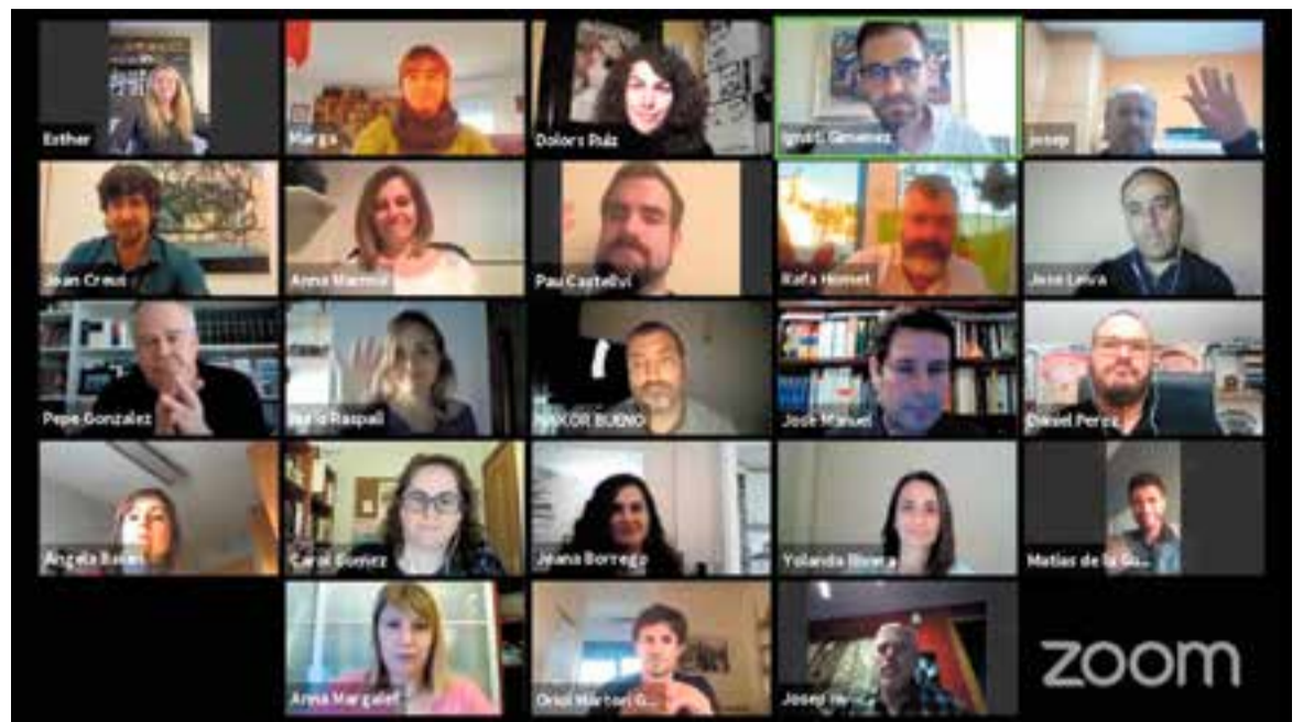
Els 21 components del consistori i el secretari i l'interventor van poder fer el ple per via telemàtica.

I és en aquest context financer d'on partirà tot un paquet de mesures destinades a pal·liar la destrossa socioeconòmica que està causant la pandèmia de Covid-19, però també per dissenyar el futur en què s'haurà de conviure amb aquest nou virus en totes les esferes de la vida i que tractaran tots els grups municipals a la taula de crisi creada recentment. L'alcalde, Ignasi Giménez, va situar diversos escenaris en què han d'incidir les polítiques municipals: l'emergència sanitària que encara es viu (sobretot a les residències), l'atenció a persones i col·