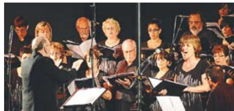
⊙ La Polifònica de Puig-reig va cantar gospel divendres passat, al Palau. || J. G