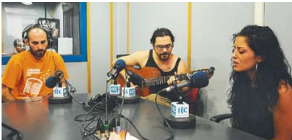
La formació Wadalupe va ser al magatzí 'Dotze' de Ràdio Castellar.

El grup presenta el treball titulat 'Ahora que el aire no es viento' que cantarà en directe diumenge, a Ca La Pastora de Castellar