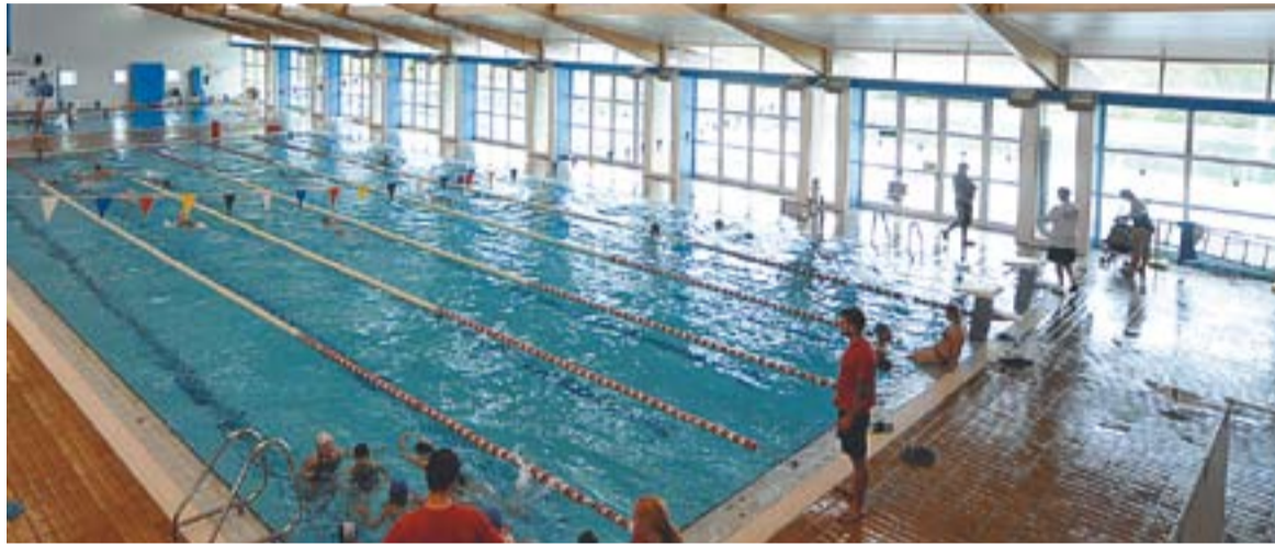
Segons el pla, un municipi com Castellar ha de tenir una piscina coberta per acomplir els equipaments bàsics. || J. GRAELLS

Segons aquest document, el municipi disposa de tots els equipaments de xarxa bàsica, és a dir, una pista d'atletisme, una piscina coberta, tres sales d'activitats dirigides, tres pavellons i un camp de futbol. "Això vol dir que tenim l'imprescindible" , constata Martínez.