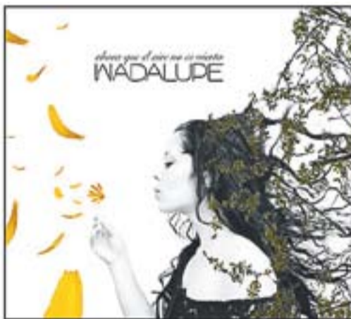
© Caràtula del disc de Wadalupe "Ahora que el aire no es viento". || CEDIDA