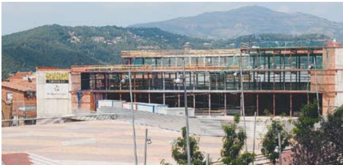
Imatge actual de l'edifici de la plaça Major.

⊕ Serviran per acabar el Centre Cívic i finançar els dos primers anys de l'equipament