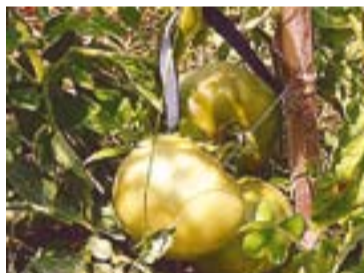
Jaume Torres i els tomàquets.

posat molta il·lusió i paciència”, també explica Almar.