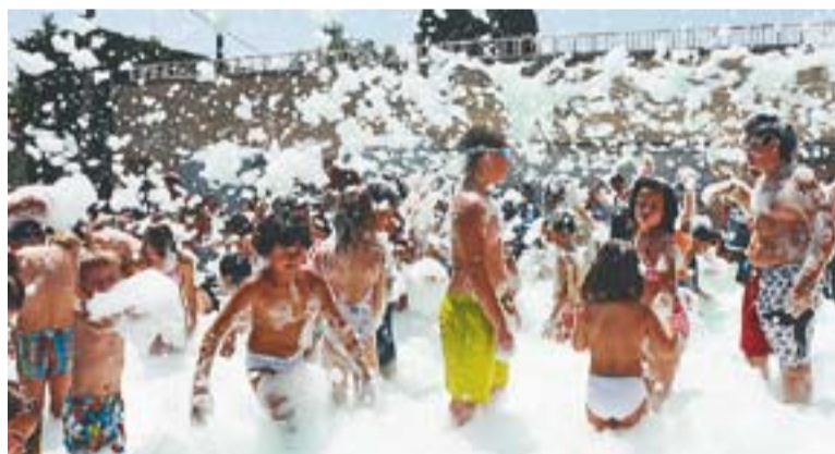
⊙ Festa de l'escuma, diumenge passat, a Can Font.