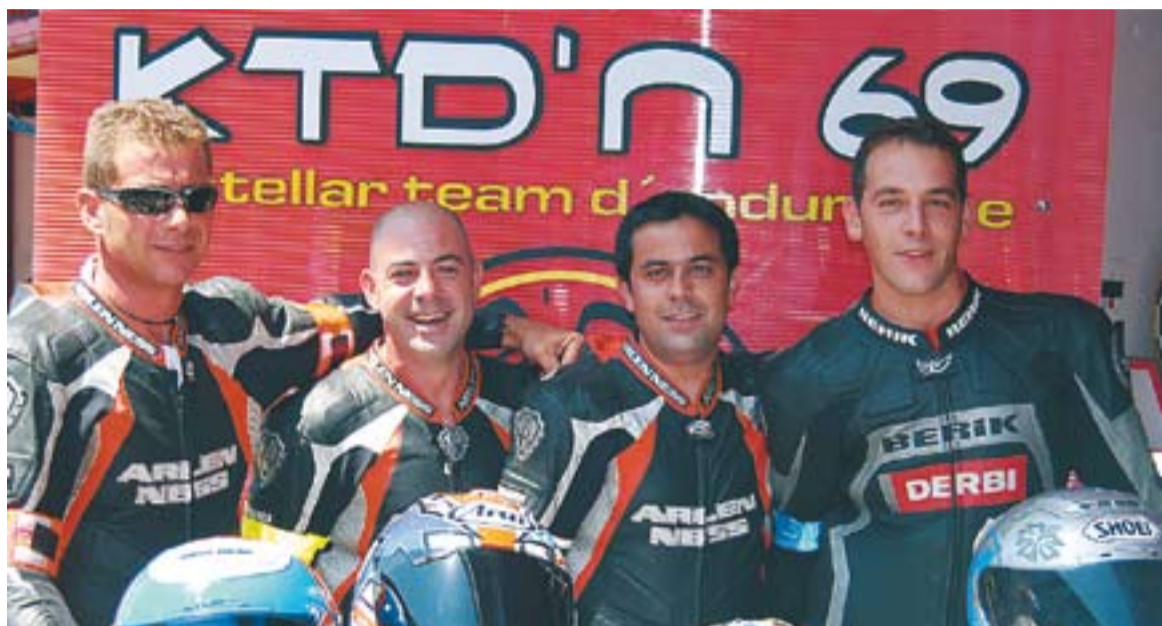
© L'equip del KTD'N 69 a l'edició de l'any passat de les 24 Hores de Motociclisme.