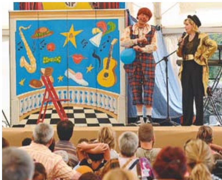
⊙ Espectacle de pallassos, diumenge 12, a Can Font.

La festa Major de Can Font i Ca n'Avellaneda va posar el punt i final amb els objectius aconseguits i amb una traca de fi de festa que es va dur a terme diumenge, a les 21 hores. +