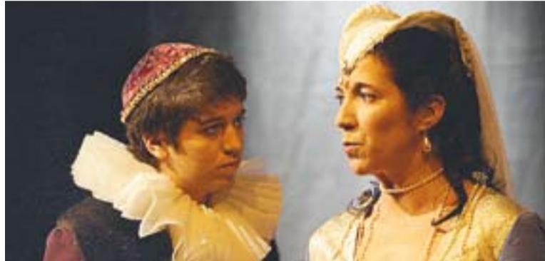
Els voluntaris per la llengua tindran entrades per assistir als muntatges de l'ETC.