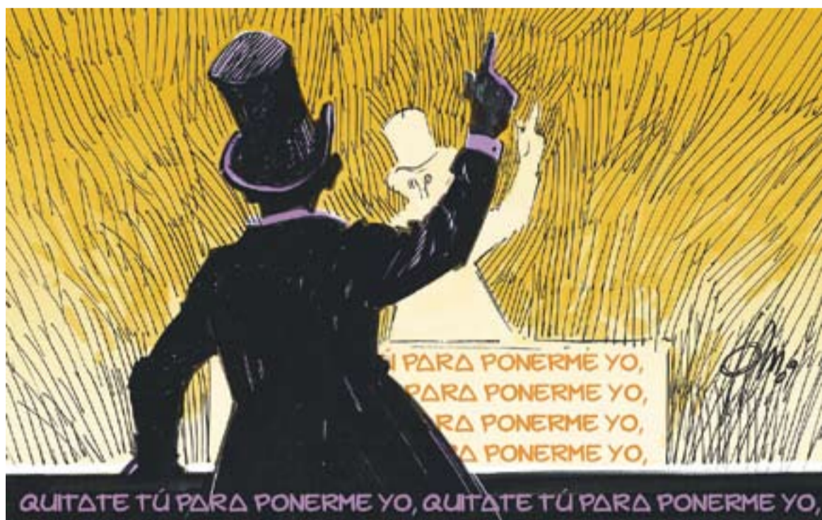
© Quitate tú... || JOAN MUNDET

Penso que els que segueixen aquesta pauta de funcionament se'ls ha de fer bastant desagradable i és una falta de respecte molt greu envers la nostra societat. Aquesta societat ha demostrat ser prou madura quan en temps de crisi sabem reorganitzar-nos adaptant la despesa familiar, quan per una sequera perllongada sabem reduir el consum d'aigua de manera adequada, quan en ocasió d'un fet extraordinari sabem manifestar la nostra posició i fem accions participatives, fem dona-