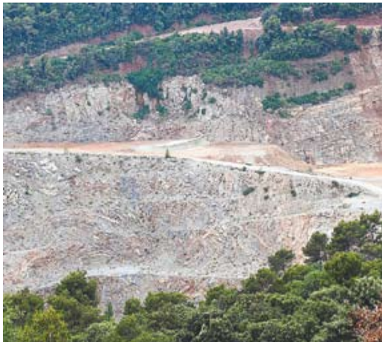
© La pedrera de Vallsallent. || JOSEP GRAELLS

Respecte la negativa de CiU de negociar cap proposta de resolució amb el govern, Giménez considera que "és una actitud que no aporta res" i que "lamentem profundament". +