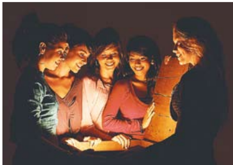
Escena del grup Macedònia, inclosa al disc "Et toca a tu".

Macedònia alterna els concerts amb l'enregistrament del seu proper disc, M'agrada , que sortirà publicat el proper mes de febrer del 2010. +