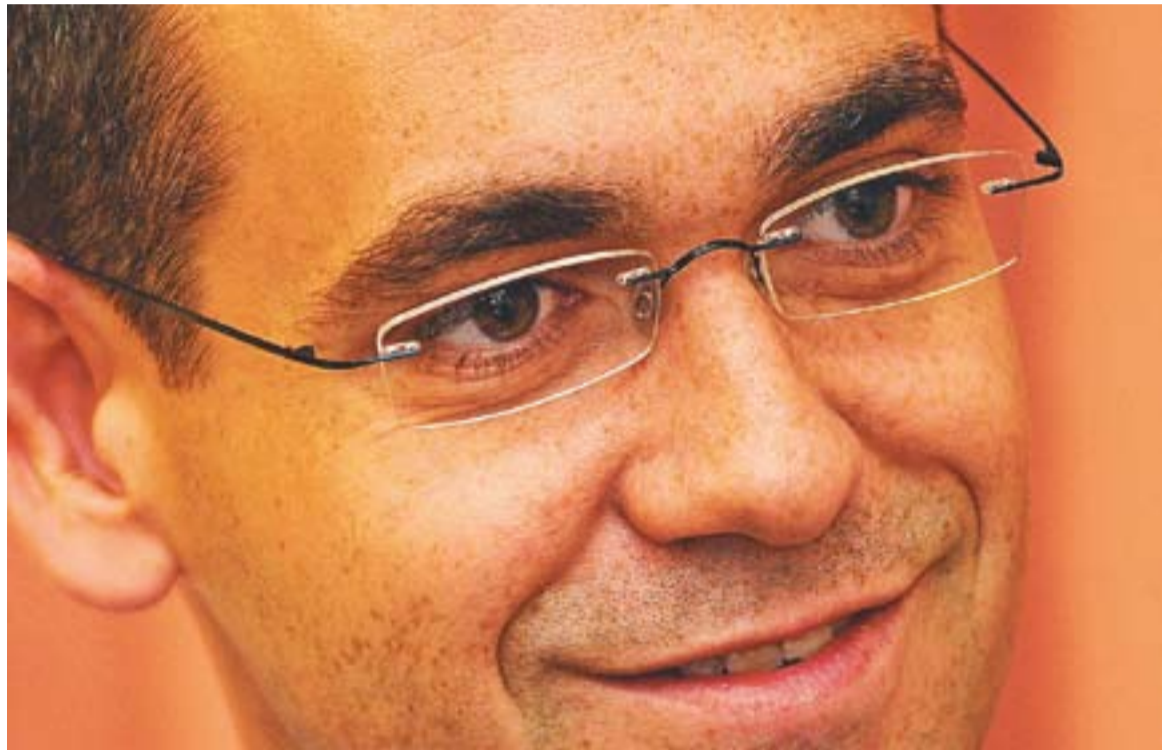
© L'alcalde fotografiat al seu despatx dijous de la setmana passada. || JOSEP GRAELLS