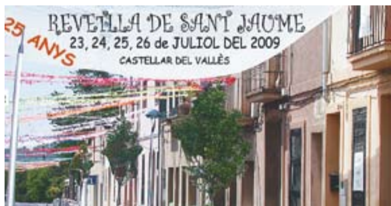
© Cartell de la revetlla de Sant Jaume 2009. || ARXIU