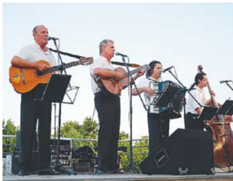
Els Pescadors de l'Escala durant una actuació en directe.