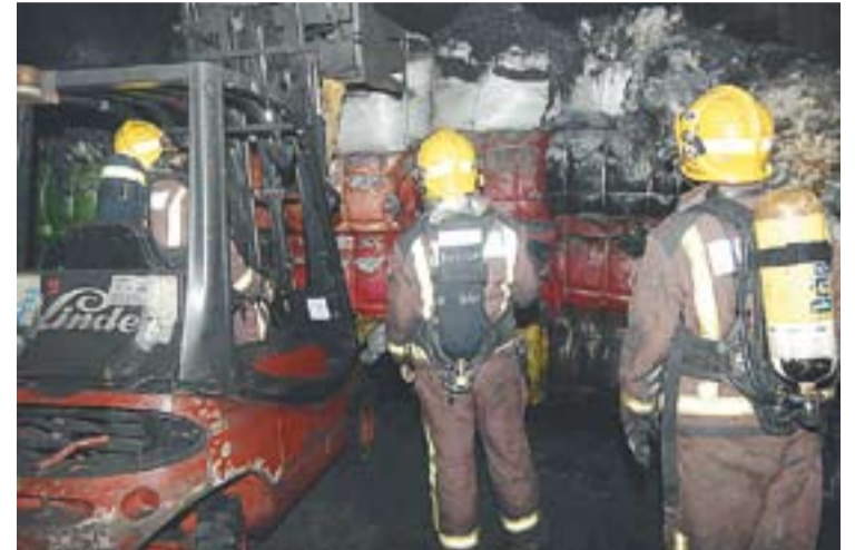
Els bombers actuant dins de l'empresa Punzonados Sabadell.