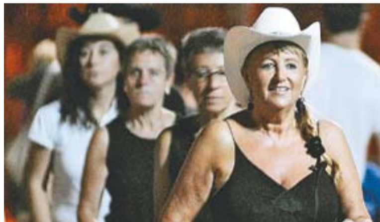
Moment de la Festa Contry a la plaça de la Fàbrica Nova.

El temps i el fet que la majoria de monitors i monitores hagin tret el country al carrer i facin llista de balls per facilitar la memòria dels participants a la trobada, ha fet que tothom apliqui el nom de Marató a aquest tipus de concentracions lúdiques, on la dansa i el vestuari són els indis- cutibles protagonistes. +