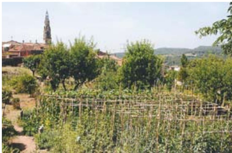
Estat actual dels horts de Cal Botafoc.

En aquests moments, hi ha dues persones que s’encarreguen del reg i d’omplir la bassa amb l’aigua de Canyelles, controlen el programador i miren el consum diari d’aigua. Un altre grup s’encarrega de rebre a les escoles que volen visitar els horts: “Els expliquem l’agricultura que fem i els deixem fer servir les eines i els agrada molt!”, comenta Almar. “Sóc de la comissió però l’èxit és fruit dels hortolans que hi han