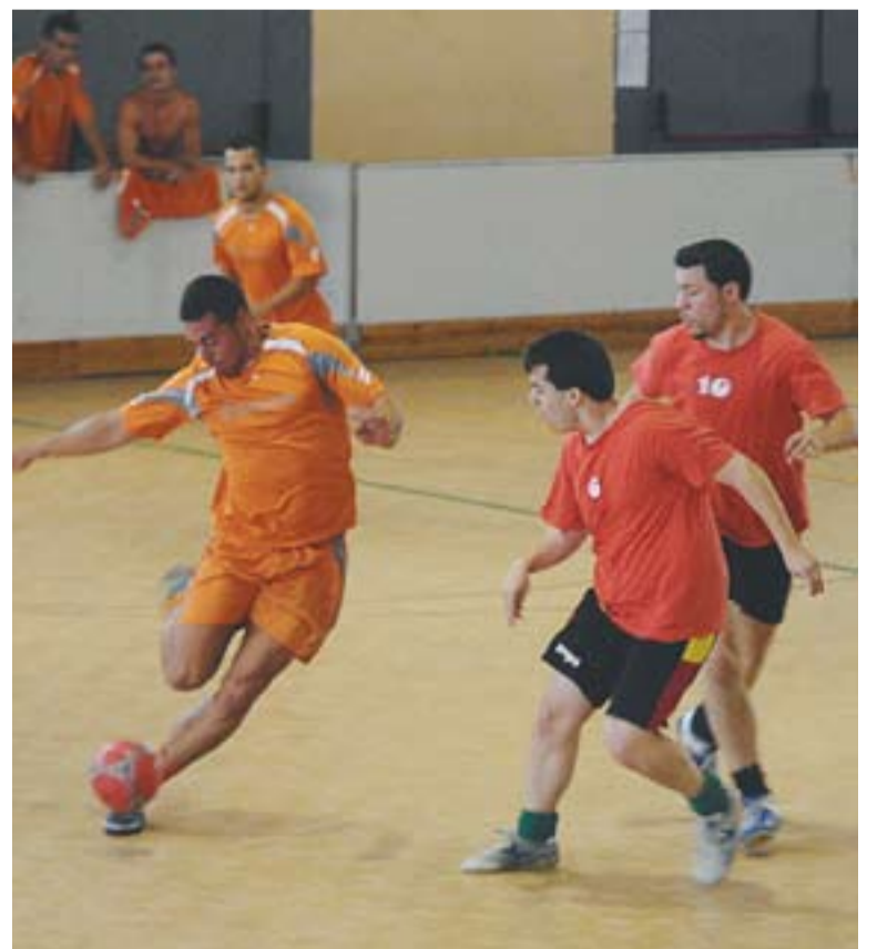
⊙ Una imatge de les 16 hores disputades dissabte passat.

El quadre d'honor el van completar Los Cariñosos, que va acabar tercer, i l'equip del Femacar, que va donar la sorpresa del torneig en eliminar al Granados Pladur, campió de l'any passat. +