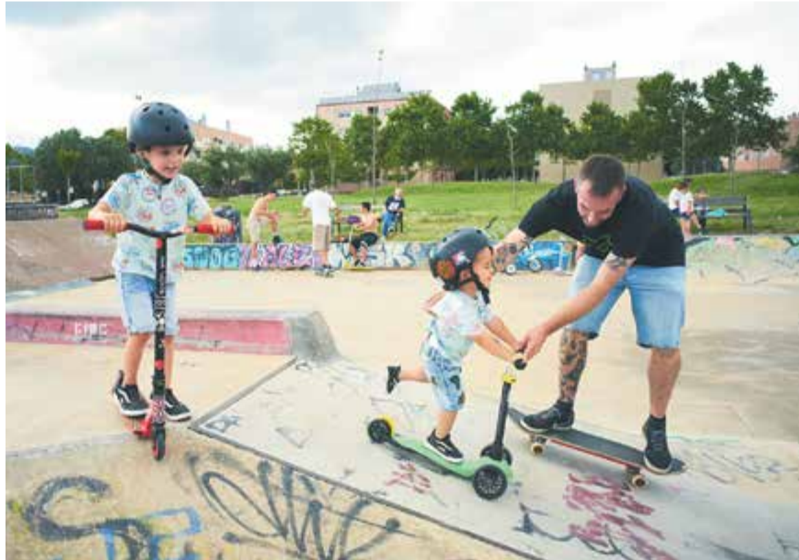
Un pare juga amb els seus dos nens amb patinets a l'skate parc', un dels espais que van reobrir divendres passat.