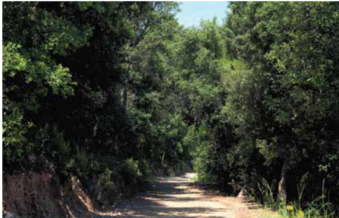
La pluja d'aquesta primavera ha contribuït a tenir uns boscos més verds i espessos que en anys anteriors.

Si bé l'any passat els termòmetres van marcar la temperatura màxima de 24,5° durant el mes de febrer, enguany aquest mes torna a estar dominat per la calor. "És el febrer més càlid dels últims 29 anys. La temperatura ha estat de més de 3° per sobre de la mitjana. Ha fet més fred al març que no pas al fe-