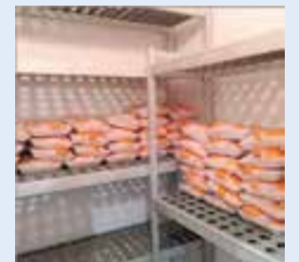
Pollastres donats pel Mercat.

Dilluns el Mercat Municipal de Castellar va començar una campanya de recollida d'aliments que es destinaran a les 218 famílies que atén Càritas a Castellar. La campanya s'allargarà fins al 31 de juliol. Al recinte de l'equipament hi haurà una caixa solidària on es podrà dipositar farina, sucre, pots de lleties cuites, cacau en pols, bolquers per a nadons (talles 1, 4 i 5) i llet sencera (en paquets de 6 brics). Paral·lelament, l'Associació de Paradistes col·laborarà amb la campanya oferint productes frescos a Càritas. De fet, la primera donació van ser uns 50 pollastres que Càritas necessitava per acabar el mes. Càritas també recull aquests productes les 24 hores a la rectoria i de dimarts a divendres de 15 a 17 h a la seva botiga, al carrer Portugal. + || REDACCIÓ