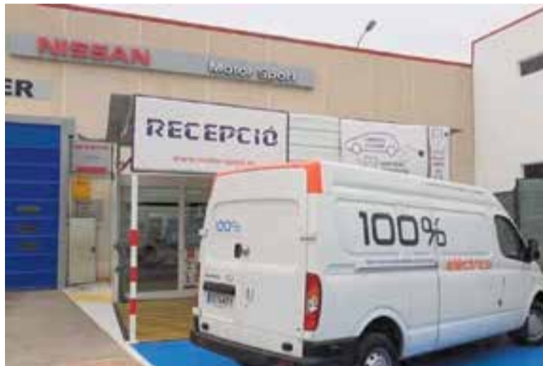
Un vehicle comercial de Motor Sport a l'entrada de les instal·lacions. || MOTOR-SPORT

El gerent de la xarxa Sarsa Volkswagen –que inclou el concessi-