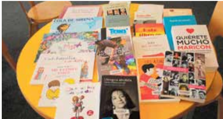
Alguns dels llibres LGTBI del fons de la Biblioteca Municipal Antoni Tort. || M. A.

Encara per posar en valor el Dia LGTBI, dimarts 30 de juny s'ha programat un segon acte, en aquest cas, per a adults. Tindrà lloc a les