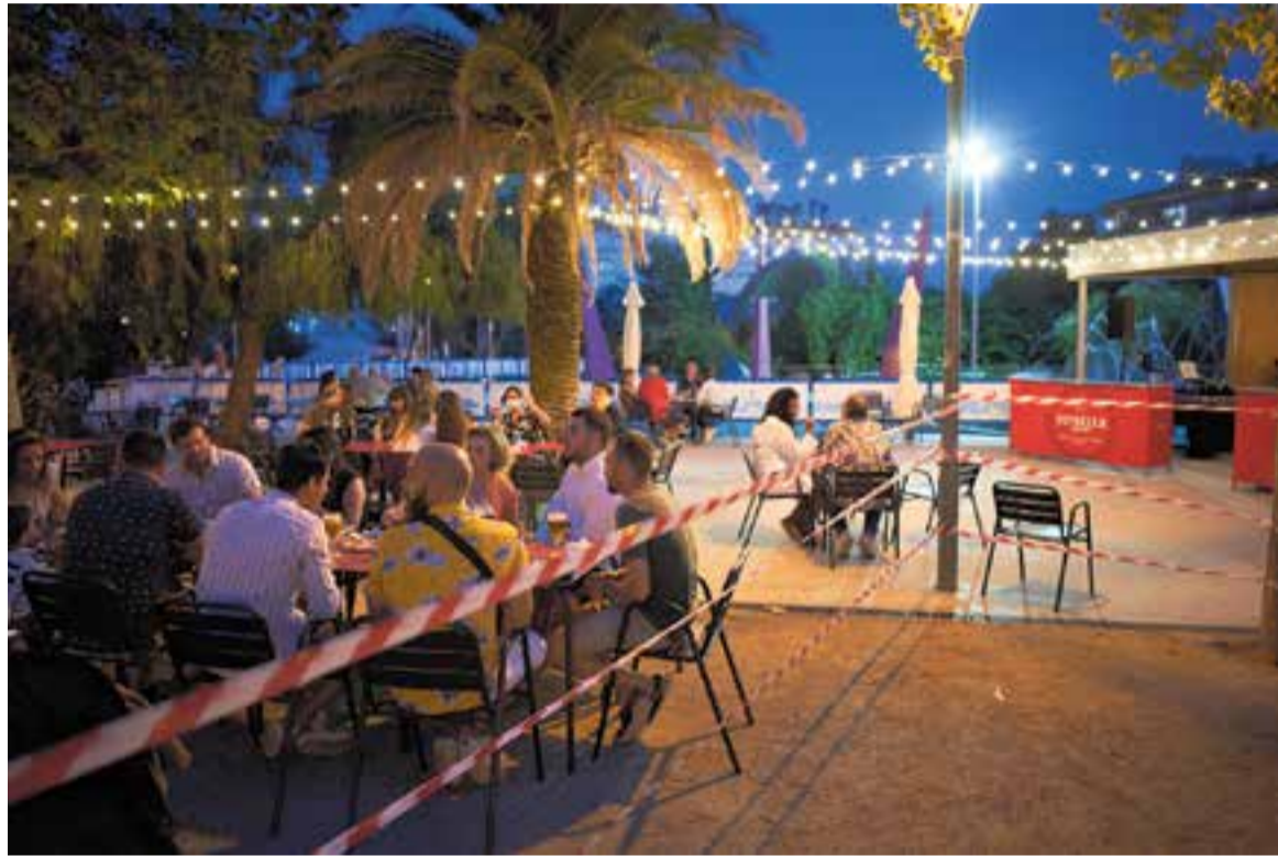
Alguns castellarencs van celebrar la revetlla sopant a les terrasses de la vila, com aquesta del bar de La Balena.