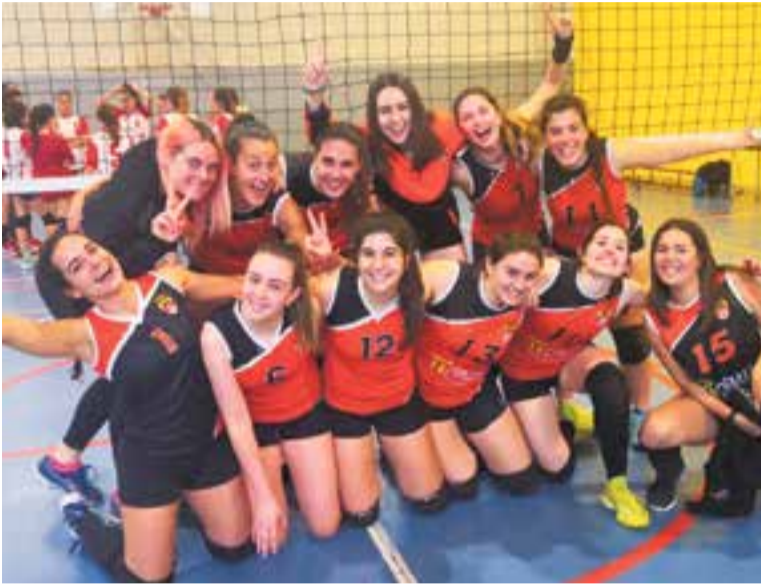
Les noies del sènior A femení van aconseguir l'ascens a Tercera Catalana.

Aquesta temporada el sènior A femení jugarà a Tercera Catalana i l'infantil ho farà a Primera