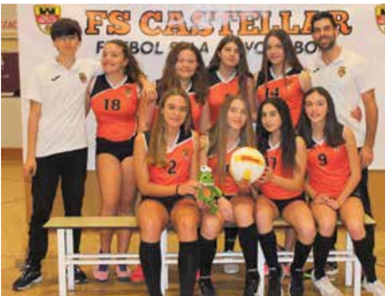
L'infantil jugarà a Primera Catalana de la categoria.