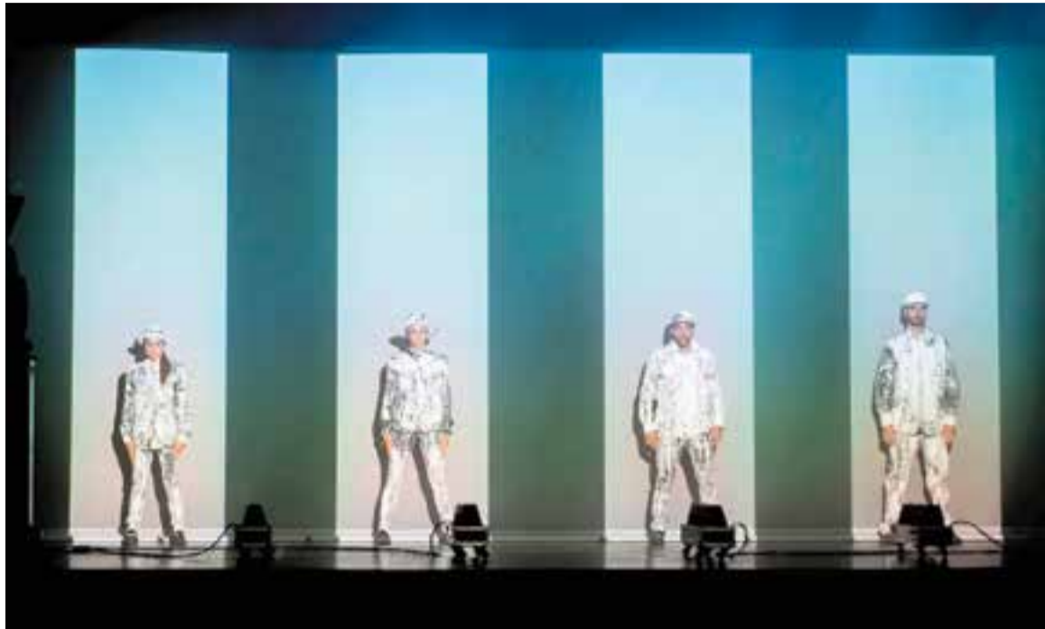
Un dels moments de l'espectacle 'Around the World' dels Brodas Bros, que reobrirà l'Auditori el dia 3. || IMAGEN BARCELONA

La temporada municipal de teatre i música de l'Auditori arrencarà el dissabte 3 d'octubre, a les 20.30 h, amb l'espectacle de dansa Around the World , una proposta dels Brodas Bros que combina dansa, llum, tecnologia i música. L'endemà, diumenge 4 d'octubre, tindrà lloc Hippos , a càrrec de Zum-Zum Teatre, un espectacle de carrer per a un públic familiar. En aquest cas, la proposta, que començarà a les 12 h i serà gratuïta, tot i que cal fer reserva d'entrada prèviament.