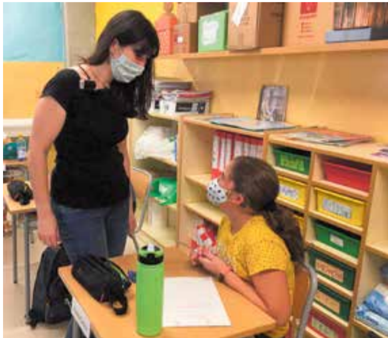
Una estudiant de primària de l'escola Joan Blanquer, amb audifòn, segueix la classe gràcies a un micròfon enllaçat que duu la seva tutora a classe.

Des del Departament d'Educació s'han compromès públicament a fer arribar mascaretes transparents