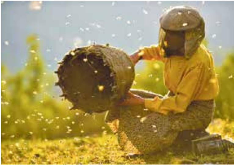
'Honeyland' és el DocsBarcelona del mes de setembre a Castellar.

La pel·lícula documental programada aquest divendres és 'Honeyland'