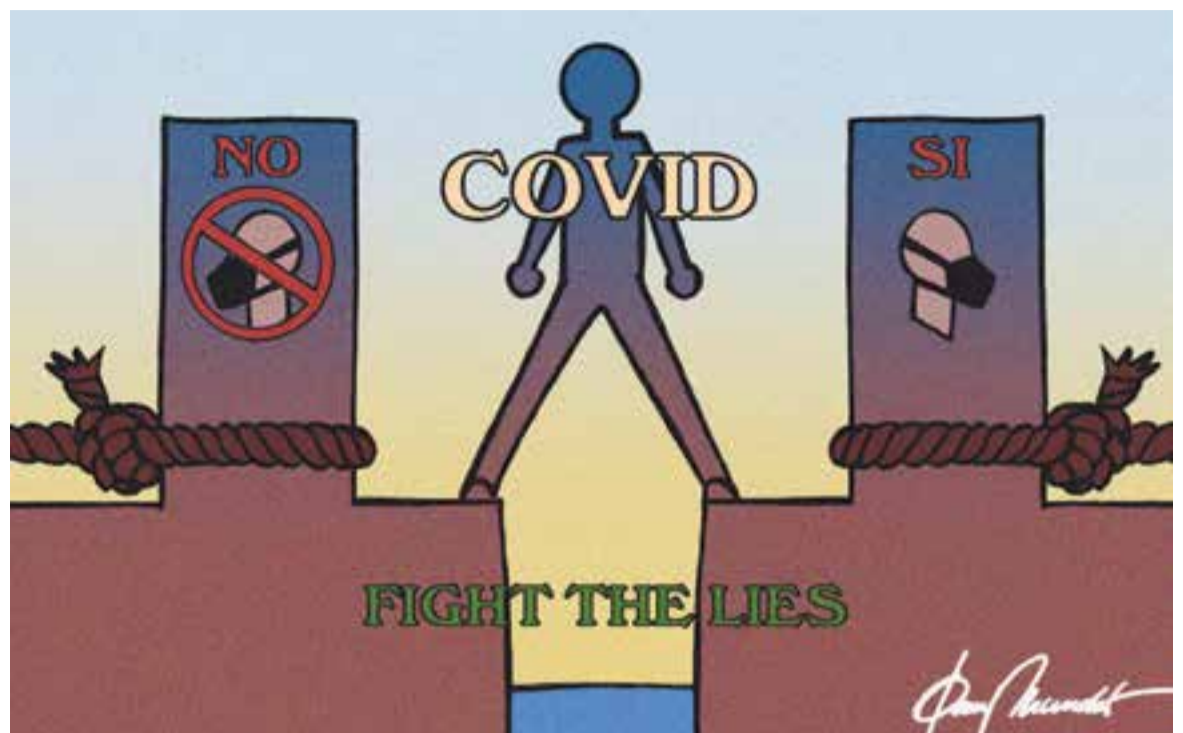
© Lluita contra les mentides. || JOAN MUNDET

regions amb més contagis. De fet, els Estats Units segueix sent el país amb més casos diagnosticats de Covid-19 del món. Dit això, durant el virus de la grip espanyola de l'any 1918 també va existir un moviment negacionista semblant al d'avui dia, segons explica l'historiador Jesús Hernández. Tornem a l'ordre del dia del coronavirus. Tot i que molts països han superat el primer confinament massiu (alguns encara estan en aquesta fase, com ara l'Índia), la gran majoria pateixen per un possible segon rebrot que obligui a un segon confinament que acabi d'ensorrar les economies de les regions. El ministre de Sanitat espanyol, Salvador Illa, va asse-