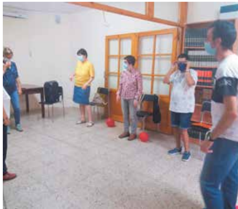
Assaig de la Coral Pas a Pas a la rectoria, aquest mes de setembre. || CORAL PAS A PAS