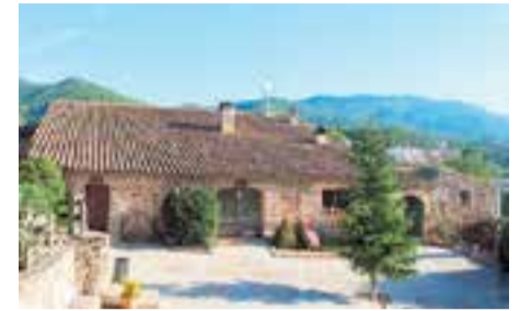
L'Espai de Can Juliana acollirà la cursa.

En ple auge de les curses atlètiques, un nou concepte de competició arriba a Castellar: la cursa d'obstacles. La Noob Race omplirà les instal·lacions de Can Juliana el pròxim 4 d'octubre, en una jornada que promet ser èpica i adaptada a no iniciats. Amb una visió una mica allunyada de la competició atlètica pura com l'entnem, la Noob es pot considerar més un híbrid entre un entrenament militar i les competicions arribades d'Orient de principis dels anys noranta. Curses d'aquest tipus són freqüents a tota la geografia catalana, però els organitzadors d'aquesta han volgut obrir el ventall per aconseguir una participació popular, en què el nivell estigui a l'abast de tothom. És per això que l'espai de Can Juliana es transformarà en un circuit d'uns quatre quilòmetres de llargada on els participants podran trobar