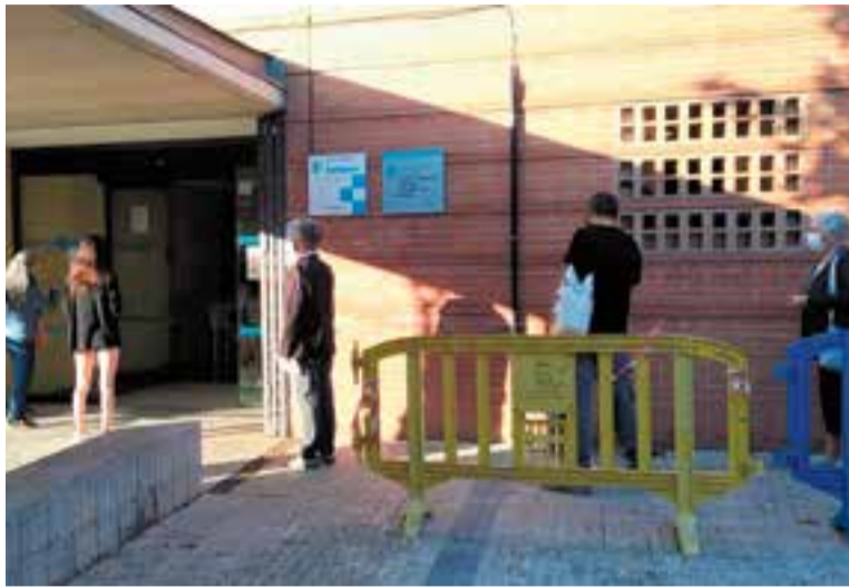
Diverses persones fan cua per accedir al CAP de Castellar, aquest dimecres.

Això pot explicar les dificultats que en alguns moments poden trobar-se ciutadans que volen ser atesos al moment via telefònica. Segons expliquen des del CAP, els nous canvis en el funcionament dels centres d'atenció primària "s'han produït de manera molt brusca, i això ha fet que