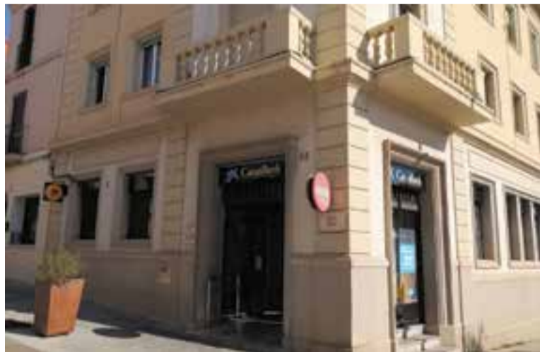
L'oficina de CaixaBank del carrer Major ja és operativa des de la setmana passada. || J. R.

La Covid-19 ha produït incidències en el servei d'atenció a clients a les dues oficines de CaixaBank a Castellar del Vallès. Dimecres