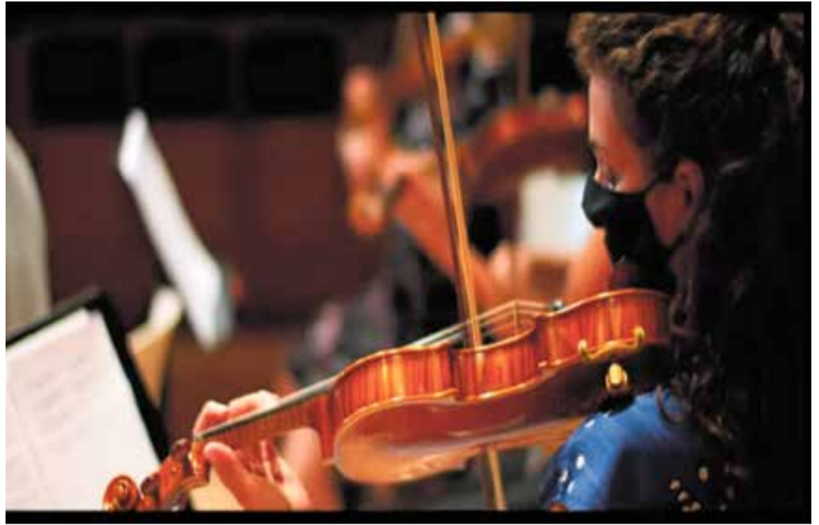
L'orquestra de Cambra de Terrassa 48 va actuar amb mascareta

El Projecte Beethoven: any 2020 , de l'Orquestra de Cambra Terrassa 48, celebra els 250 anys de la mort del compositor, director, pianista de Bonn. Ha coincidit, malauradament, amb la pandèmia, que no permet desplegar tanta gent a dalt d'un escenari. La formació s'hi ha