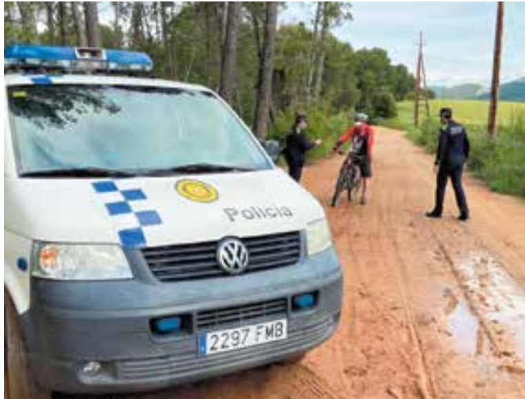
Control policial a l'entorn de Castellar durant la primera onada de la pandèmia.

Com tallar la transmissió comunitària del coronavirus en aquesta segona onada? Aquesta és la gran qüestió a la qual s'hi enfronten des de fa dues setmanes les autoritats polítiques que han vist com el virus s'extenia de forma exponencial. Després de tancar bars i restaurants, decretar l'estat d'alarma i imposar toc de queda entre les 22 i les 6 hores, aquest dijous la Generalitat també imposa els tancaments perimetrals municipals durant el cap de setmana. La mesura, de moment, tindrà una vigència de 15 dies i també ve acompanyada de noves i severes restriccions: en el moment del tancament d'aquesta edició, ha trascendit la suspensió durant els pròxims 15 dies de tota activitat cultural i esportiva, així com