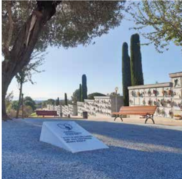
Una placa al cementiri recorda el nou espai i servei en record als nonats.

El cementiri ha posat en marxa un espai en record a les pèrdues gestacionals o perinatals. Aquest memorial permetrà que les famílies que pateixen aquest tipus de dol puguin comptar amb un punt físic de referència on retre homenatge a un fill