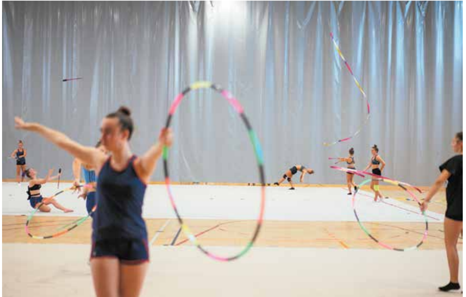
Diverses gimnastes del grup de les grans del Club Rítmica Clau de Sol en un entrenament al Pavelló Puigverd.

L'èxit va ser tal que el club va canviar les instal·lacions a les escoles pel pavelló Puigverd i l'Espai Tolrà, espais amb més capacitat i que han donat solució al problema d'aforament: "Necessitem moltes hores d'entrenament per poder competir amb garanties i estar al nivell d'un campionat d'Espanya. Un mínim de nou setmanals i aquesta ha estat una bona solució" , explica Ballesteros. És per aquest motiu que els entrenaments durant el confinament van ser només físics i de manteniment, ja que exercicis de rítmica –pilota, cinta, cercol, corda o maça– difícilment es poden practicar sense espai i sense les correccions d'un entrenador: "Tot i la pandèmia, hem pogut mantenir molts grups, encara que d'escola hem