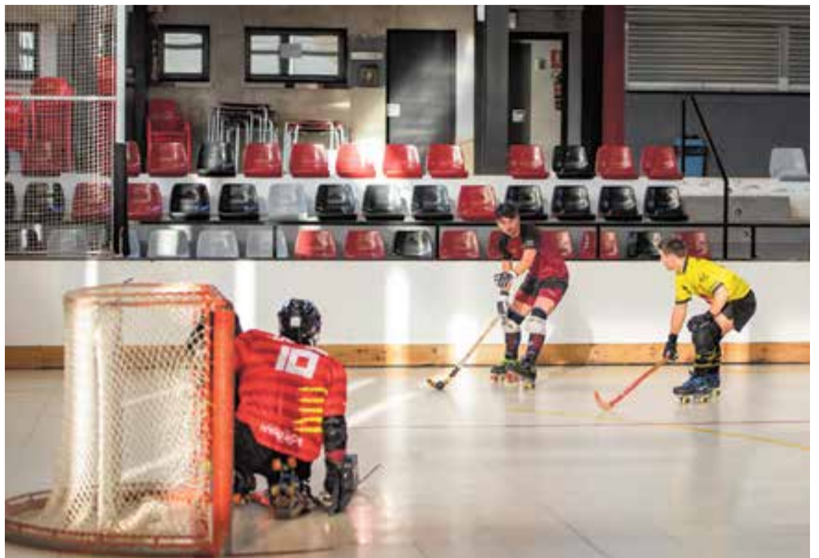
El pavelló Dani Pedrosa buit, en l'únic partit oficial disputat per l'HC Castellar aquesta temporada.

Esteva també va explicar les mesures que sol·licita el sector: “Exigim la tornada de la competició esportiva, que s'elevi l'aforament de les instal·lacions esportives del 50 al 70% i que es permeti allargar els entrenaments fins a les 22 h en el toc de queda”. Pel que fa a la fiscalitat, el president ha reclamat un “IVA superreduït del 4% sobre els ser-