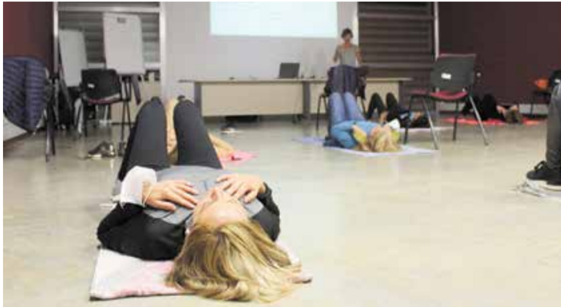
El taller, en què van participar 10 persones, es va fer seguint les mesures de seguretat de la Covid-19. || E. VENTURA

A la sessió, l'experta va explicar, en una primera part teòrica, per què ens estressem, què passa en el nostre cos quan passa i com podem reduir l'estrès. A la part pràctica, els assistents van conèixer quatre tècniques senzilles per aprendre a minimitzar l'estrès. “La situació actual fa que sigui més necessari que mai disposar de tècniques senzilles i eficaces que puguem utilitzar en qualsevol moment de forma autònoma individual. En aquest taller n'he explicat quatre, amb evidència clínica provada. Són molt efectives i molt fàcils d'aprendre, l'únic que s'ha de fer és practicar-les. A més, aquestes tècniques les poden practicar tots els membres de la família. Per als nens