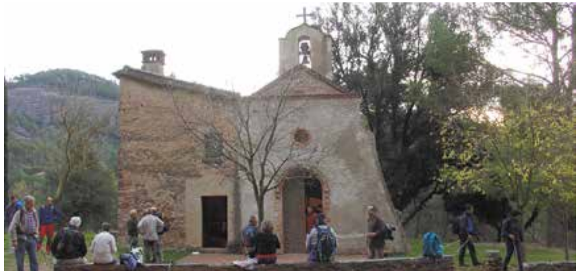
Uh grup d'excursionistes fan parada davant de l'Ermita de la Mare de Deu de les Arenes.

La Mare de Déu de les Arenes està inclosa en l'Inventari del Patrimoni Arquitectònic de Catalunya. És un edifici romànic d'una sola nau amb absis semicircular sense decoració externa, amb grans contraforts a la façana de migdia, on es troba l'antic accés del temple, una porta amb arc de mig punt actualment tapiada. Adossada a la paret nord hi ha la casa dels ermitans, de construcció molt posterior i amb coberta d'una inclinació. L'actual façana està arrebossada i el campanar és d'espaldanya. + || M. A.