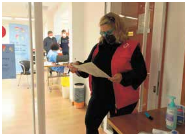
La Creu Roja està col·laborant en la campanya de vacunació de la grip. || C. D.

Des de l'organització asseguren que tothom és benvingut i recorden que es pot fer voluntariat des dels 16 anys. En aquests moments, a Castellar s'estan realitzant projectes amb infants, amb adolescents d'instituts, també es fan trucades d'acompanyament a gent gran i es continua amb el banc d'aliments, cada vegada amb més usuaris. Els voluntaris també fan promoció de la salut als carrers. En aquests moments, a més, estan col·laborant amb la campanya de vacunació. Tothom que hi vulgui col·laborar es pot adreçar a la seu de l'entitat, a la plaça de la Llibertat. + || C. D.