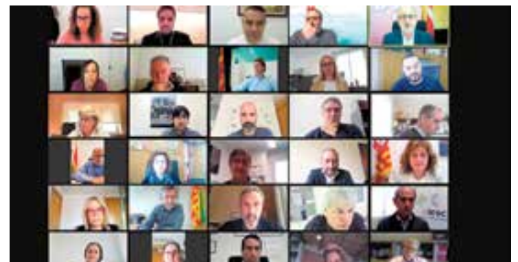
Reunió del Consell Plenari de l'Àmbit B30. || L'ACTUAL