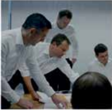
CCCV, L'Aula i Cal Gorina