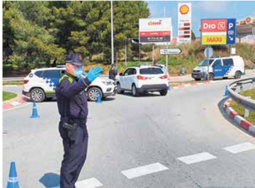
Imatge d'un control de la policia local en una rotonda de la B-124.