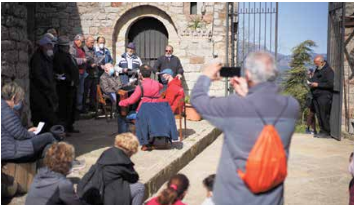
El Cor de Cavallers interpretant el Cant de la Passió davant de la façana principal de l'ermita.

150 persones van pujar al recinte per a celebrar la Trobada de Primavera