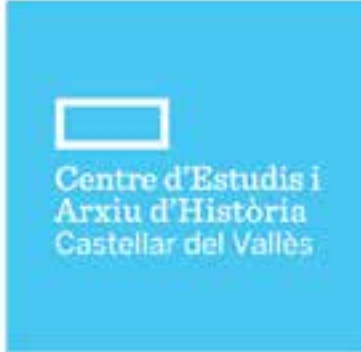
Centre d'Estudis de Castellar

+ INFO: www.castellarvalles.cat , www.clubcinemacastellar.cat , www.auditoricastellar.cat