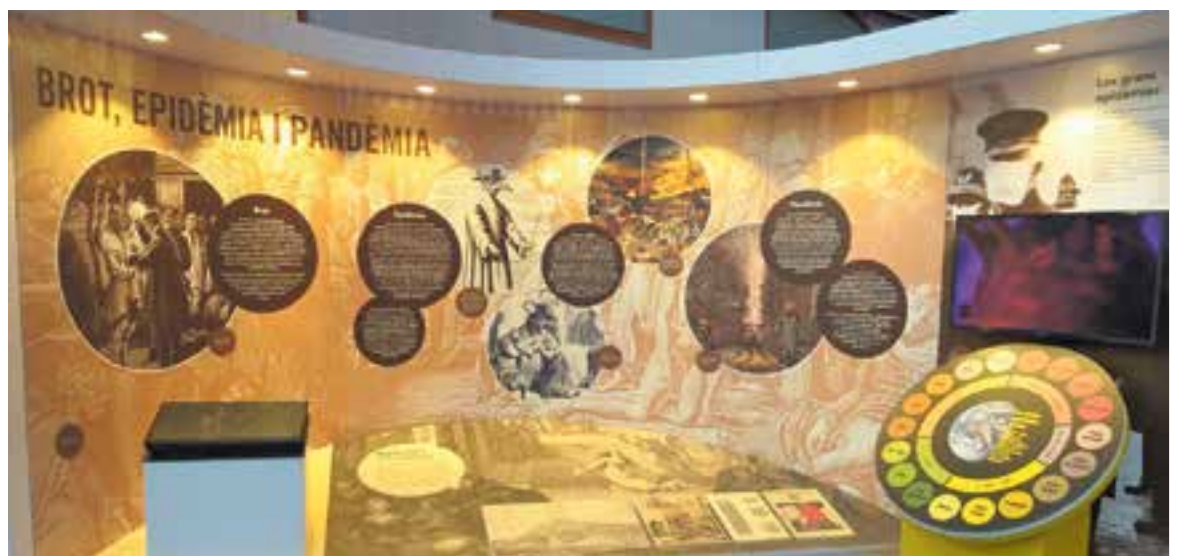
Un dels plafons de l'exposició 'Epidèmies i pandèmies. L'enemic invisible' que s'exposa al MNACTEC

Concretament, la mostra, que romandrà al museu fins a finals d'any, s'estructura en set espais: Un món ple de vida; Malaltia versus salut; Brot, epidèmia i pandèmia; Malalties, metges i vacunes; La salut pública; La globalització i la gran pandèmia del segle XXI; i En els límits de la vida . La voluntat del museu és explorar des d'una manera multidisciplinària l'origen i l'impacte d'aquests episodis, que com