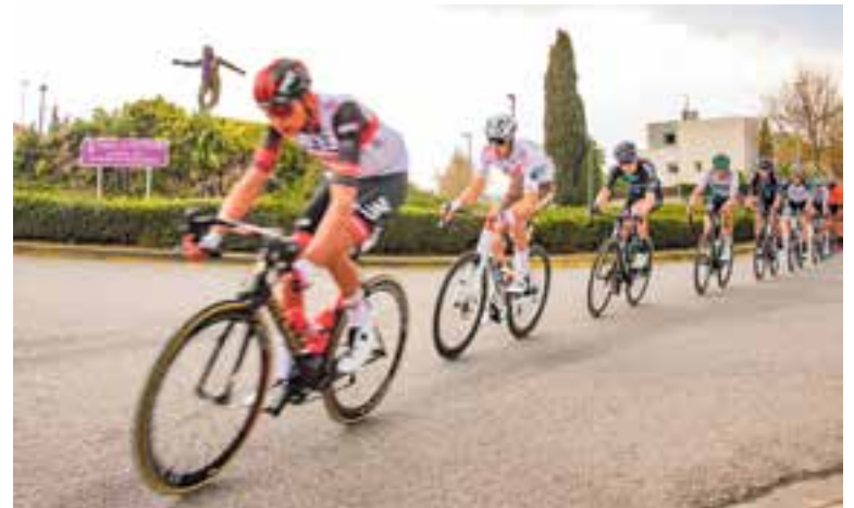
La Dona Acollidora va veure el pas de l'edició 100 de la Volta.

Sentmenat i van enfilear en direcció al poble veí, des d'on anirien a Polinyà per agafar la direcció del Circuit de Barcelona Catalunya i posteriorment finalitzar a la capital del Maresme. Peter Sagan (Bora-Hansgrohe) va ser el guanyador d'una etapa que es va decidir a l'esprint, en què l'eslovac va sumar la victòria número 115 de la seva carrera. Pel que fa a la general, va ser el britànic Adam Yates (Ineos-Grenadiers) qui va emportar-se el premi absolut, va aconseguir un històric triplet per a l'equip anglès, juntament amb l'australià Richie Porte i el seu compatriota Geraint Thomas. ✦