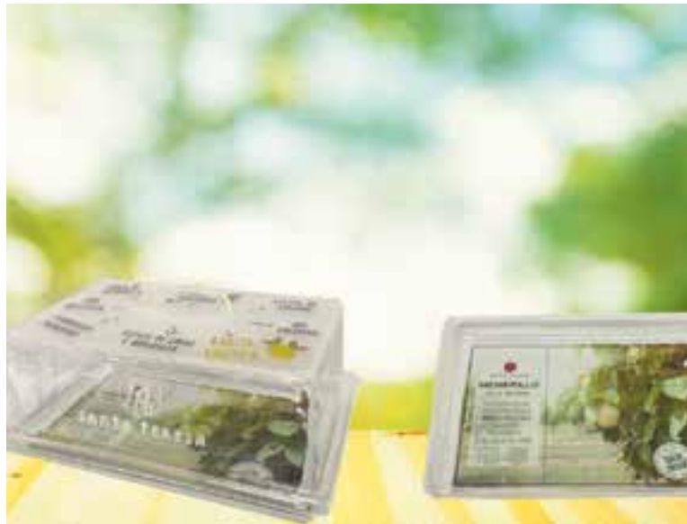
Els expositors que ha elaborat Disnou per a l'empresa Santa Teresa.

Una de les primeres feines ha estat la fabricació d'uns expositors per a l'empresa de codonyats Santa Teresa. Una vegada l'expositor ha esgotat la seva vida útil, el client pot retornar el metacrilat a Disnou “on tenim unes gàbies en què es poden dipositar els retalls, que es poden tornar a fondre