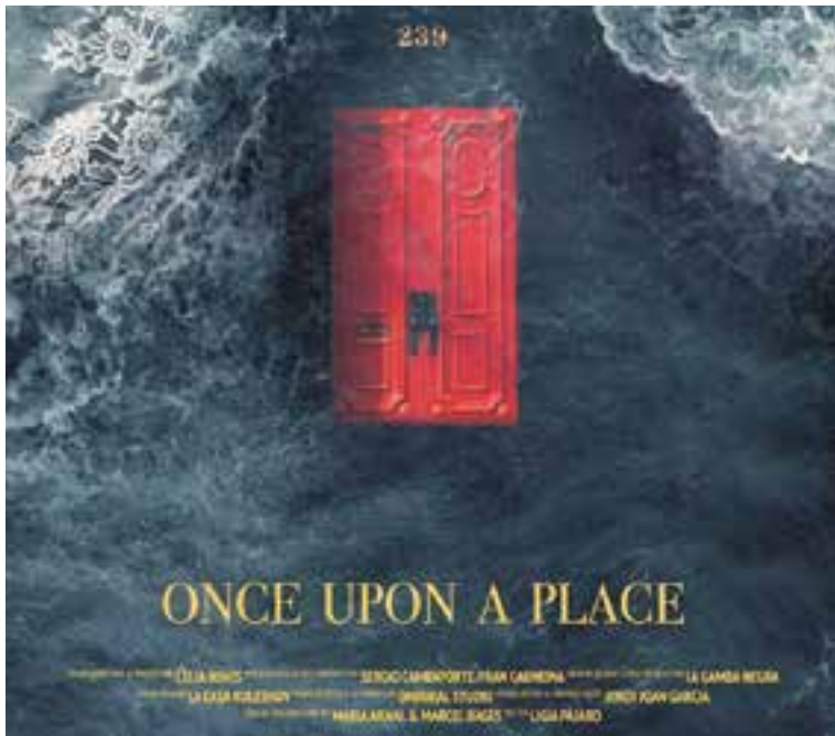
Detall del cartell promocional del documental 'Once upon a place'

Així, la castellarenca es va capbussar en tota la documentació disponible del local, i va entrevistar tant als actuals responsables com als descendents d'alguns dels socis que