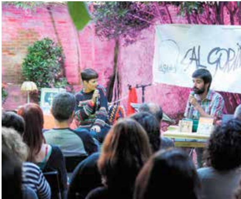
Cal Gorina va acollir diferents actes al llarg dels anys, com presentacions de llibres. || ARXIU

L'impacte de la pandèmia també s'ha fet notar en les activitats programades del col·lectiu. "Si no hagués estat pel coronavirus, hagués estat un any important