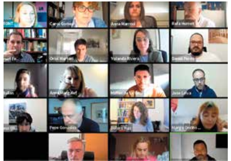
El ple es va fer de forma telemàtica, fet habitual des de ja fa un any. || YOUTUBE

Les primeres gestions derivades de l'ampliació de la despesa va ser promoure una nova convocatòria d'ajuts al lloguer (1.600 euros com a màxim) i l'inici dels tràmits per canviar al POUM l'ús del solar de l'antiga Playtex per aixecar-hi pisos de lloguer públic, que es podran fer a través d'un conveni amb l'Incasòl amb la compra prèvia del terreny. El tinent d'alcalde de Territori, Pepe González, va detallar que hi havia previstos 1,5 milions per a la compra, cosa que “permetrà abordar des d'una perspectiva estratègica el problema de l'habitatge a la vila i sense endeutar-nos” . Oriol Martori (ERC) va qualificar l'operació de la Playtex de “carambola” que havia permès finalment recollir l'oferiment de l'Incasòl de fer pisos a la vila. Castellví va abundar en aquesta mateixa direcció i va lloar la feina feta pel conseller Damià Calvet en matèria d'habitatge. En tot cas, tothom es va mostrar d'acord que aquesta operació dona la volta a la situació de manca d'oferta d'habitatge de lloguer a preus raonables al municipi, com va subratllar el regidor de Territori.