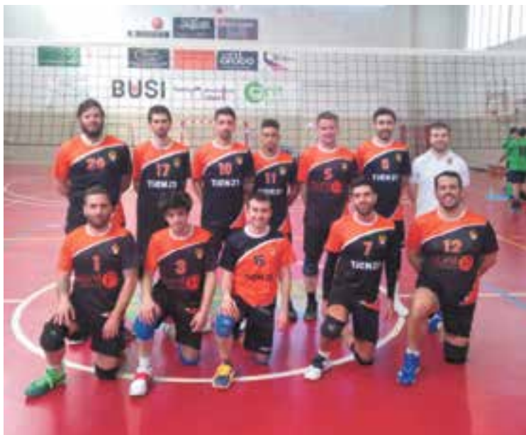
Els integrants del sènior masculí lluitaran per l'ascens de categoria.