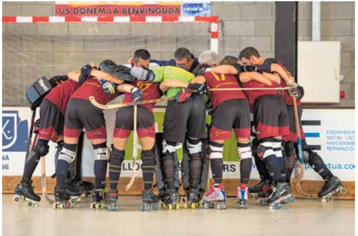
L'HC Castellar, obligat a seguir sent una pinya si vol aconseguir l'ascens de categoria. || A. SAN ANDRÉS

“Estem en bona posició, però hem de seguir sumant i treballant, ja que en una Lliga com aquesta no ens podem permetre fallar” , va opinar el tècnic, que no ha donat festa als seus homes aquesta Setmana Santa per poder preparar el pròxim partit contra el cuer, el Manresa, en una pista gran i de parquet on l'equip no està acostumat a jugar.