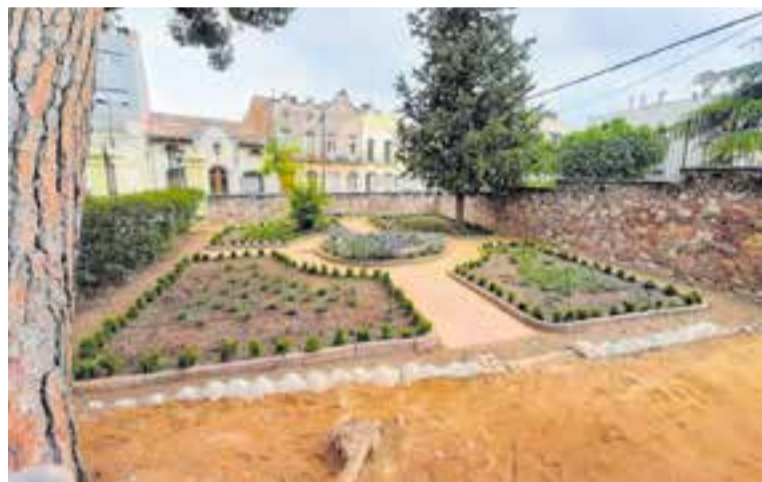
A dalt, la plaça Canigó reformada i, a baix, el nou enjardinament de Torre Balada.