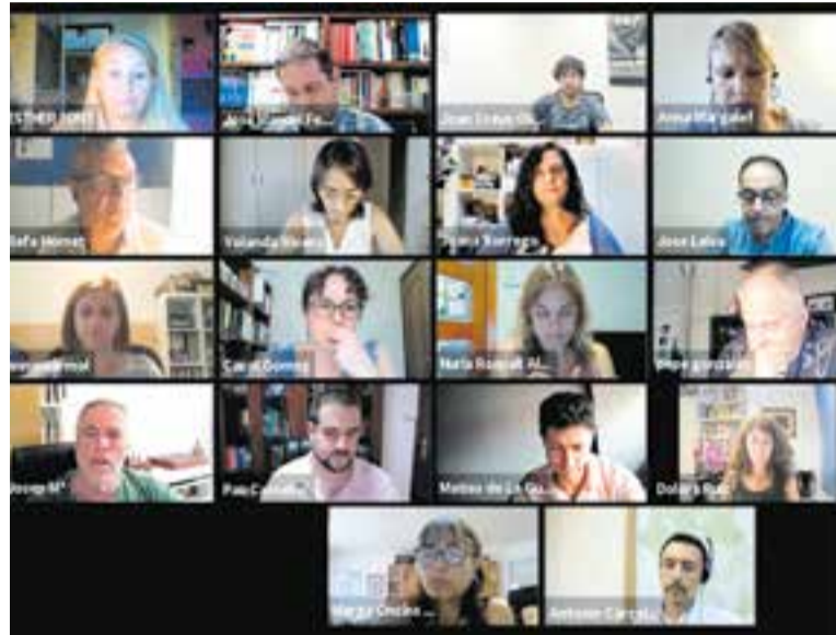
Moment del ple virtual de juny. Al juliol ja serà novament presencial.