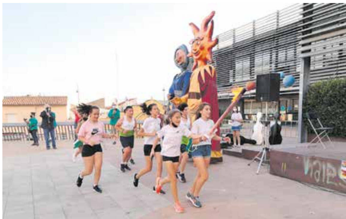
Corredores del CAC van fer arribar la flama fins a la plaça d'El Mirador en motiu de l'acte de la CAL Castellar.

Els Gegants també van oferir una ballada en motiu de la Flama del Canigó, així com el Ball de Gitanes de Castellar, "que actuaven