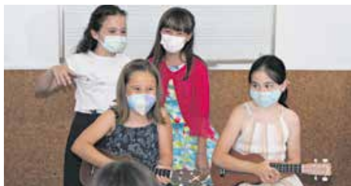
Alumnes d'Espaiart durant l'audició d'instrument.

A les portes de l'estiu, l'escola de música, dansa i interpretació Espaiart ha dut a terme unes audicions d'instruments en el sí de la mateixa escola, fent-les a les pròpies aules. Sota el paraigua "L'hem cuidat i ha florit", s'han inclòs les propostes musicals que han tingut lloc el darrer cap de setmana de curs escolar, el 19 i 20 de juny. Davant la situació de la pandèmia, Espaiart va optar per aquest format d'audicions, més íntimes i personalitzades, que es van anar succeint dins de les aules. Es van poder escoltar audicions de piano, guitarra, ukelele, violí, violoncel, trompeta, flauta travessera i bateria. + || M. A