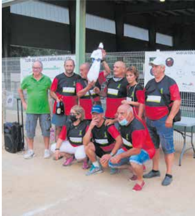
Els integrants del CB Colobrers que van viatjar a Tordera.