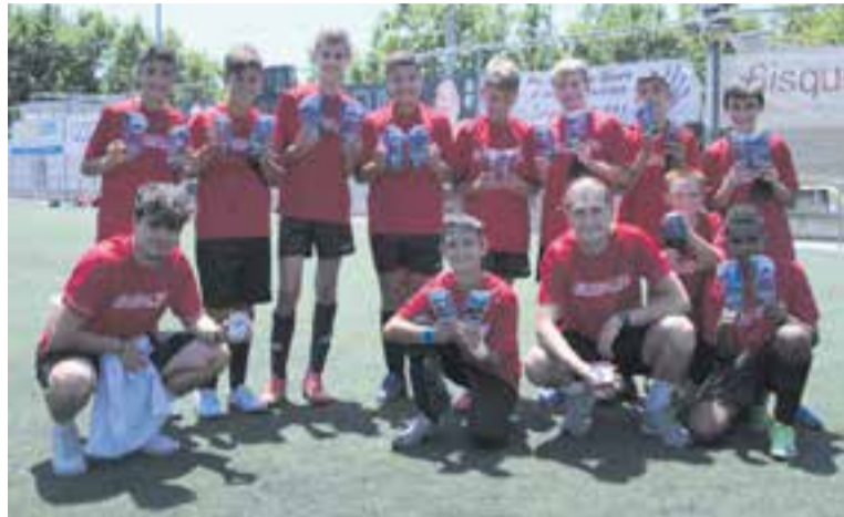
L'aleví B de la UE Castellar, després de ser campions a Sant Cugat.