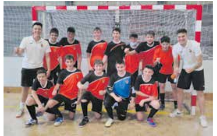
L'infantil A de l'FS Castellar ha aconseguit ascendir de categoria.

L'Infantil A de l'FS Castellar ha aconseguit l'ascens de categoria després de superar en l'última jornada de Lliga el CN Caldes per 7-3 i sumar els tres punts necessaris per col·locar-se en segona posició, en plaça d'ascens directe.