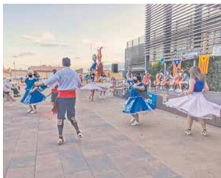
El Ball de Gitanes va tornar a ballar després d'un any i mig de no fer-ho.

Un cop finalitzats els balls, aprofitant la coincidència amb la sortida dels polítics i activistes independentistes de la presó, es va llegir una nota d'alegria per a la notícia de l'indult i es va recordar que el moviment continuarà al carrer. Per cloure les activitats, cinc violoncel·lats de l'escola Artcàdia van tocar "El cant dels segadors". L'entitat de la CAL de Castellar va voler agrair la participació, "tant de les entitats que van col·laborar amb l'esdeveniment com el públic que va assistir-hi" , deia Fusté. +