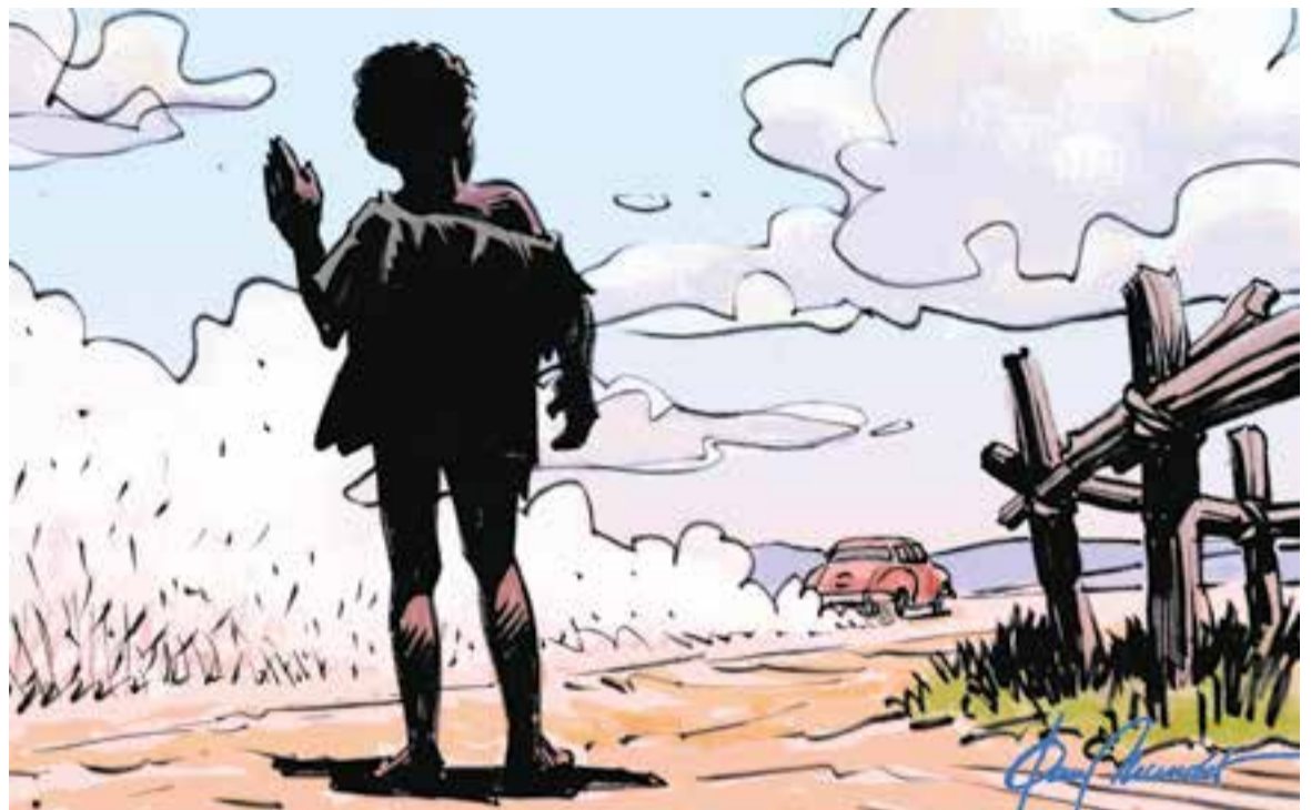
© Sense títol 56. || JOAN MUNDET

“Van creant maó a maó un clima concret que ens porta a un desenllaç inevitable”