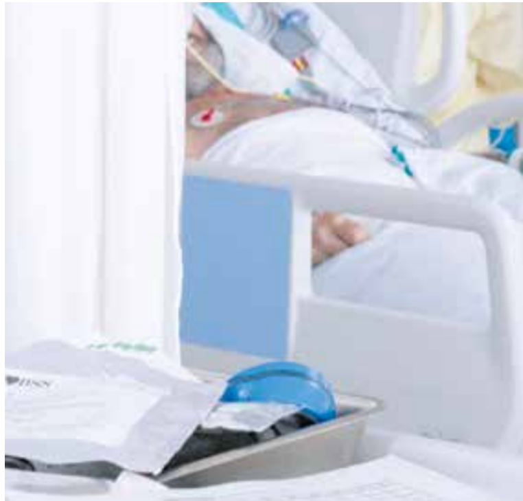
En aquests moments, la mitjana d'edat dels pacients Covid-19 a l'UCI és de 50 anys. || Taulí

torietat de la mascareta a l'aire lliure, sempre que no es produeixin aglomeracions, el director de l'hospital ho valora positivament. “Era el moment oportú, però cal fer una crida a la responsabilitat de la ciutadania. És necessari recuperar la vida normal” , reconeix. “És important que es continuï portant la mascareta en espais interiors, mantenir les distàncies de seguretat, però a poc a poc cal anar rebaixant les restriccions” , afegeix.