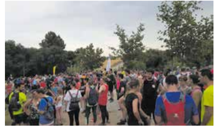
L'última edició del #Sotalalluna del CE Castellar va ser l'edició de 2019.

Les inscripcions poden fer-se fins al dia 1 de juliol en línia al web www.cecastellar.cat a un preu de 12 € adults i 8 € per als menors de 18 anys, amb els beneficis destinats a l'entitat castellanca Suma+. Amb la inscripció també es farà entrega d'una samarreta de l'acte a cada participant. + || REDACCIÓ