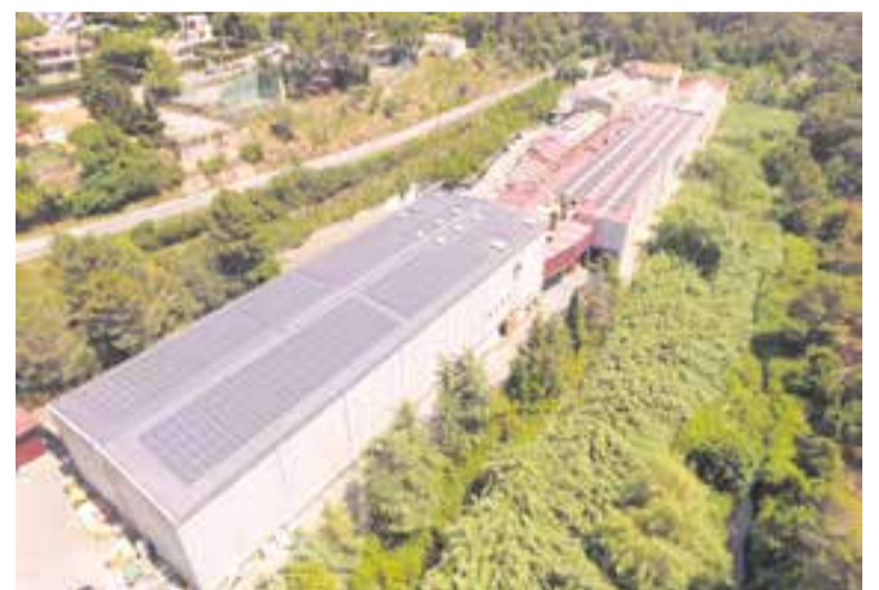
Grausa ha instal·lat 2.000 m 2 de panells fotovoltaïcs al sostre de dues naus.

Grausa, que va néixer el 1868, va comptar a les seves instal·lacions amb una petita central hidroelèctrica que aprofitava l'aigua del riu Ripoll. El 1994 va posar en marxa una de les primeres centrals de cogeneració d'alt rendiment, cosa que suposava que a través de gas natural