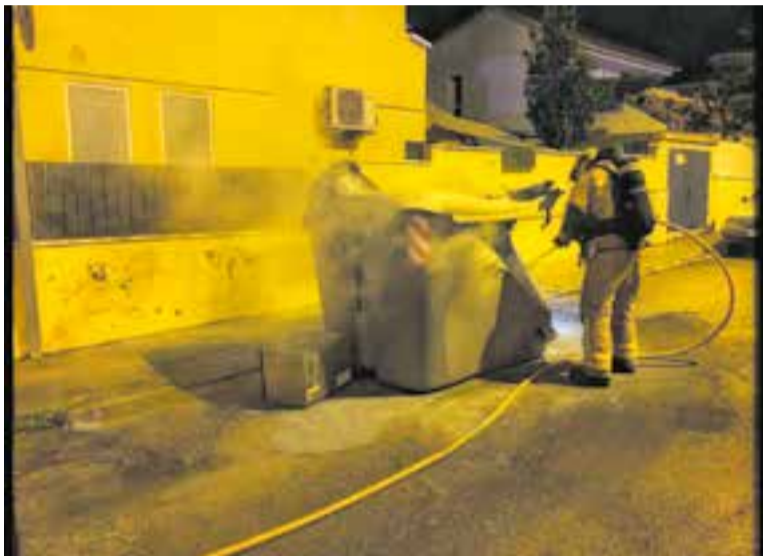
Un bomber apagant l'incendi d'un contenidor al carrer Agustina d'Aragó. || BOMBERS

També van fer sortides a Terrassa, Argentona, Palau-solità i Sabadell