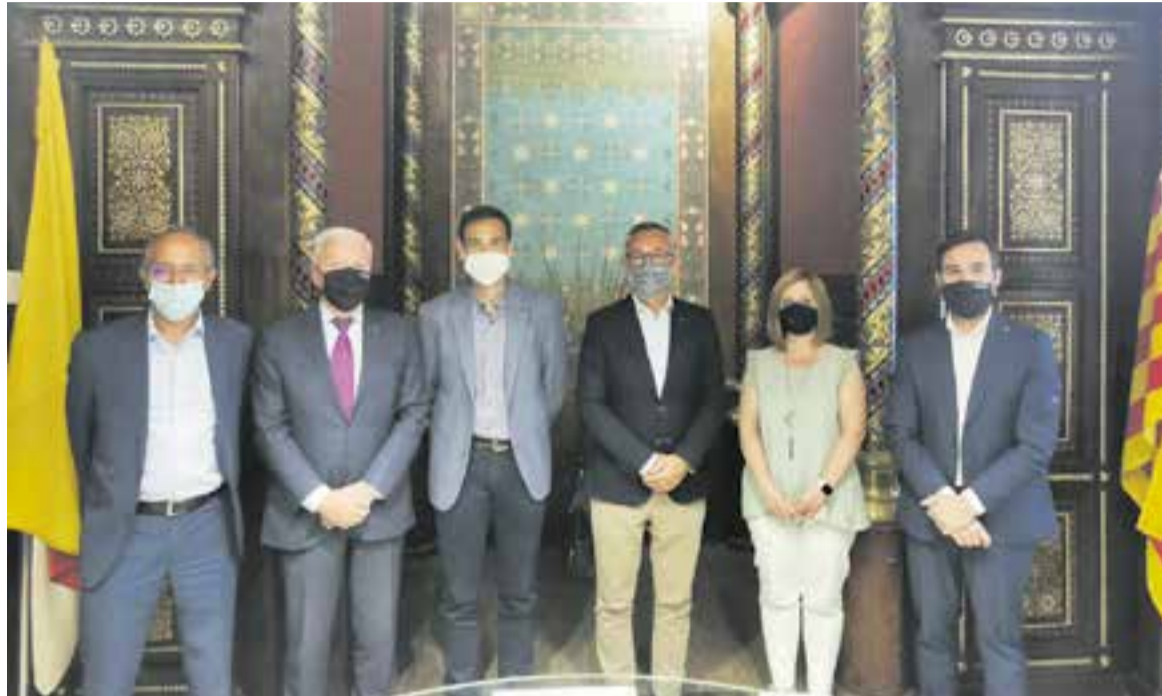
Membres del Centre Metal·lúrgic, Cecot i ASEMCA amb representants de l'Ajuntament després de la signatura.

ni Abad, va afirmar que des que es va començar a parlar el 2019 dels objectius de desenvolupament sostenible de les Nacions Unides "ha enganxat tothom, i de fet els 17 objectius de les Nacions Unides se'ns tornen més assequibles" . El president de la patronal vallesana va assegurar que "des dels polígons, l'altra continuïtat de la generació d'energia és la connexió i això vol dir que les xarxes amb 'software' funcionen molt bé" i que "l'experiència ens diu que en l'àmbit industrial s'arriba a un 30% del que genera l'empresa sobre