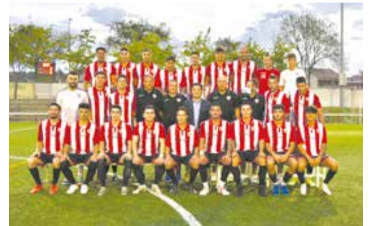
Plantilla de la UE Castellar per a la temporada 2021-2022.