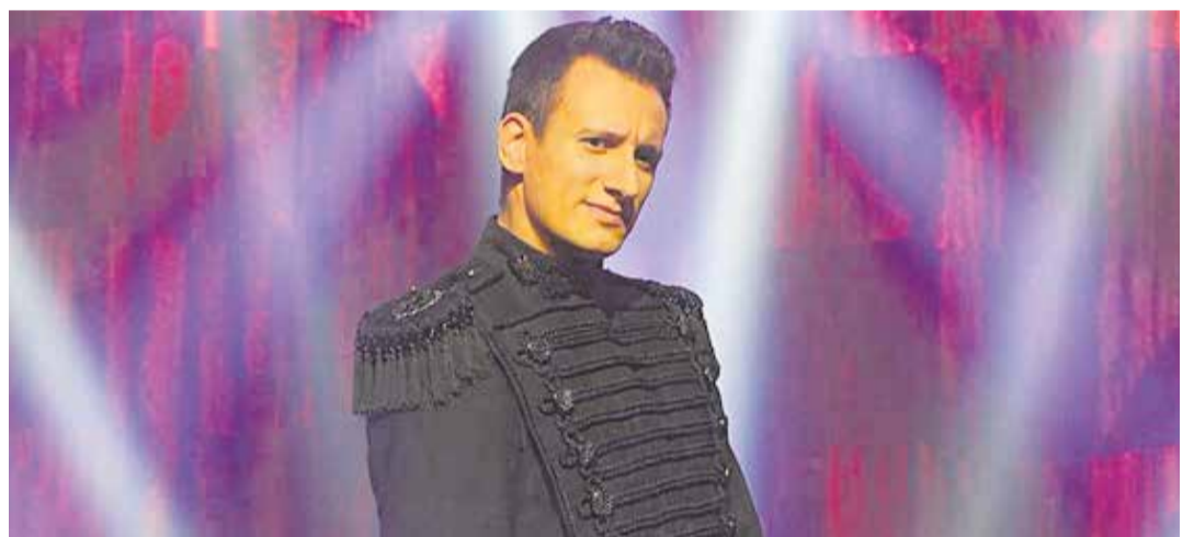
El Mag Lari obre la temporada d'espectacles, el dia 25 de setembre, amb 'Una nit amb el Mag Lari'.