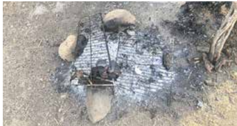
Els ADF van apagar la barbacoa. || POLICIA LOCAL

El 12 d'agost uns individus van pensar que era bona idea encendre un foc per fer una barbacoa a Castellar Vell, coincidint amb l'episodi de temperatures extremes que vivia Catalunya. A més, per extreure les precaucions, aquells dies havia entrat en vigor un seguit de restriccions per a 279 municipis, inclòs Castellar del Vallès. Una d'aquestes prohibicions era la de realitzar qualsevol barbacoa. De fet, les instal·lacions de Castellar Vell estaven clausurades des de dimecres 11 d'agost.