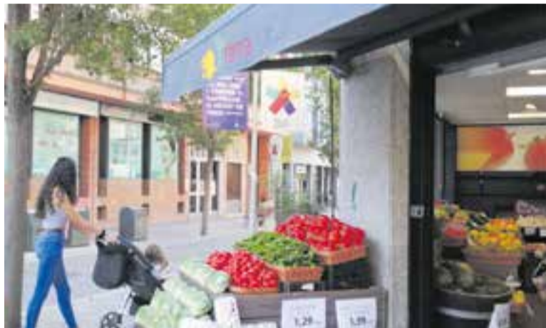
Una de les banderoles que es pot veure al carrer Sala Boadella.

La ciutadania podrà comprar vals de 5 o 10 euros a meitat de preu