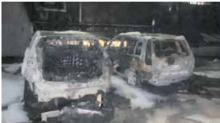
Vehicles totalment calcinats a l'interior de l'edifici. || CEDIDA

Una vegada el foc va quedar extingit, i fetes les comprovacions de seguretat pertinents, els veïns van poder tornar als seus domicilis. + || REDACCIÓ