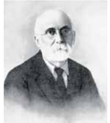
Imatge d'Àngel Sallent publicada a la Galeria de Científics catalans de l'IEC.

El web de la Galeria de Científics inclou biografia i fotografies dels científics catalans que més han contribuït a formar una ciència catalana de prestigi internacional. Els continguts són ampliat periodicament. El Projecte d'aquest web està coordinat per Mercè Durfort i Coll. +