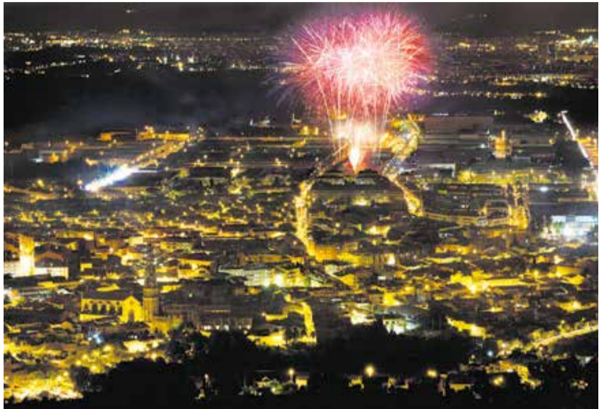
Enguany no faltará el gran castell de focs a la zona esportiva del Pla de la Bruguera.

D'altra banda, la plaça d'El Mirador acollirà el lliurament de la Medalla de la Vila a les comunitats educativa i sa-