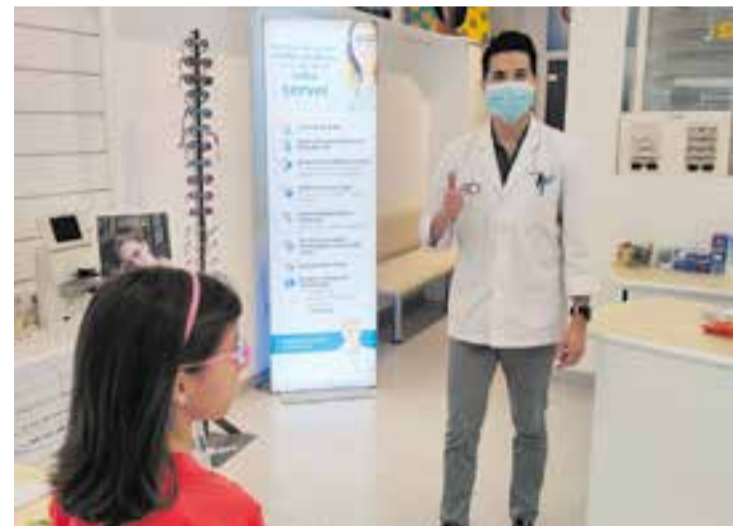
Una de les participants a la campanya l'any passat. || CEDIDA

Els nens i nenes que vagin a la botiga durant la campanya podran escollir entre 50 models diferents d'ulleres. "No es tracta de cap liquidació d'estocs, sinó que s'ha fet una inversió important en ulleres" , constata Fermoselle. + || J.RIUS