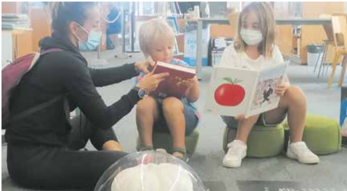
Uns usuaris de la Biblioteca Municipal Antoni Tort en una imatge recent.

Els clubs de lectura, un taller d'escriptura i l'Hora del Conte són algunes de les propostes programades fins al desembre