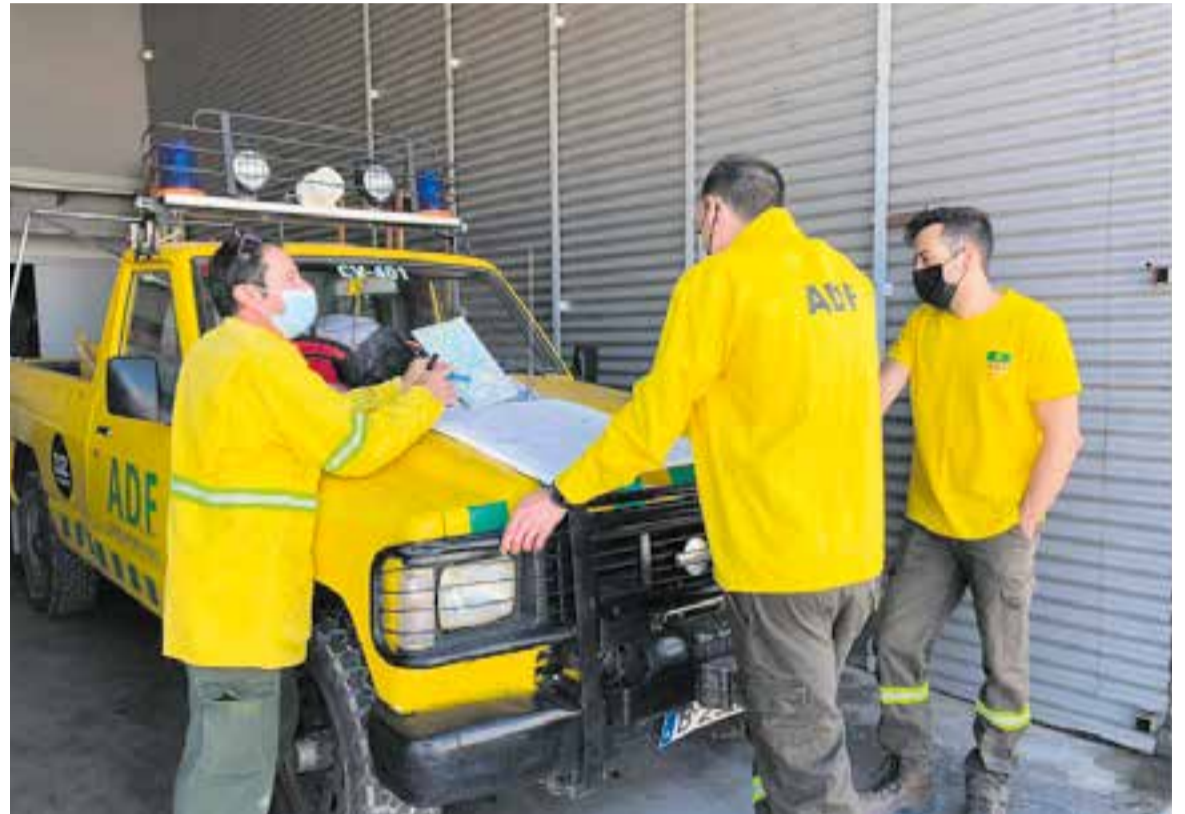
Els ADF fan tasques de prevenció i vigilància, entre d'altres. Aquí, interpretant un mapa.

Però els ADF desenvolupen moltes altres funcions a banda de la prevenció i extinció d'incendis forestals. Una tasca molt relacionada és la revisió d'hidrants: "Si funcionen bé, si tenen la pressió adequada. Sobretot ens preocupem d'aquells més propers a les zones forestals. A Castellar estem ben nodrits d'hidrants i de punts d'aigua, com les basses. Ara