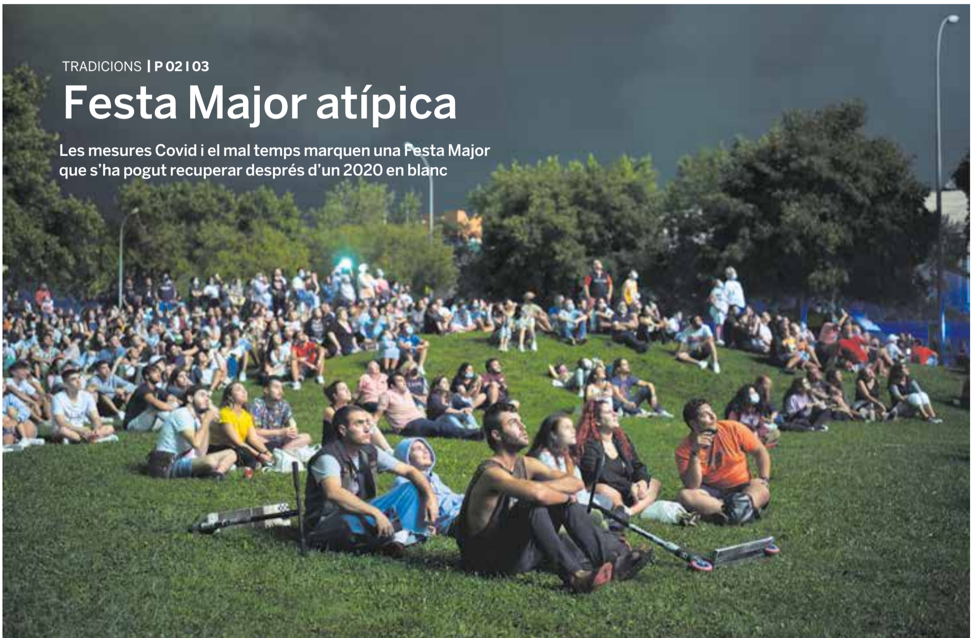
El castell de focs del dilluns, que es va fer a l'espai habitual del Pla de la Bruguera, va ser un fi de Festa que va recordar els anys anteriors a la pandèmia. En la imatge, uns veïns miren l'espectacle pirotècnic.

Les mesures Covid i el mal temps marquen una Festa Major que s'ha pogut recuperar després d'un 2020 en blanc