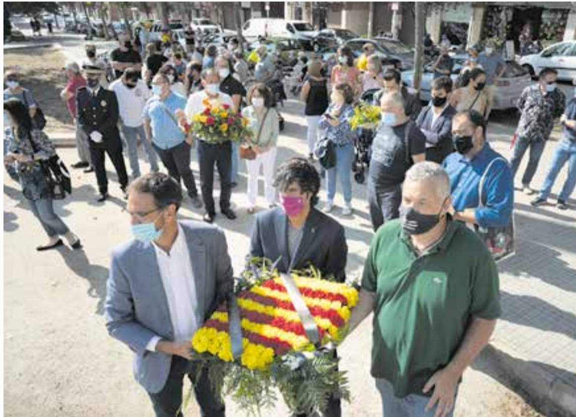
Ofrena institucional a la plaça Catalunya de l'alcalde, el portaveu del govern i el portaveu d'ERC.

En un àmbit més polític, la presidenta d'ERC va reivindicar que Catalunya "ha estat no només el motor econòmic d'Espanya, sinó també un factor de modernització