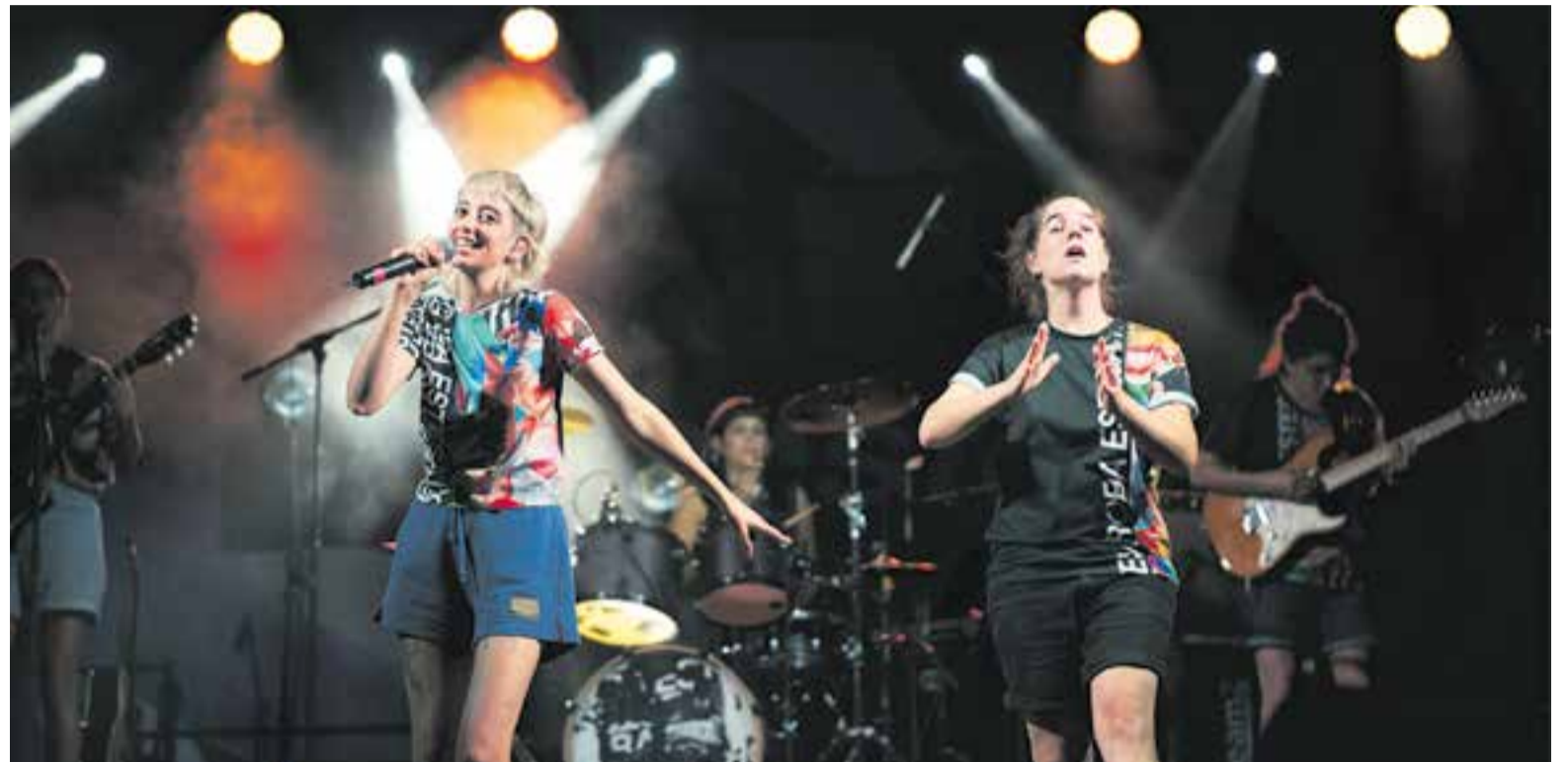
Algunes de les integrants de Roba Estesa actuant al nou espai del carrer Osona amb la seva música d'estil urbà i amb lletres reivindicatives.

Però res d'això va semblar important. Emmarcades en un escenari lila, Roba Estesa va atraure a la immensa esplanada del carrer d'Osona una bona massa de fans incondicionals, que disparaven la lletra apresada de memòria dels darrers àlbums, Dolors (2020) i Desglaç (2016). I també públic expectant per descobrir la cada vegada més