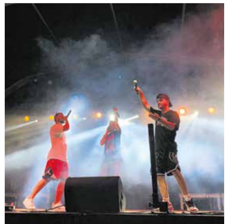
Els castellarencs CE1NO durant el concert de Vilabarrakes de dissabte passat. || R.G.

Després del pregó de Vilabarrakes va ser el torn de La Banda del Coche Rojo. El concert va començar, com la nit requeria, amb una mica de patxanga, i altres himnes de festa major com "Bailando" d'Alaska. Per no perdre pistonada el grup va seguir amb un bloc dedicat a Queen, en què la cantant va demostrar una gran afinació i presència escènica. Popurris d'èxits d'Operación Triunfo, Britney Spears, Spice Girls, Backstreet Boys, Catarres, Txarango, Ska-P o el "Viva la vida" de Cold Play van ser algunes de les píndoles de la cinta d'estiu intergeneracional que va portar a Castellar La Banda del Coche Rojo. | ROCÍO GÓMEZ