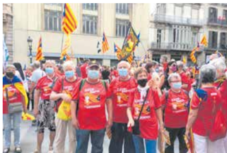
Representants de l'ANC de Castellar a la manifestació de Barcelona.

L'acte de Cal Targa es va tancar amb la intervenció de la portaveu municipal de la CUP, qui potser