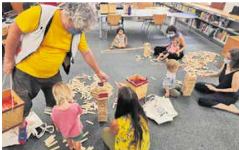
El taller familiar de Kapla de la ludoteca durant la Festa Major. || AJUNTAMENT

tindran la informació, però, fins a la setmana que ve. Fins ara, aquesta aplicació permetia saber quantes persones (alumnat, docents i personal dels centres), grups i centres hi havia confinats per Covid en cada moment a tot Catalunya i seguir-ne la traçabilitat. +