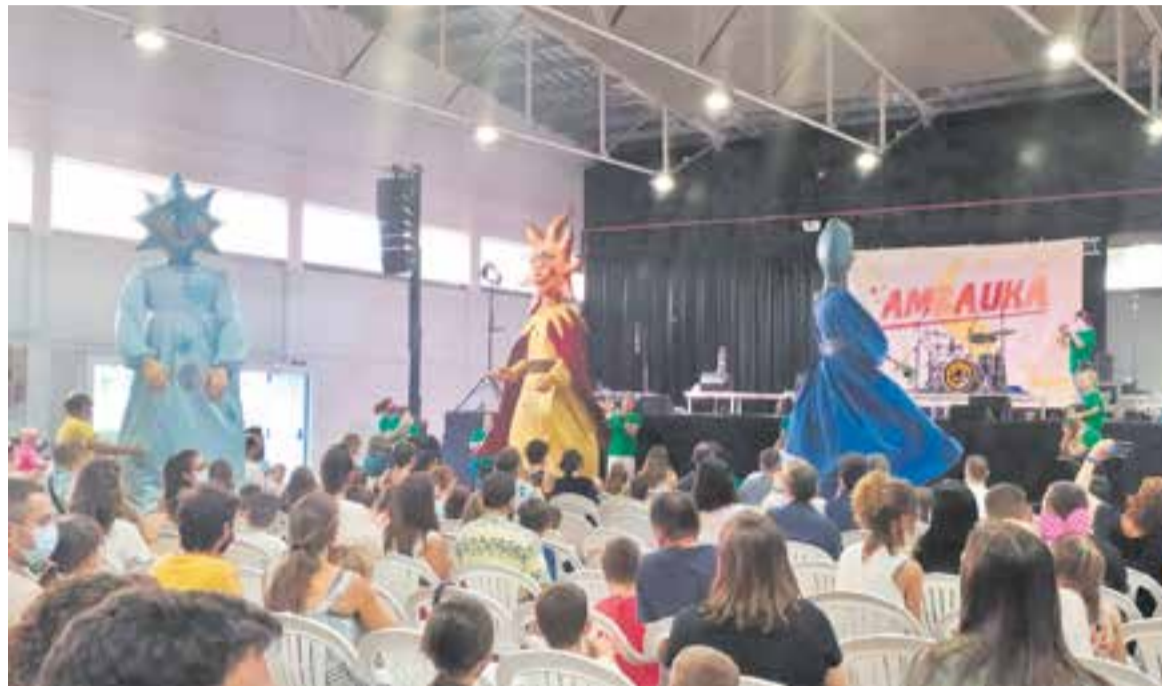
Moment del concert d'Ambauka, al recinte firal de l'Espai Tolrà.

La companyia de Molins de Rei, formada per monitors d'esplai, porta la motxilla plena d'estils musicals: reggae, ska, rock, folk, rap, rumba, i molt i molt de ritme. Aquesta és la nota dominant dels Ambauka. Per això, i tristament amb pandèmia, que no es pugui ballar és una mica una murga, però tot i així, els Ambauka ja tenen altres mecanismes per fer moure l'esquelet a l'audiència, com el moviment de braços i peus. Un