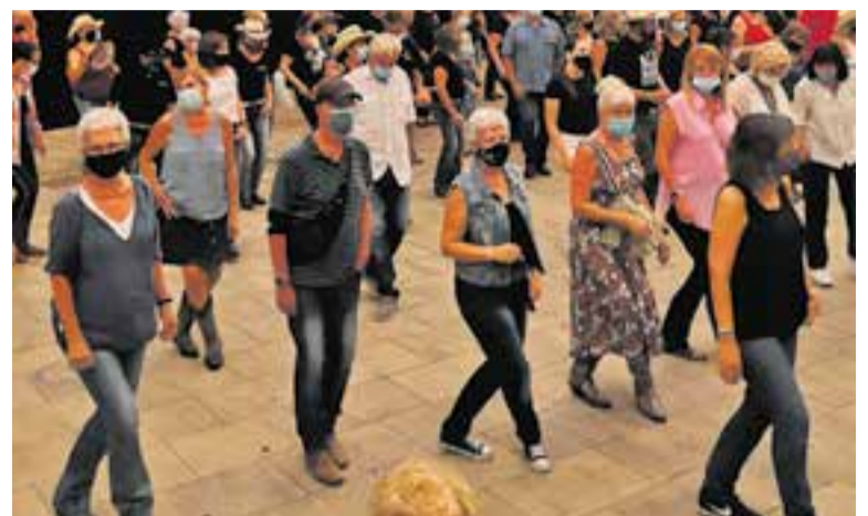
Els Amics del Country van tancar una tarda dedicada a la cultura al carrer.

Els darrers en actuar van ser els Amics del Country de Castellar que, tot i haver-hi una gran participació, malgrat la Covid-19, es van queixar de la manca d'il·luminació al lloc as- signat i es van sentir "menystinguts grollerament" i, de fet, "no és la mi- llor manera de fer poble, oi?" es pre- guntava l'entitat en un comunicat. +