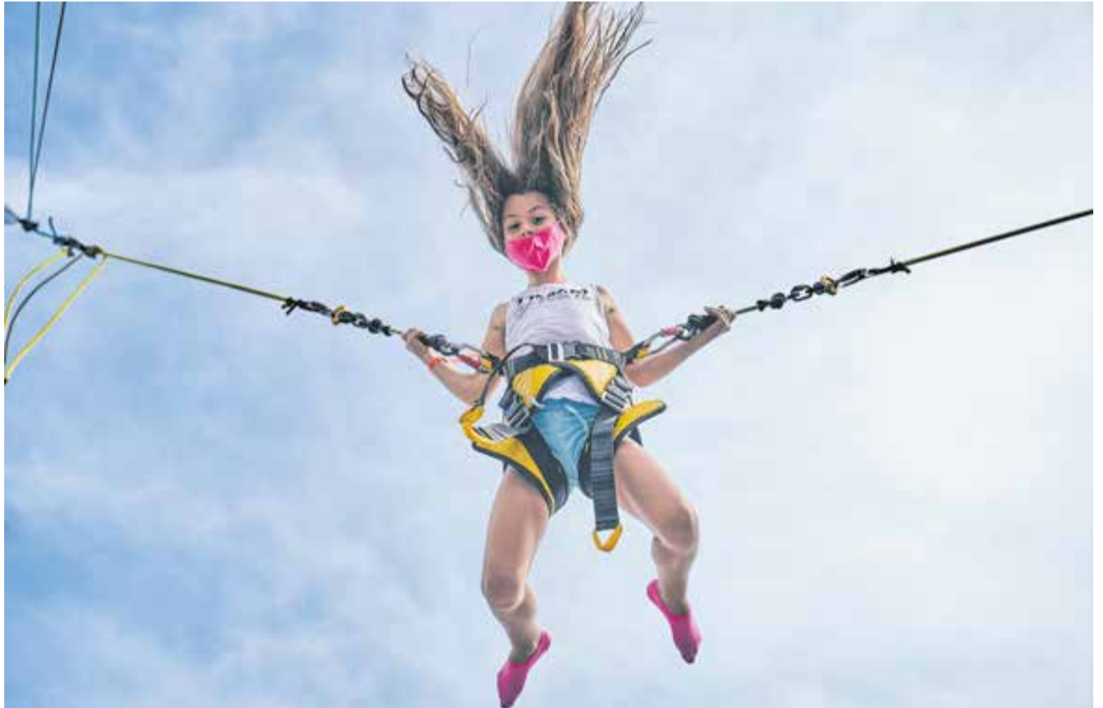
Una nena gaudeix d'una de les atraccions ubicades a la plaça de la Fàbrica Nova en la jornada de dilluns dins l'espai Aventura't.

col·lectiu, era important donar visibilitat a les entitats de cultura popular de la vila”.