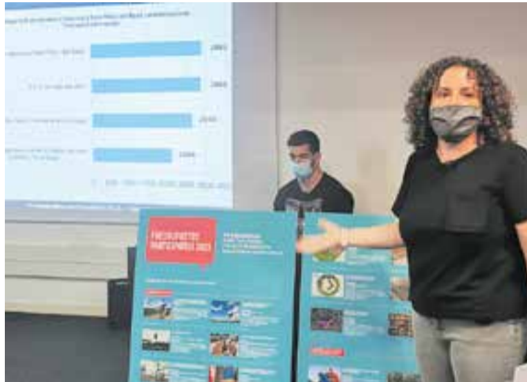
La regidora de Responsabilitat Social dona a conèixer els resultats. || AJ. CASTELLAR

Els tres projectes dins de la categoria de nucli urbà sumen 150.000 euros –el màxim amb què està dotada aquesta categoria– mentre que dins de la categoria d'urbanitzacions ha estat escollida la millora de les places de Sant Feliu del Racó, proposada pel Consell d'Infants de Castellar, dotada amb 50.000 euros. Pel que fa a les aules multisensorials, es tracta de crear espais multisensorials d'estimulació a les escoles, amb un enfocament globalitzat per garantir la inclusió, l'equitat, l'acollida i l'èxit de l'alumnat. La segona proposta guanyadora, la de l'ADF, consisteix en la compra d'un dron i equipament complementari que permeti facilitar les tasques de vigilància, d'actuació en emergències i també per combatre la vespa asiàtica. La tercera proposta dins de la categoria de nucli urbà que ha obtingut el suport de les votacions ha estat l'adequació d'una