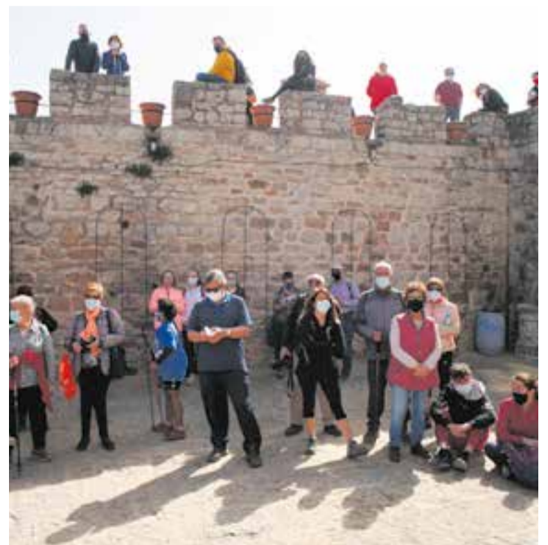
Imatge de la trobada de la primavera passada al Puig de la Creu. || Q.PASCUAL

Les obertures de l'edifici són una finestra a l'absis i dos ulls de bou als murs de llevant i de ponent, a més d'una petita obertura a l'absis nord. La porta d'accés, a la banda nord, és d'arc de mig punt. L'església està dedicada a la Mare de Déu dels Dolors. ➔