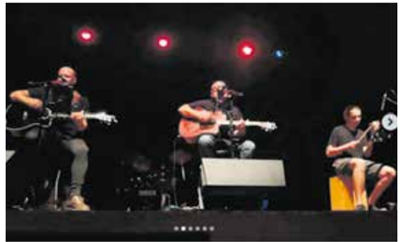
Petit & Comitè van ser els teloners de Los Mucca al concert de dissabte.