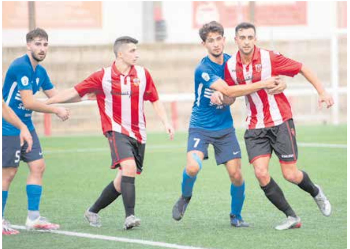
La UE Castellar no va poder escapar de la contundència ofensiva de l'Igualada i va caure per 1-3.

Amb l'inici de Lliga en menys de dues setmanes, l'equip se centra a seguir agafant bon ritme i recuperar els lesionats lleus, amb vista al partit contra el sempre complicat CE Sallent (2/10, 18:00 h). ➔