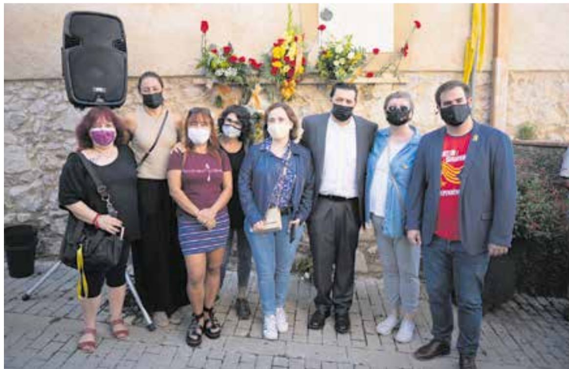
Portaveus i representants de les forces independentistes al final de l'ofrena del carrer de les Roques.

i d'estabilitat" , i també el caràcter "massiu i majoritari" de les mobilitzacions ciutadanes dels últims 11 de Setembre. Quant al moment que viu el procés sobiranista, Nicolàs va recalcar que "la resposta a un conflicte polític és el diàleg, i no la repressió, ni la regressió de drets i llibertats" . "Ens implicarem amb tenacitat i perseverança per una llei d'amnistia al Congrés dels Diputats perquè són innocents i no haurien d'haver passat ni un sol dia, ni una sola nit a la presó" , va asseverar en relació a la situació dels presos indultats.