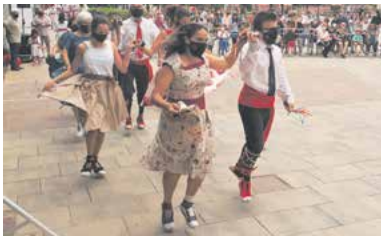
El Ball de Gitanes feia molts mesos que no podia actuar per les restriccions.