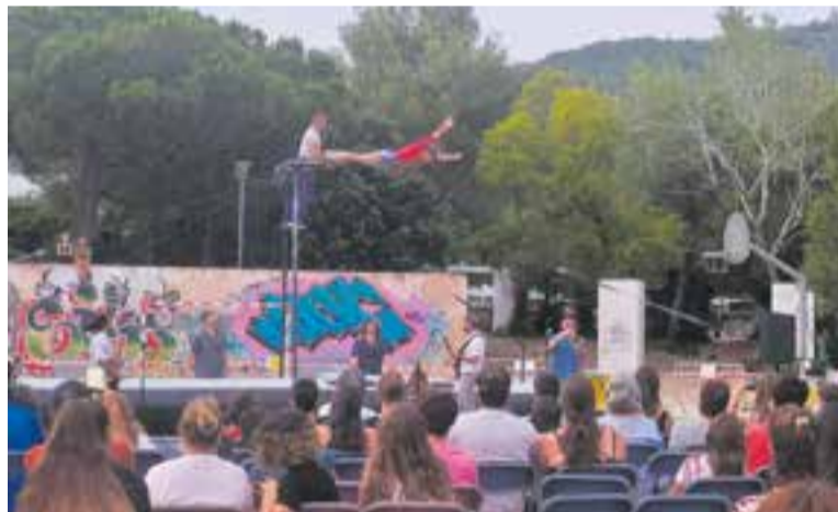
'Violeta', de La Persiana i Venancio y Los Jóvenes de Antaño, a la pl. Catalunya || M. A.

També van ser molt aplaudits els Gegants de Castellar de l'ETC i els Gegantets del Sol i la Lluna, que dissabte