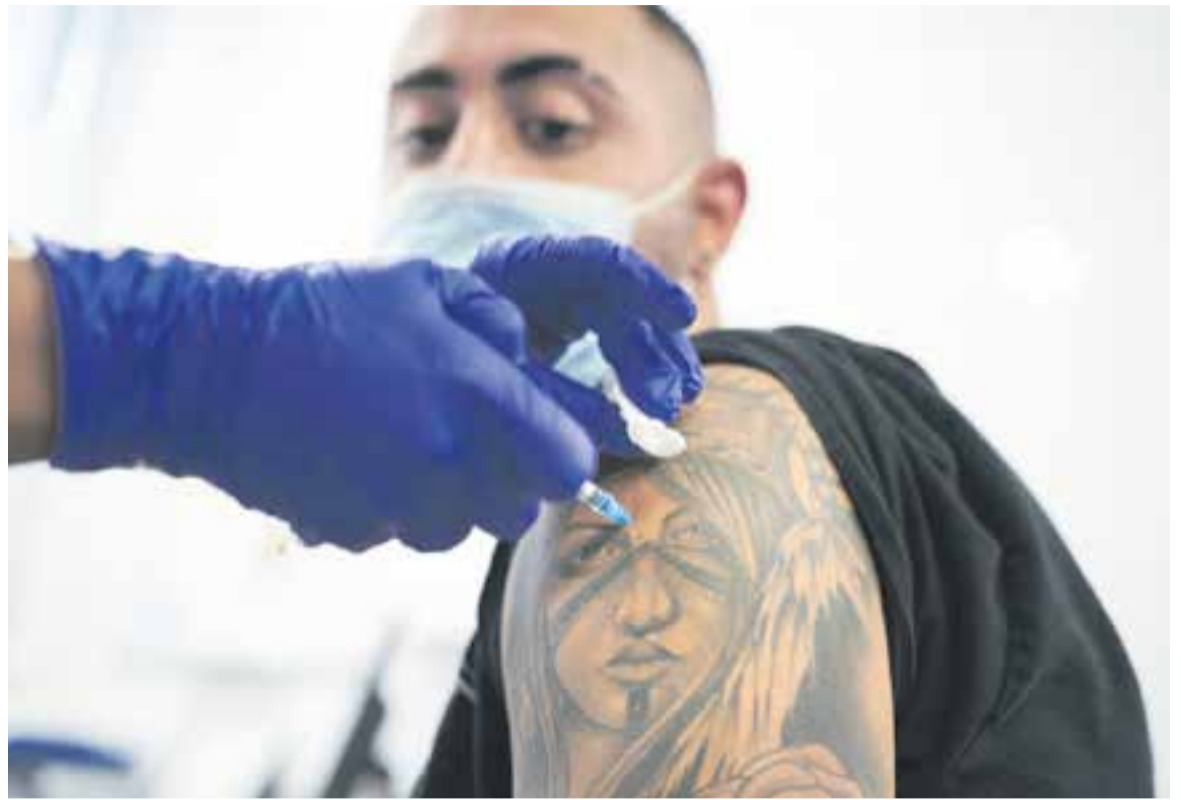
Instant de la vacunació d'un jove durant la marató organitzada al CAP per la Festa Major per vacunar sense cita prèvia.