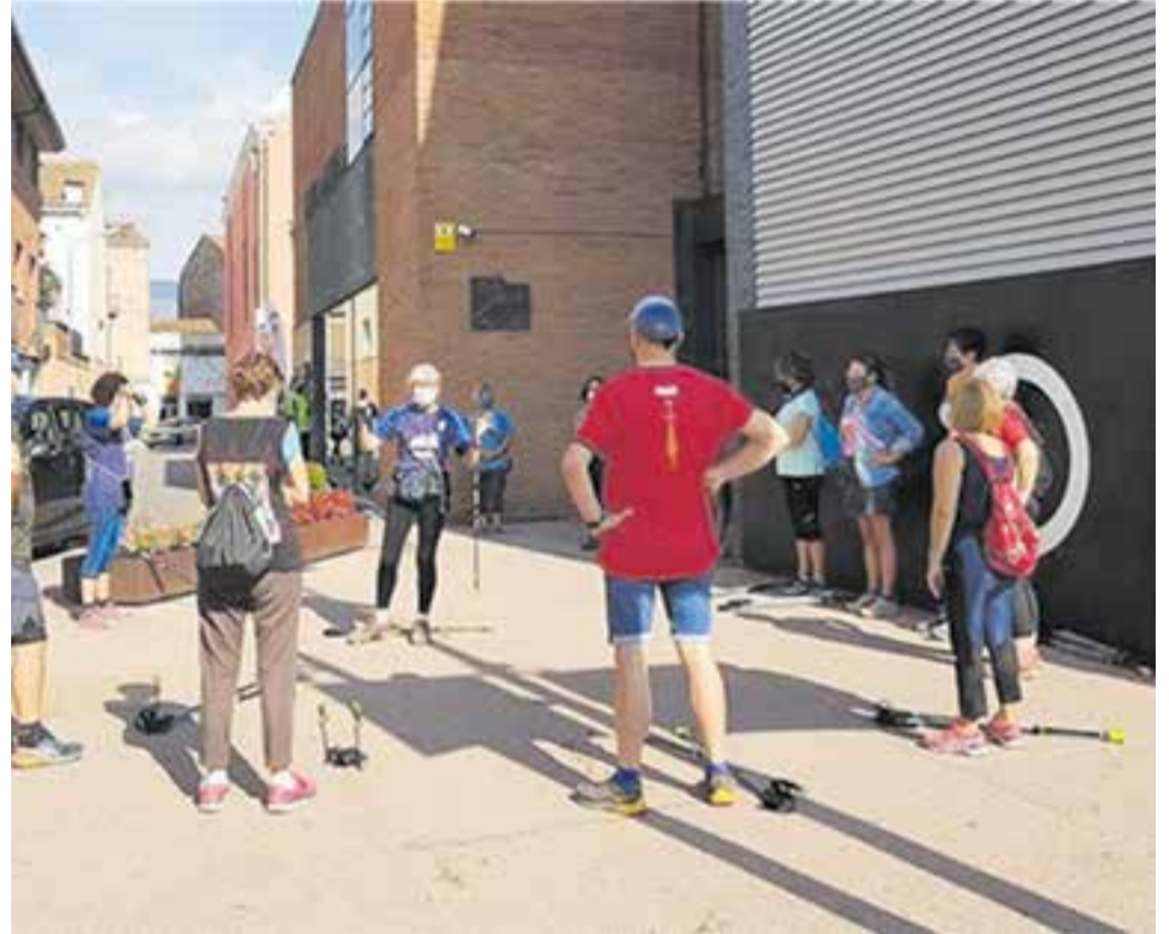
La marxa nòrdica va ser un dels actes organitzats pel Centre Excursionista durant la Festa Major. || CEDIDA

La pròxima activitat de l'entitat serà la 60a edició de la Marxa de Regularitat Infantil, el dia 3 d'octubre, amb un recorregut de 8,537 km, 329 m de desnivell i un temps estimat de 3 h i 10 m. Les inscripcions per aquesta edició històrica estan obertes fins al 26 de setembre ( www.cecastellar.cat ) i s'hi poden inscriure parelles formades per infants de primer de primària, fins a segon de l'ESO, mentre que en el cas de les mixtes són des de P4 a 1r de primària, i amb una persona major d'edat. ♣ || A.S.A.