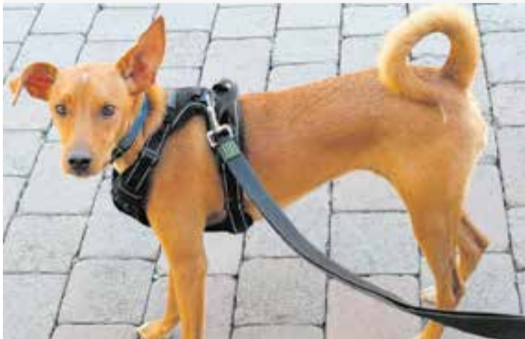
En Mac és un dels gossos de Caldes Animal que ha estat adoptat aquest 2021.

Des de la protectora encarregada dels animals de Castellar expliquen que actualment tenen espai per acollir animals i que de fet, el cap de setmana passat, van arribar divuit gossos d'Andalusia dels quals només en queden quatre. En aquest sentit, detallen que últimament donen molt de suport a particulars i associacions que rescaten i acullen gossos a altres punts del territori. A diverses comunitats autònomes,