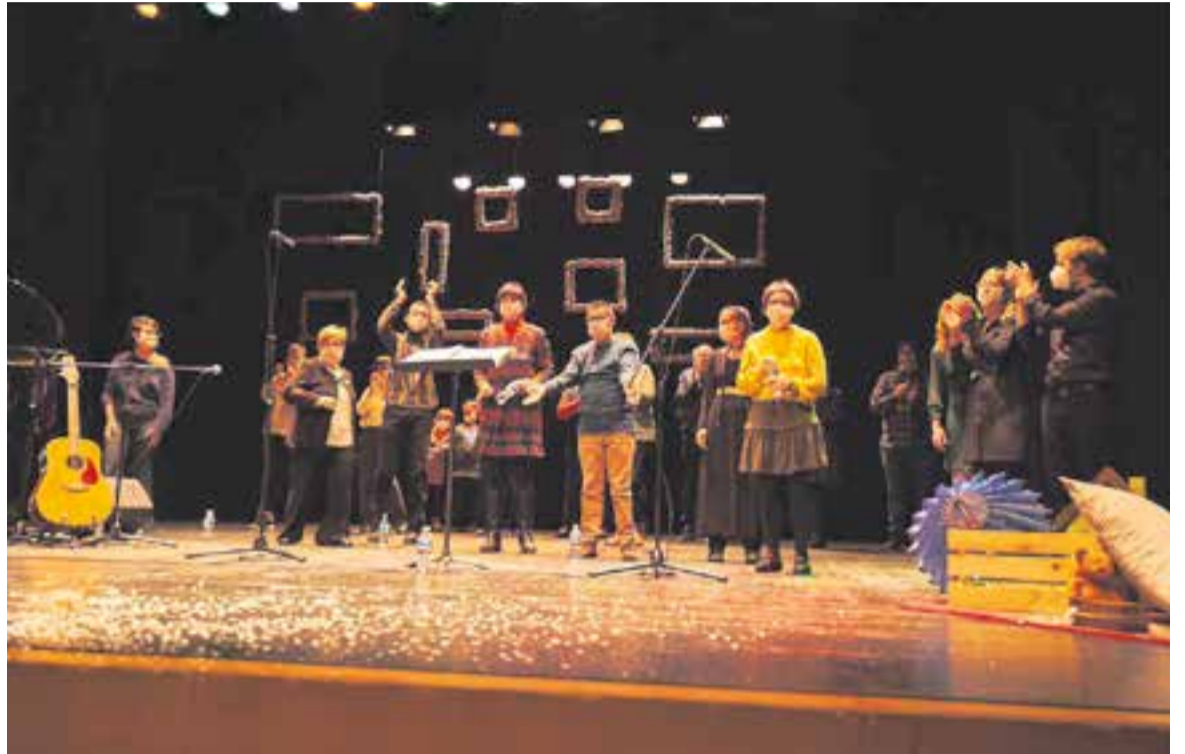
L'any 2020, una espectacle de la Coral Pas a Pas a l'Auditori Municipal.

Els objectius de la Coral Pas a Pas, són: la inclusió, tant per combinar gent que té dificultat amb la que aparentment no en té, com per fer