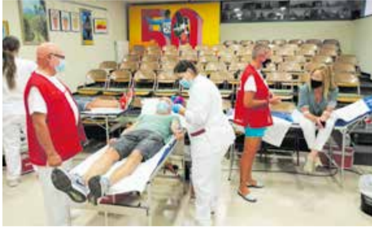
Jornada de donació del sang al CEC l'estiu passat.

El final de la cinquena onada de la pandèmia fa preveure a les autoritats sanitàries un augment de les necessitats de sang perquè augmentaran les transfusions si es repeteix l'escenari de la quarta onada, del maig: llavors, les necessitats de sang als hospitals van pujar un 15%. De fet, ja es comencen a tenir problemes de reserva perquè els hospitals comencen