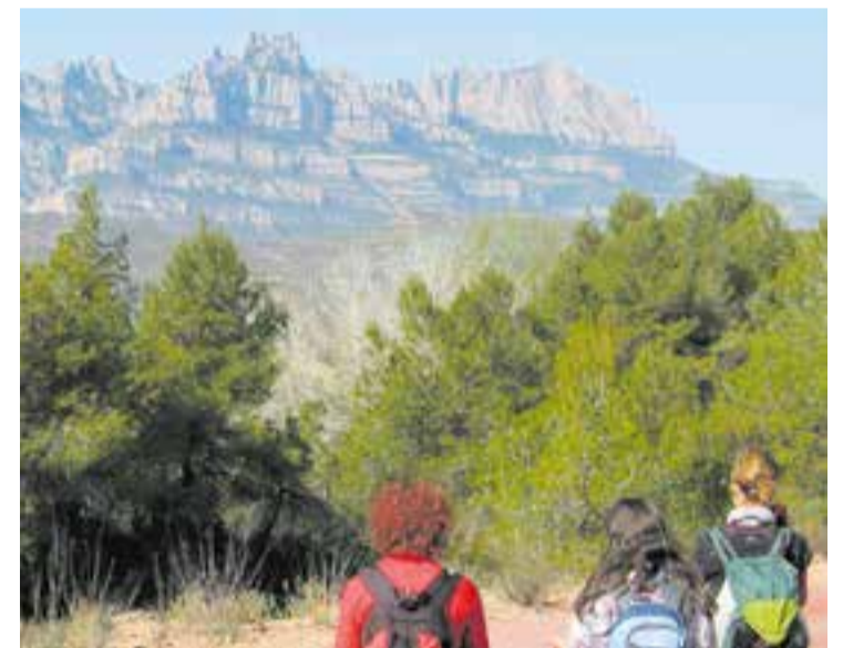
Participants de la Travessa Castellar-Montserrat en una edició anterior. || ARXIU

D'altra banda, les inscripcions per a la 60a edició de la Marxa Infantil del 3 d'octubre encara estan obertes fins aquest diumenge, dia 26 de setembre. + || A. SAN ANDRÉS