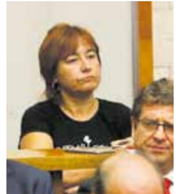
Oncins en la presa de possessió.