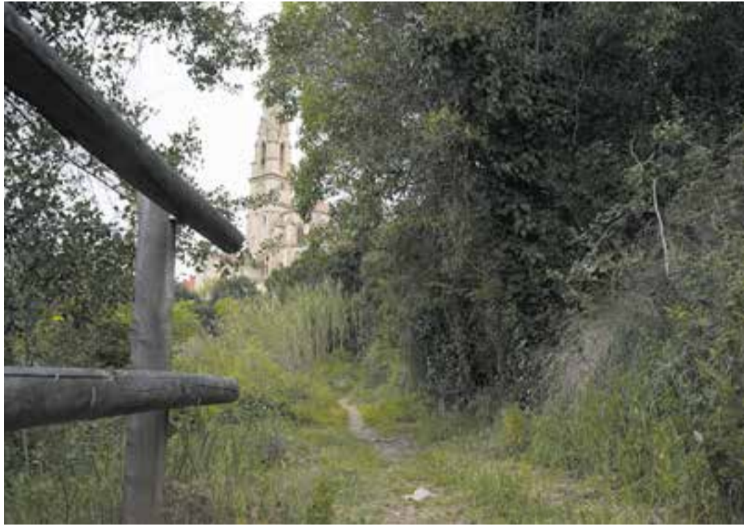
Zona del parc de Canyelles que experimentarà una millora, amb l'església de Sant Esteve al fons.

Els treballs també inclouran la urbanització i ampliació de la zona pública d'estacionament a tocar del parc, amb accés des del carrer del Calvari i amb capacitat per a una vintena de vehicles. Aquest és un espai que connecta el camí de vianants rural perimetral al parc de Canyelles amb el camí existent dels horts del Brunet, que enllaça amb el camí del riu Ripoll i que també es millorarà en tot el tram des del carrer del Calvari fins a la carretera de Sant Llo-