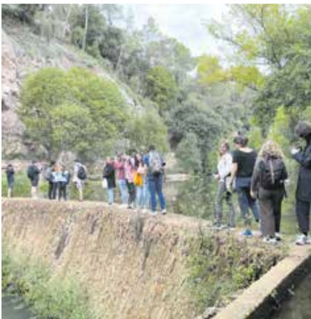
Els estudiants d'arquitectura de la UPC al Ripoll.