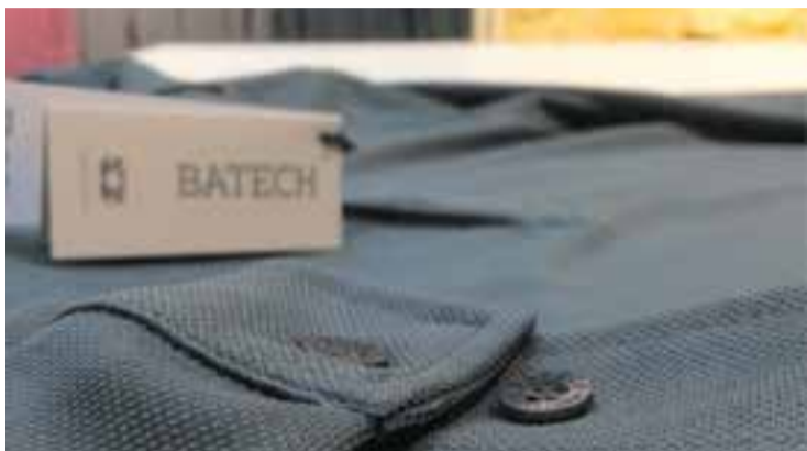
Un dels polos Batech de la col·lecció del 2016.

L'empresa castellanenca de polos tècnics Batech ha posat en marxa el Pla Renova'm, destinat a renovar un antic polo de la marca i bescanviar-lo per un de nou, amb una rebaixa de preu. La promoció està destinada a canviar un polo a l'armari que ja no ens posem i tenir-ne un de nou amb 20 euros de descompte. No cal preocupar-se per l'antiguitat o l'estat del polo. Només cal que es porti la peça antiga a la botiga oficial de Batech a Barcelona (c/ Provença 203). Batech, creada fa set anys per l'enginyer industrial Santi Simon i el teòric tèxtil Lluís Latorre, va obrir al juliol la seva secció outlet amb aproximadament un miler de peces de la temporada passada. El servei està disponible tant a la botiga física del carrer Provença de Barcelona com a la pàgina web de Batech. A la secció, es pot trobar des de polos fins a camises d'estiu i d'hivern, tret de parques, bombers o armilles. L'empresa va preferir obrir un outlet abans que fer rebaixes. Els descomptes a la zona outlet oscil·len entre el 15 i el 35% depenent de l'article. + || REDACCIÓ