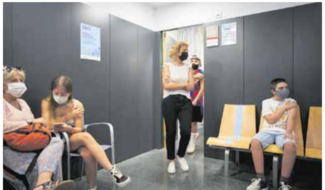
Joves de Castellar acabats de vacunar al CAP de la vila.

D'altra banda, la vacunació continua endavant i s'ha arribat al 75,2% de la població amb la pauta completa, és a dir, 18.499 persones immunitzades. Si s'eliminen els