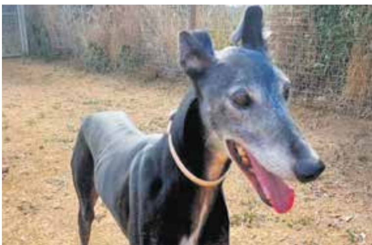
En Gandalf espera adopció a la protectora a Caldes Animal.

com per exemple Andalusia, la llei de protecció animal estableix que els animals que van a parar a les gosses, si no són adoptats, cedits o reclamats pels seus propietaris en un termini de 21 dies, poden ser sacrificats.