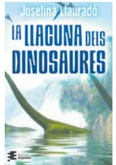
'La llacuna dels dinosaures', de J. Llauredó.

El llibre, doncs, continuarà a partir de l'opció guanyadora, la més votada. “ Durant tot el procés estaré en contacte amb els lectors gràcies al fòrum ”, afegeix l'escriptora. + || M. A.