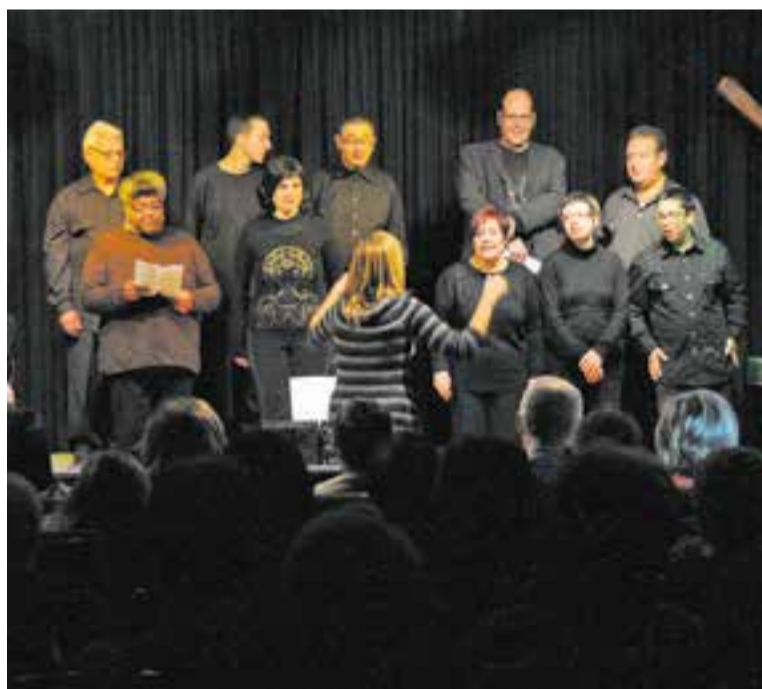
Concert de la Coral Pas a Pas, l'any 2012, a Castellar.

una activitat de cant coral com qual-sevol persona; la visibilització d'aquest col·lectiu, i les noves oportunitats per aquestes persones. “Qui et diu que demà no patiràs una malaltia mental o un accident, molta gent no recorda que és important cuidar-se a nivell mental i emocional”.