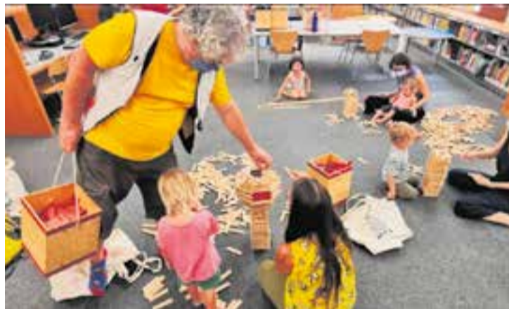
El taller familiar de kapla que va fer la ludoteca durant la Festa Major.

Com que l'aforament és limitat, és important reservar plaça al telèfon 93 715 92 89 o escriure un correu electrònic a ludoteca@castellarvalles.cat. + || REDACCIÓ