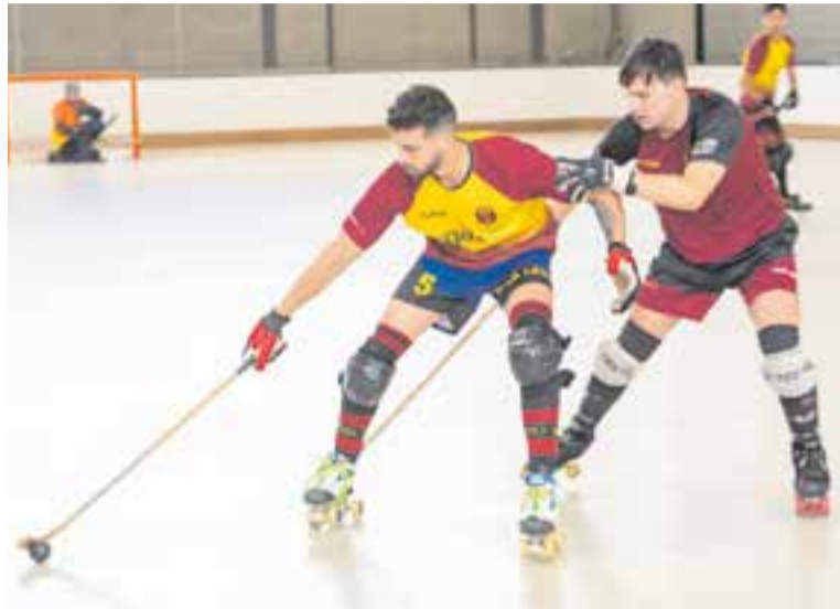
L'HC Castellar intentarà lluitar per l'ascens per tercer any consecutiu. || A. SAN ANDRÉS

Els granes, un equip remodelat i jove, però amb jugadors de molta qualitat, no vol deixar passar una nova oportunitat i arribaran a la data, després de golear en amistós per 9 a 2 el Corbera. + || A. SAN ANDRÉS