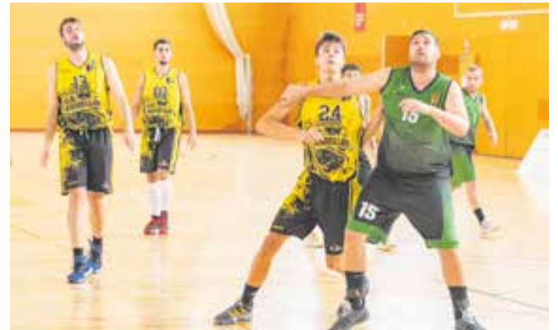
Els nous jugadors del CBC debutaran en la temporada de Copa a Montgat.