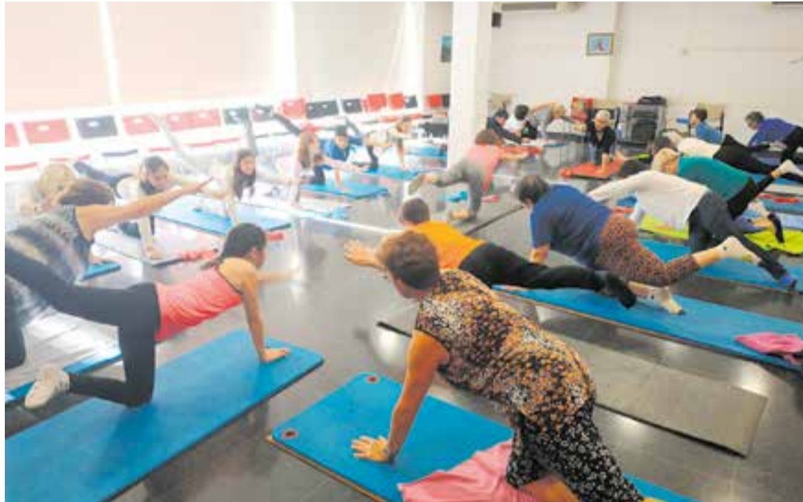
Una foto d'arxiu d'una classe de pilates conjunta entre el Casal Catalunya i alumnes del Sant Esteve.