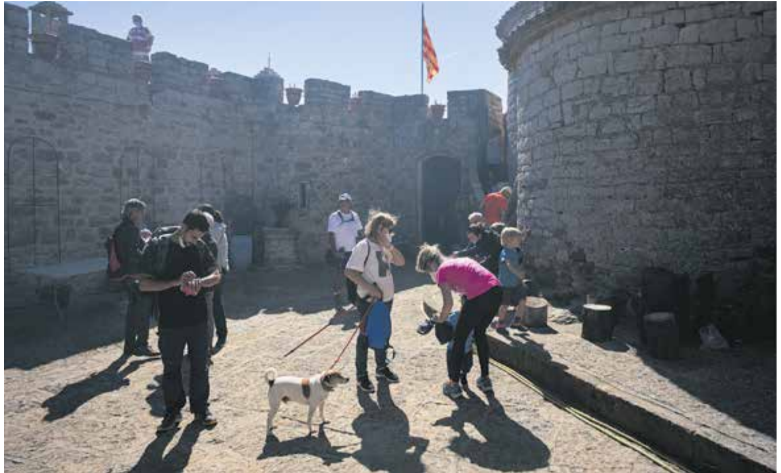
Participants de l'Aplec de Tardor del Puig de la Creu al peu de la torrassa i amb la senyera al fons.

Tal com va explicar el mateix Martí diumenge, s'ha calculat que unes 30.000 persones a l'any pugen al Puig de la Creu. Les actuacions previstes a la zona que envolta l'edifici