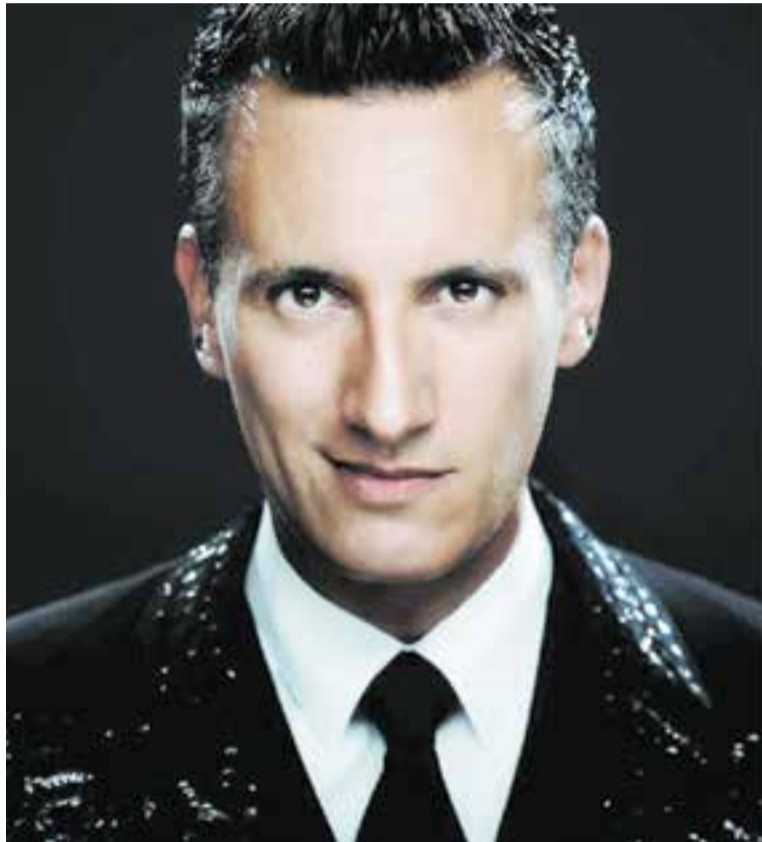
El Mag Lari actua dissabte a l'Auditori Municipal de Castellar del Vallès.