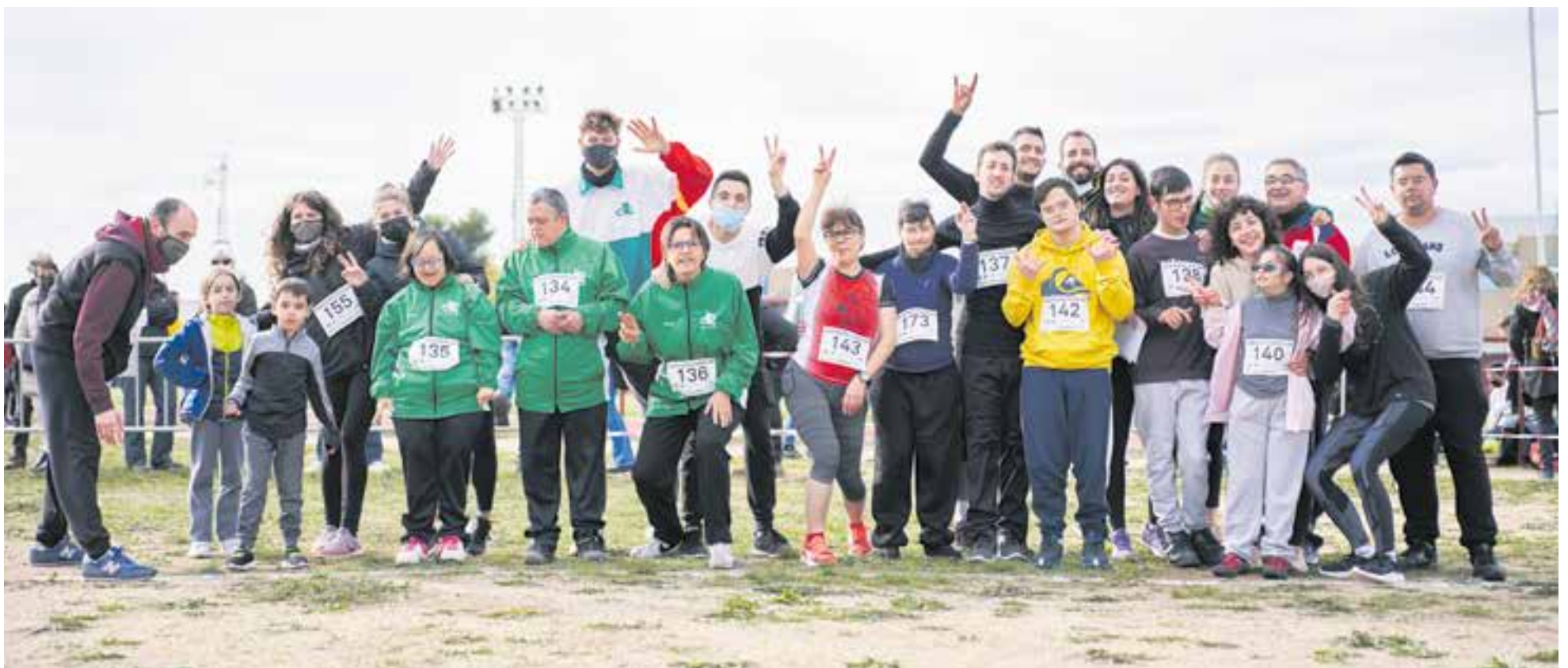
Foto de família d'alguns participants en la cursa per a atletes amb diversitat funcional envoltats de familiars i voluntaris a les pistes d'atletisme.

La novetat principal d'aquesta edició del cros de Castellar ha estat la cursa per a atletes amb diversitat funcional