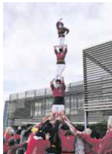
Els Capgirats, dissabte passat.

El 19 de desembre tornaran a ser a la plaça d'El Mirador amb motiu de La Marató, amb una paradeta i un altre taller adreçat a totes les edats. El 2 de gener a la tarda recuperaran el tradicional quinto de Nadal. +