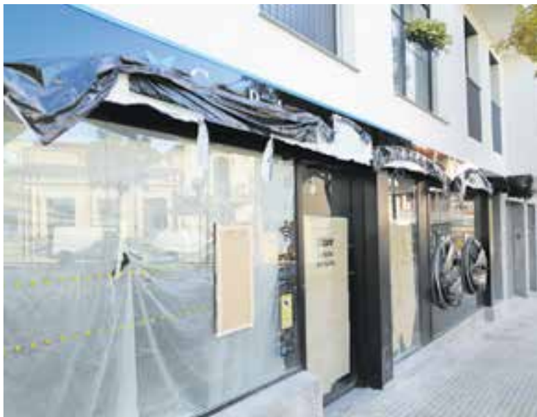
Les noves instal·lacions de CaixaBank, a la carretera de Sentmenat, estan a punt d'obrir. || J.R.

En el nou model d'oficina Store es potencia l'atenció personal i la gestió de l'autoservei; s'acompanya i ajuda el client en l'ús dels caixers d'última generació situats a l'oficina perquè els empleats se centrin en la gestió de les operacions de valor. Els clients reben la benvinguda, a l'entrada de l'oficina, per part d'un empleat que els guia en funció de les seves necessitats. Segons CaixaBank, l'eliminació de les barreres físiques permet millorar la transparència en la relació client-empleat, Així mateix, pels clients de Banca Premier i Banca Privada, l'oficina Store disposa de zones diferenciades que permeten més privacitat. + || REDACCIÓ