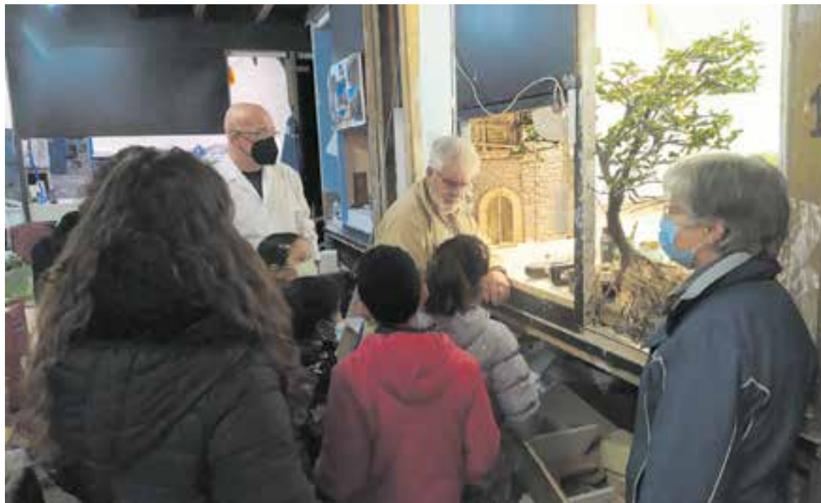
Els usuaris de la Ludoteca Municipal van visitar els pessebres en la seva fase final abans de la inauguració.