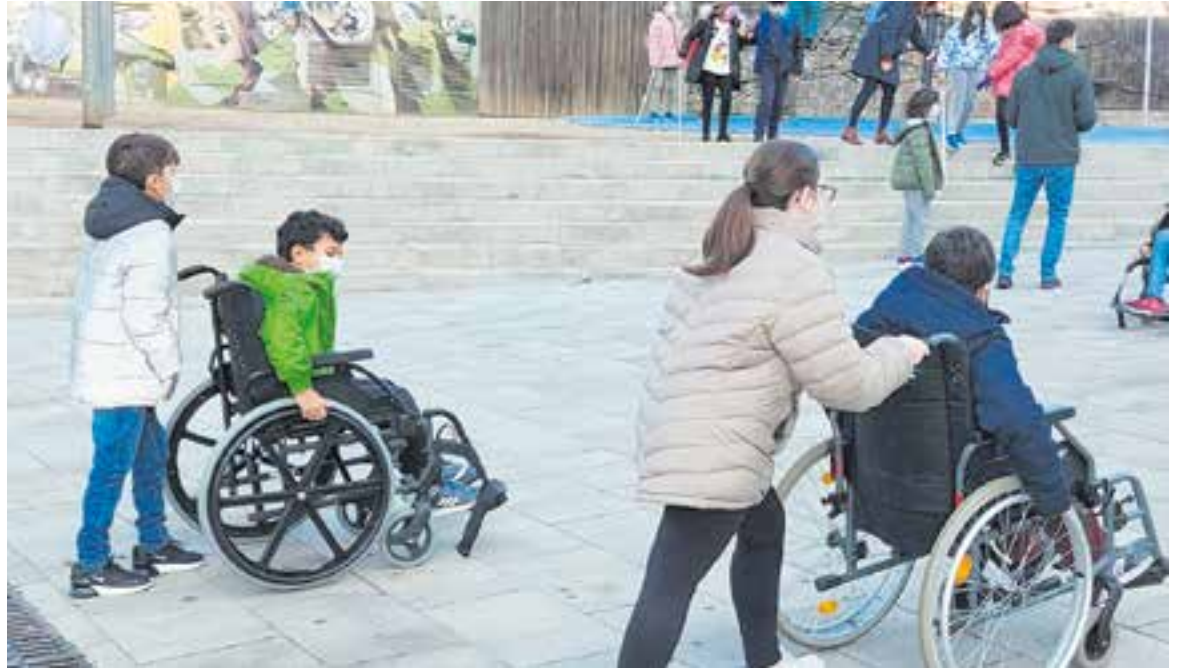
Alumnes de 6è de primària durant l'activitat de conscienciació de l'Associació Amputats Sant Jordi.

25 persones es van interessar pel taller de l'AVAN 'Gestió emocional davant una malaltia neurològica', i també dimecres a la tarda es va fer la presentació del Còmic Escac i Mat,