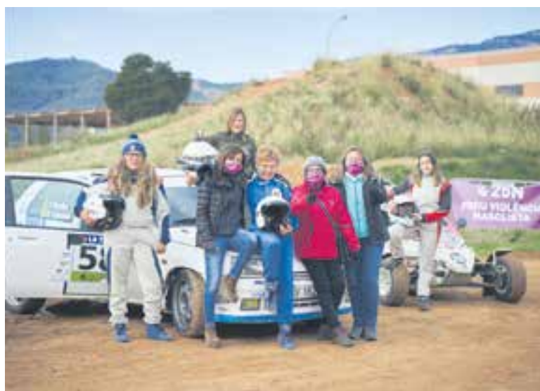
Rodada contra la violència masclista a càrrec de l'Escuderia T3. || Q. PASCUAL