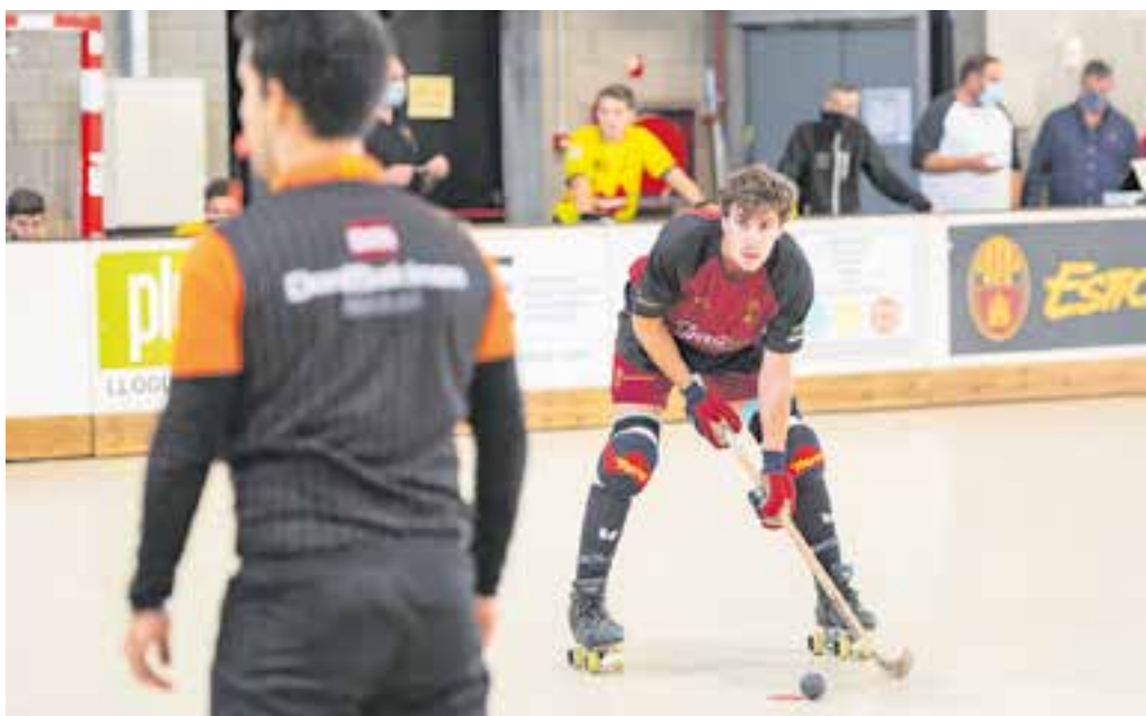
El primer equip grana va cedir els primers tres punts de la temporada a Ripollet. || A. SAN ANDRÉS