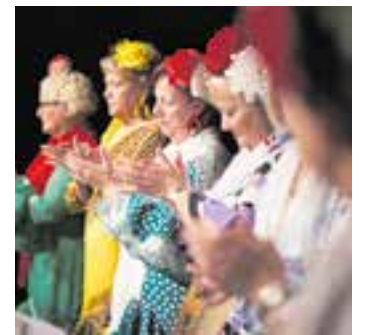
Aires Rocieros Castellarencs. || Q. P.

L'acte tindrà lloc a les 17.30 h i és obert a tota l'assistència, si bé cal trucar al telèfon 937148739 o al mòbil 669770954 per a fer la reserva. † || REDACCIÓ