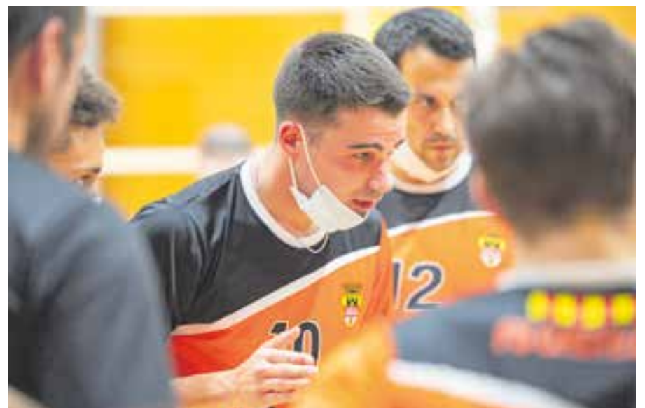
El sènior masculí no va tenir sort en el partit contra l'Igualada. || A. SAN ANDRÉS

Pel que fa al segon equip femení, segueix la dinàmica negativa i ja són nou les derrotes consecutives. El conjunt va perdre per 3-0 (25-13/25-12/25-18) contra l'Escola Orlandai de Sarrià i segueixen en l'última posició sense haver sumat cap punt aquesta temporada. + || A. S. A.