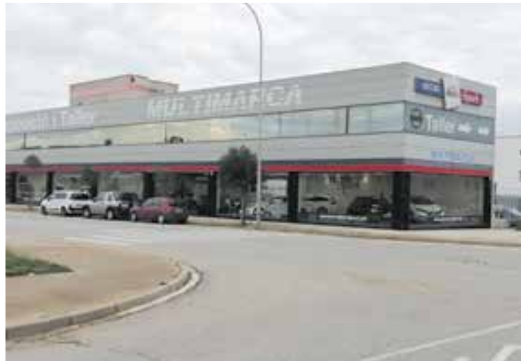
El concessionari Motor Sport, situat al carrer Osona del polígon Pla de la Bruguera.

A Motor Sport tenien un estoc de 50 vehicles, però ara mateix "tenim el que tenim a la botiga" i això que el concessionari castellarenç "compra vehicles a França, Alemanya i Bèlgica des del 2012". Navarro apunta que la situació no canviarà a mitjà termini i caldrà esperar "entre sis mesos i un any". El problema també rau en la falta de components específics que "potser no es troben ni aquí ni tampoc a fora".