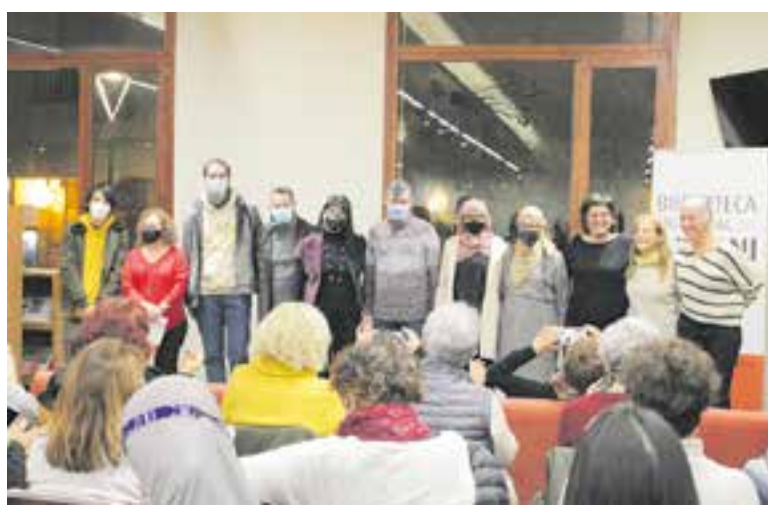
Els estudiants de l'Escola d'Adults i les actrius de l'espectacle a la Biblioteca.