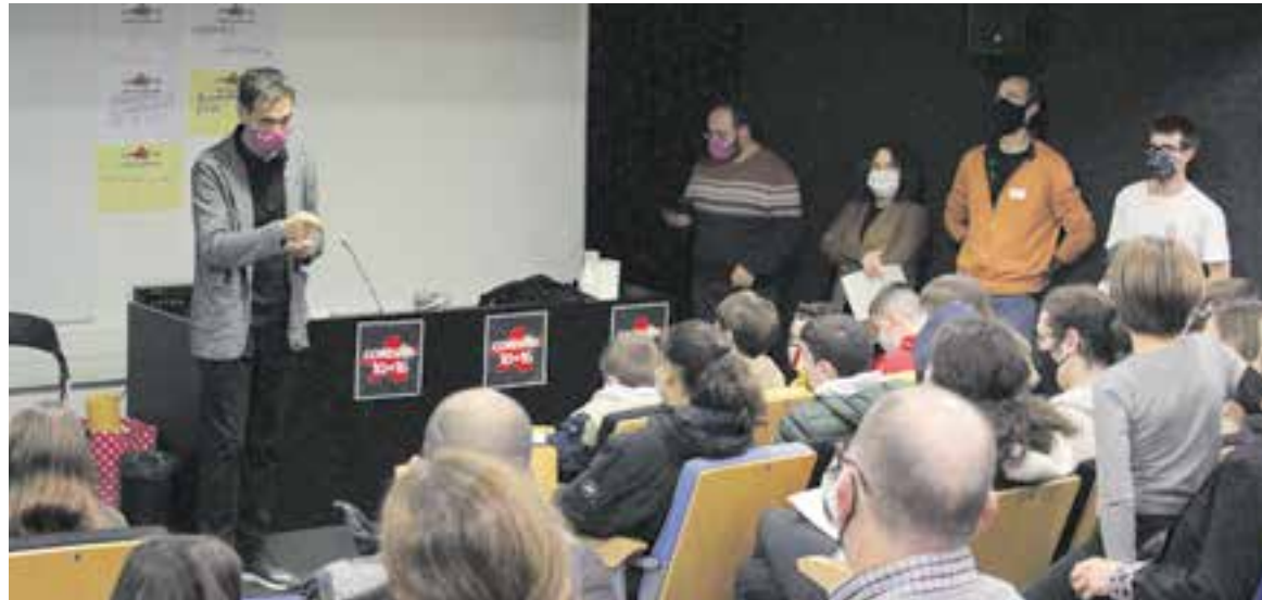
Constitució del Consell d'Infants i d'Adolescents, dijous passat, a la Sala d'Actes d'El Mirador.

presentació dels 21 infants de 5è i 6è de primària i dels 21 adolescents de 1r a 4t d'ESO que formen part d'aquests òrgans de participació. En aquesta ocasió, els infants no tindran un encàrrec concret sinó que canalitzaran les propostes que detectin als seus centres escolars però també al seu entorn més directe per esdevenir altaveus dels suggeriments i peticions, i trans-