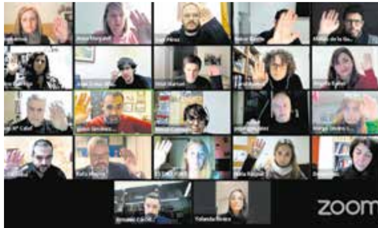
Votació en el ple telemàtic d'aquest mes de desembre. || YOUTUBE

El grup municipal de Ciutadans va presentar una moció per instar la Generalitat a la suspensió de l'impost de CO 2 . Segons el regidor Matías de la Guardia, "no és moment de posar