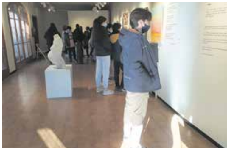
Alumnes de 3r d'ESO visitant l'exposició 'Com a casa', de Nadyv. || M. ANTÚNEZ

Divendres passat, l'alumnat de segon i tercer d'ESO de l'Institut Escola Sant Esteve van visitar l'exposició 'Com a casa' de Nadyv, que des del 27 de novembre s'ha pogut veure al Centre d'Estudis de Castellar - Arxiu d'Història. La mostra va tancar diumenge 19. ✦ || M. A.