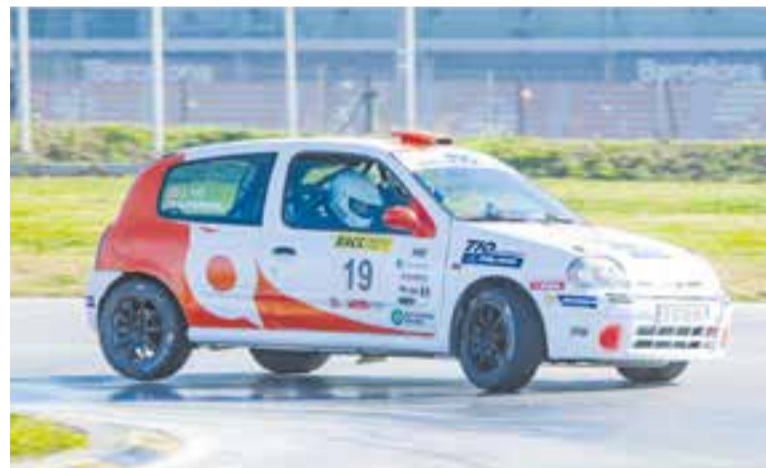
Parera en una de les parts del recorregut del Rally Sprint RACC. || A. SAN ANDRÉS

Els vencedors absoluts van ser Díaz Aboitiz-Medina (Skoda Fabia Rally2) en velocitat, mentre que Moreno-Noguera (BMW E30) ho van ser en RSS i Segú-Molist (VW Golf GTI) en RS. + || A. SAN ANDRÉS