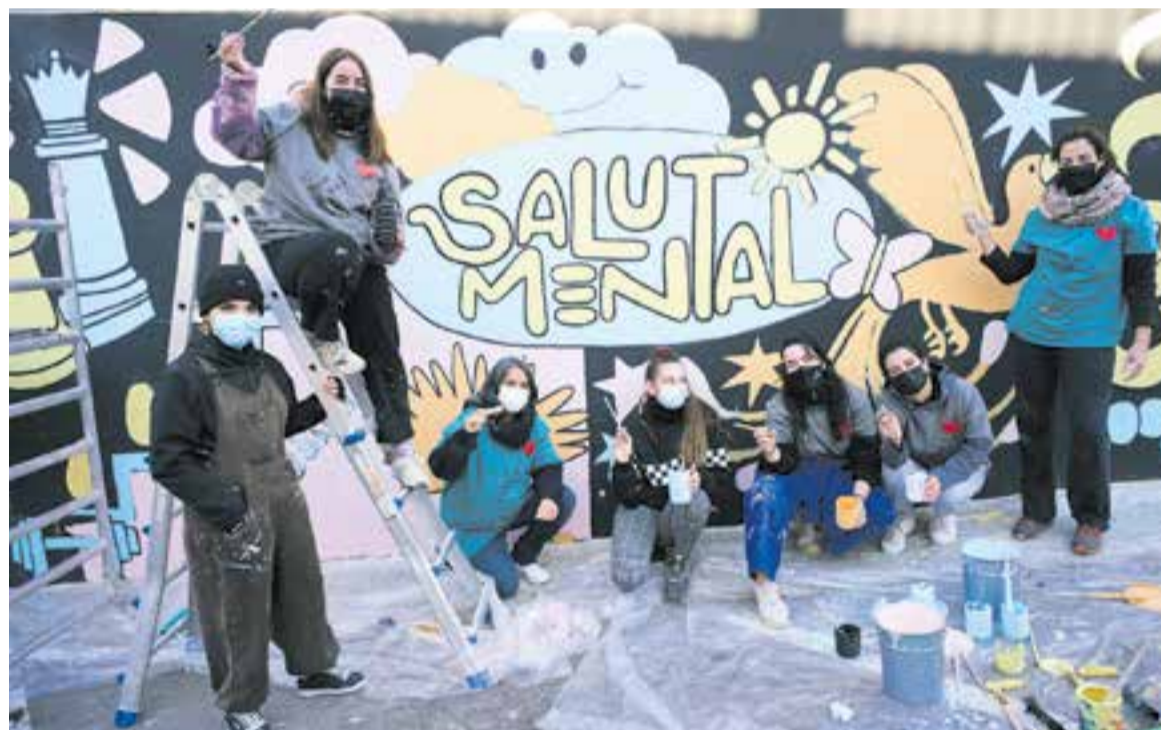
Voluntàries confeccionant el mural 'Pinta per la salut mental', promogut per Suport Castellar i Les Carnera.

Concretament, la pintada es va iniciar dissabte i va continuar diumenge per elaborar un mural per reivindicar la importància de tenir cura de la salut mental. Des de l'organització de l'activitat van convidar la ciutadania a participar-hi per expressar a través de l'art aquest clam per vetllar per la salut mental. ➔