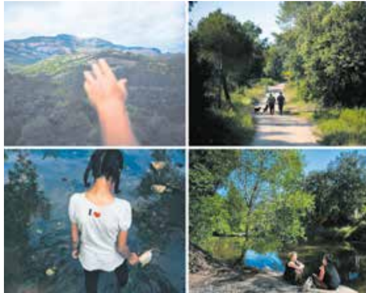
Les imatges que acompanyen els mesos de maig, juny, juliol i agost. || Q.PASCUAL