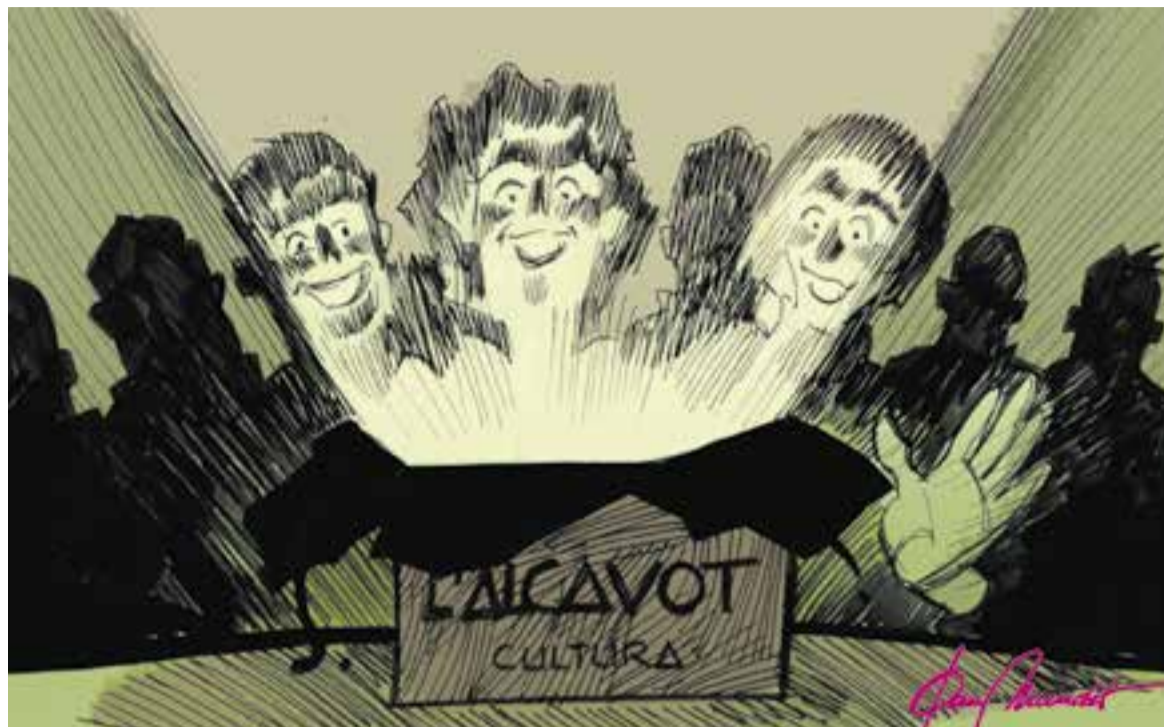
© El regal de l'amic invisible. || JOAN MUNDET

moista, director, escenògraf, autor, programador... Impulsat per aquesta estimació pel teatre en particular i la cultura en general, vaig anar madurant la idea de crear una sala, un espai de creació, desenvolupament i oferta de propostes culturals en tots els seus vessants, amb una gestió independent i complementària a la municipal. Un espai polivalent, versàtil i multidisciplinari en què tindrà cabuda qualsevol activitat cultural destinada al públic en general o bé a les mateixes entitats o col·lectius que la necessitin. Així va néixer el projecte L'Alcavot