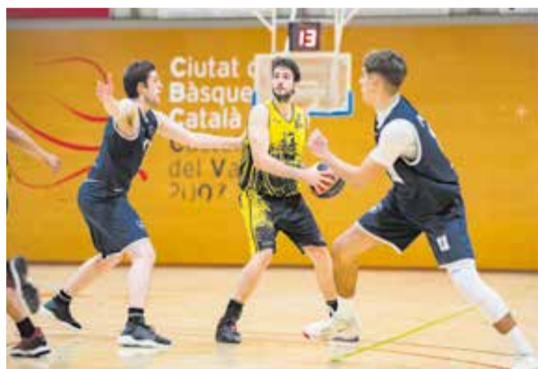
El CB Castellar va sumar la setena derrota de la temporada. || A. SAN ANDRÉS