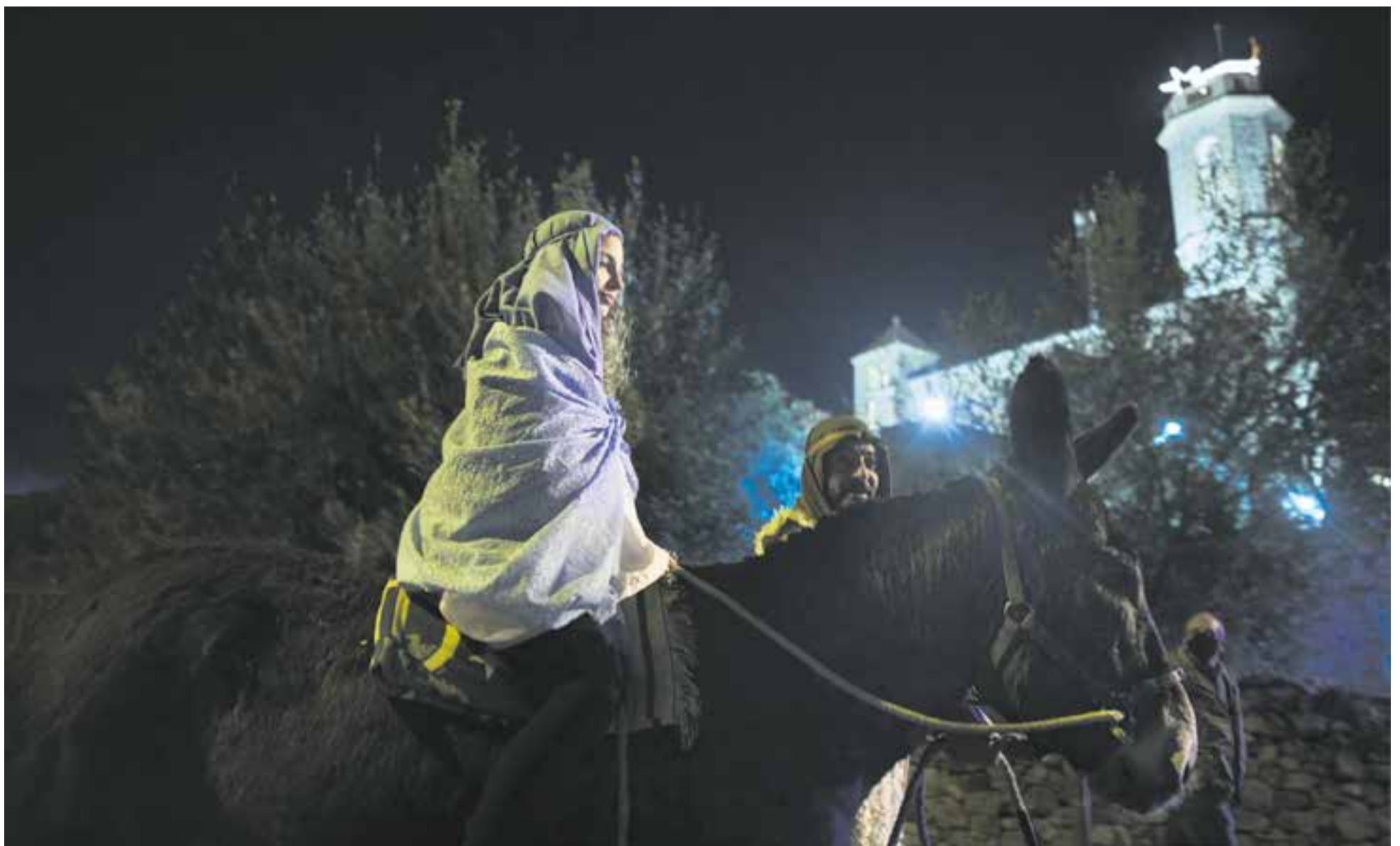
Sant Josep i la verge Maria van fer la seva entrada per la plaça Doctor Puig de Sant Feliu del Racó amb burro, com marca la tradició nadalenca.

Nadal. Per exemple, diumenge dia 2 hi haurà Quinto Capgirat amb els Castellans de Castellar, a l'Espai Tolrà. Vilabarrakes també farà quinte el dimecres dia 5, a la Sala Blava de l'Espai Tolrà. Altres entitats també han programat quintos pels socis.