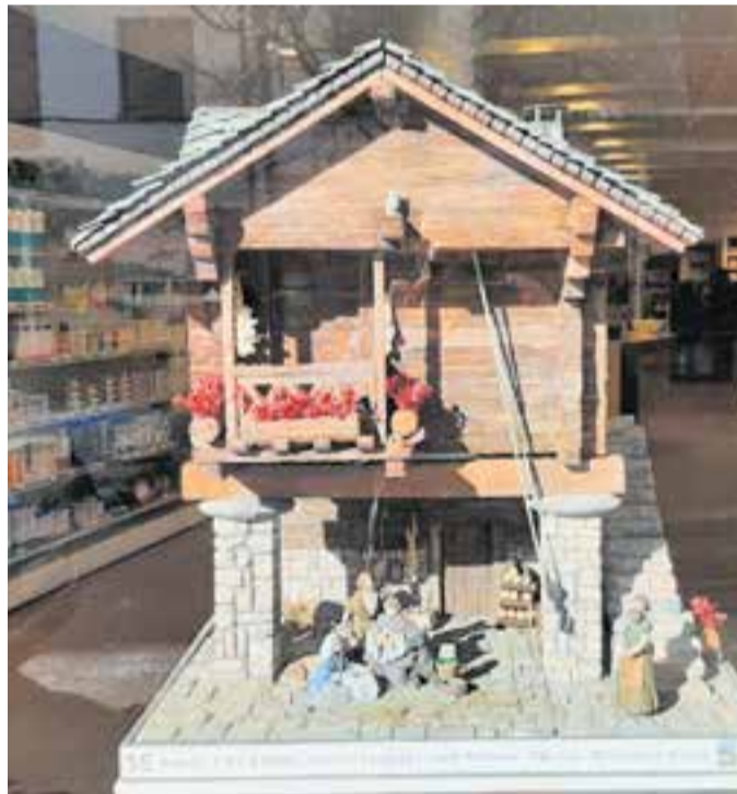
Pessebre del Grup Pessebrista Castellar a la Farmàcia Casanovas. || GRUP PESSEBRISTA

D'altra banda, aquesta setmana també s'ha col·locat al local el pessebre que fa 18 a l'exposició d'enguany. Es tracta d'una vitrina feta per l'alumnat de la Unitat d'Escolarització Compartida (UEC). +