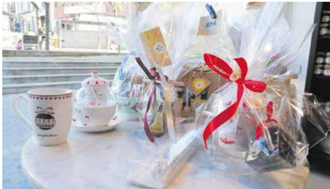
Lots de productes de proximitat que es poden trobar a la botiga La Graneria, de la plaça Calissó.

Una solució a l'hora de fer regals, per exemple, per a l'amic invisible, són els productes de proximitat. A la botiga La Graneria, de la plaça Calissó, aposten pels elaboradors locals o comarcals a l'hora d'exposar productes alimentaris a l'establiment. Per exemple, a la botiga es pot trobar mel de la marca Les Nostres Abelles "feta per un productor de mel de Castellar,