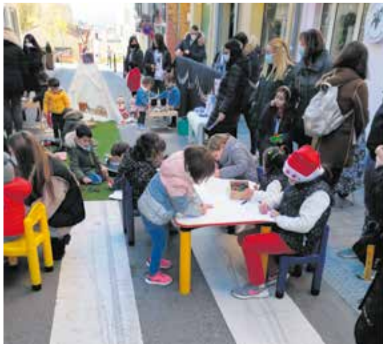
Taller infantil organitzat per l'escola bressol El Picarol al carrer Major.