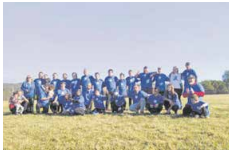
Tots els participants en la jornada de rugbi inclusiu a Castellar.

"Volem donar les gràcies a la Regidoria de Diversitat Funcional per tot el seu suport per poder celebrar aquesta trobada", han assenyalat des dels Gossos de Castellar, que han afegit que "després d'aquesta magnífica rebuda, s'està valorant crear un grup a Castellar per poder tirar endavant un possible equip de rugbi inclusiu". +