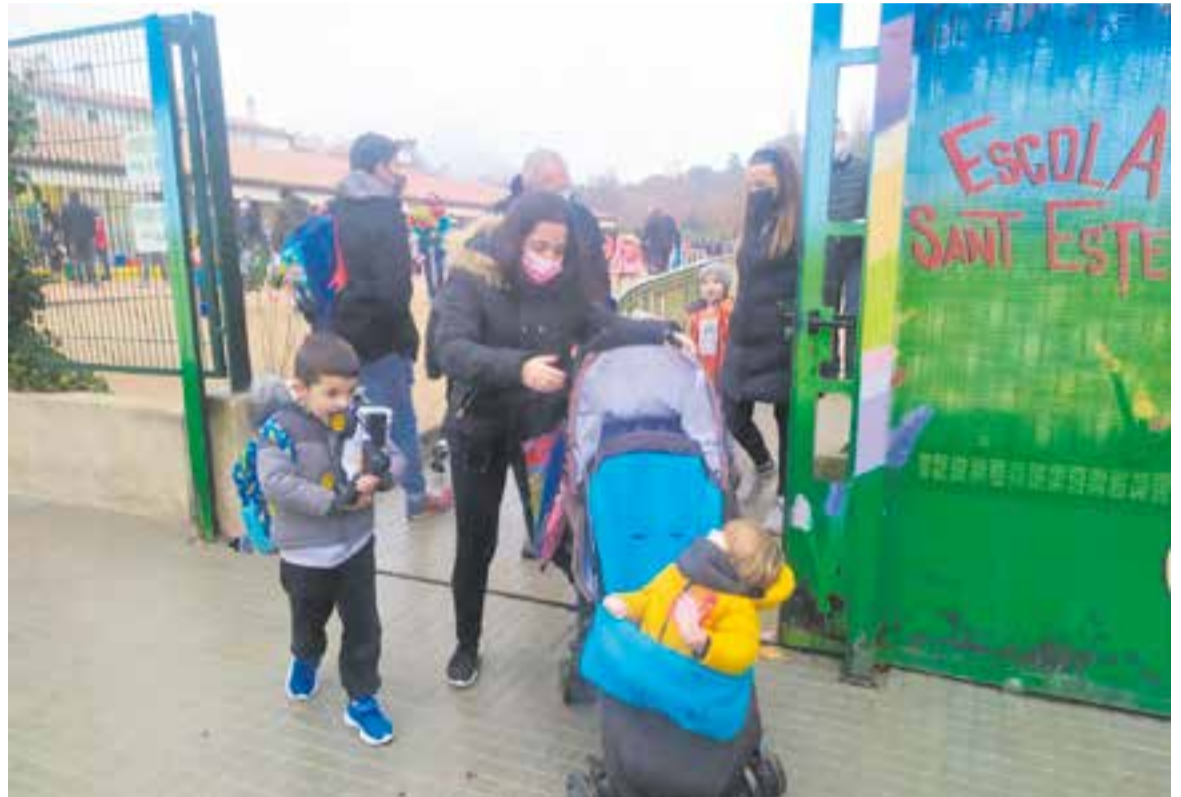
Sortida escolar al Sant Esteve, dilluns passat, dia de represa del curs.

Amb la tornada a l'escola comença la rutina i les xifres de contagi d'aquesta sisena onada no donen treva, de fet, encara s'espera que la corba augmenti fins a arribar al màxim la setmana que ve, quan es compatibilitzin els contagis de la darrera festivitats, el dia de Reis. En aquests moments, hi ha 9 persones castellarenques hospitalitzades a causa de la Covid-19, els casos confirmats són de 520 en els darrers 7 dies i el risc de rebrot se situa en 4.604 punts. La pitjor notícia és que Castellar ha tornat a patir dues defuncions a causa de la pandèmia després de gairebé mig any sense tenir-ne cap víctima. “És la tendència a Catalunya i a l'Estat. La quantitat és alta, però per sort, les afectacions greus