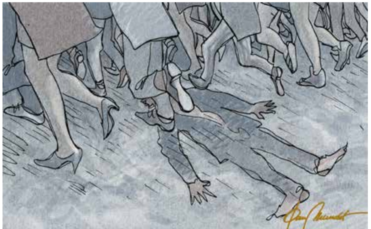
© La massa animal. || JOAN MUNDET

En la meua modesta opinió, després de 4.000 milions d'anys d'evolució, crec que cal ser conscients d'aquest privilegi privatiu de l'ésser humà i fer-ne un ús "intel·ligent". És ben cert que la capacitat humana de raonar no té moralitat, és allò que és. És l'individu qui ha de fer un bon ús de les atribucions pròpies de la seva espècie amb aquesta ment abstracta que li permet percebre pels sentits, valorar aquestes percepcions i actuar en conseqüència (lliure albir). En l'exercici de la seva intel·ligència, un lladre també pensa com evitar ser enxampat, un assassí pot arribar a planificar un crim perfecte, les velleïtats d'un dictador poden provocar la mort de milions de persones. Afortunadament, aquesta mateixa capacitat de raonament ha permès avenços molt importants en sectors primordials com ara la medicina, la tecnologia o l'ensenyament, per citar-ne alguns. Però trobo a faltar més aprofundiment en la filosofia i