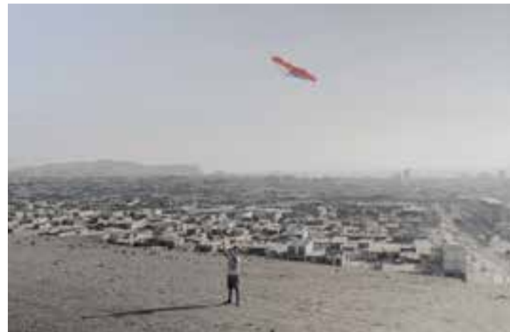
El DocsBarcelona del Mes, 'Arica', es pot veure a Castellar aquest divendres.