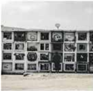
CCCV i L'Aula