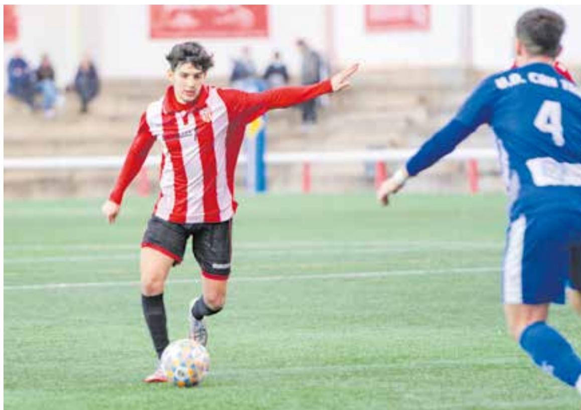
La UE Castellar va saber remuntar el 0-1 després del descans amb una gran efectivitat ofensiva.

Sense un joc brillant, l'efectivitat castellarenca va quedar palesa en el minut 54, quan Marc Ruano va aprofitar un remat al travessar de Marc Estrada per empatar el partit. Només dos minuts després, Estrada va recuperar una pilota dins de l'àrea local i no va perdonar per capgirar el marcador. El 2-1 obria un nou ventall de possibilitats en un equip que havia corregit els errors dels primers 45 minuts i que es va mostrar més incisiu de cara a porteria. Sense decaure en l'ànim, el Can