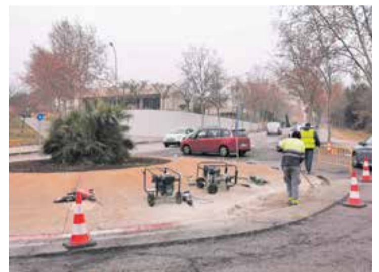
Obres de reasfaltatge de la ronda Llevant, dilluns passat al matí.

Aquest dilluns han començat les obres de reasfaltatge del tram de la ronda de Llevant situat entre la rotonda del carrer de Balmes i la rotonda del carrer de Prat de la Riba. Mentre durin els treballs, que es preveu que s'allarguin durant tota la setmana, es manté la circulació en els dos sentits de la marxa, tot i que en moments puntuals es poden produir petits talls de trànsit. També hi haurà afectacions puntuals als accessos de camins o carrers de l'entorn. En aquests dies no es podrà aparcar en aquest tram de la ronda. + || REDACCIÓ