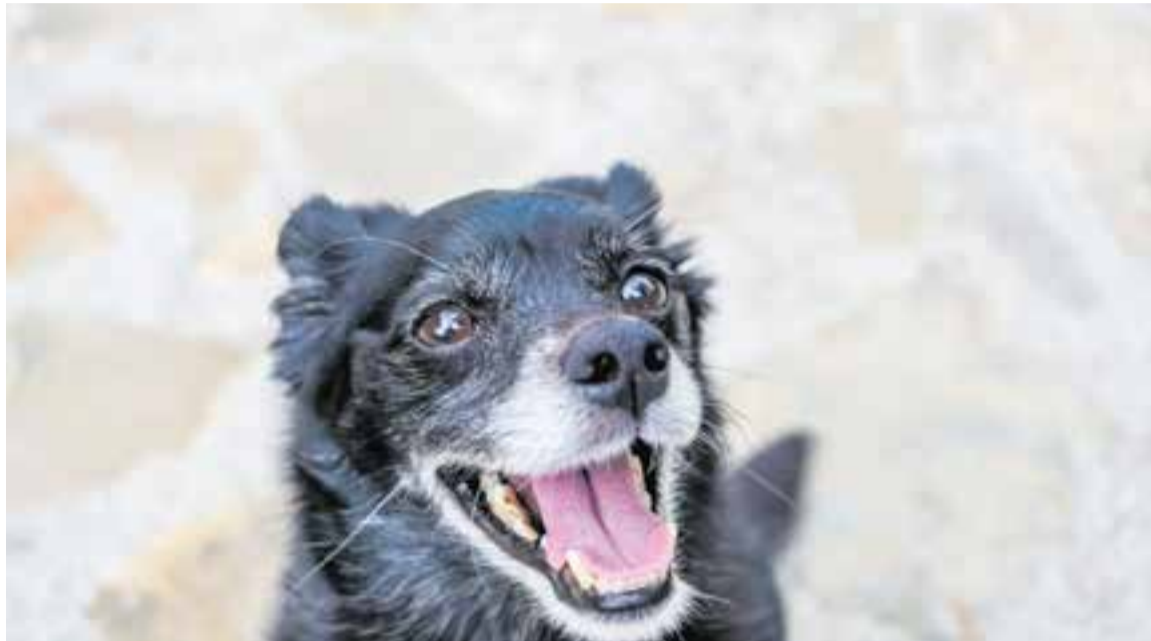
Amb la reforma de la llei, en una separació o divorci, el jutge decidirà si s'estableix la custòdia compartida o qui en serà el titular. || J. R.

Així, a partir d'ara els jutges seran els encarregats de dirimir, en cas de separació o de divorci, si hi ha custòdia compartida o quin membre