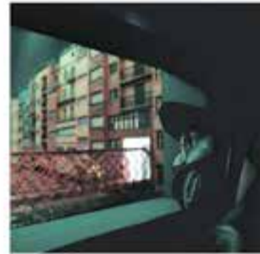
Grup Pessebrista de Castellar