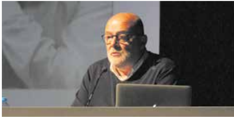
Corominas a la conferència de L'Aula aquest dimarts.

L'exvicepresident del Parlament i exalcalde de Castellar va inaugurar el segon trimestre de L'Aula