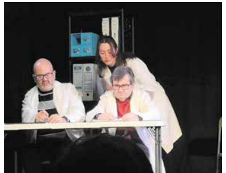
Moment de l'espectacle 'Màsters', de la companyia L'Alcavot. || CEDIDA

I el dia 30 de gener arriba la proposta de teatre familiar Projecte Mu , amb la companyia Alcavot Teatre. L'acte tindrà lloc a les 12 h. Es tracta d'un espectacle pensat per a nens de fins a 7 o 8 anys. El muntatge consta de tres contes divertits en què apareixen personatges tan diferents i diversos com una bruixa, una gallina, animalons de granja i, fins i tot, un nas que s'ha perdut i que no troba el seu amo. ➔ || M. ANTÚNEZ