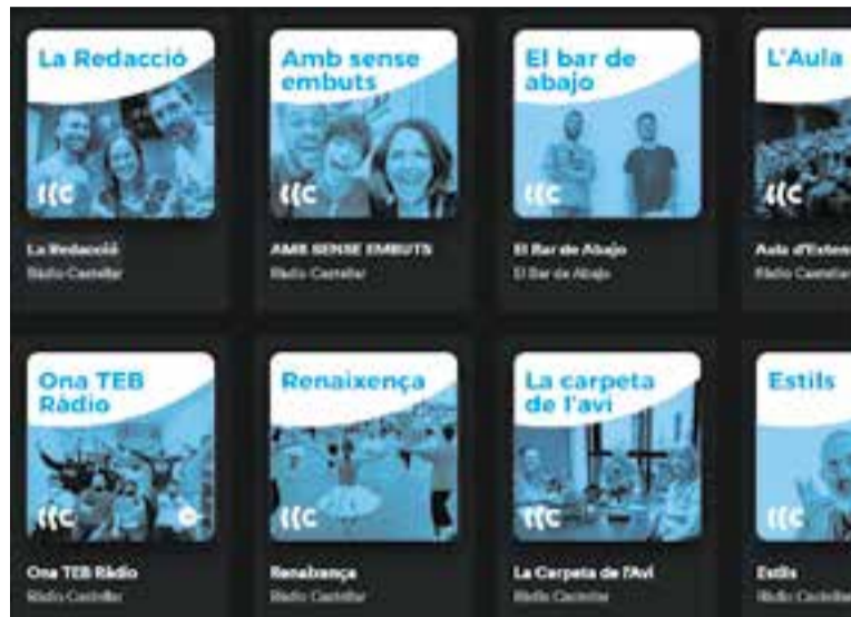
Podcasts de Ràdio Castellar a la plataforma Spotify. || SPOTIFY

En aquest sentit, el 2021 no ha millorat els resultats del 2020 que van ser excepcionals per l'impacte informatiu generat per la pandèmia, moment d'un ús intensiu del món digital com no s'havia viscut mai, i que va