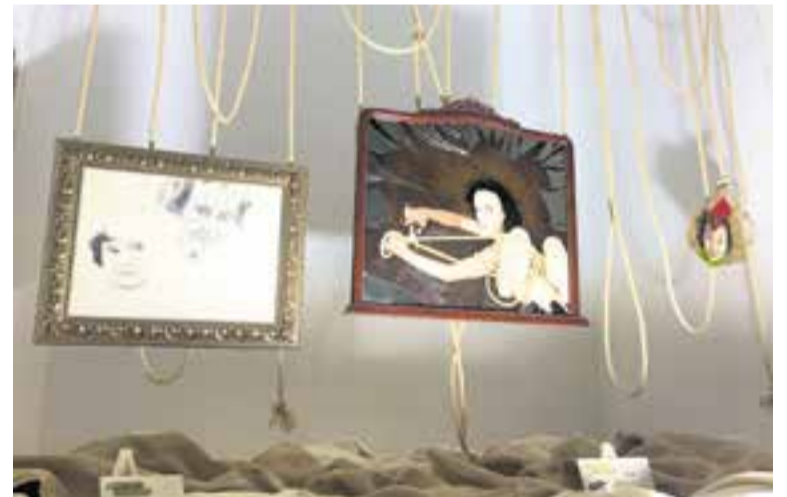
Les obres de Siro López que es poden visitar a Castellar.

L'exposició encara estarà oberta de dilluns a divendres, de les 17.15 a les 18 h, fins al 21 de gener, tot respectant l'aforament permès. L'exposició és oberta a tota la ciutadania. †