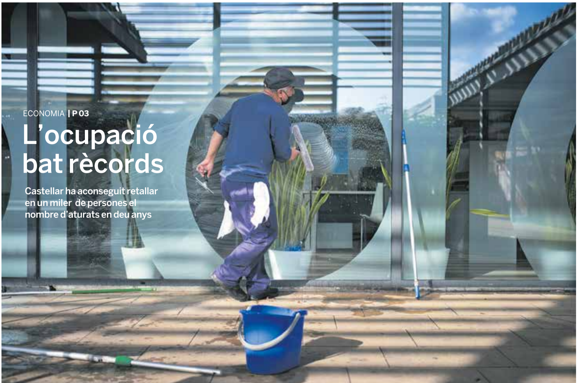
Un empleat neteja vidres a les instal·lacions d'El Mirador, en una imatge de dimecres passat. Castellar tanca el 2021 amb 954 aturats, la xifra més baixa des del 2008.

Castellar ha aconseguit retallar en un miler de persones el nombre d'aturats en deu anys