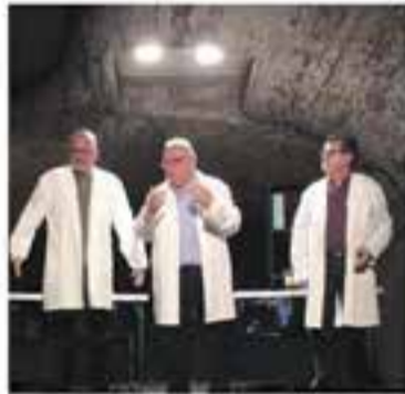
L'Alcavot Espai Cultural

Una història d'investigació impactant sobre l'abocament il·legal de residus tòxics a la ciutat xilena d'Arica. Les conseqüències van ser terribles per als habitants de la ciutat, però ningú no vol assumir responsabilitats.