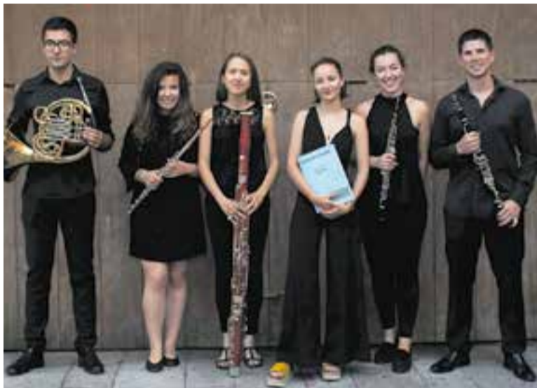
Bärhof Ensemble actua dijous 27, a les 'Audicions íntimes de L'Aula.'

Sis joves amb talent oferiran un repertori de cambra de gran format