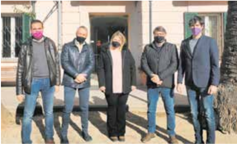
Trobada a l'Ajuntament amb el president i el director de CIPO, dilluns passat.

La Fundació CIPO té previst instal·lar un dels centres especials de treball a Castellar. Concretament, portarà al Pla de la Bruguera el Servei de Gestió de Residus, amb l'objectiu d'oferir oportunitats laborals a les persones amb discapacitat intel·lectual. El centre de treball estarà ubicat a una nau entre els carrers Solsonès i Osona, i es duran a terme les tasques derivades de la recollida