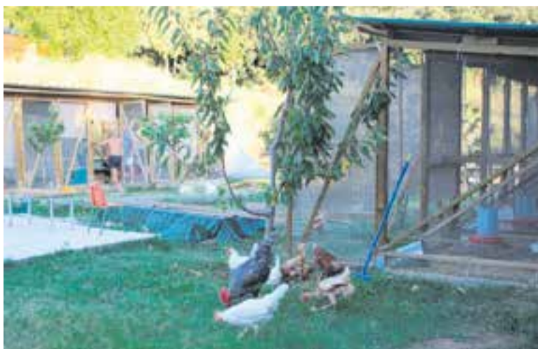
Als Horts de Puigvert l'aviram està en un espai delimitat. || C.D.

El dia més fred de l'any passat va ser el 6 gener, amb -2,5°, i els més càlids, el 12 i 13 d'agost, amb 38°, lluny del rècord històric de l'Estació Meteorològica de Cal Botafoc, que van ser els 41° que es van assolir els estius del 1994 i del 2019. +