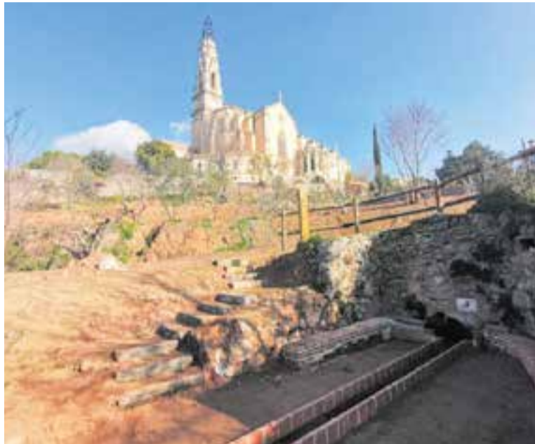
Les vorades de pedra s'estan utilitzant al parc de Canyelles.

Gràcies a aquesta iniciativa, ja s'han habilitat unes escales que donen accés a la font de les Bassetes i properament també es farà servir al parc de Canyelles per connectar la part antiga amb la part nova que s'està acabant d'enllestir. Tot plegat s'ha fet utilitzant aquestes vorades de pedra extretes en diverses obres, principalment dels carrers del Doctor Vergés, de Girona i del Pont i, properament, també se n'ex-