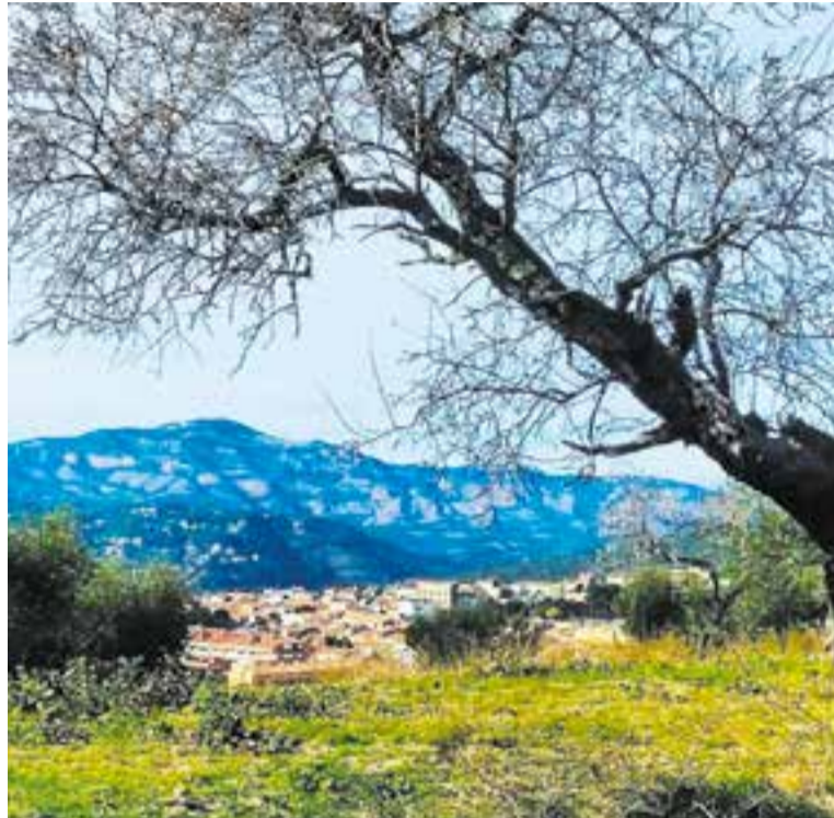
Castellar vist des del Serrat del Vent el febrer del 2020. || DESCOBRINT CASTELLAR

L'autora de @descobrintcastellar procura documentar cada foto i posar detalls de cada imatge "per si hi ha alguna persona que, com jo, està descobrint el poble" . Fins a tal punt està descobrint llocs nous que la seva parella li ha acabat dient que "em sé més racons jo que no pas ell de Castellar" . Al seu perfil d'Instagram es poden veure gairebé 500 fotos i d'algunes en rep comentaris i mencions. Gómez intenta ser constant amb les imatges que va penjant al seu perfil per anar-lo actualitzant. +