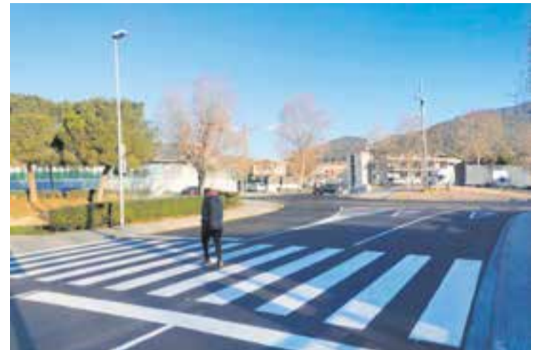
Un veí travessa el pas de vianants que s'ha asfaltat i pintat de nou.