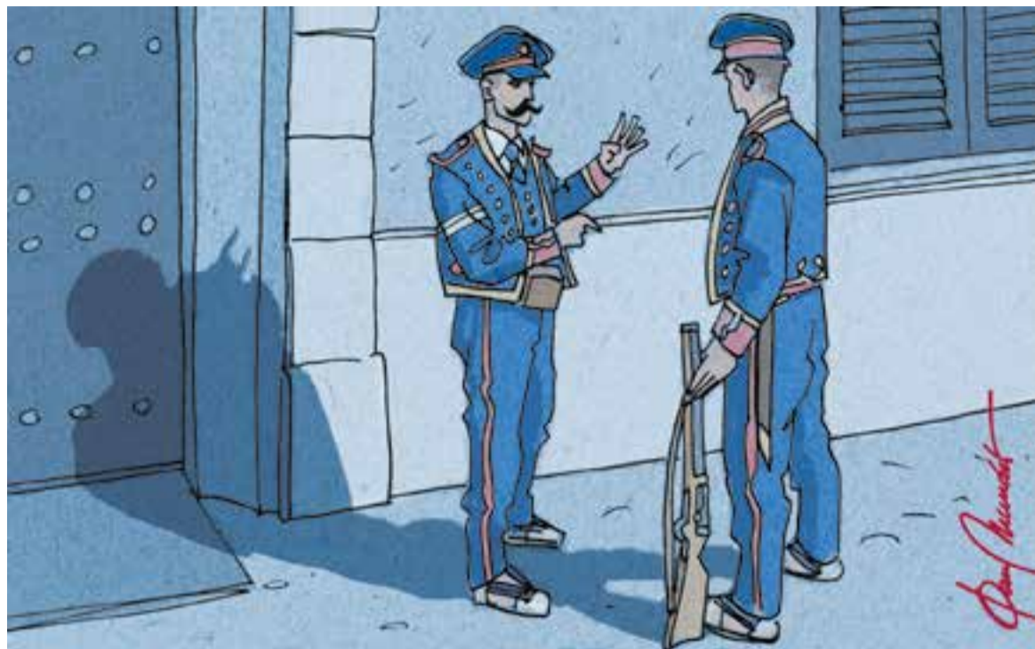
© Dos no, quatre. || JOAN MUNDET

3. Significar a la Comandancia que en este pueblo solamente se hallan siempre dos individuos, y en vista de que la población industrial requiere de sí misma más número, rogar al Il. Sr. Comandante si en lo sucesivo el número de mozos permanente puede ser de cuatro por lo menos". En l'acta de 30 de maig, el Sr. Comandante comunica la seva satisfacció per l'acord de l'Ajuntament envers la seva petició.