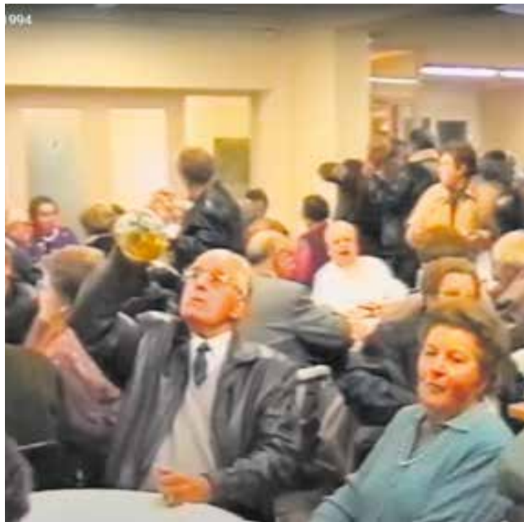
Imatge del vídeo de la inauguració del casal d'avis l'any 1994. || CANALLA VALLESANA