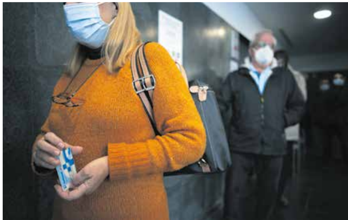
Un grup de persones fa cua a les instal·lacions del CAP Castellar en una imatge de desembre.