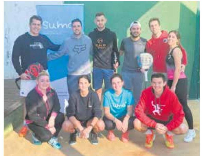
L'equip guanyador del torneig solidari de SUMA+.

El calendari de SUMA+ no s'atura. En els pròxims mesos, hi ha prevista una cursa de bicicletes i del 27 al 29 de maig, la tercera marató solidària. +