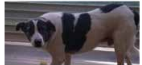
TOM // Raça: Mastí · Mascle · Pèl curt En adopció des de novembre de 2021