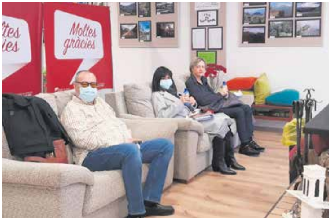
Donants castellarencs que es van apropar al Centre Excursionista de Castellar durant la jornada de donació.

Dijous, a la seu castellarenca va haver-hi un degoteig de donants que havien demanat cita. Fins a 80 persones es van apropar a la campanya, 62 persones van donar sang i dues van fer