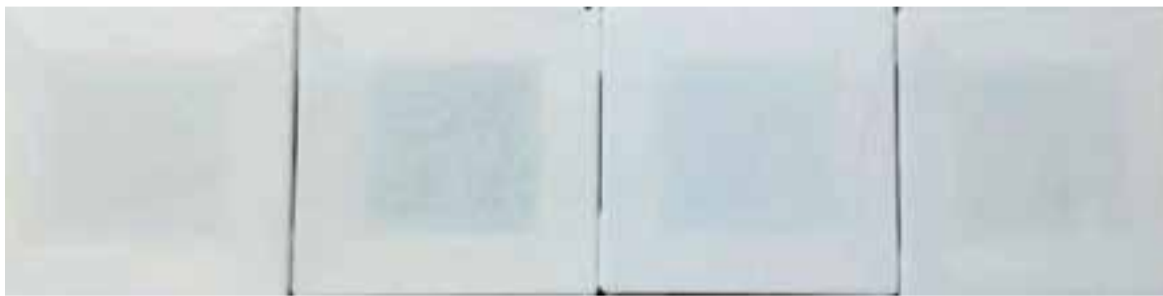
Detalls de l'obra de Neus Segalés present a la mostra: Una part d'un aixovar de dona. || CEDIDA

A més de l'obra que exposa, Segalés forma part d'una taula rodona prevista per divendres, a les 19 h, a la mateixa Acadèmia, juntament amb dos artistes més, Eme Rock i Gabriel Lecup. + || M. ANTÚNEZ