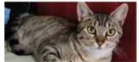
HADA // Raça: Europea · Femella · Pèl curt En adopció des de novembre de 2021