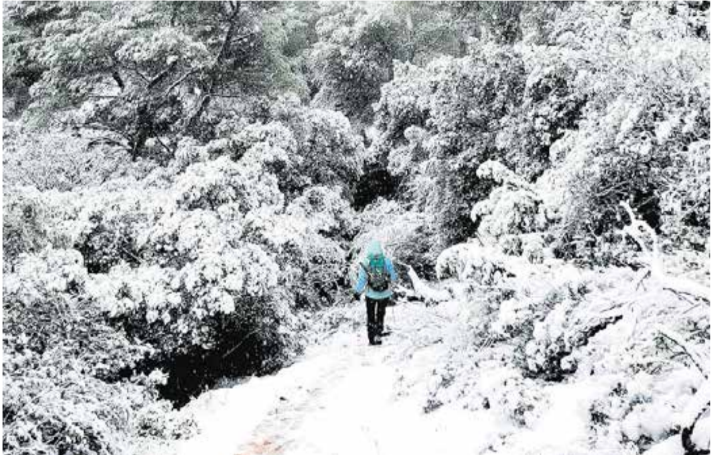
L'any 2021 va arrencar amb turbulències meteorològiques com l'enfarinada que va provocar el fenomen Filomena. || A. PORTOLÉS

Tanmateix, l'1 de gener del 2022 sí que es va igualar la temperatura rècord d'un mes de gener amb una màxima de 22°, segons els registres de Cal Botafoc. “El 2021 ha estat un any lleugerament