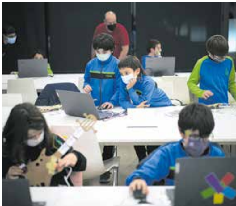
Un dels tallers al LAB emmarcat en la Setmana de la Ciència al novembre.

La nova realitat marcada pel coronavirus ha fet que els darrers mesos a El Mirador hagin estat imprevisibles, però a poc a poc, s'està tornant a la normalitat, encara hi ha limitacions d'aforament. "Partim des de zero, de nou. El Mirador que coneixíem de fa 2 anys -amb moviment de les entitats, reunions, oferta formativa...- no té res a veure amb el que ens hem trobat. No ens podem oblidar que l'oferta formativa d'El Mirador, la gent la fa per socialitzar, com a afició, per tant ha afectat molt, perquè si les restriccions recomanaven moure's el menys possible, el pri-