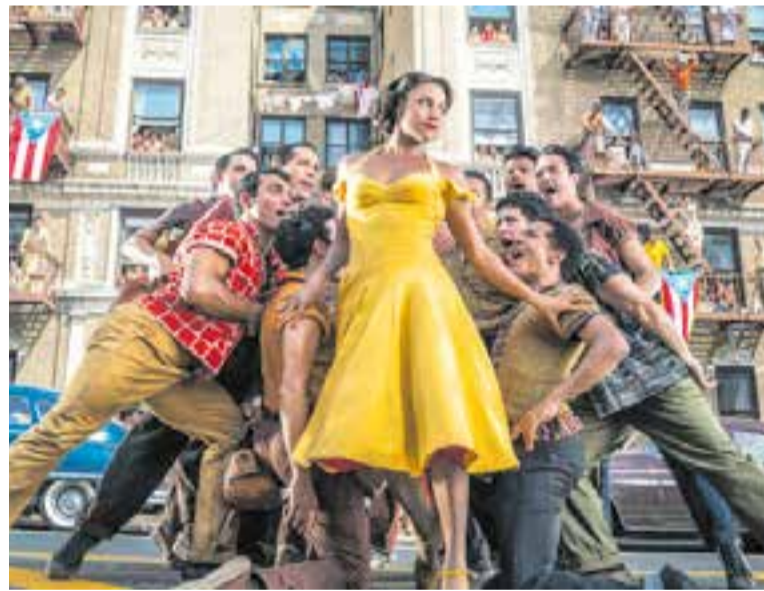
Moment de la pel·lícula musical 'West Side Story' de Steven Spielberg.

A l'Auditori, aquest cap de setmana també es projectarà altra vegada la pel·lícula Pan de limón con semillas de amapola , de Benito Zambrano. Serà dissabte, a les 21 h. + || M.A.