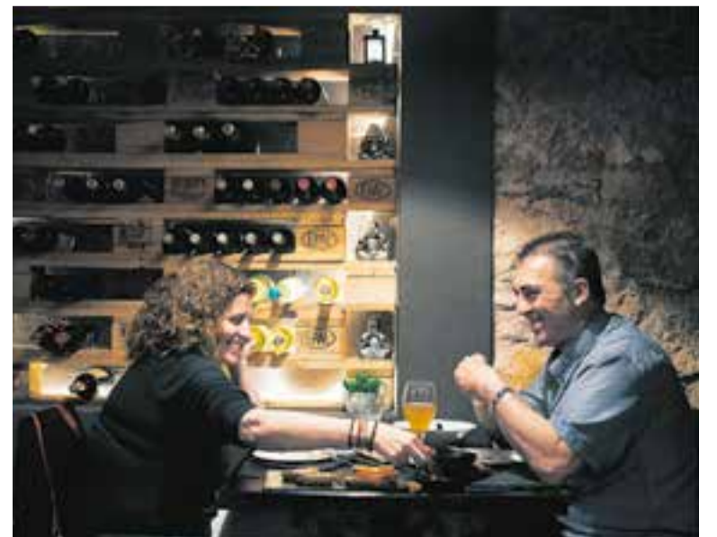
Clients del restaurant Stewart, en una imatge de fa uns mesos. || Q. PASCUAL

Tanmateix, treu una conclusió positiva del període de restriccions: “No he parat, afortunadament, i he fet canvis que en fred no m'havia plantejat. Canvis a millor”. +