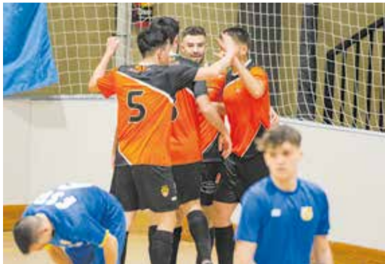
L'FS Castellar ha demostrat ser l'equip més en forma de la categoria. || A. SAN ANDRÉS

L'FS Castellar supera 4-5 el Girona i segueix colíder a falta de dos partits