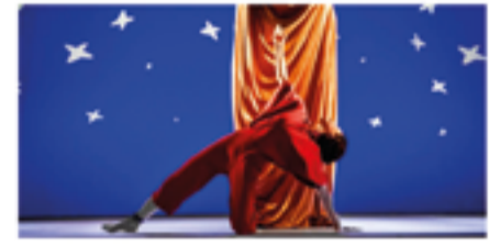
Dg. 03/04 – 12 h – Auditori MiraMiró (Teatre Principal de Palma i Baal)