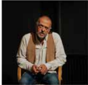
Esbart Teatral de Castellar