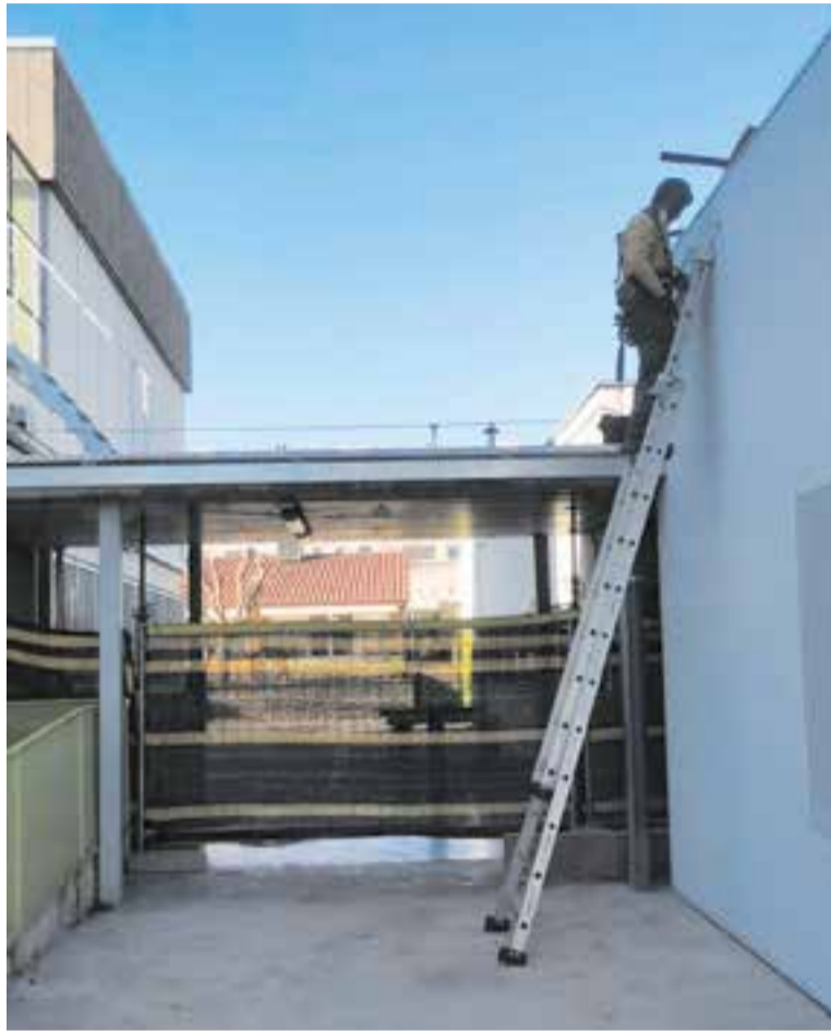
Un operari treballa en les obres actuals a l'IE Sant Esteve.