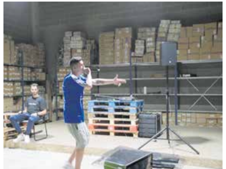
Assaig del grup 31 FAM a les instal·lacions de la discogràfica PICAP.

Tot i les dures condicions amb què s'han trobat moltes empreses, Picap veu un futur prometedori. “La idea és seguir adaptant-nos als nous temps i desenvolupar la part de grups, modernitzar la casa i tornar a fer més directes” . +