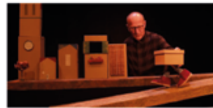
Dg. 01/05 – 11 h i 12.30 h – Auditori Sabates Noves (Tian Gombau - L'Home Dibuixat)