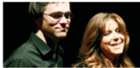
Ds. 23/04 – 20 h – Auditori Nosaltres les dones (Maria del Mar Bonet i Dani Espasa)