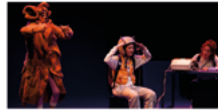
Dg. 06/03 – 12 h – Auditori Les croquetes oblidades (Les Bianchis)