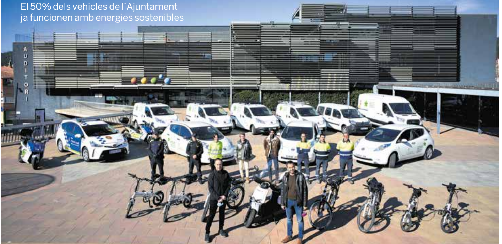
Els 20 vehicles de la flota de l'Ajuntament que funcionen amb energia elèctrica o són híbrids en una imatge de dimecres passat amb personal que els fa servir i el regidor d'Espai Públic i l'alcalde.

El 50% dels vehicles de l'Ajuntament ja funcionen amb energies sostenibles