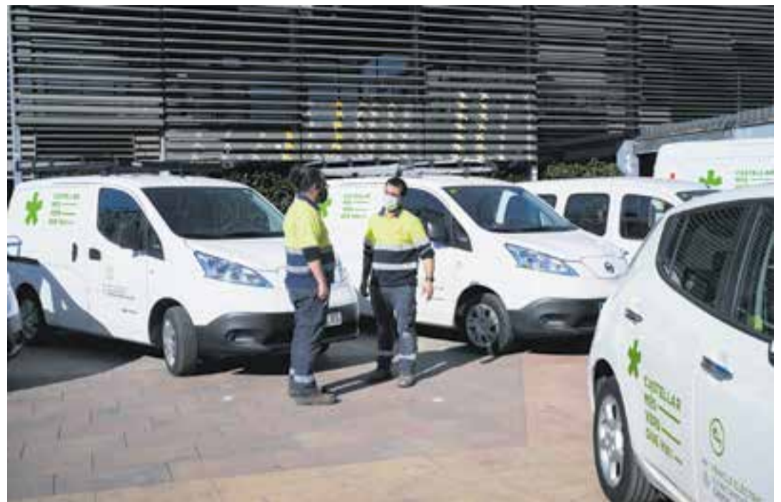
Operaris municipals amb alguns dels vehicles elèctrics del parc mòbil municipal a la plaça d'El Mirador.

La notificadora del Servei d'Atenció Ciutadana disposa de motocicleta elèctrica (Silence S02 L3 4 Kwh). Finalment,