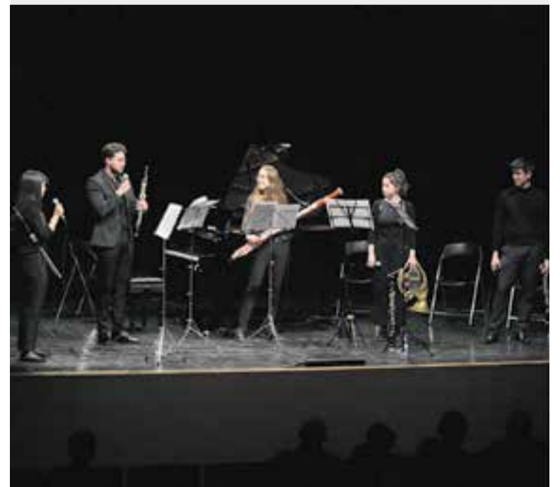
Actuació de Bärhof Ensemble a l'Auditori Miquel Pont, dijous passat.

Entre les principals dificultats de la formació, els músics van reconèixer que ara per ara hi ha poc repertori clàssic per a aquesta combinació de vent, i la personalitat de cada instrument que fa que la tasca per agermanar les sonoritats sigui intensa. La connexió entre tots sis, pura màgia i hores d'assaig, va traspasar l'escenari en la interpretació de composicions com el primer i el segon moviment del Quintet per a piano de Beethoven, que l'autor va compondre abans de perdre l'audició, i de rubricar les conegudes simfonies o els quartets de corda, “amb una clara inspiració mozartiana” , va dir Chavarría Talarn. +