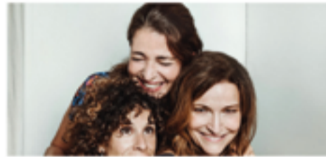
Ds. 26/03 – 20 h – Auditori Les irresponsables (Bitò)