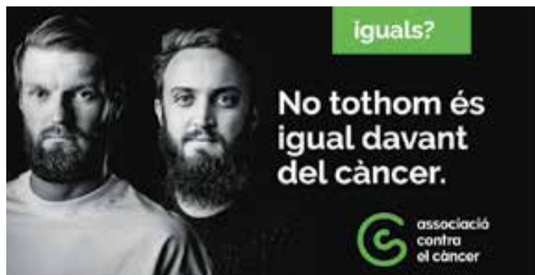
Imatge de la campanya amb motiu del Dia Mundial Contra el Càncer.

Com cada 4 de febrer, se celebra el Dia Mundial Contra el Càncer, una jornada reivindicativa per visibilitzar la malaltia, donar suport a totes les persones que la pateixen i les seves famílies. Enguany, des de l'Associació Contra el Càncer a Barcelona, la diada té per objectiu sumar esforços per “aconseguir l'equitat en el càncer” i posar de manifest “les desigualtats que existeixen, perquè el càncer és igual per a tots, però