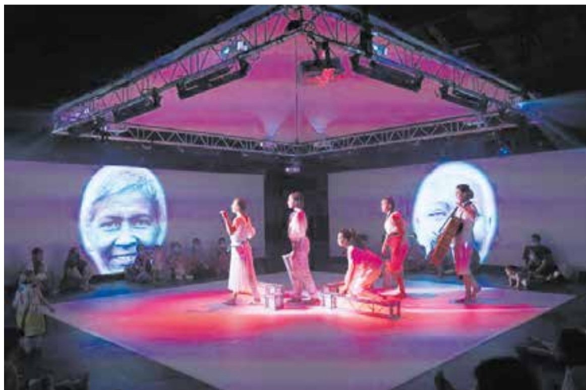
'Bob Marley for babies' de La Petita Malumaluga arriba a l'Auditori Municipal aquest diumenge.

Aquest cop, la protagonista és la música de Bob Marley, i es planteja d'una manera molt atractiva. En aquest sentit, l'espectacle compta amb una escenografia immersiva a 360°, amb un públic que se situa al voltant de l'escenari. "Sempre intentem la màxima proximitat amb l'audiència". Per això, si la Covid ho permet, també faciliten la flexibilitat perquè els nadons es puguin moure