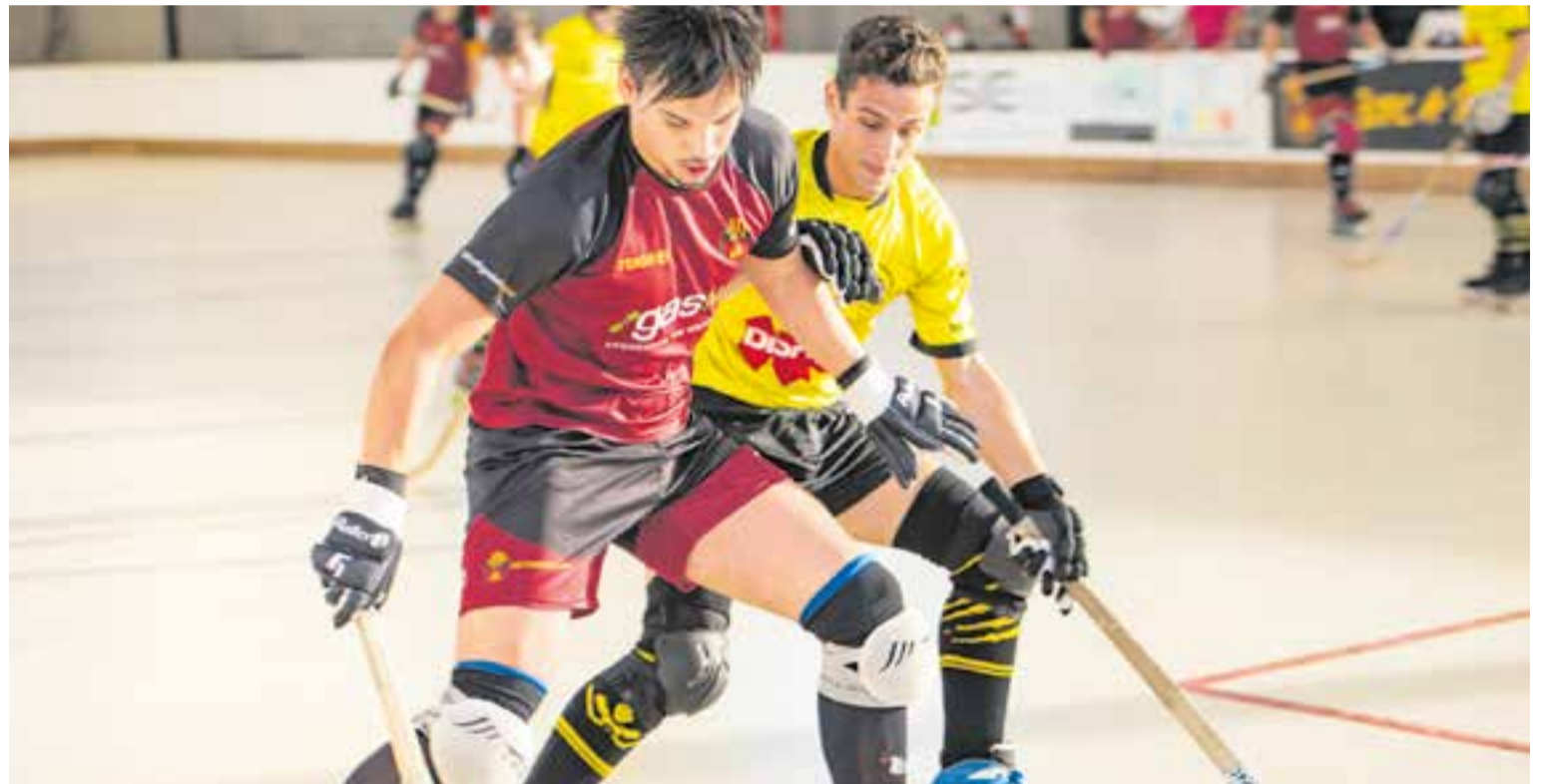
Aquesta setmana l'HC Castellar descansarà i afrontarà la segona fase com un dels favorits principals per aconseguir l'ascens de categoria.