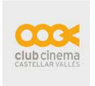
Club Cinema Castellar Vallès

+ INFO: a/e suportcastellar@hotmail.com.