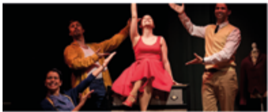
Ds. 02/04 – 20 h – Sala de Petit Format de l'Ateneu Mistela Candela Sarsuela (Epidèmia Teatre)