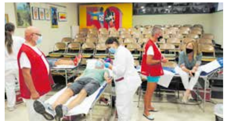
Imatge d'arxiu d'una jornada de donació de sang al CEC.

De forma general, pot donar sang qualsevol persona que tingui bona salut i que compleixi les següents condicions bàsiques: tenir entre 18 i 70 anys, pesar 50 quilos o més i en cas de ser dona, no estar embarassada. + || REDACCIÓ