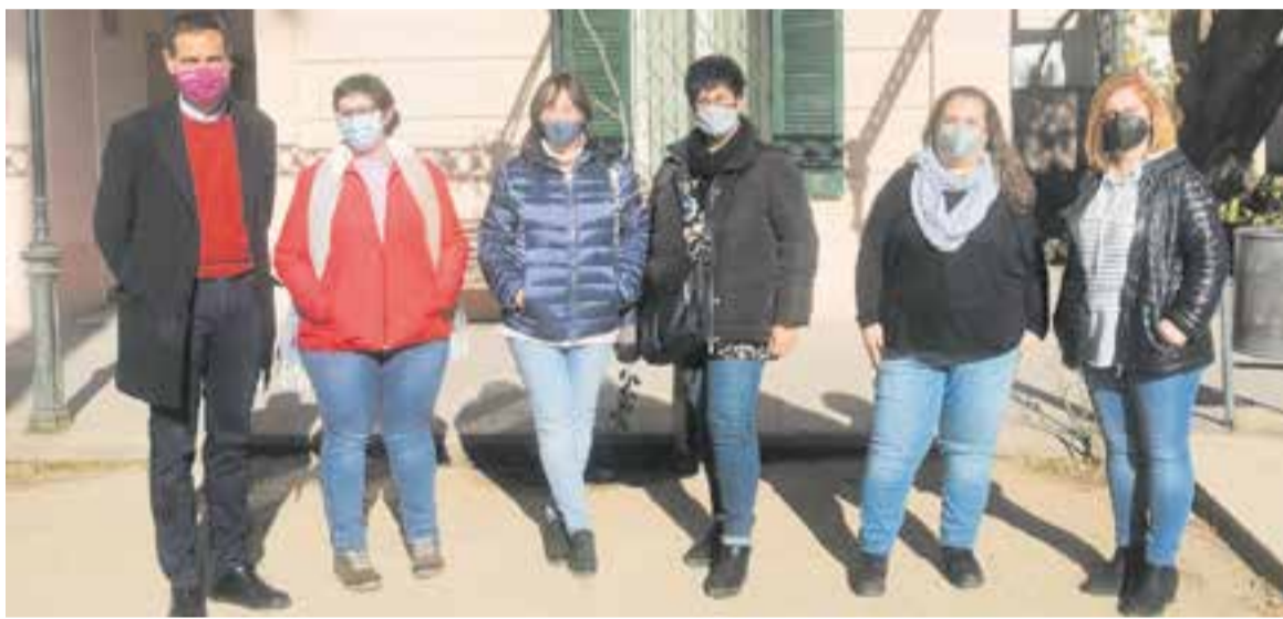
Part de les persones aturades que s'han incorporat a l'Ajuntament a través de plans d'ocupació. || A.J. CASTELLAR

El cost total d'aquest programa és de 190.000 euros, dels quals 137.000 són finançats per la Generalitat de Catalunya, mentre que la resta seran aportats per l'Ajuntament. Per primera vegada en aquest programa se subvencionen les accions d'acompanyament tècnic que es porten a terme des del Servei Local d'Ocupació. +