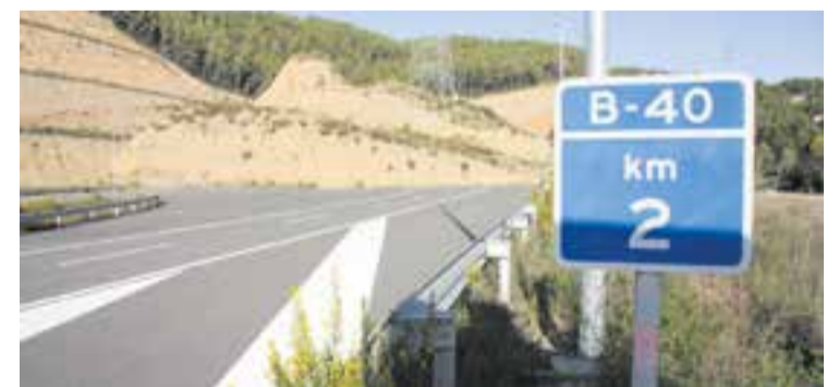
Una imatge d'arxiu del tram en funcionament de la B-40. || TERRITORI

La CCQC alerta que és el moment “d'abandonar els projectes del passat i afrontar els problemes de la conurbació del Vallès”, una àrea amb 875 quilòmetres de xarxa viària, des de la qual es produeixen 845.000 viatges interns dins de la comarca, a més dels 580.000 viatges cap a Barcelona que s'originen des de la comarca, segons dades de la Campanya. És per això que els responsables de CCQC demana que “les administracions deixi d'apostar per aquestes infraestructures i aposti pel transport col·lectiu”, apunta Cunill, que adverteix que “també ens hauríem de moure menys i més d'acord amb els vectors mediambientals”. ✚ || J. RIUS