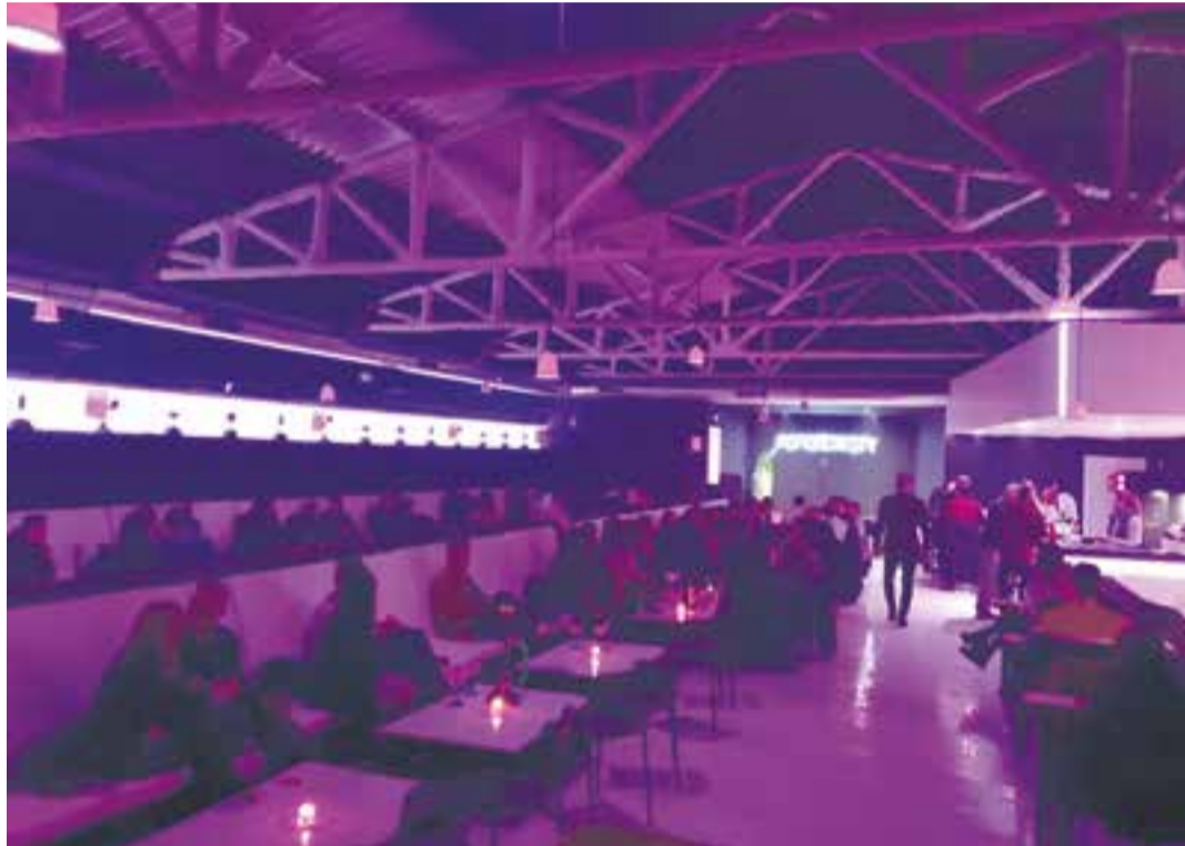
A imatge del Serendipity durant els primers dies d'obertura de l'oci nocturn a l'octubre de 2021.

El cap de setmana passat va ser el primer en què l'oci nocturn va poder obrir després de tancar just abans de Nadal. En total, des de març de 2020, el sector ha estat tancat per la pandèmia 569 dies amb 135 de funcionament molt limitat. Recordem que l'oci nocturn va haver de tancar just abans de les festes de Nadal i Cap d'Any, un dels moments de la tem-