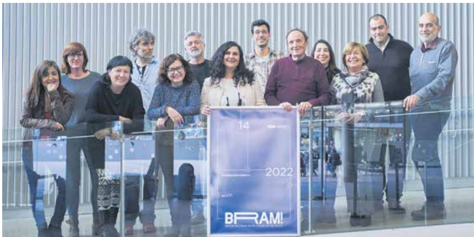
La comissió organitzadora i entitats i persones participants a la 14a edició del BRAM!, dimecres passat a la presentació del cartell de la mostra de cinema.

En total, es projectaran 13 films que ja han estat participant a diversos festivals de cinema i han rebut diversos guardons i nominacions. La 14a edició del BRAM! destaca per la diversitat en les projeccions que es podran veure. S'ha fet una tria que inclou pel·lícules que tene a veure amb el món laboral - el cas de Sis dies corrents , En un muelle de Nor-