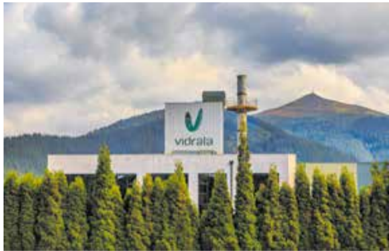
Vista de la planta de Vidrala a Castellar del Vallès.

De fet, les seves previsions parlen d'un creixement de les vendes d'envasos de vidre d'un 9,4%. La planta de Castellar del Vallès està sota l'òrbita de Vidrala des del 2005, quan la matriu va adquirir BSN Glasspack seguint un pla estratègic per aconseguir una producció a la península de 805.000 tones anuals de vidre. El grup Vidrala invertirà 600 milions fins al 2024 per consolidar la seva quota en el mercat europeu d'envasos de vidre. † || REDACCIÓ