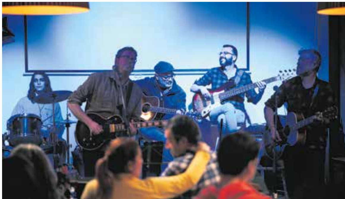
Moment de la Jam Sessions al Calissó, divendres passat.

L'11 de febrer es van reprendre les Jam Sessions al Calissó, després d'un parèntesi "perquè era complicat, pel passaport Covid i la limitació d'aforament" , diu Dani Sagrera de Cal Gorina, una de les entitats organitzadores de l'activitat, juntament amb Fun Music Club i l'Escola Arteàdia d'Acció Musical Castellar.