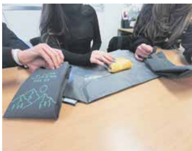
Mostra dels 'boc'n rolls' que s'han distribuït. || AJ. CASTELLAR

Podeu trobar més informació a la pàgina web www.llega800.es. + || REDACCIÓ