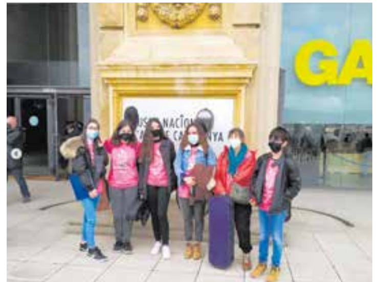
Moment del concert assaig de la Trobada Fiddle, al MNAC.