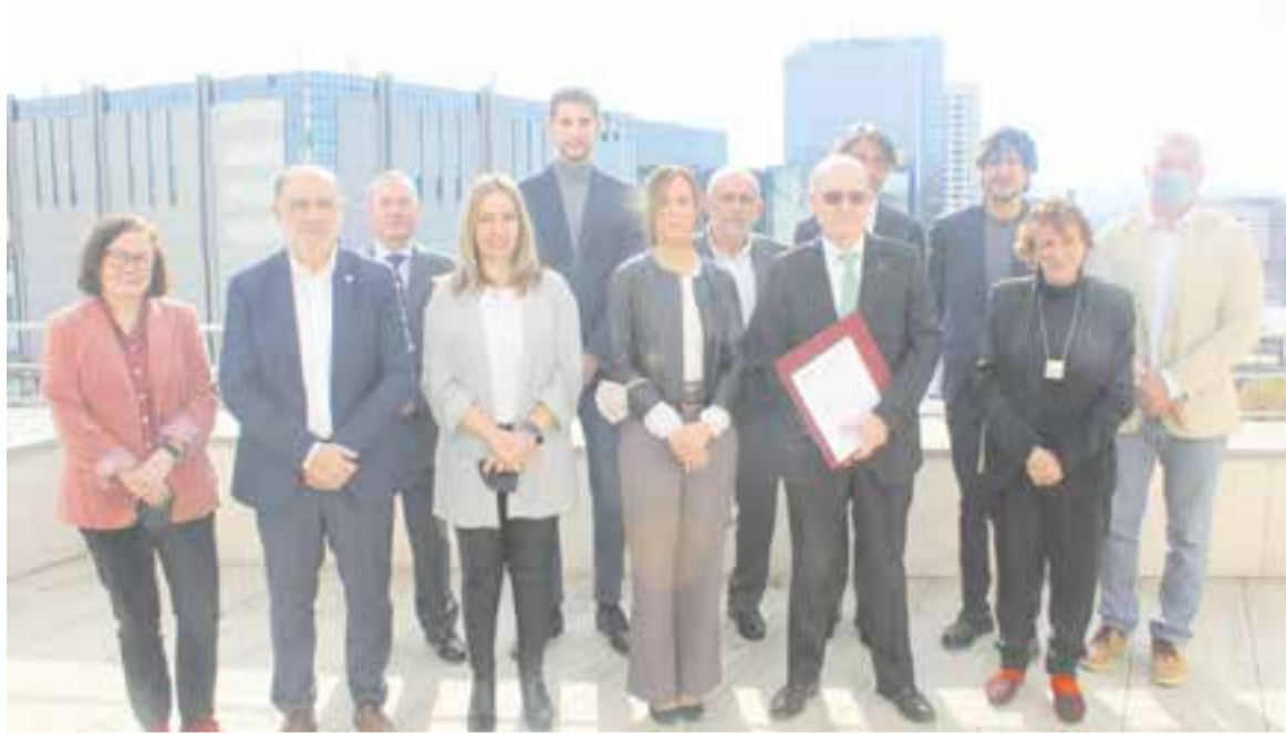
Representants del municipalisme vallesà i les entitats que reivindiquen la construcció d'un nou eix ferroviari.

La infraestructura connectaria la comarca fins a l'estació de la Sagrera