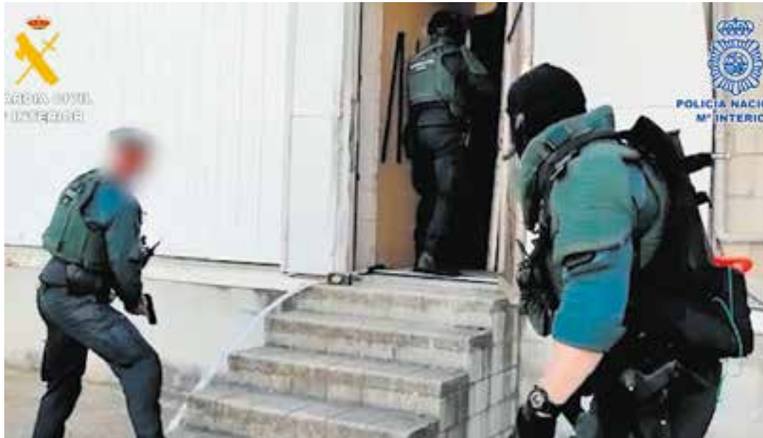
Agents de la Guàrdia Civil i la Policia Nacional accedint a una de les naus on van fer les detencions.

L'operació, segons ha fet públic aquest dijous la Policia Nacional, ha suposat també la detenció de 13 persones de nacionalitat espanyola, suïssa i marroquina, alguns d'ells violents i armats. La investigació, a més de les detencions, ha implicat fins a un total de 12 escorcolls a municipis de l'entorn de Barcelona com Sabadell, Vic, Granollers, Badalona o Santa Eulàlia de Ronçana. L'organització aprofitava la capacitat logística que havia creat al voltant de l'haixix per, a més, rebre drogues sintètiques procedents de l'Amèrica del Sud i distribuir-les posteriorment a Europa.