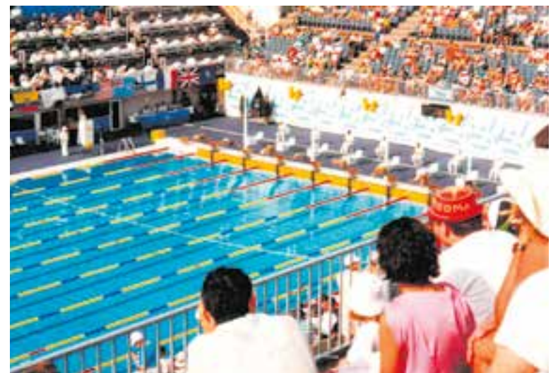
A dalt, l'estadi olímpic en una jornada d'atletisme i a baix, les piscines Bernat Picornell on es disputaven les proves de natació de Barcelona 92.