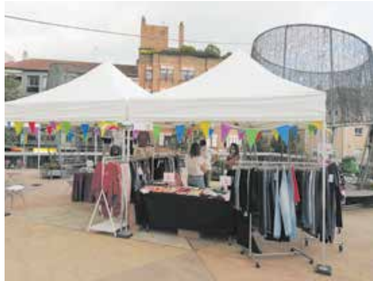
L'any passat, a causa de les restriccions, la fira es va fer a la plaça d'El Mirador.