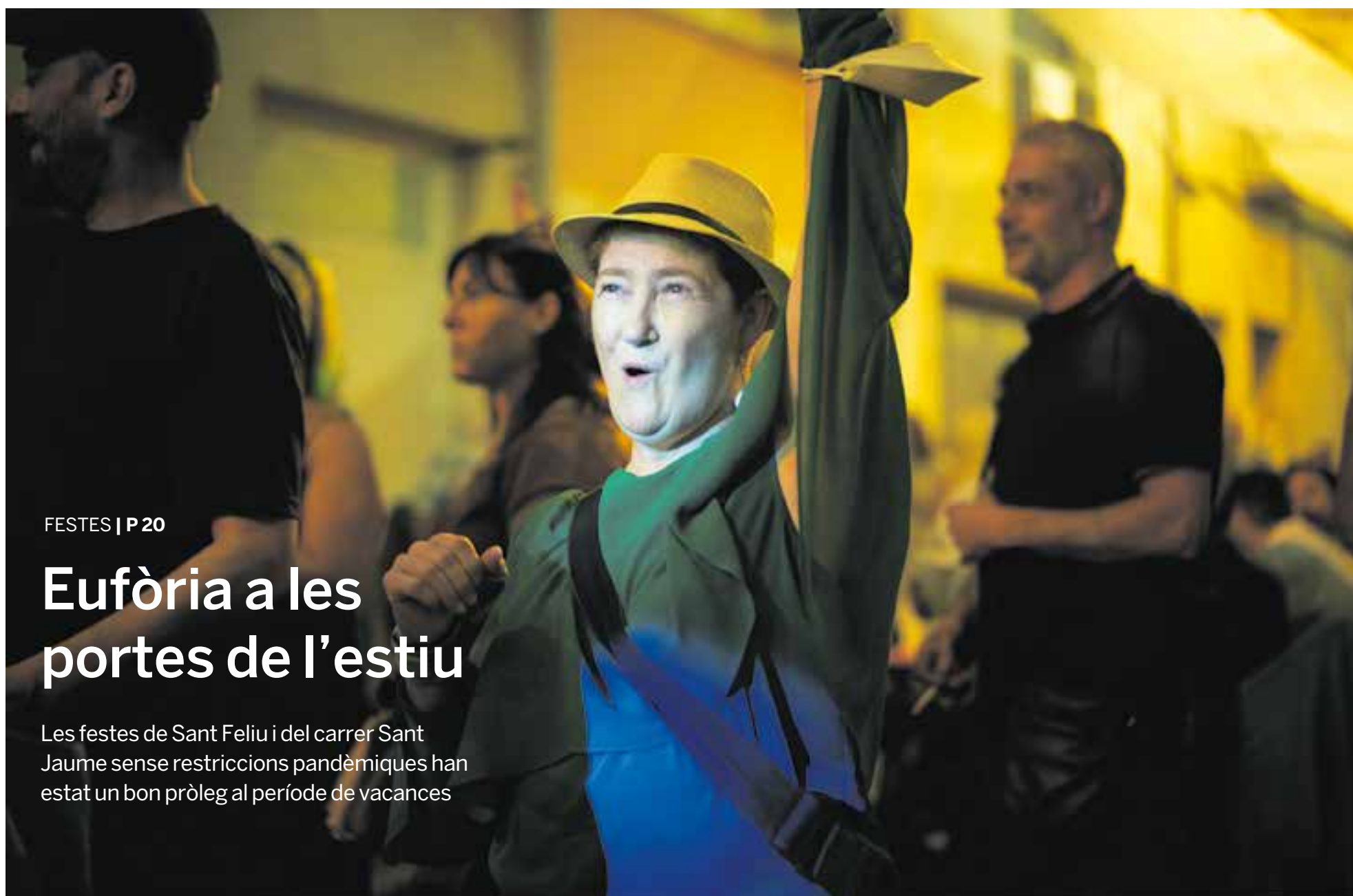
Una dona balla a les festes del carrer Sant Jaume –amb una mascareta penjada al braç– durant l'actuació de la M. Davis Band, dissabte passat a la nit.

Les festes de Sant Feliu i del carrer Sant Jaume sense restriccions pandèmiques han estat un bon pròleg al període de vacances