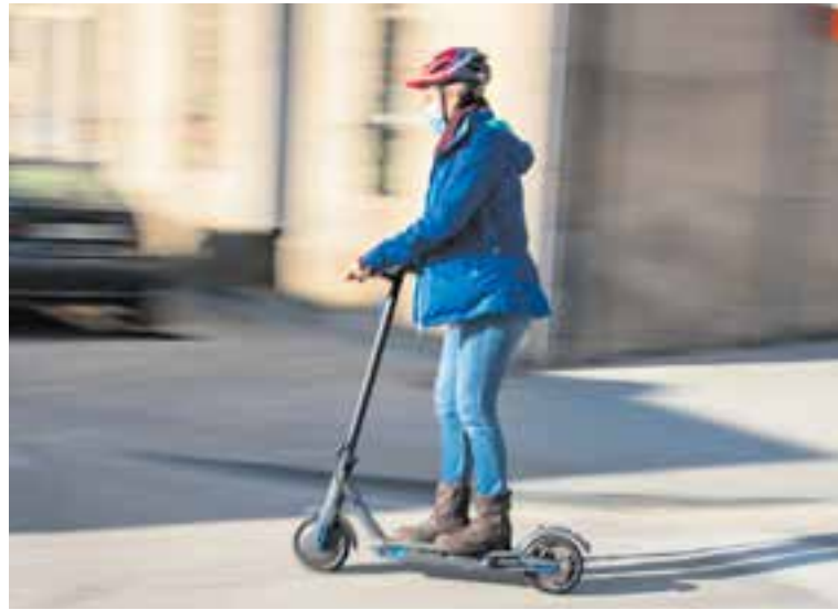
A la tardor, els patinets hauran de circular per la calçada sense superar els 25 km/h. || A. S. A.

En el cas dels patinets elèctrics i altres VMP només podran circular amb una sola persona, serà obligatori l'ús del casc i quan es condueixin de nit hauran d'estar equipats amb llums