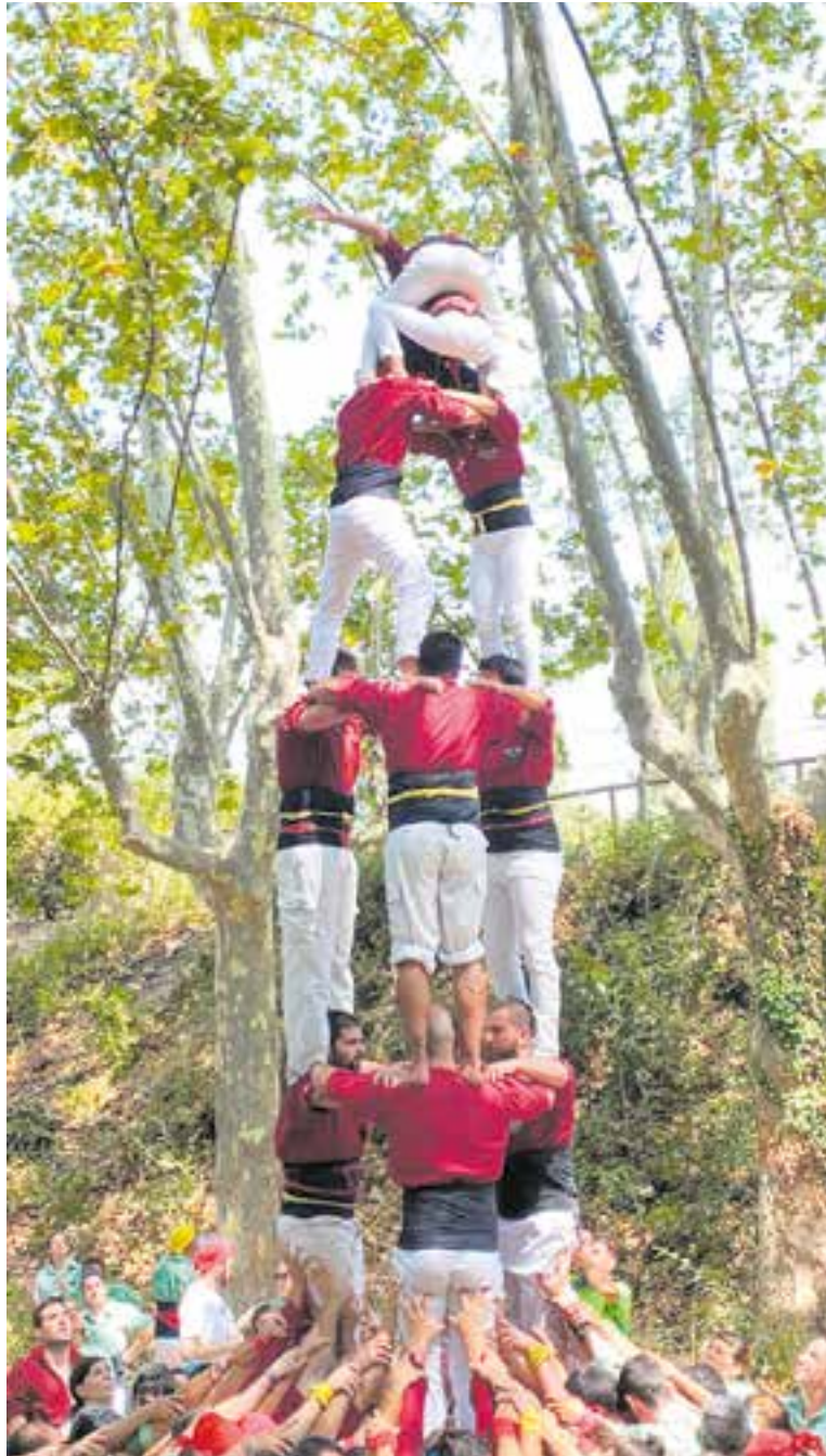
El 3 de 6 dels Capgirats a la Festa Major de Gallecs. || CASTELLERS DE CASTELLAR

Ara l'objectiu de la colla és sumar nous castellers per poder tenir pinyes més nombroses i també incorporar-hi canalla, una part clau per carregar tots els castells que es proposin i consolidar els de sis, sobretot a les actuacions fora de casa. A més a més, un dels objectius més a llarg termini és poder recuperar les estructures de set pisos que van assolir abans de la pandèmia. ✦