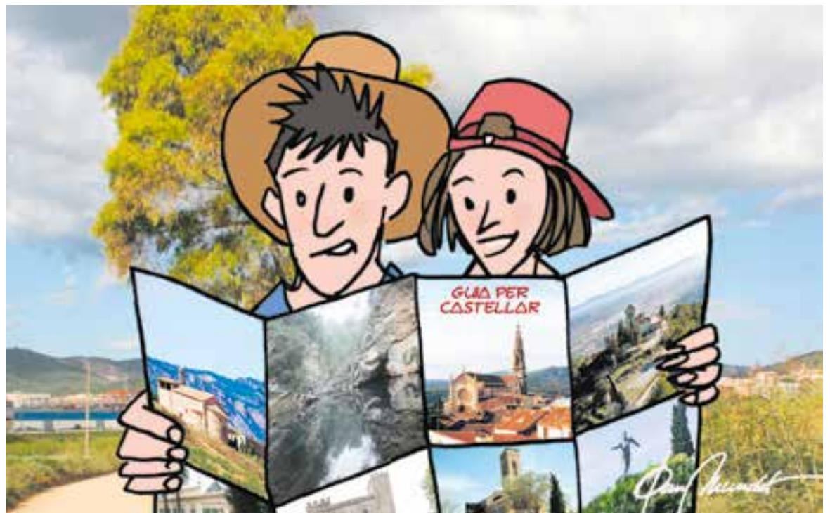
© Guia de Castellar. || JOAN MUNDET