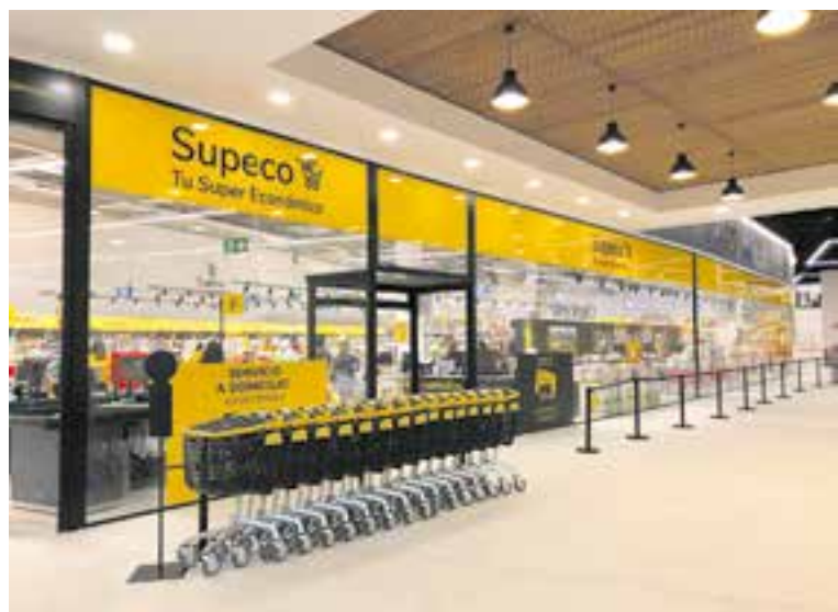
Imatge interior d'un Supeco, molt similar al que tindrà Castellar.

L'estratègia de la cadena multinacional francesa és reactivar justament la marca Supeco com a format de proximitat però vinculada a preus de producte econòmic. De fet, el concepte de súper pot recordar els inicis de Lidl i Aldi a Espanya, quan van explotar al màxim l'anomenat hard discount . +