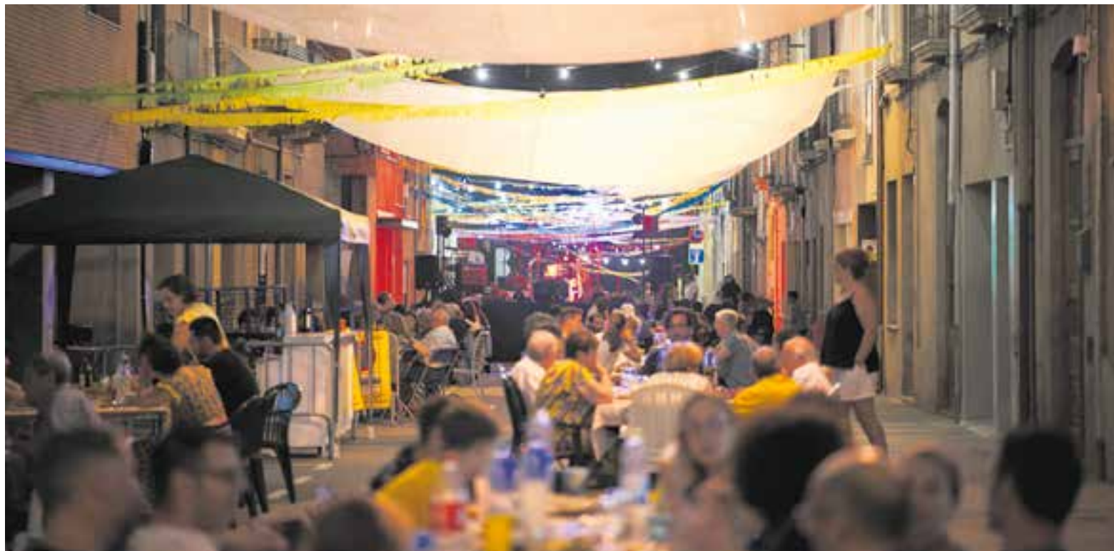
El sopar de germanor de dissabte de l'Agrupació de Veïns del Pla va concentrar nombrosos veïnat amb ganes de festa.

L'esperit de la revetlla és mantenir viu el caliu del carrer. Anys enrere havia estat una via comercial del poble molt transitada, a causa de