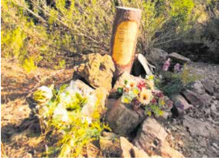
El tronc col·locat el dia 19 per l'ADF de Castellar en memòria del company mort. || ADF