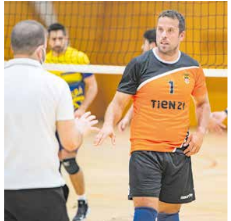
A més de ser president, Barbero també és jugador del sènior del vòlei. || A. S. A.

Abans de la pandèmia s'organitzava amb els instituts de Castellar unes jornades en què entrenadors de la casa preparaven sessions que s'impartien en les hores d'educació físi-