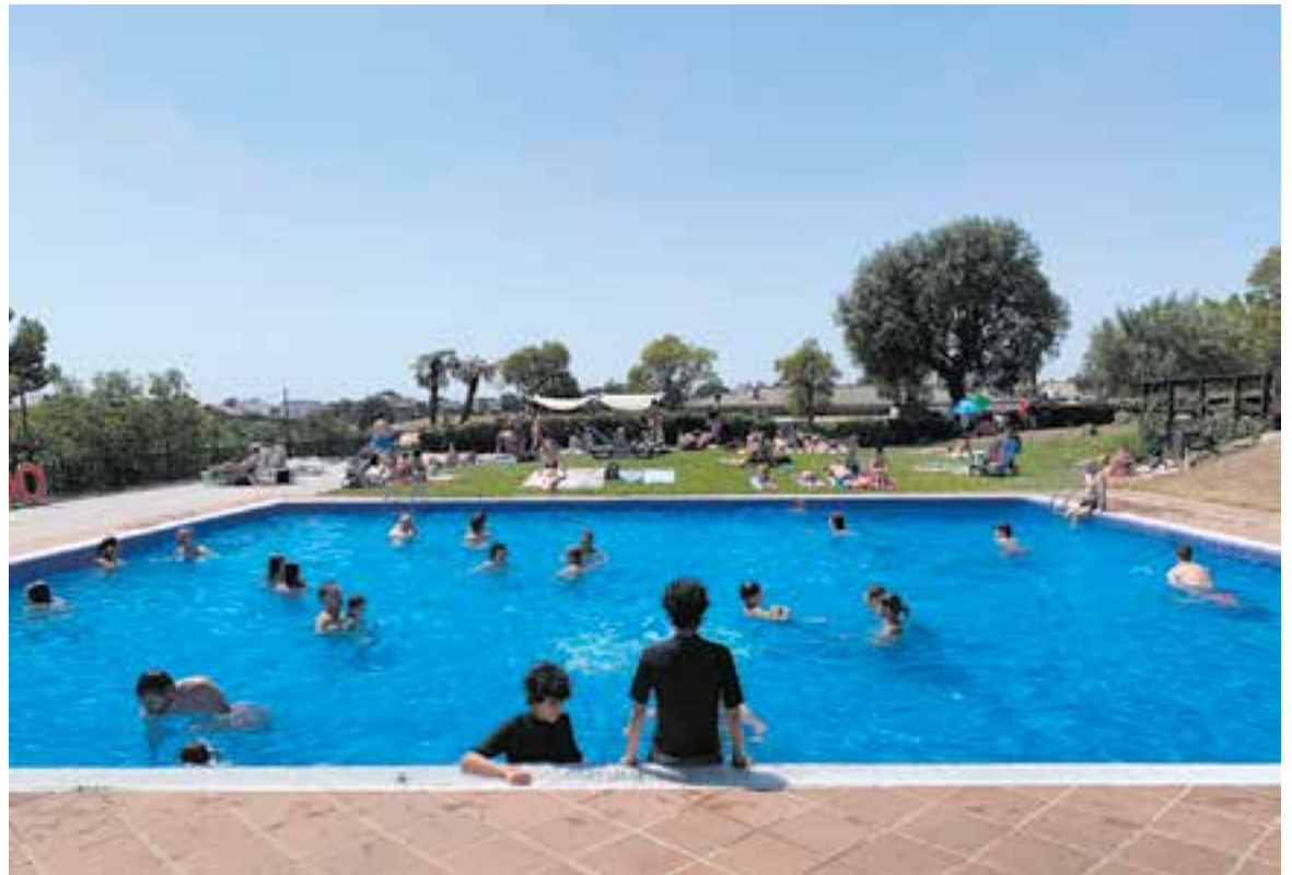
Molts castellarencs van fer ús del nou preu per entrar a la piscina de la Peña Arlequinada el cap de setmana. | PENYA ARLEQUINADA

Per tenir cura de la salut en aquesta època de l'any és molt important protegir-nos amb crema solar, també els dies ennuvolats, ja que les radiacions passen a través dels núvols. Cal reduir l'activitat física les hores de més calor i evitar