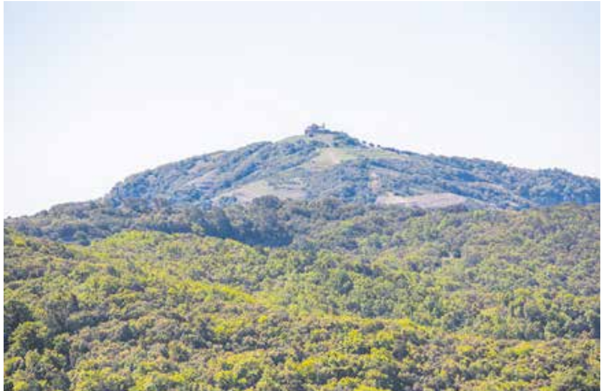
El monestir de la Mola dalt de la muntanya és el destí de moltes excursions de castellers i castelleres. || X. VILAREGUT

Durant la X Trobada d'Estudiosos de Sant Llorenç del Munt i l'Obac, que se celebrarà el 23 de novembre, està previst fer un acte institucional. Altres activitats previstes són una acció de voluntariat, el 17 de setembre, amb el Cercle de Voluntaris dels Parcs Naturals, i, el 3 de desembre, Dia Internacional de la Discapacitat, una jornada divulgativa, sobre l'accessibilitat als espais naturals, amb tallers, rutes i itineraris amb cadira Joëlette, als entorns de la Casa Nova de l'Obac. La clonada dels actes es preveu ja el 2023 amb la inauguració d'una exposició permanent al Centre d'Informació del Coll d'Estenalles.✦