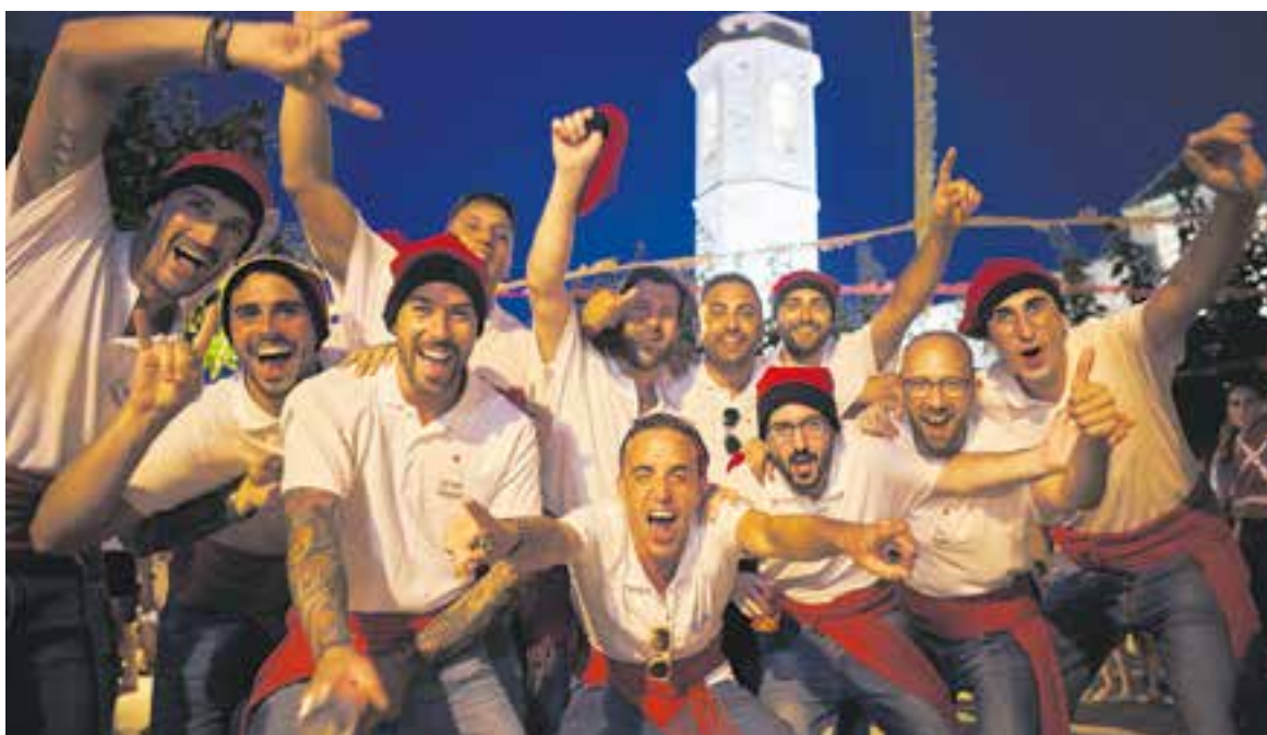
El grup que fa les cantades està format per joves de Sant Feliu.

Un dels moments àlgids del cap de setmana –que ha comptat amb gimcana, jocs, música, sopar popular, ball de bastons i sardanes– van ser les tradicionals cantades de dissabte a la tarda, una tradició de més de 70 anys d'història. “Un grup de joves del poble anem cantant per tot el poble fent cinc parades. Nosaltres anem amb un camió i la gent ens va seguint per aquestes parades. Va ser tot un èxit, unes 500 persones ens seguien, de Sant Feliu, de Castellar, de Sabadell, gent que havia viscut aquí i ja no hi viu... el grup normalment era de 15 persones, però els dos darrers anys que es van fer (abans de la Covid) vam ser 8. Ara hem aconseguit sis incorporacions noves i això ha fet que l'autoestima, les ganes i l'empenta vagi a més” . A la cançó que entonen els joves s'expliquen situacions i escenes d'actualitat pels santfeliuencs, amb paròdia i humor. “Fem patxoca. És una festa