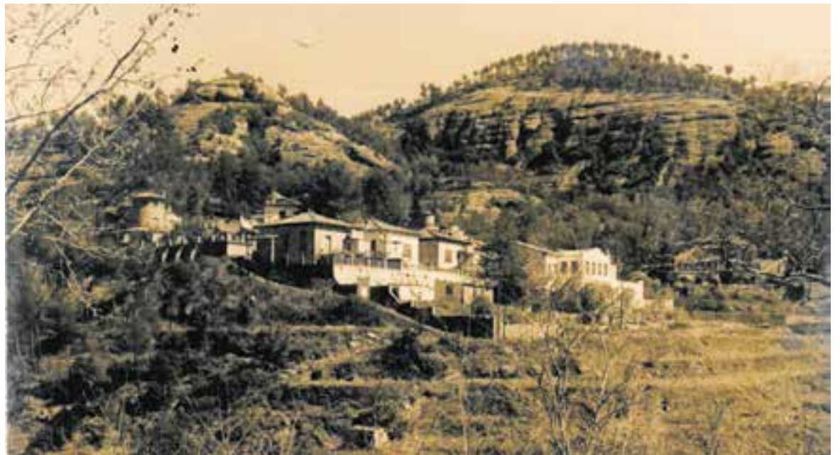
L'hostal de Les Arenes en una imatge del 1960. Al fons es poden veure els primers cingles del parc.