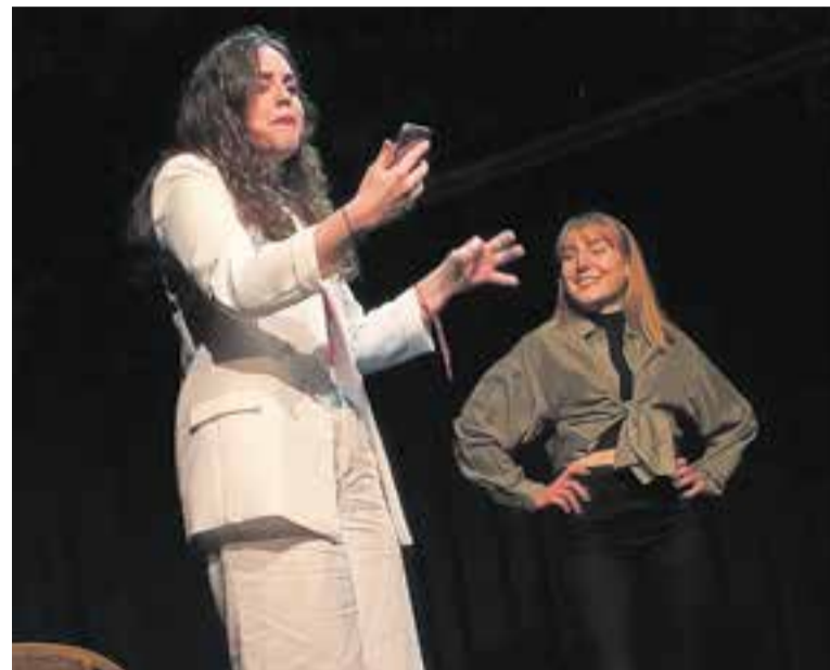
Dues de les actrius, a l'estrena de Teatràlia .

Un total de 14 actors i actrius han enlluernat el públic amb les actuacions que han portat a terme. Cal tenir en compte que tot i la inexperiència dels participants, van demostrar una gran capacitat d'adaptació i resolució dalt de l'escenari, avalada pels aplaudiments del públic. ➔