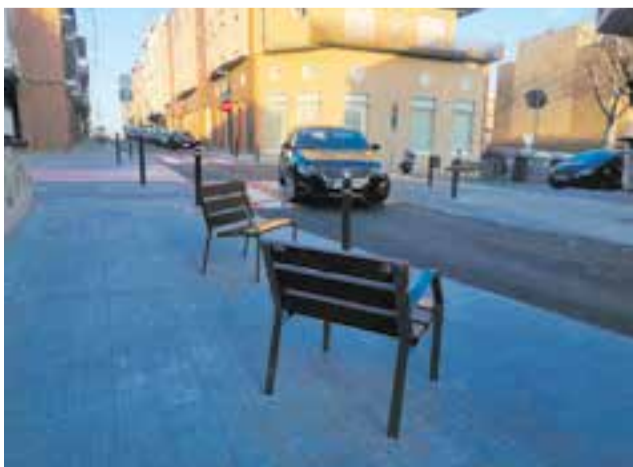
S'ha actuat entre carrer Catalunya i Av. 11 de Setembre || AJ. CASTELLAR