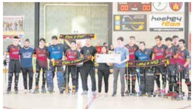
L'HC Castellar vol ser de nou equip de Primera Catalana. || A. SAN ANDRÉS

L'HC Castellar fa tres temporades que lluita per recuperar un lloc en la Primera Catalana i té la lliçó apresada de la passada campanya on es va quedar a les portes després de perdre o empatar partits decisius, que no li van permetre aquest retorn, tot i l'excel·lent campanya completada. Aquest dissabte a les 19.55 h, arrenca el primer match-ball contra el Capellades a domicili. + | A. SAN ANDRÉS