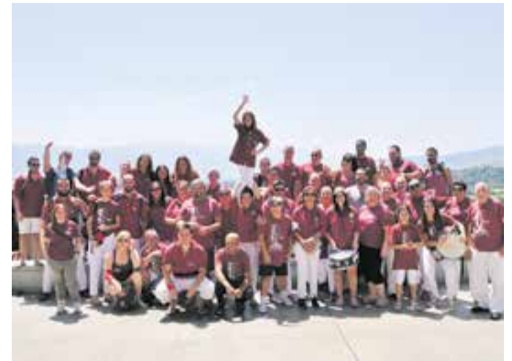
La colla dels Castellers de Castellar, a la imatge.

El 24 de febrer la Colla Castellera de Castellar donarà el tret de sortida a la temporada, que és la novena que encaren amb la camisa bordeus, amb el seu primer assaig després de més de dos mesos sense enfaixar-se. Una temporada més, els assajos els faran cada dilluns i cada divendres de 19.30 a 22 h a l'Espai Tolrà.