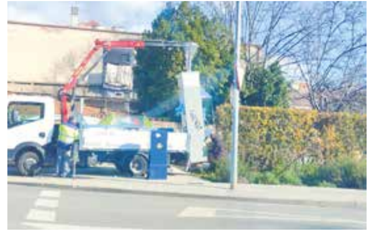
Retirada de les cabines, divendres passat.