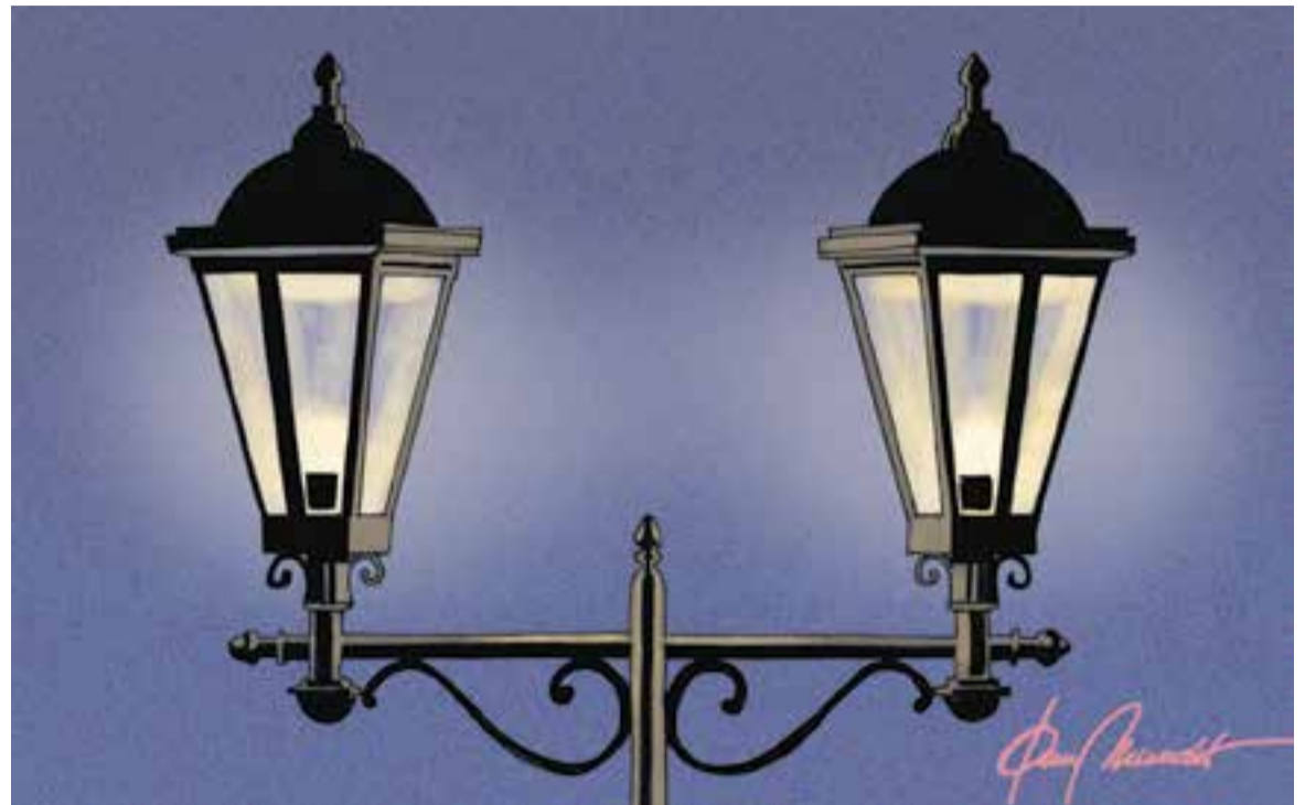
© "Farol" públic.