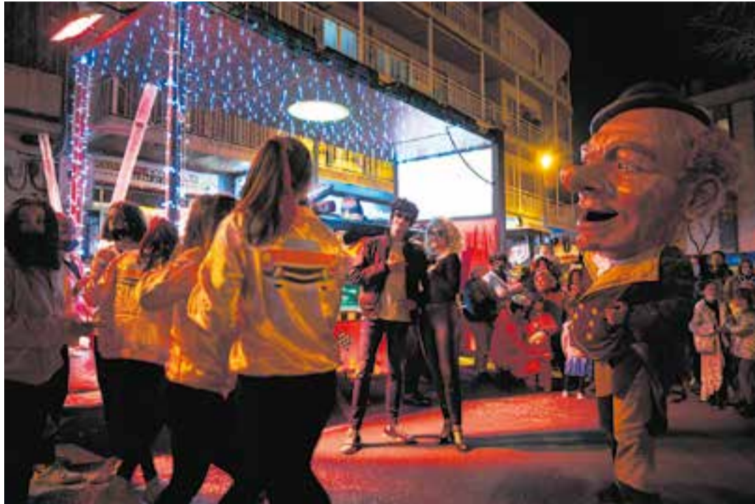
Imatge del Carnaval de l'any passat, que estava centrat en la pel·lícula 'Grease'.

L'arribada oficial del Rei Carnestoltes s'ha programat aquest divendres, a partir de les 17.30 hores, a la plaça d'El Mirador, en una gran festa que comptarà amb l'actuació de La Dona del Sac, amb l'espectacle Vols jugar? , i durant la qual es repartirà coca i xocolata entre els assistents.