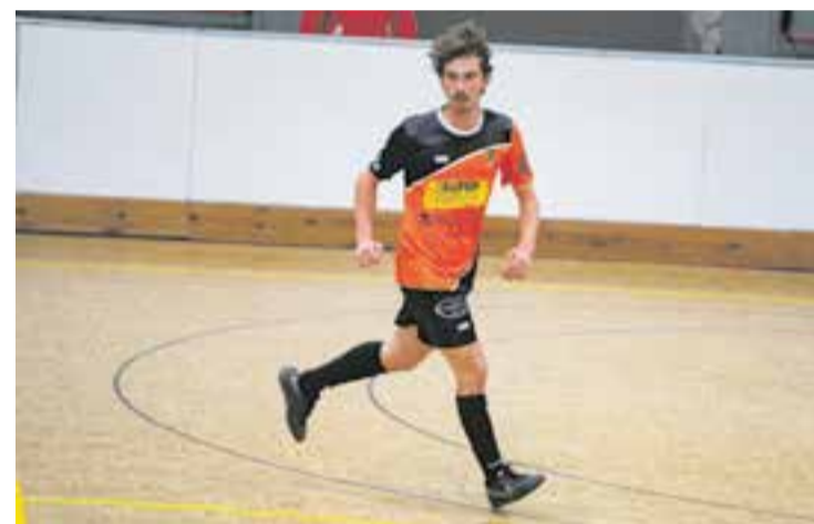
L'equip va rebre un correctiu molt dur a Sant Cugat contra l'Olympic. | A. S. A.

Tot i la derrota, la salvació continua a cinc punts de distància, ja que el Parets va perdre, el Montcada no va jugar i el Vacarisses, el seu perseguidor, va empatar a dos amb el CN Caldes, cosa que fa que l'equip segueixi amb opcions. + | A. SAN ANDRÉS