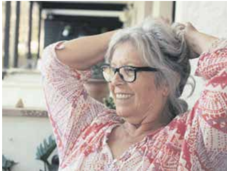
'Margalida' és el film que es projecta al BRAM! dissabte que ve. || NOVEMBRE FILMS

Va ser un procés, a poc a poc. Na Margalida ens ho ha posat molt fàcil, s'ha