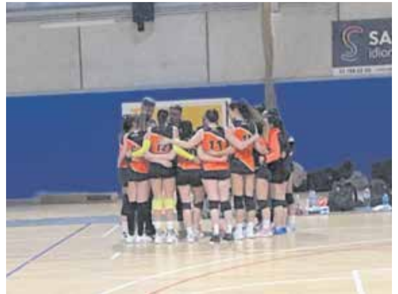
L'equip femení té la salvació a les seves mans. || CEDIDA

Pel que fa a l'equip masculí, els de Rafa Corts van caure per 0-3 (27-29/22-25/23-25) amb un Get Blume que, tot i emportar-se els tres sets, va veure com els locals li van posar les coses força difícils, ja que van quedar molt a prop en la puntuació dels tres sets. El masculí continua a la cua de la classificació del grup de promoció amb quatre punts. + | A. SAN ANDRÉS