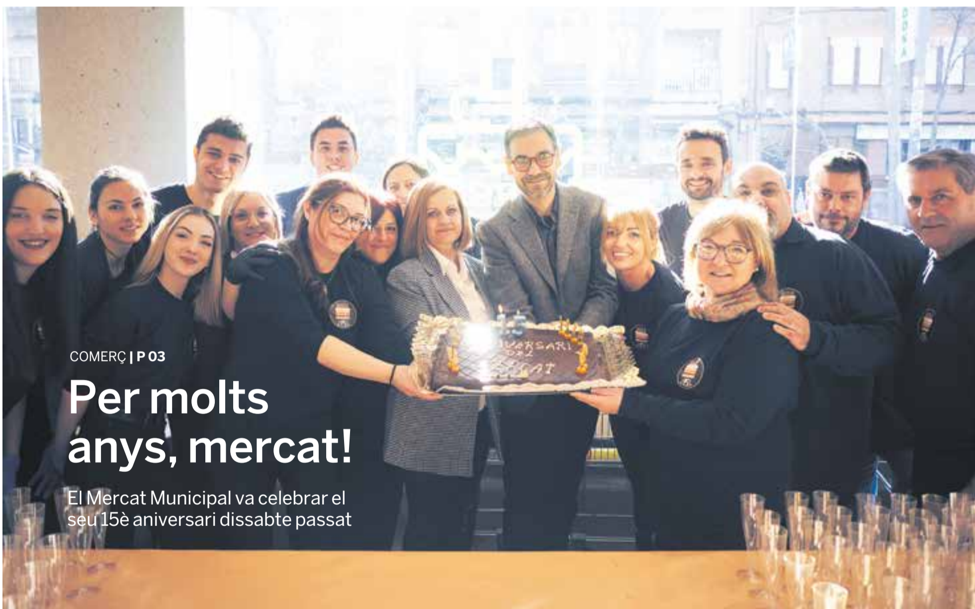
Els paradistes del Mercat amb la regidora de Comerç i l'alcalde en la celebració que es va fer dissabte passat i en què es van repartir més de 600 porcions de pastís d'aniversari.

El Mercat Municipal va celebrar el seu 15è aniversari dissabte passat