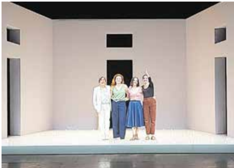
Les quatre actrius saludant el públic castellanenc en finalitzar l'obra.

La proposta teatral de la Perla 29 convenç un auditori ple a vessar