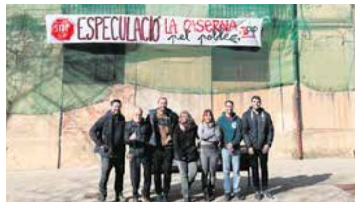
Membres de la CUP davant la pancarta que han penjat a l'antiga caserna. || CEDIDA

D'altra banda, des de la CUP segueixen portant a terme accions al voltant de l'antiga caserna de la Guàrdia Civil. La CUP, que ha penjat una pancarta a la façana de l'edifici, insta "l'Escola Pia [propietari actual] i l'Ajuntament a fer complir el testament d'Emília Carles i Tolrà i destinar l'edifici a un ús educatiu obert a tothom" . La intenció dels propietaris és fer-hi habitatges. + || REDACCIÓ