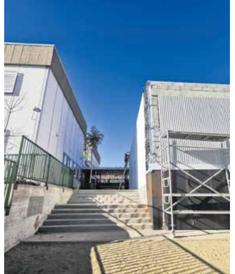
L'Ajuntament va avançar els diners per a les obres del Sant Esteve. || L'ACTUAL

A escala comarcal, la Generalitat destina gairebé 145 milions d'euros a la comarca del Vallès Occidental. Si mirem projectes també relacionats amb els castellarencs i castellarenques, destaquen per sobre de tot els 21,8 milions en les obres de l'hospital Parc Taulí. També són remarcables els 2,6 milions que es dedicaran a la millora de l'enllaç entre la C-58, la B-30 i l'N-150 entre Ripollet i Terrassa. †