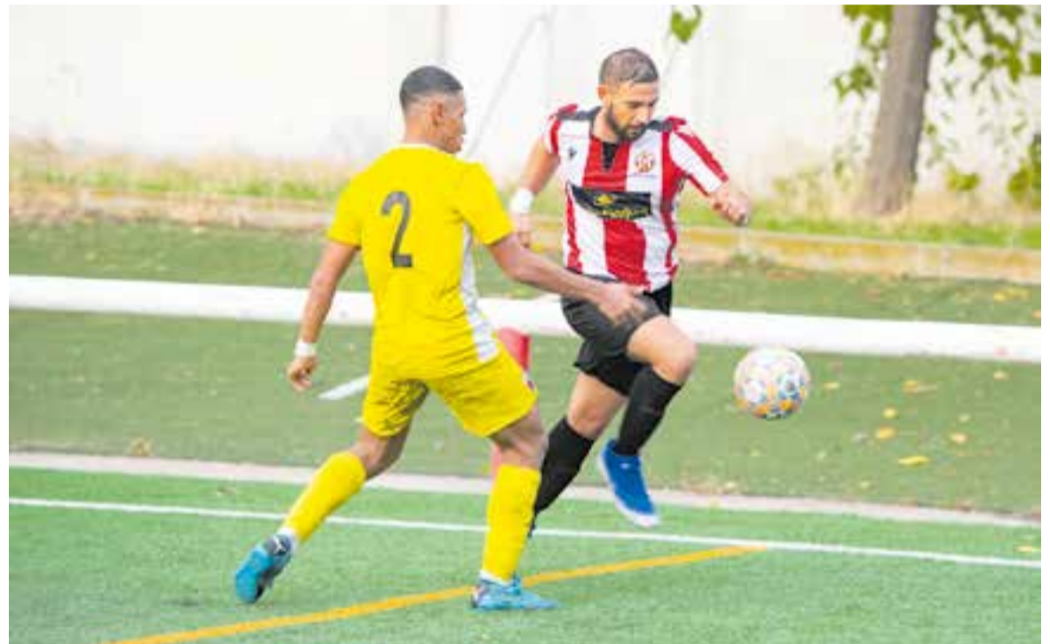
L'equip ha tornat amb noves il·lusions per continuar lluitant per l'ascens de categoria. || A. SAN ANDRÉS

Aquest dimecres va disputar un nou partit a casa contra el Can Rull (2a Cat) amb un resultat de XX-XX i el dissabte (19.00 h) s'enfronta al Molins CF de Primera Catalana a casa. ▶