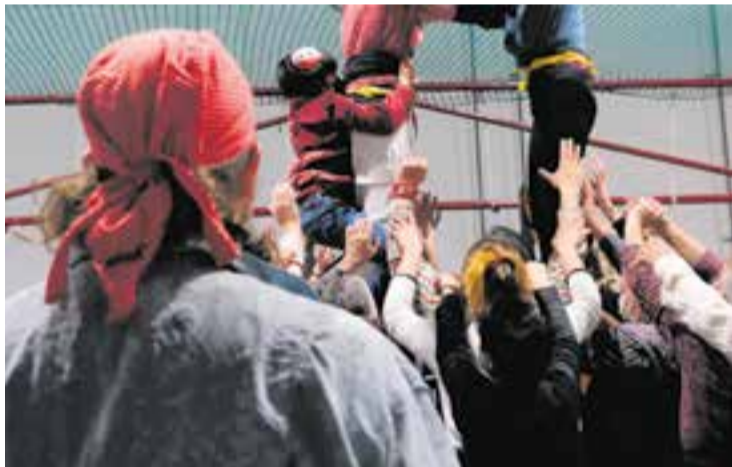
Assaig de la colla castellera Capgirats, a Castellar del Vallès.