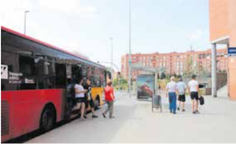
Castellarencs baixen de La Vallesana a la plaça Espanya, al costat de l'estació.

A partir de l'1 de setembre i fins al 31 de desembre entra en funcionament l'abonament gratuït per a viatgers freqüents de Rodalies de Catalunya. Aquest permetrà moure's sense cost per la xarxa de Rodalies de Barcelona, amb el pagament previ d'una fiança de 10 euros que es retornarà si es fan un mínim de 16 viatges. El retorn de la