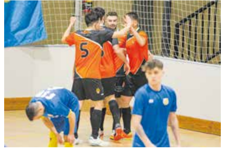
Els jugadors de l'FS Castellar celebrant un gol.