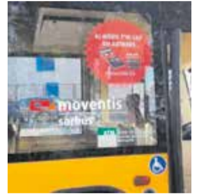
Autobús de la línia C3.

En direcció a Sabadell, les expedicions que acaben el seu trajecte a Castellar finalitzaran el seu recorregut normal a