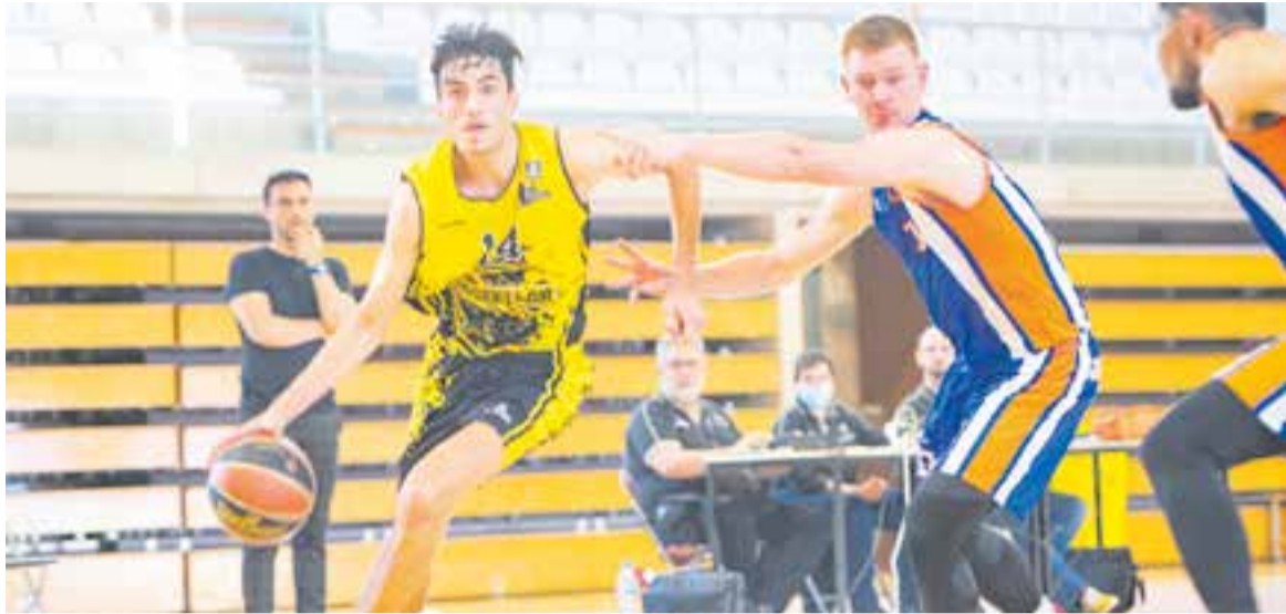
Els groc-i-negres volen millorar la dinàmica de temporades passades i tenir un bon any a Copa Catalunya. || A. SAN ANDRÉS