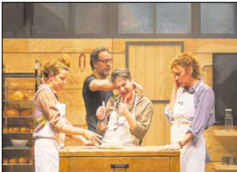
'Una teràpia integral' es podrà veure el dia 8 d'octubre, a l'Auditori Municipal. || CEDIDA

dia 24 de setembre, a les 20 h, amb l'obra de teatre Buffalo Bill a Barcelona , de Bitò Produccions. Seguiran el dia 2 d'octubre, a les 12 h, amb la proposta de teatre familiar Camí a l'escola , de la companyia Campi qui Pugui.