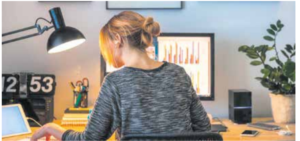
La nova llei dels autònoms suposarà una pujada de la quota mensual per als professionals amb més facturació.