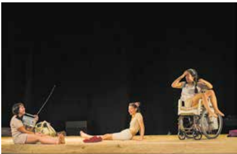
'Camí a l'escola', de Campi Qui Pugui, es va poder veure a l'Auditori Municipal.

Camí a l'escola va comptar amb pocs espectadors, a causa de la coincidència de la Marxa Infantil de Regularitat, però cal destacar que va agradar molt i que, fins i tot, alguns dels espectadors es van acostar a les actrius al final de l'espectacle per felicitar-les. † || M. ANTÚNEZ