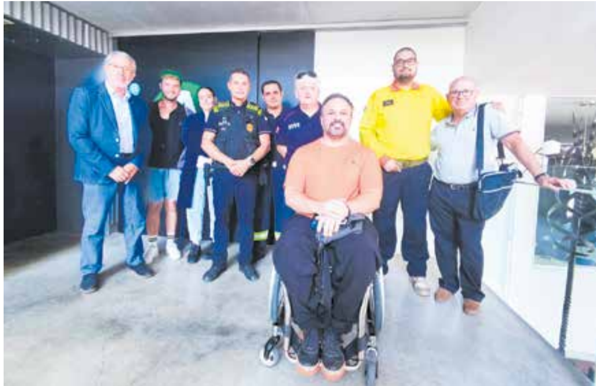
Els testimonis i els actors que dilluns van participar en l'activitat 'Canvi de marxa' a l'Auditori Municipal Miquel Pont.

La iniciativa educativa impulsada per la fundació privada sense ànim de lucre Mutual de Conductors, amb el suport del Servei Català de Trànsit i la col·laboració de l'Ajuntament i la policia local de Castellar del Vallès, té l'objectiu de conscienciar els joves d'entre 14 i 18 anys sobre les causes i conseqüències dels accidents de trànsit, així com fomentar conductes responsables i d'autoprotecció en aquest tram d'edat. "Els joves surten de l'activitat impactats, que és el que pretenem. D'entrada ells no saben a què venen i a l'inici hi ha música de festa i una introducció amb dos actors que reben una trucada telefònica d'uns joves que han patit un accident anant de festa. A partir d'aquí, intervenen els professionals i les víctimes d'accidents, ex-