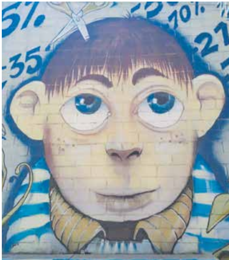
Grafiti fet a Castellar del Vallès.