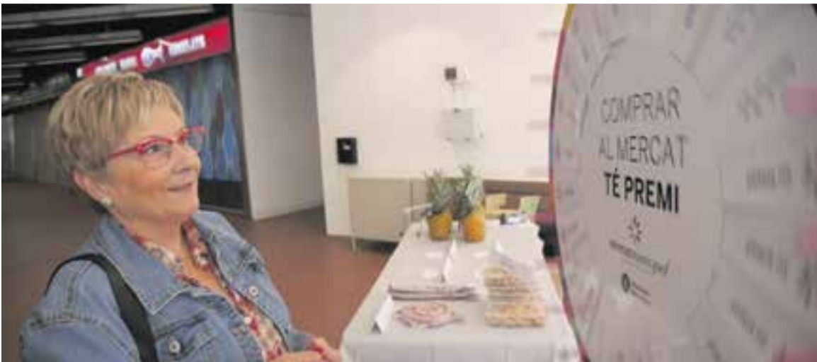
Una clienta del Mercat esperant que la ruleta acabi de girar per obtenir un premi segur.

El Mercat torna a engegar 'La ruleta té premi' amb obsequis segurs