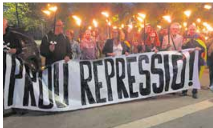
Alguns dels membres de l'ANC a la marxa de torxes de divendres passat.

zació va coincidir amb els actes reivindicatius del cinquè aniversari de l'1-O. Des de l'ANC de Castellar, remarquen que és important continuar amb la mobilització de la ciutadania "malgrat la desunió política, nosaltres seguim aquí per empènyer en la direcció de la independència" . Rius també critica que "els Mossos s'hagin presentat com a acusació contra alguns represaliats" , i és per això que la seu de la policia de Terrassa es va triar com a punt final de la marxa de torxes.