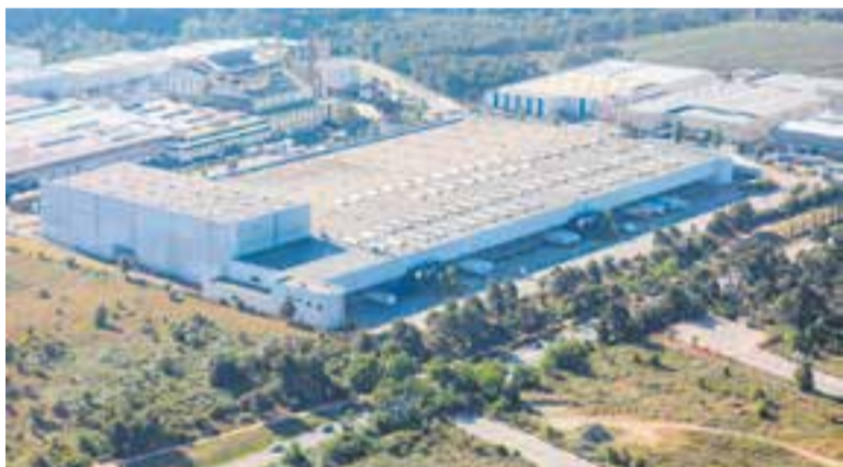
Vista aèria de la nau logística adquirida per Hines al Pla de la Bruguera.

Segons publiquen diversos mitjans econòmics de fonts de la mateixa empresa, Hines estava cercant un espai de qualitat dins el mercat logístic de Barcelona, ciutat que ha esdevingut un "hub' logístic clau a Espanya i Europa per la seva connectivitat" . +|| REDACCIÓ