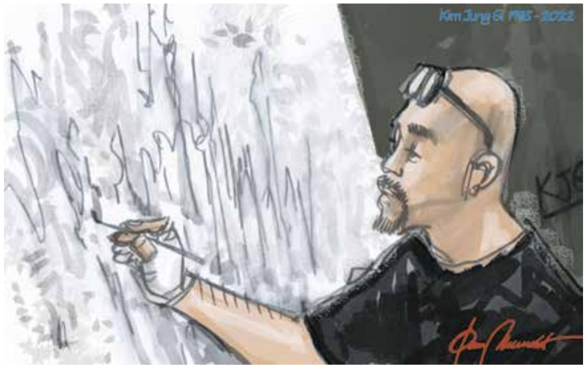
© Fins que s'acaba. || JOAN MUNDET

Llevat de WhatsApp no tinc cap més xarxa social per interactuar amb la resta del món