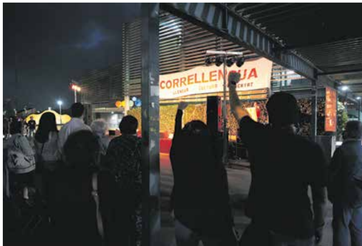
Edició del Correllengua 2021, a la plaça d'El Mirador. Enguany, tindrà lloc els dies 7 i 8 d'octubre.

Ja entrat el vespre, es farà l'Arribada de la Flama i la lectura del manifest. A continuació, s'encetarà