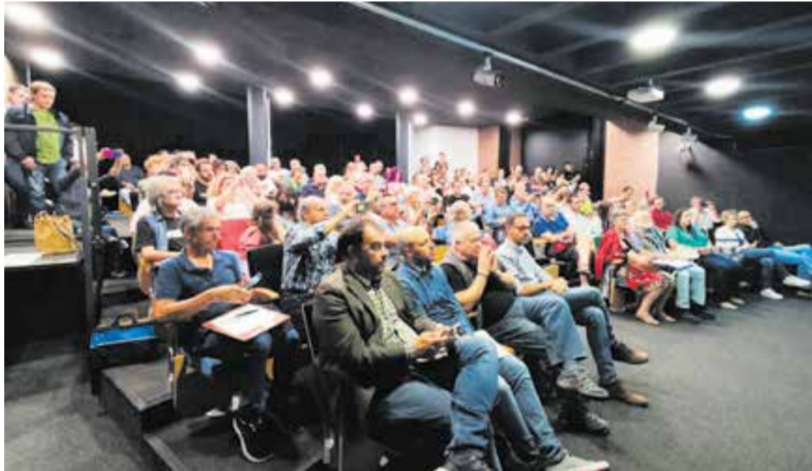
La xerrada va generar molta expectació entre els vilatans i la sala d'actes d'El Mirador es va omplir de gom a gom.