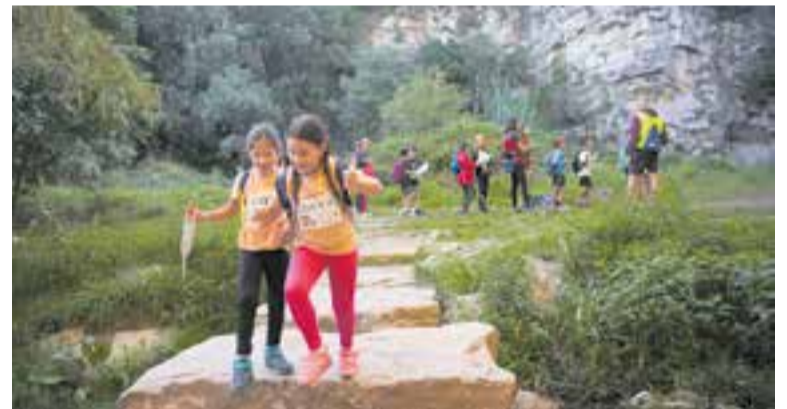
Uns participants després de passar per un control al Gorg d'en Fitó.

Aquesta va ser la quarta de les proves incloses dins del calendari de Marxes Infantils de la Federació d'Entitats Excursionistes de Catalunya (FEEC); els participants es van moure per un recorregut circular amb un total de 9,64 km, amb sortida des del centre de Castellar, va recórrer diversos indrets com el riu Ripoll, el Molí de la Barata, la Font de la Riera, el Gorg d'en Fitó, Cal Joan Coix o Can Julià, entre d'altres, abans d'arribar a Sant Feliu del Racó i tornar cap al punt de sortida en la plaça del Mirador.