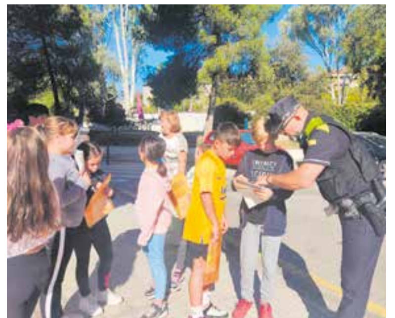
Alumnes de 4t A i B de l'IE Sant Esteve fent l'activitat acompanyats de la policia local.