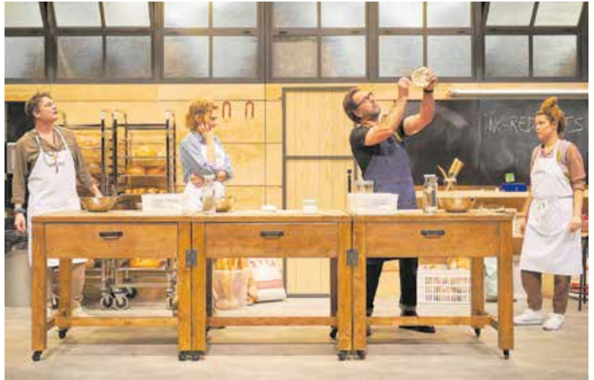
Moment de l'obra 'Una teràpia integral', que arriba dissabte a l'Auditori Municipal Miquel Pont.