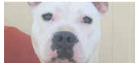
MELDI // Raça: creuada - Femella Pèl curt · En adopció des d'abril de 2022