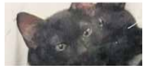
TAFARI // Raça: europea - Mascle Pèl curt · En adopció des de setembre de 2022