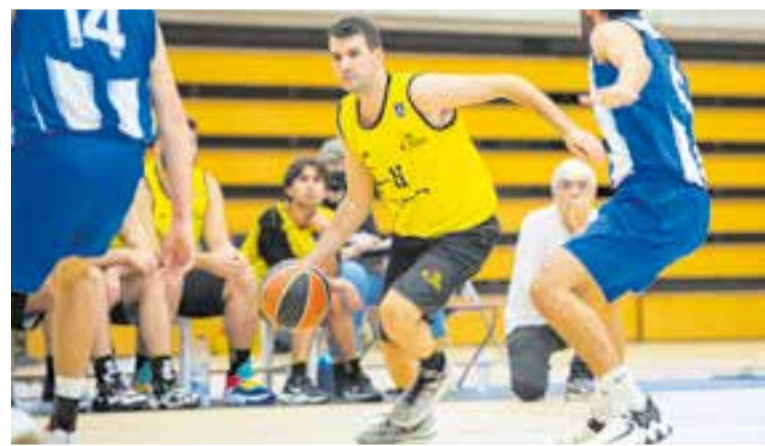
El CB Castellar encara no coneix la victòria en les dues jornades disputades. || A.S.A.

Aquesta jornada, l'equip tornarà a jugar lluny del Puigverd, amb la visita als Lluïsos de Gràcia (diumenge, 18.00 h), cuer de la categoria, també amb dues derrotes. L'últim enfrontament entre els dos equips va ser fa quatre temporades en la promoció d'ascens a Copa Catalunya, on l'equip barceloní va aconseguir passar de ronda i on els dos equips van ascendir. + || A. S. A.