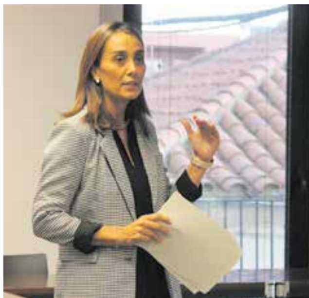
La regidora en l'audiència de pressupostos dimarts passat. || R. G.

Sobre els grans números del pressupost, la regidora explica que l'augment en 4 milions comparat amb el 2022 s'explica “per les transferències d'altres administracions per executar inversions, la majoria de les quals procedents dels fons Next Generation”.