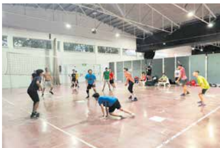
Un dels partits de vòlei que es van jugar el cap de setmana a l'Espai Tolrà.

És una proposta d'esport, lleure i cultura per a joves de 12 a 18 anys, que lidera Creu Roja