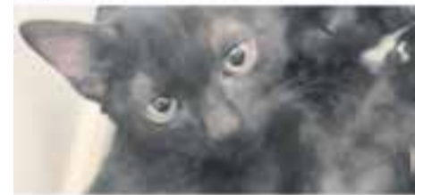
KOFI // Raça: europea · Mascle Pèl curt · En adopció des de setembre de 2022