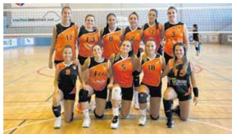
L'equip femení va debutar a 2a Catalana amb una victòria a Alpicat.