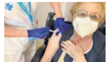
Vacunació al Casal Catalunya.

Segons ha informat la secretària de Salut Pública, Carme Cabezas, després del tret d'inici de la campanya de vacunació, molt focalitzada en persones de residències i majors de 80 anys, "la idea ha estat obrir de seguida a la resta de col·lectius les dues vacunes" , començant per les persones majors de 60 anys. També s'obrirà la possibilitat de vacunació tant de grip com de Covid a "persones amb risc de possibles complicacions com problemes respiratoris, cardiovasculars o diabetis" , ha explicat Cabezas. A més, en aquests col·lectius s'inclouen les persones amb immunodepressió o dones embarassades. + || REDACCIÓ