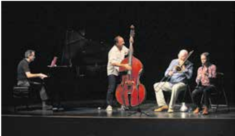
El quartet de jazz Dumpy Lobsters durant el concert a L'Auditori, dijous passat.

El quartet de jazz Dumpy Lobsters va inaugurar el cicle de concerts de les Audicions Íntimes de L'Aula amb una actuació refrescant