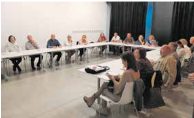
Assistents a la primera sessió de formació, divendres passat. || A.J. CASTELLAR

Ha estat organitzat per l'AVAN en col·laboració amb l'Ajuntament