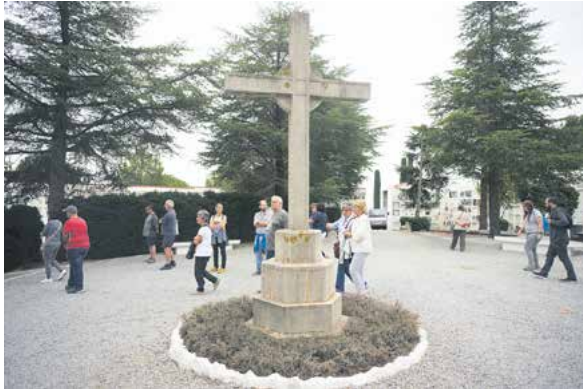
Persones participants en l'activitat Un Tomb per la Història, celebrada diumenge passat, visitant un dels racons del cementiri.

D'altra banda, tota aquesta setmana i fins al 31 d'octubre està