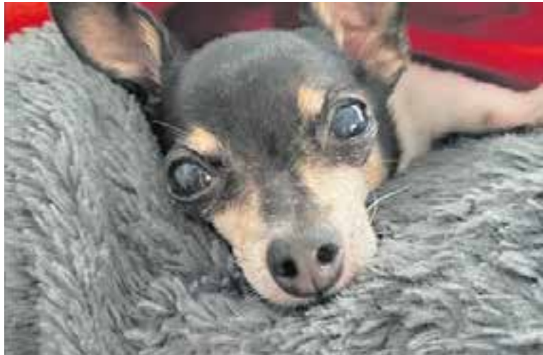
La vacuna contra la ràbia serà obligatòria a Catalunya per a gossos, gats i fures. || JMR

Des del Departament de Prevenció van apuntar en la roda de premsa que la ràbia és endèmica a diversos països com Ucraïna, d'on han arribat refugiats amb les seves mascotes. Ara bé, dels 1.200 animals ucraïnesos que es té constància que han arribat en els últims mesos,