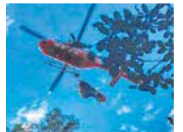
Moment del rescat.

Diumenge 23 d'octubre al matí els Bombers de Castellar van rescatar una excursionista de 58 anys que va caure mentre feia una caminada pels voltants l'Ermita de la Mare de Déu de les Arenes. La dona es va trencar el turmell i es va requerir un helicòpter, que va aterrar a l'esplanada popera a l'Ermita. Després d'estabilitzar-la, la dona va ser traslladada a una ambulància del Servei d'Emergències Mèdiques que es va encarregar de portar-la a l'hospital. El rescat es va poder dur a terme amb la col·laboració del SERNA, dels GRAE (Grup d'Actuacions Especials) i dels MAER (Mitjans Aeri Bombers de la Generalitat). + || REDACCIÓ