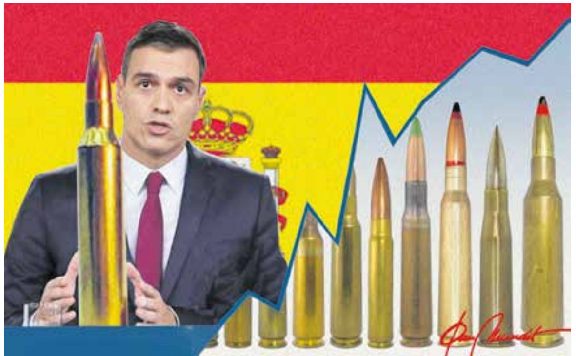
© 'Pressupostos generals, despesa militar'. || JOAN MUNDET

"La despesa militar espanyola del pressupost de l'estat del 2023 serà de 27.617 milions"