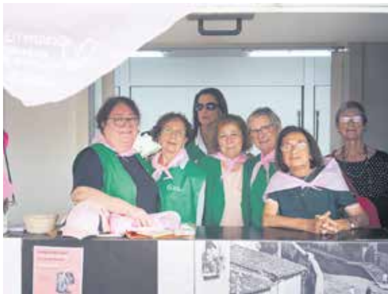
Voluntàries de l'Associació Contra el Càncer, diumenge passat.