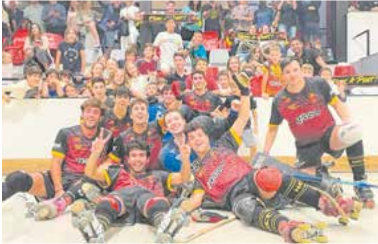
L'equip de l'HC Castellar celebrant la victòria contra el Sant Just.

La victòria contra el Sant Just era vital per tal de mantenir el lideratge del grup –també a banda de sumar el màxim de punts possibles de cara a la segona volta–, ja que la victòria del Mollet HC contra el CH Vilassar (4-3) ho podria haver evitat, allunyant els grans del primer lloc que han ocupat des de la prime-