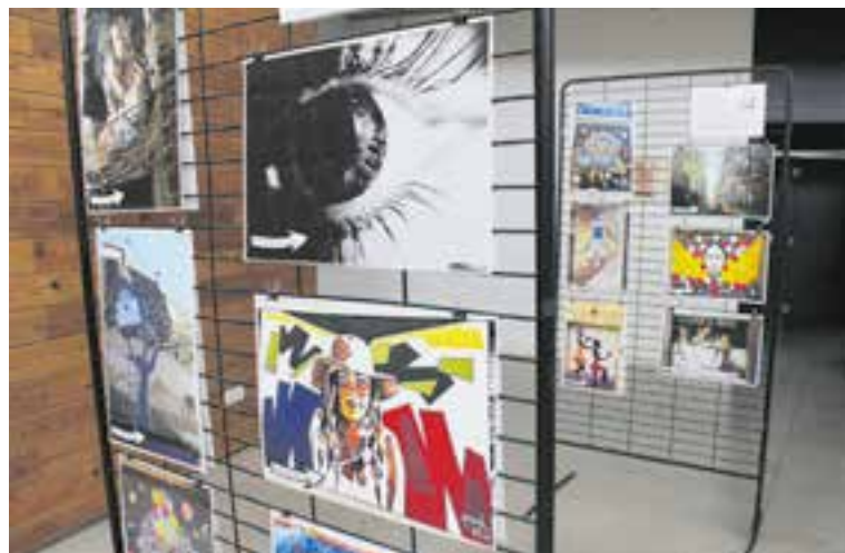
Detall de la mostra de grafiti que es pot veure a El Mirador. || J. MELGAREJO

"Alguns dels grafitis que es poden veure són obres d'art, d'altres, més aviat busquen el vessant transgressor", segons les representants d'ARGA a l'acte inaugural. També n'hi ha en espais emblemàtics, en persianes de comerços, en transports públics i privats (autobús, furgoneta, trens), en fonts, etc.