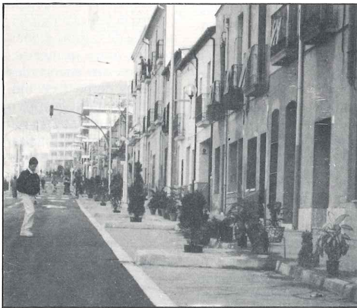
Com que els arbres no s'han pogut plantar (ja que encara no és el temps) la imaginació dels veïns els va suplir amb nombroses plantes que, junt amb les senyeres, els participants i els espectadors, contribuïren al lluïment de la festa.