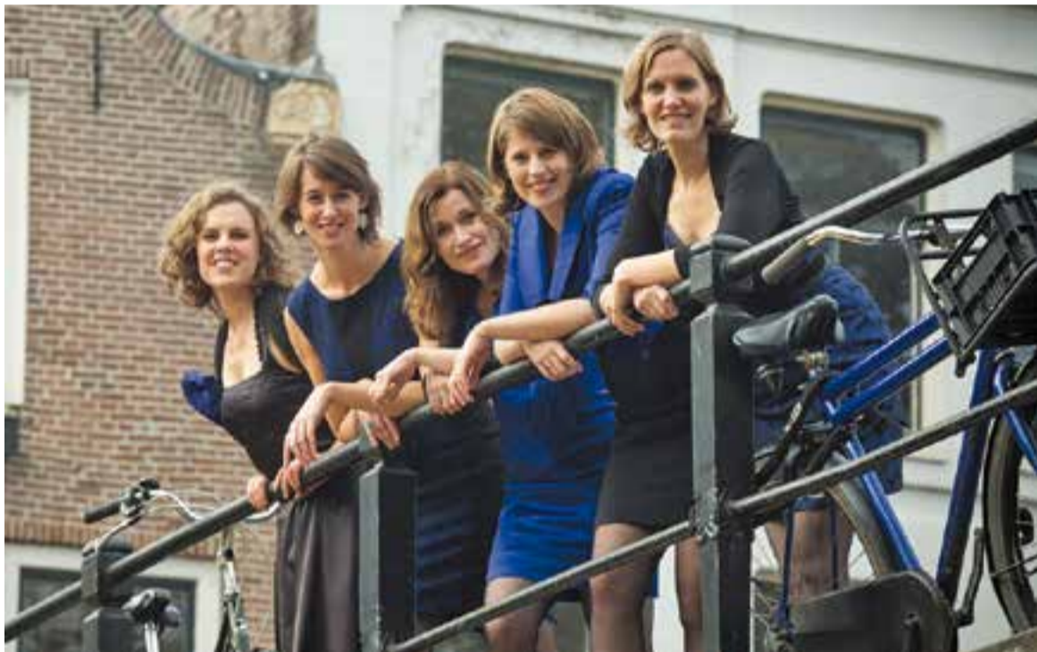
Les Wishful Singing actuen aquest dissabte a la Capella de Montserrat. Aquest serà l'últim concert de Nits d'Estiu 2017.

El grup femení tancarà a la Capella de Montserrat el cicle Nits d'Estiu