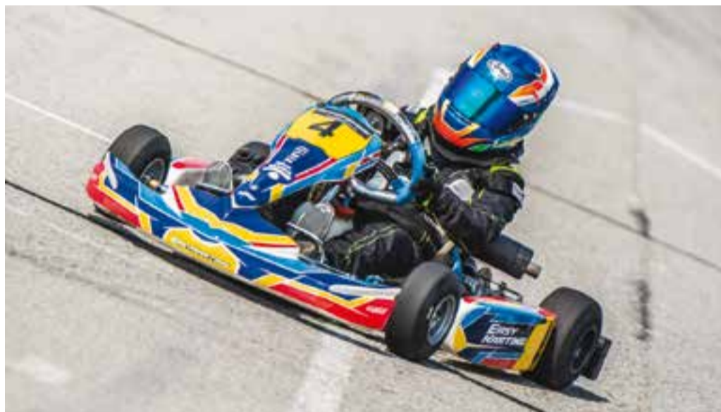
El jove pilot castellarenc porta tres temporades competint al campionat de Catalunya de karting. || A. SAN ANDRÉS

goria aleví competeix amb el Marc Güell i en sènior amb l'Àlex Font.