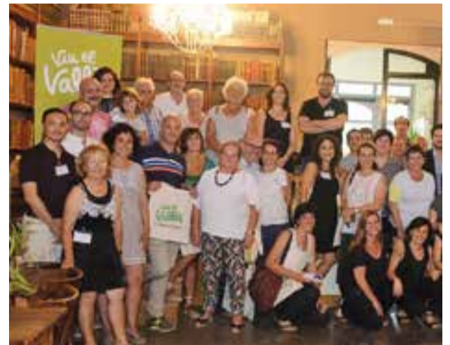
Calsina, segon per l'esquerra, en la trobada a Sant Cugat.