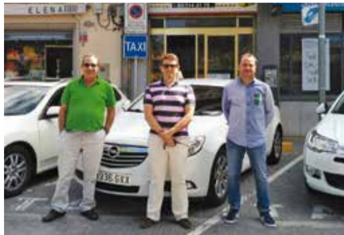
Taxistes de Castellar davant la seu Ràdio Taxi Castellar a la pl. Calissó.

El sector del taxi va fer ahir una jornada de vaga per protestar contra les llicències VTC, les que utilitzen actualment aplicacions com Uber o Cabify per operar al territori espanyol. La vaga es va portar a terme a Barcelona i a altres ciutats d'Espanya, i els taxistes castellarencs també es van afegir a la protes-