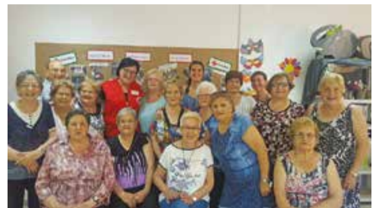
Les assistents als diferents tallers que es fan a la Creu Roja.

A més, un dimecres al mes a les 10.30h es realitza una xerrada sobre temes de salut per ensenyar a millorar el maneig de l'ansietat, la hipertensió, l'alimentació, l'abordament de diferents malalties, primers auxilis, etcètera. De forma habitual és la pròpia Creu Roja i la Regidoria de Gent Gran de l'Ajuntament de Castellar del Vallès qui detecta la necessitat de prevenir la solitud d'una persona gran, però des de l'entitat asseguren que és important que tots els ciutadans i ciutadanes siguin conscients d'aquesta problemàtica molt poc visible per acompanyar a persones grans que estiguin soles a la Creu Roja o al departament de Gent Gran de l'Ajuntament de Castellar del Vallès. + || REDACCIÓ