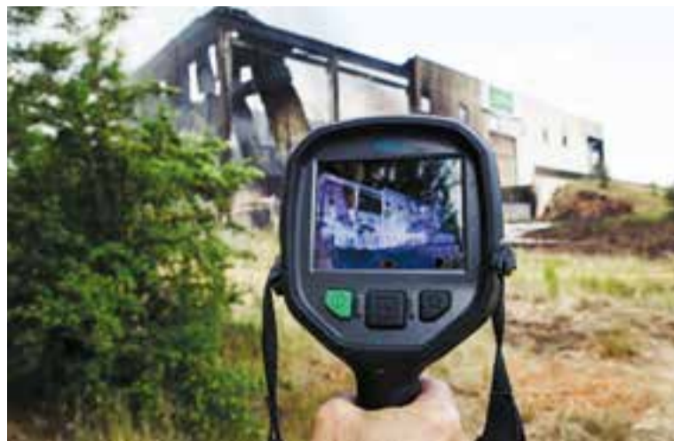
Mesurador d'infrarojos per controlar la temperatura de la nau cremada.

Els Mossos d'Esquadra i els pèrits estan investigant les causes del foc que va cremar íntegrament l'empresa Dispopack