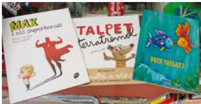
Algunes de les recomanacions de la llibreria Vallès

La llibreria La Centrala ens proposa els llibres La muntanya de llibres més alta del món , de Rocío Bonilla, per a nens i nens de 6 a 8 anys; El Laberint de l'anima , d'Anna Llenas, recomanat per a infants de 8 a 10 anys, i L'herbari de les fades , de Benjamin Lacombe i Sébastien Pérez, per a joves de 10 a 12 anys.