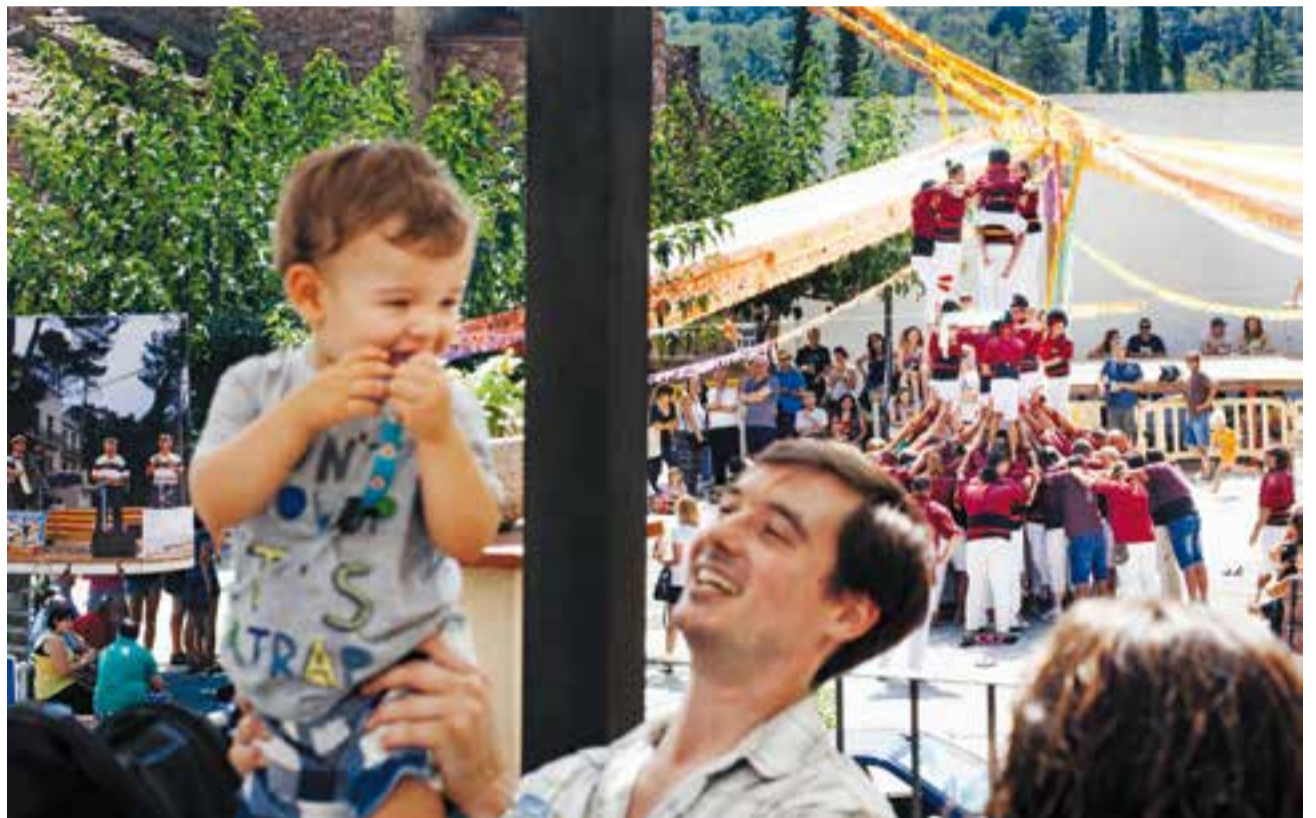
Un moment de les activitats de Sant Feliu del Racó, l'any passat.

A les 21 hores tindrà lloc el repic de campanes de Festa Major al campanar de l'Església de Sant Feliu.