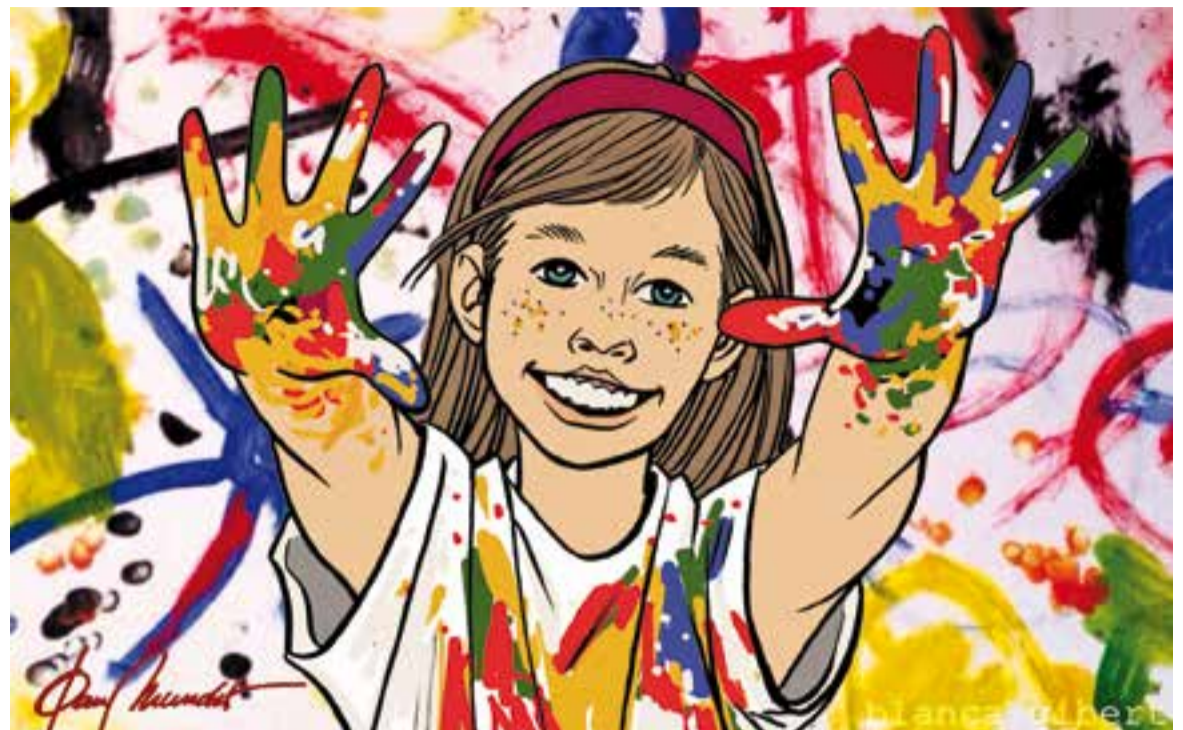
© Sobre tela.