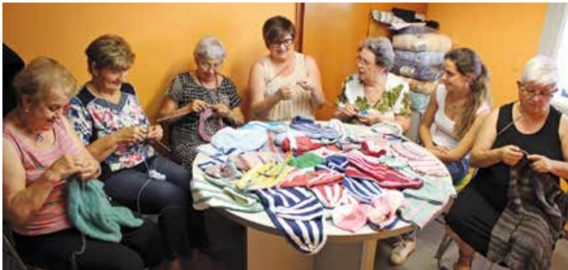
Dones voluntàries teixint sacs a 'La botiga de les Llanes' dimarts passat.

Voluntàries de Castellar teixeixen sacs per a nounats prematurs