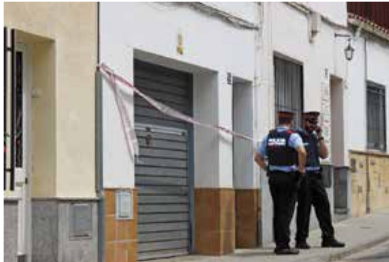
La policia científica va recollir proves durant el matí que es va trobar la víctima. || C.D.

vestigació, els agents van confirmar les sospites inicials i van corroborar que terceres persones van ajudar els lladres, que havien obtingut informació valuosa sobre les rutines que tenia l'home assaltat. Les dades aporta-