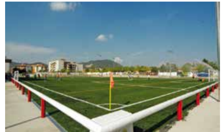
El camp de futbol el dia que es va inaugurar la gespa artificial ara fa 10 anys.

L'Ajuntament va adjudicar dimarts a BBVA l'arrendament financer de la nova gespa artificial del camp de futbol Pepín Valls. Una vegada resol el concurs públic, es preveu que la col·locació, que anirà a càrrec de l'empresa Mondo Ibérica SA, es pugui dur a terme durant el mes d'agost. D'aquesta manera, la Unió Esportiva Castellar podrà iniciar la temporada 2017-2018 amb la superfície del camp de futbol totalment renovada. L'equipament disposa de gespa artificial des de l'any 2006. Després de 10 anys, l'actual gespa ha esgotat el seu cicle de vida útil, per la qual cosa és necessària la seva renovació. La previsió és que part de la gespa actual es pugui reaprofitar recol·locant-la en altres espais del mateix camp de futbol i de la via pública. El nou contracte de lising de la gespa artificial del camp de futbol s'ha adjudicat per un període de 7 anys i un preu total de 173.000 euros (IVA inclòs) a dividir en 84 mensualitats. ▶ || REDACCIÓ