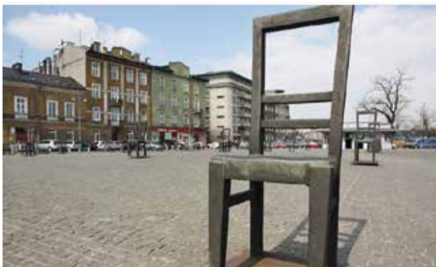
Plaça del Bohateraw al barri jueu de Cracòvia, a Polònia.