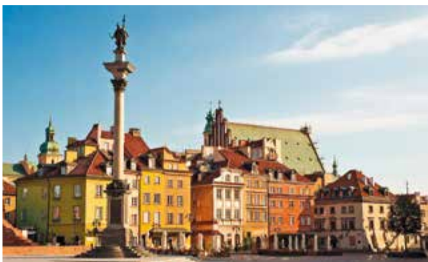
Plaça del Castell, al centre històric de la ciutat de Varsòvia, a Polònia.

Els dos països del vell continent ofereixen als visitants una gran riquesa de patrimoni cultural i natural a preus molt competitiu