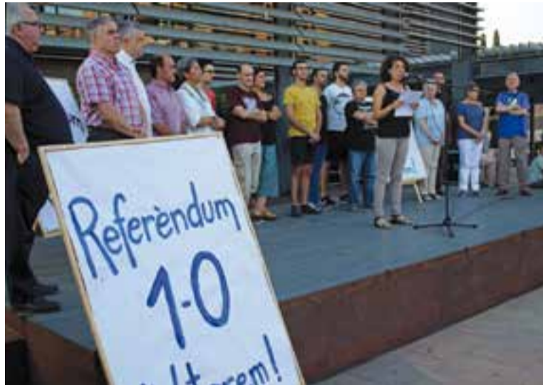
Acte de suport al referèndum, dijous passat a la plaça d'El Mirador.

En aquest sentit, el manifest a favor del referèndum va asseverar que la prohibició de votar es recull a “una constitució que es va redactar sota