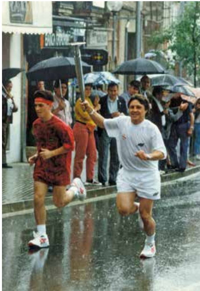
El pas de la torxa per Castellar, un mes abans del començament.

L'herència de l'esperit olímpic deixa més de 1.400 atletes i esportistes federats en l'actualitat, practicants de múltiples disciplines, amb campions del món, d'Europa, d'Espanya i de Catalunya des d'aquell màgic estiu del 1992. +