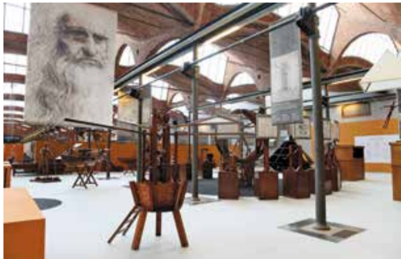
En la mostra s'exposen 40 màquines i enginyers ideats per da Vinci.