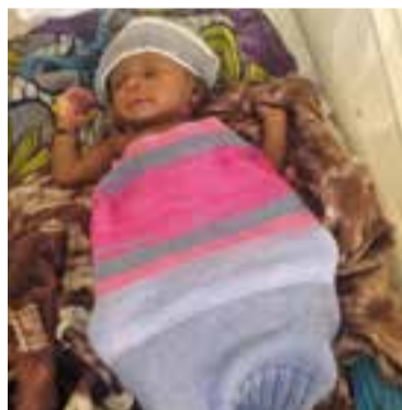
Un nadó prematur amb el saquet.

tiga de les Llanes , aquestes dones voluntàries, van elaborant saquets i barrets de llana que hi fan joc, ja en porten 30. Aquesta primera tongada marxarà la propera setmana a Gàmbia. "El 30 de juliol tenim la visita a l'hospital i farem el lliurament dels saquets. Ells ho agraeixen molt, perquè en moments compli-