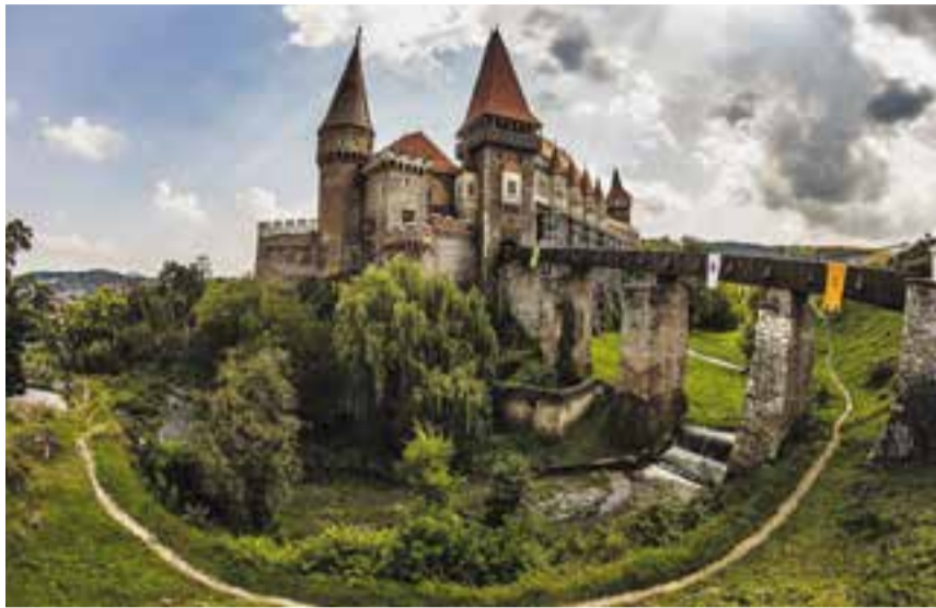
Castell gòtic d'Hunedoara a la regió de Transsilvània, a Romania. || D.CARCEA