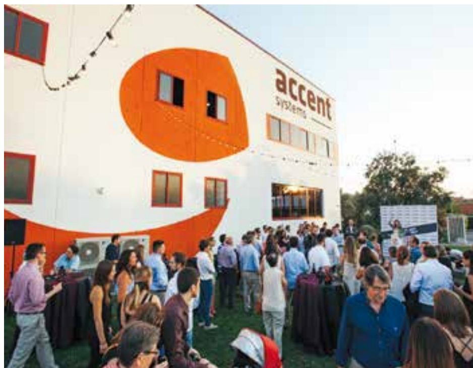
La celebració dels 10 anys de l'empresa va comptar amb l'assistència de molts treballadors i familiars.

La família que forma Accent Systems va concloure la vetllada amb un refrigeri als jardins de l'empresa. +