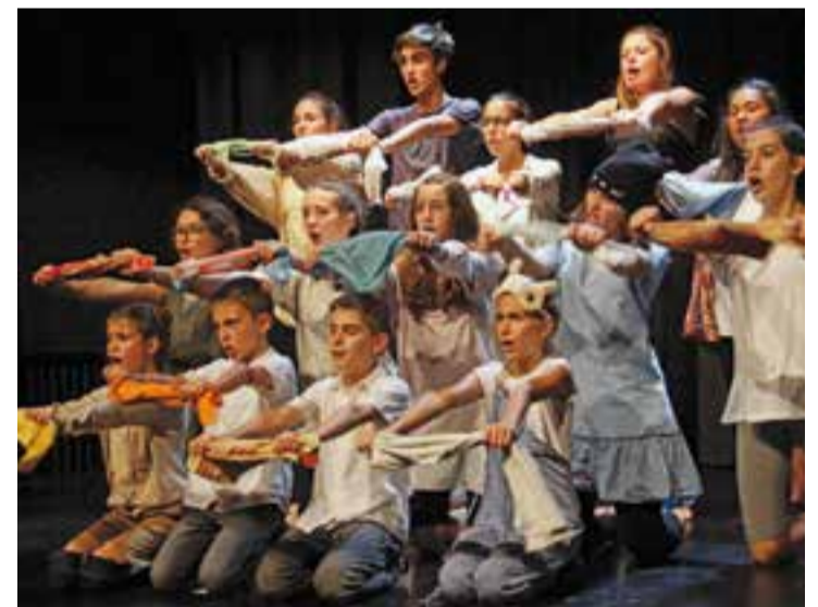
Els alumnes de l'stage musical en plena representació de 'Serà demà'