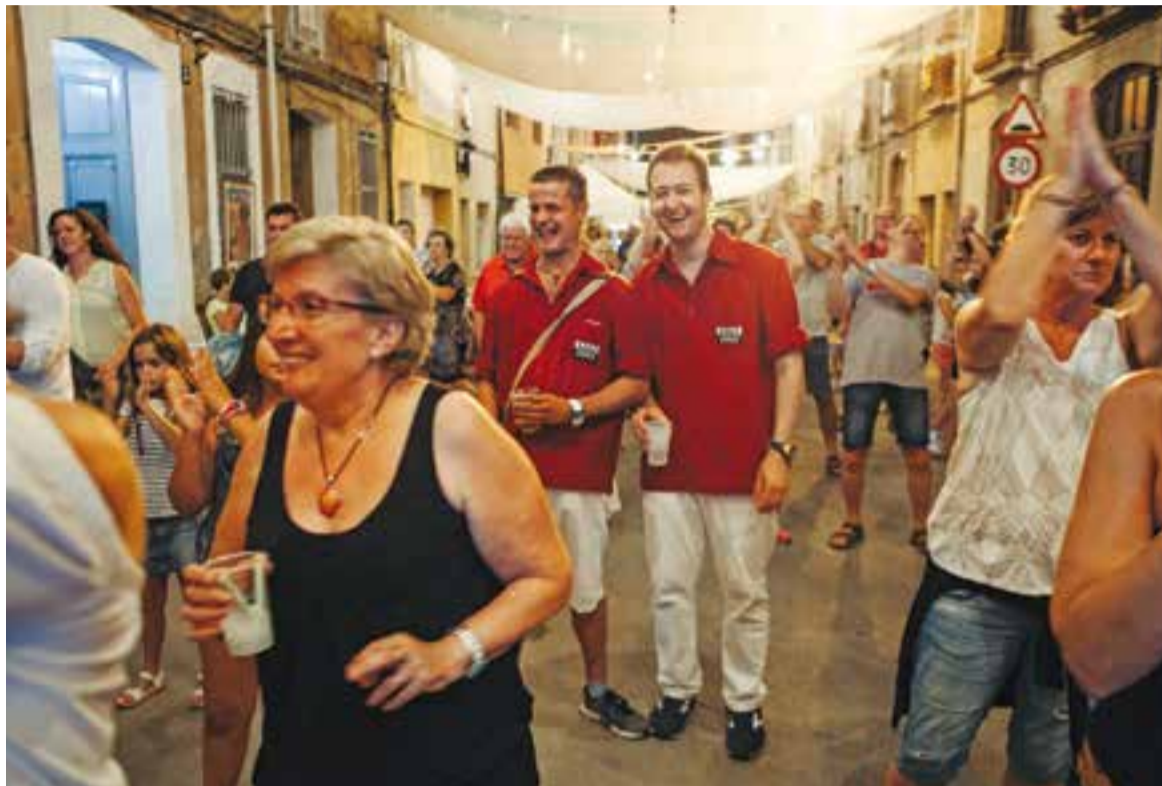
Els veïns del Pla gaudint de la revetlla de Sant Jaume d'enguany.

Evocadora de records de joventut per als adults i reconeixible per als més joves gràcies a la pel·lícula de Grease, la vestimenta anacrònica i llampant del quintet de ballarins de l'espectacle Remember Show Dance va sorprendre la multitud de castellarencs que va aplegar la revetlla del dissabte. Les dues noies i els tres nois van començar a dansar a quarts d'onze, interactuant amb el públic davant d'un projector de vídeo. Es canvia-