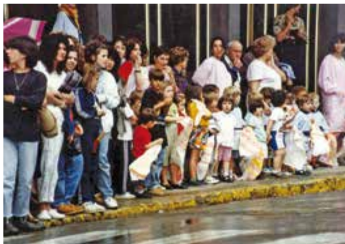
Molta expectació a Castellar, tot i la pluja d'aquell 16 de juny del '92.