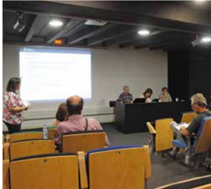
Tècnics municipals presentant les novetats del Geoportal. || AJUNTAMENT

Castellar del Vallès va tancar el mes de juny amb 1.158 persones sense