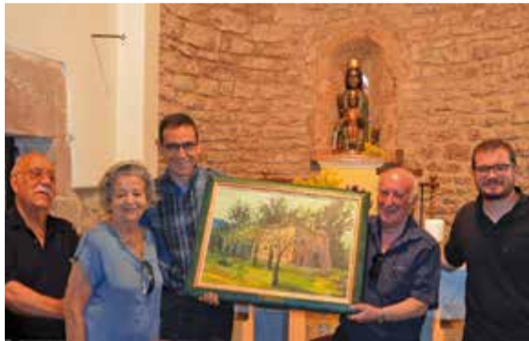
Amics de Les Arenes, mossèn i autoritats, el dia del reconeixement. || JOSEP CASANOVAS

Els diables volen ser més i fer més gresca i per això han llançat una crida "perquè qualsevol persona que vingui motivada pugui unir-se al grup, si té com a mínim, 16 anys, i 18 si vol tirar foc" . + || M. A.