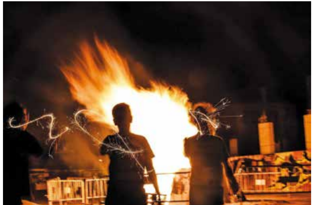
Dos nens juguen amb bengales davant de la foguera de Sant Joan a la plaça d'El Mirador.

El cap de setmana festiu també es va centrar a Can Carner durant el cap de setmana. Entre d'altres activitats, el barri va celebrar la revetlla de Sant Joan ballant les cançons de Musical Platinum. En total es van reservar més de 50 taules, aplegades davant de l'escenari, on més de 300 persones van sopar abans que comencés el concert, que va atraure castellarencs i també gent de la rodalia de la vila. Fins a les 4 de la matinada, el grup local Musical Platinum, que fa 20 anys que amenitza festes majors i festes privades, revetlles, sales d'oci nocturn i casals de gent gran, va oferir un concert animat. +