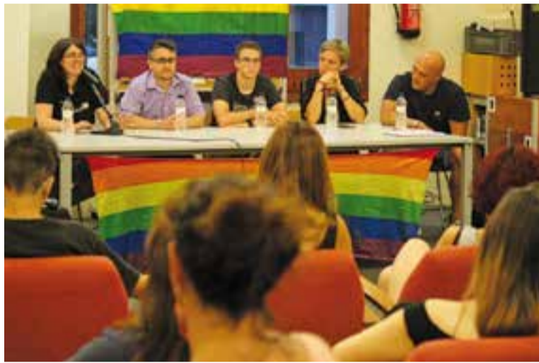
Tertúlia sobre LGTBI a la Biblioteca Antoni Tort, dilluns passat.

Així, la trobada va arrencar amb la lectura del manifest elaborat per la Diputació de Barcelona amb motiu de la jornada reivindicativa. El text recull el compromís de la corporació de "continuar treballant donant suport al territori a les campanyes i activitats transversals de sensibilització i lluita contra la violència" . L'objectiu final que defensa el manifest és apostar per per la igualtat significativa per aconseguir un escenari on "on les diferències per orientació afectiva i sexual, d'identitat de gènere i expressió de gènere siguin respectades" .