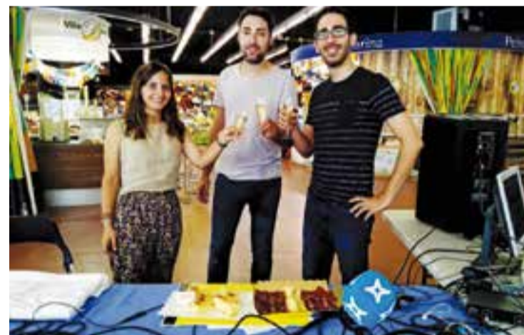
El magazín Dotze va tancar la temporada fent programa al Mercat Municipal. || J.G.

Com ja és tradició a l'antena de Ràdio Castellar, la final del concurs infantil Quin Cacau! (QKK!) és un dels moments culminants de la recta final de la temporada radiofònica. La 2016-2017 serà recordada perquè l'emissora municipal ha arribat als 35 anys d'emissions ininterrompudes. Després de Sant Joan, Ràdio Castellar obre un parèntesi de tres mesos en la seva graella habitual i bona part dels programes realitzats per entitats i voluntaris de la vila descansen. També fa vacances el magazín matinal Dotze, que el passat 23 de juny va fer un programa especial des del Mercat Municipal. † || REDACCIÓ