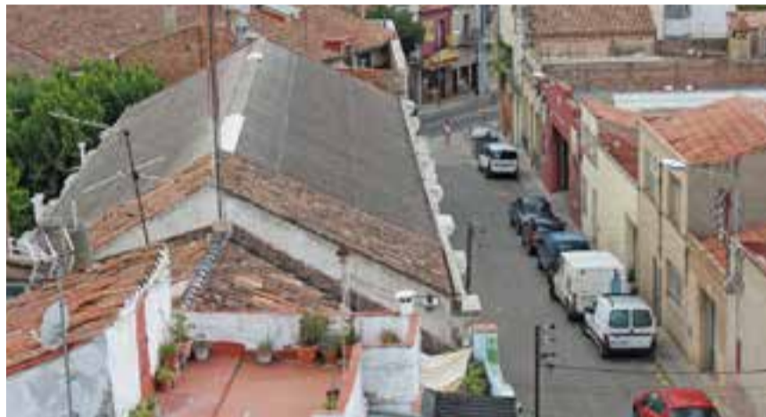
Vista de la teulada d'El Coral, on es retiraran les plaques de fibrociment.

l'intervenció a totes les escoles d'infantil i primària i als centres educatius municipals