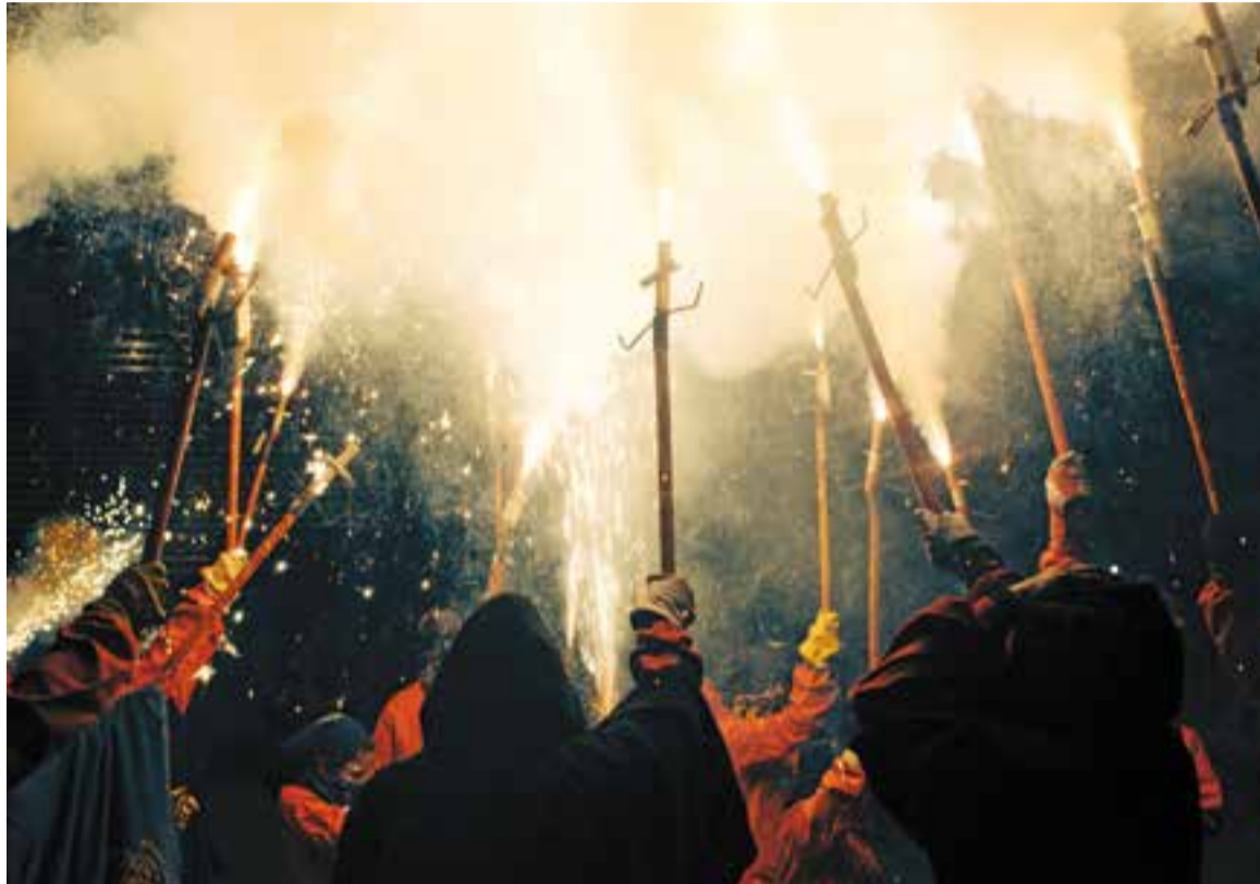
La secció de diables de Castellar ha programat un correfoc aquest divendres.