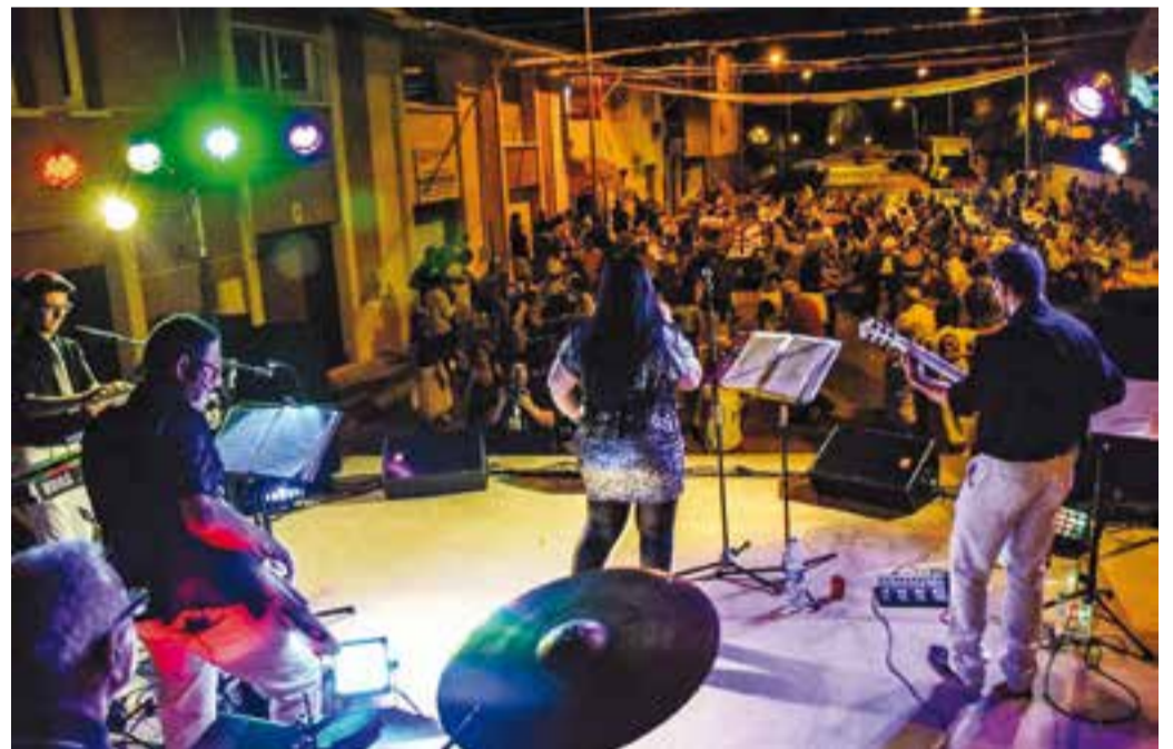
Actuació del grup Musical Platinum a la revetlla de Sant Joan de les festes de Can Carner.