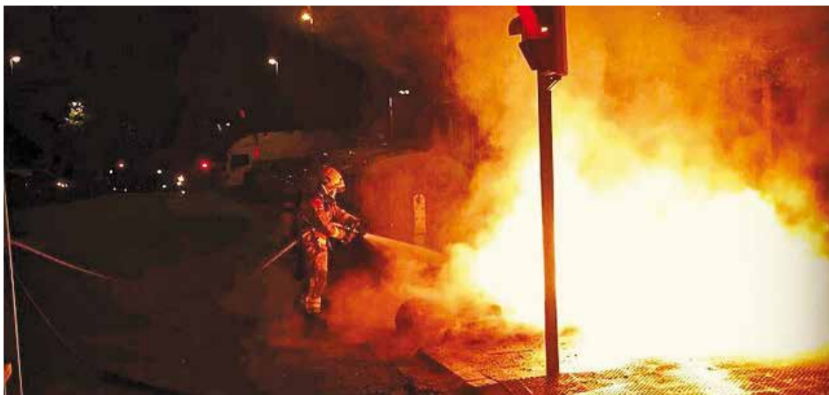
Una de les sortides que van fer els bombers de Castellar el passat 23 de juny.