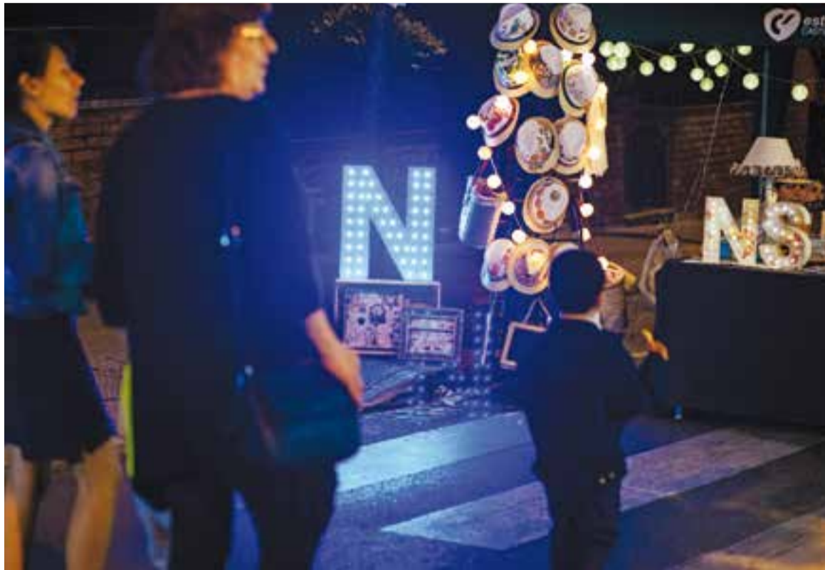
Una imatge d'arxiu de l'edició de 2015 de l'Avinguda Shopping Night.

Una de les sorpreses de cada edició és que els comerciants es vesteixen de forma temàtica. Si l'any passat, els botiguers van optar pel món de la granja, enguany sembla que triaran la imatge refrescant dels gelats, dolç que apareix a tots els cartells que anuncien l'esdeveniment. A més de promocions especials d'aquest dia amb la sortida dels