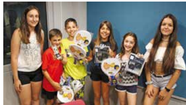
Un dels equips guanyadors del QKK! 16/17 amb les presentadores de l'espai. || C.L.

Com ja és tradició a l'antena de Ràdio Castellar, la final del concurs infantil Quin Cacau! (QKK!) és un dels moments culminants de la recta final de la temporada radiofònica. La 2016-2017 serà recordada perquè l'emissora municipal ha arribat als 35 anys d'emissions ininterrompudes. Després de Sant Joan, Ràdio Castellar obre un parèntesi de tres mesos en la seva graella habitual i bona part dels programes realitzats per entitats i voluntaris de la vila descansen. També fa vacances el magazín matinal Dotze, que el passat 23 de juny va fer un programa especial des del Mercat Municipal. † || REDACCIÓ