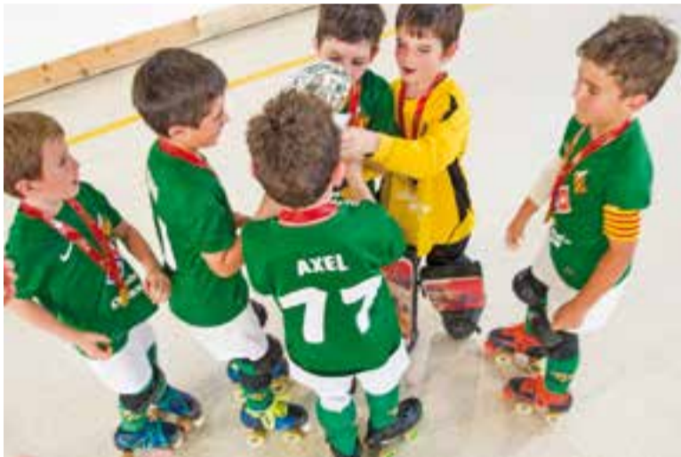
El CP Vilanova amb la copa de campions de la final de Barcelona.

L'HC Castellar salva el descens directe i jugarà la promoció a La Garriga