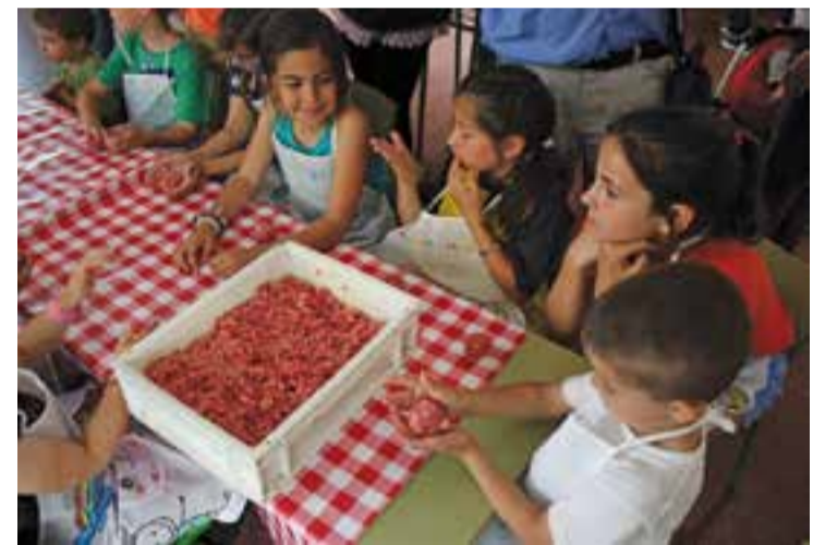
Taller de cuina per a infants, divendres passat || R. GÓMEZ

En el marc del Dia Mundial de l'Hamburguesa i de la Setmana Internacional dels Mercats, divendres passat els paradistes del Mercat Municipal de Castellar van organitzar un taller de cuina per a infants, el segon de la temporada. Així, al punt de les 17h, una quinzena d'infants d'entre 3 i 8 anys, es van posar el davantal per aprendre a elaborar un hamburguesa des del seu punt de partida: donar forma a la carn picada. Després d'arrodonar i aplanar la carn, els infants van decidir la guarnició de l'hamburguesa i la van cuinar a la graella sota la supervisió dels talleristes, els tres carnisers del Mercat. Els tres paradistes, de Cárnicas Merche, Prat Torras i Casé, van explicar als nens i nenes que van participar al taller el procés d'elaboració d'una hamburguesa i els van apuntar alguns consells perquè el resultat final fos un plat saborós i vistós. + || R. GÓMEZ