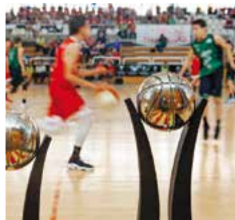
Els trofeus de les finals infantils.