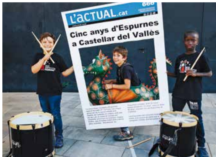
Photocall del 5è aniversari de les Espurnes.

Quant als reptes de futur, el cap de colla assegura que l'objectiu és consolidar les Espurnes, i "retenir les edats més grans" . De fet, properament s'obriran noves places per ampliar la família de diables que aplega a infants i joves de 3 a 18 anys. +