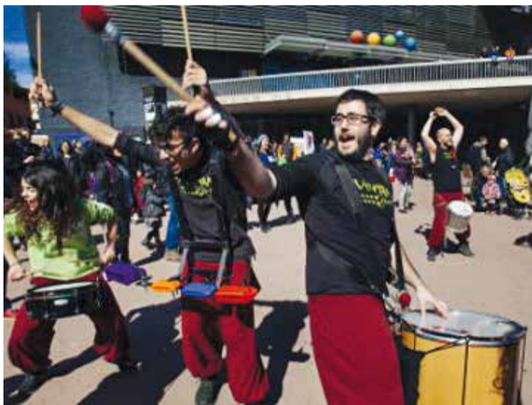
Els Tucantam Drums durant la Festa de l'Esbart, l'any 2015.

El grup de Tucantam Drums està format per 20 persones. És un projecte de percussió de carrer que va néixer arrel de les inquietuds percussives dels seus membres. El seu repertori està influït per ritmes i melodies ben diversos, arranxats perquè sonin molt i facin ballar. ➔