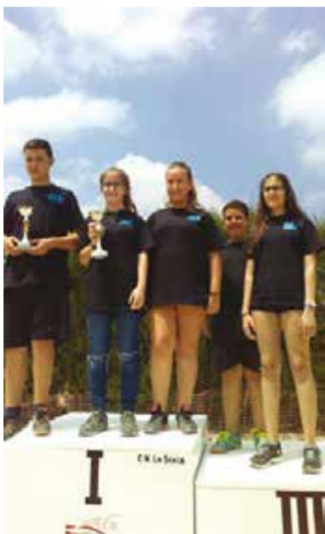
El Colobrers campió de lliga 2016-17.