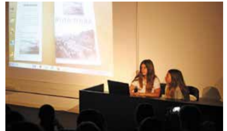
Presentació de la Ruta Tolrà, divendres passat || R.GÓMEZ

El treball d'investigació que han fet els alumnes, ha culminat amb l'elaboració de dues petites guies que inclouen mapes, fotografies i explicacions de cada edifici o construcció. A més, els alumnes de 6è van enregistrar en vídeo la ruta, resseguint pas a pas, la petjada dels Tolrà a Castellar del Vallès. ➔ || R.GÓMEZ