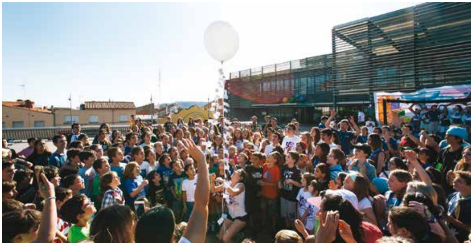
La festa de dissabte a la tarda va aplegar nombrosos infants a la plaça d'El Mirador.

Uns 400 infants entre els esplais integrants de la zona 12 del Moviment de Centres d'Esplai Cristianes Catalans: Can Colapi, la Branca i la Tropa, de Sabadell i el Roser, de Cerdanyola; i l'Esplai Sargantana de Castellar i Les Espurnes van ser a la festa del 50è aniversari, el dissabte. A partir de les 16.30 h van començar les activitats programades, arrencant amb una representació del Xiribec i la Xiripiga per descobrir què és un esplai, a partir de 7 valors de Colònies i Esplai Xiribec: persona, grup, poble, Catalu-