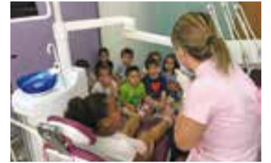
Els nens a una de les consultes.