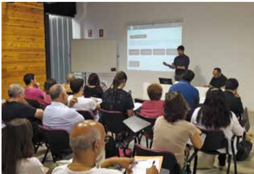
Primera trobada de la Comissió Permanent del Pla Estratègic aquesta setmana.

Per assistir a qualsevol dels tallers, de dues hores i mitja de durada cadascun, es poden formalitzar inscripcions trucant al telèfon 93 714 40 40 o a través del web www.castellarvalles.cat/plaestrategie