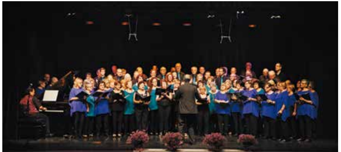
Actuació conjunta de les corals Renaixença, Polifònica d'Alella i Xiribec.