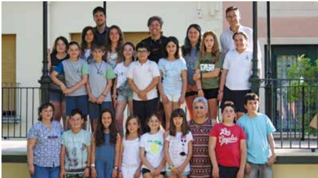
Els membres del Consell d'Infants del curs 16-17 i els representants polítics.