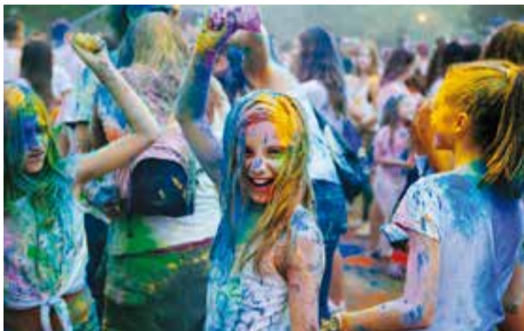
Una imatge de la festa Holi de la passada Festa Major.

Finalment, la propera fase que encetarà el pla estratègic de Suport Castellar serà el d'elaborar un DAFO per avaluar els punts forts i febles de l'associació. La presidenta de l'entitat apunta que en un futur obriran a més gent el procés "perquè aportin la seva visió". L'entitat preveu tenir el pla estratègic enllestit abans que finalitzi l'any. +