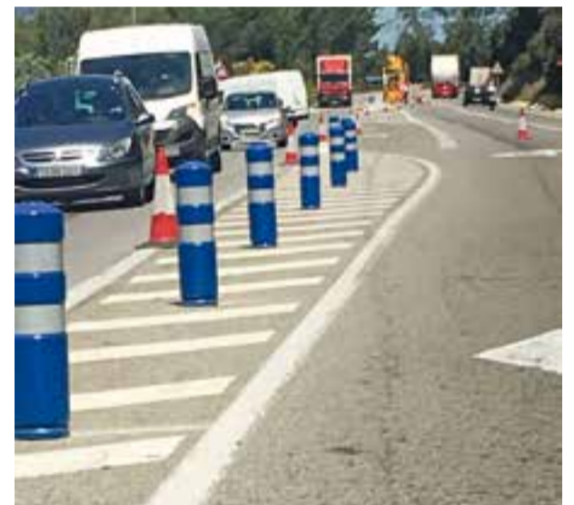
Les fites es van col·locar dijous de la setmana passada.

L'accidentalitat de la B-124 és una de les preocupacions del consistori en termes de mobilitat i, en aquest sentit, s'ha reclamat a la Generalitat (Servei Català de Trànsit i Servei Territorial de Carreteres) que s'hi pugui actuar per reduir-la i, alhora, millorar la connectivitat viària del municipi. ➔ || REDACCIÓ