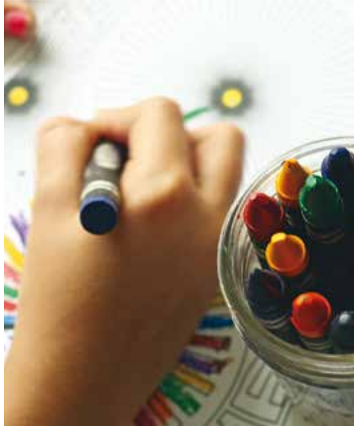
Aquest any el concurs és obert a tothom amb inquietuds artístiques.

La presentació de cartells candidats es pot fer fins al proper 23 de juny al registre General de l'Ajuntament (El Mirador, dilluns i divendres, de 8.30 h a 14.30 hores, i de dimarts a dijous, de 8.30 h a 19 h. Els menors de 16 anys hauran de presentar una autorització del pare, la mare o tutor legal. Es poden consultar les bases completes a www.castellarvalles.cat/cartellfestamajor . ➔