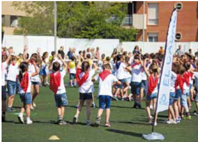
Desena edició del Dansem al camp de futbol Pepín Valls, divendres passat

El Grup de Treball de Música del Pla de Formació de Zona del Centre de Recursos Pedagògics del Servei Educatiu del Vallès Occidental VIII, l'equip docent de les escoles participants amb la col·laboració de l'Ajuntament i el Departament d'Edu-