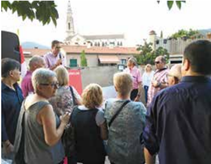
Parlament d'Ignasi Giménez durant la celebració.