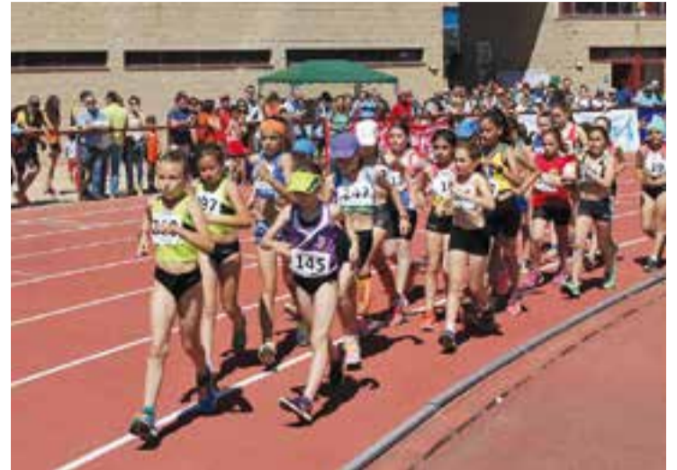
Cursa de marxa femenina a les pistes de Colobriers. || C. ATLÈTIC CASTELLAR