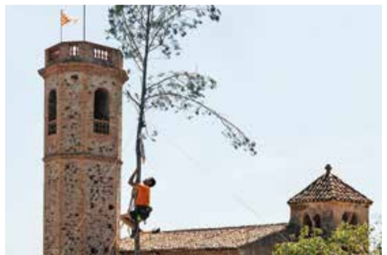
Primera Pujada al Pi en els actes de Santa Quitèria.

El cap de setmana passat, es va celebrar Santa Quitèria a Sant Feliu del Racó. Dissabte, es va dur a terme la primera pujada al pi, acompanyada dels Grallers de l'Esbart Teatral de castellar. Diumenge, es va celebrar la Missa de Santa Quitèria. A continuació, es va fer la tradicional la benedicció del pa, a la plaça de l'Església. A les 12.15 h es va poder brindar amb vermut i, a les 14 h, es va repartir el pa beneït. A les 17 hores es va cloure l'acte un campionat de dòmino. +|| REDACCIÓ