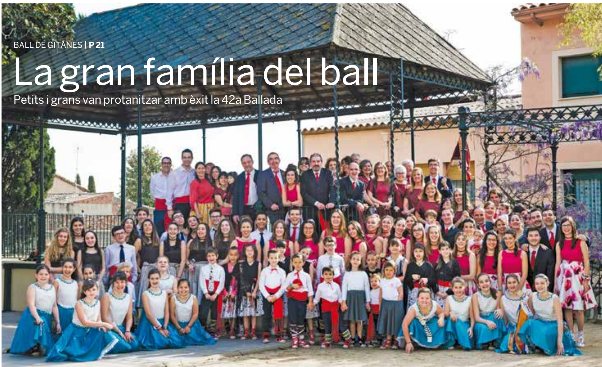
Tot el col·lectiu del Ball de Gitanes en una imatge als Jardins del Palau Tolrà. Una de les novetats d'aquest any va ser l'estrena de nou vestuari per a les actuacions.

Petits i grans van protagonitzar amb èxit la 42a Ballada