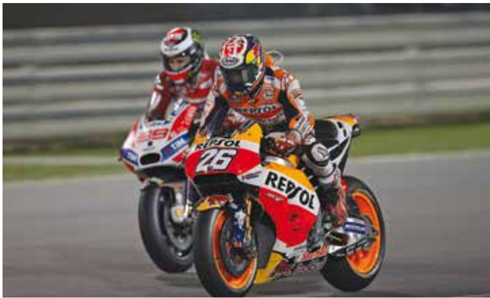
Dani Pedrosa en un moment de la cursa, juntament amb Jorge Lorenzo.

El pilot acaba cinquè al circuit de Losail (Qatar) en l'estrena del mundial de MotoGP, on l'elecció dels pneumàtics va ser clau