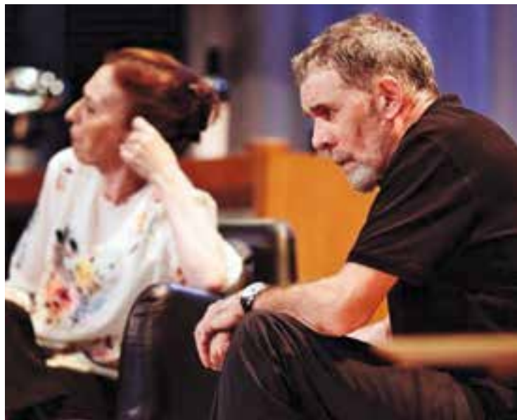
Moment de l'obra 'El bon pare'.

En aquest sentit, a l'argument de El bon pare el públic podrà com-