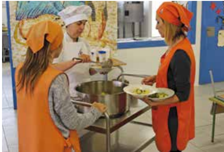
Moment de servei del dinar en el menjador del Joan Blanquer.