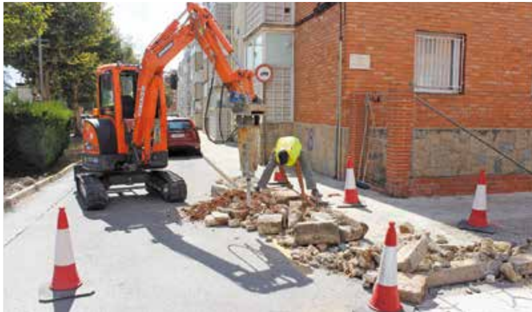
Obres de reparació d'un gual.

Les obres consisteixen concretament en la reparació de trams de voreres existents malmeses pel pas del temps i pel seu ús i en actuacions en guals de vianants centrades a rebaixar el pendent dels trams de voreres que queden entre els passos de vianants. "Aquesta darrera actuació inclourà la col·locació de paviment tàctil per a invidents" , apunten des de la regidoria de Manteniment. Aquest tipus d'actuacions "són impor-