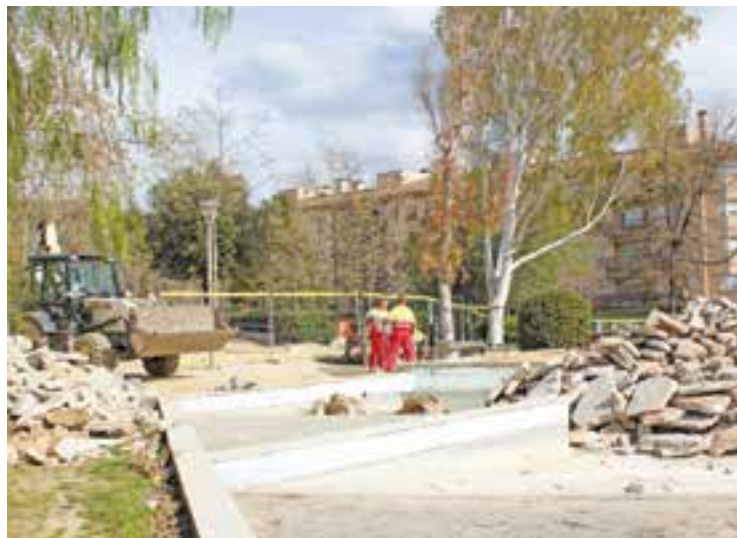
Dos operaris treballant a la plaça Catalunya la setmana passada.

en el pressupost d'inversions d'aquest 2017, suposarà que la superfície actual de la bassa, de 700 metres quadrats, es transformi en un espai que disposarà de dues àrees diferenciades de joc: una de familiar, amb 25 jocs d'aigua adreçats a persones de totes les edats, i una altra d'infantil, dirigida als més menuts, que tindrà fins a 18 elements de joc. En tots dos casos, els jocs s'activaran amb una freqüència determinada quan es premi el polsador, de manera que els usuaris podran anar interactuant amb els diferents elements. A més, l'espai, que estarà adaptat a persones amb diversitat funcional, disposarà de dutxes i de dues plataformes d'estada que faran la funció de platges dures: una d'elles