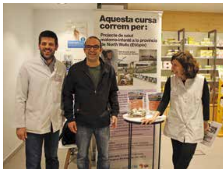
Els responsables de la Farmàcia Casanovas entregant la donació

Pel que fa a la campanya per recaptar fons, la Farmàcia Casanovas va instal·lar un estand amb informació sobre el projecte d'IPI Coop i també una guardiola on els clients van poder col·laborar durant dues