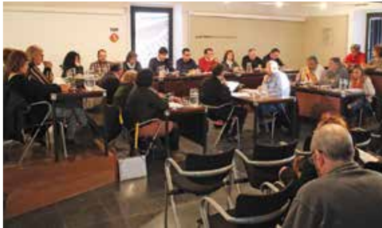
Imatge del ple de dimarts passat.

Tot i l'elevat nivell d'unanimitat que es va tornar a donar en les votacions del ple de març, en aquesta ocasió govern i oposició van apujar el to de les intervencions i es van viure alguns moments de tensió, sobretot en la discussió de les mocions i en els precs i preguntes.