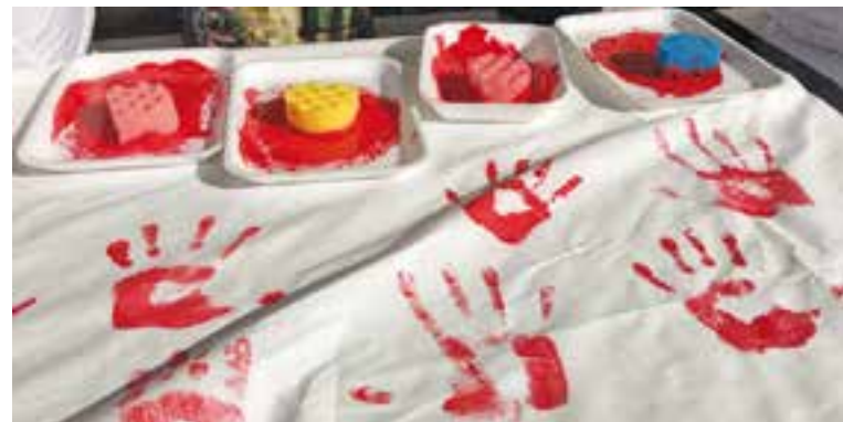
Part del mural que es va fer a la fira de Sant Josep

Stop Bullying ofereix servei de suport davant una situació d'assetjament i orientació a joves, famílies, docents i centres educatius. +