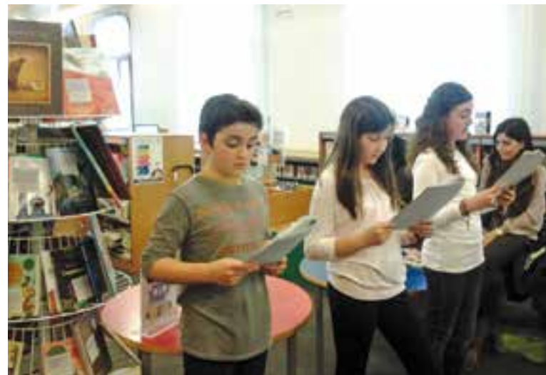
Infants a la celebració del Dia Internacional del Llibre Infantil, l'any passat. || CEDIDA

Des del 1967, el 2 d'abril, coincidint amb la data del naixement de l'escriptor danès Hans Christian Andersen, l'International Board on Books for Young People (IBBY) promou la celebració del Dia Internacional del Llibre Infantil per tal de promocionar els bons llibres infantils i juvenils i la lectura entre els més joves. ➔ || M. ANTÚNEZ