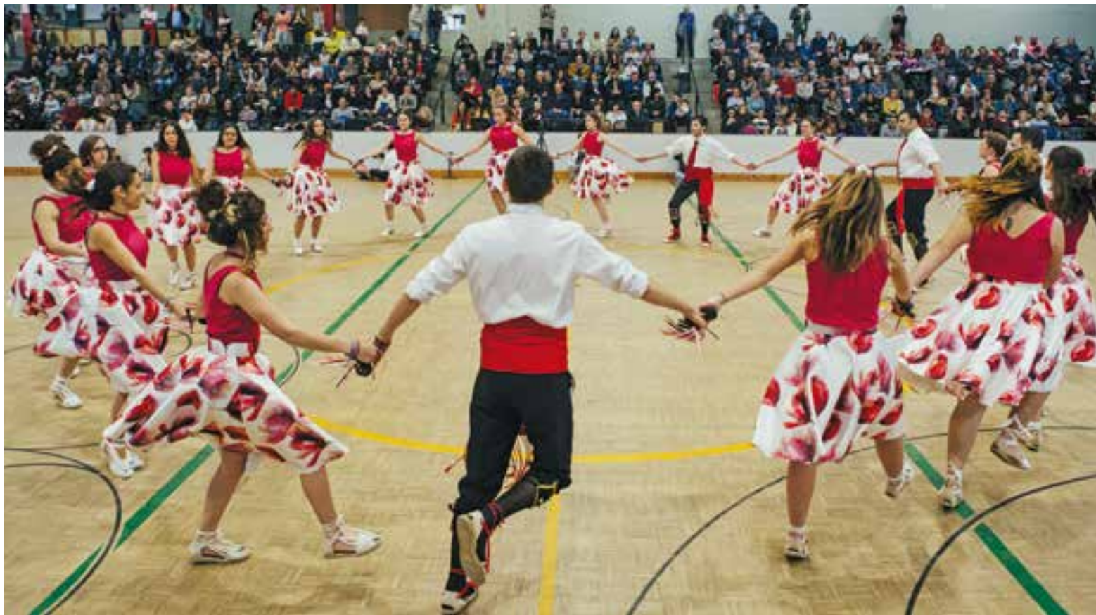
La colla de solters amb els seus nous vestits ballant a la pista del pavelló Joaquim Blume.

L'entitat va estrenar nous vestits i va incloure novetats que van ser molt ben rebudes