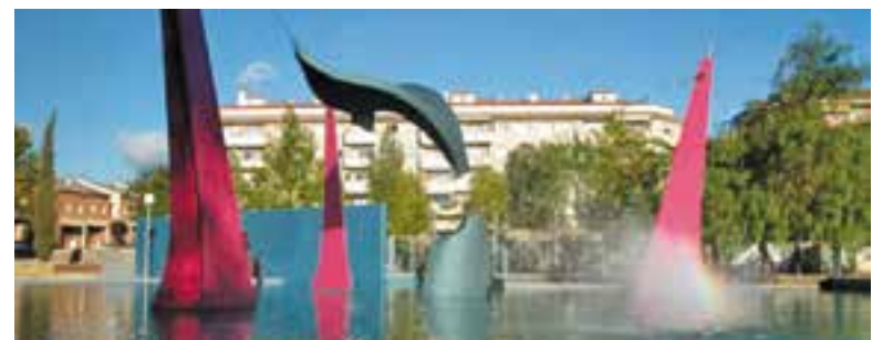
Imatge d'arxiu de l'escultura de la balena de Joan Coderch.

Prèviament al ple, el regidor de Planificació va explicar que consideraven que el projecte de reforma de la plaça "s'ajusta al que diu el Catàleg i es protegeix l'ordenació de la plaça i la seva estructura". Des del punt de vista tècnic, va apuntar que s'opta "per una millora del manteniment i la sostenibilitat de l'espai i, a més, es restaurarà l'escultura i li donarem nova vida". + || REDACCIÓ