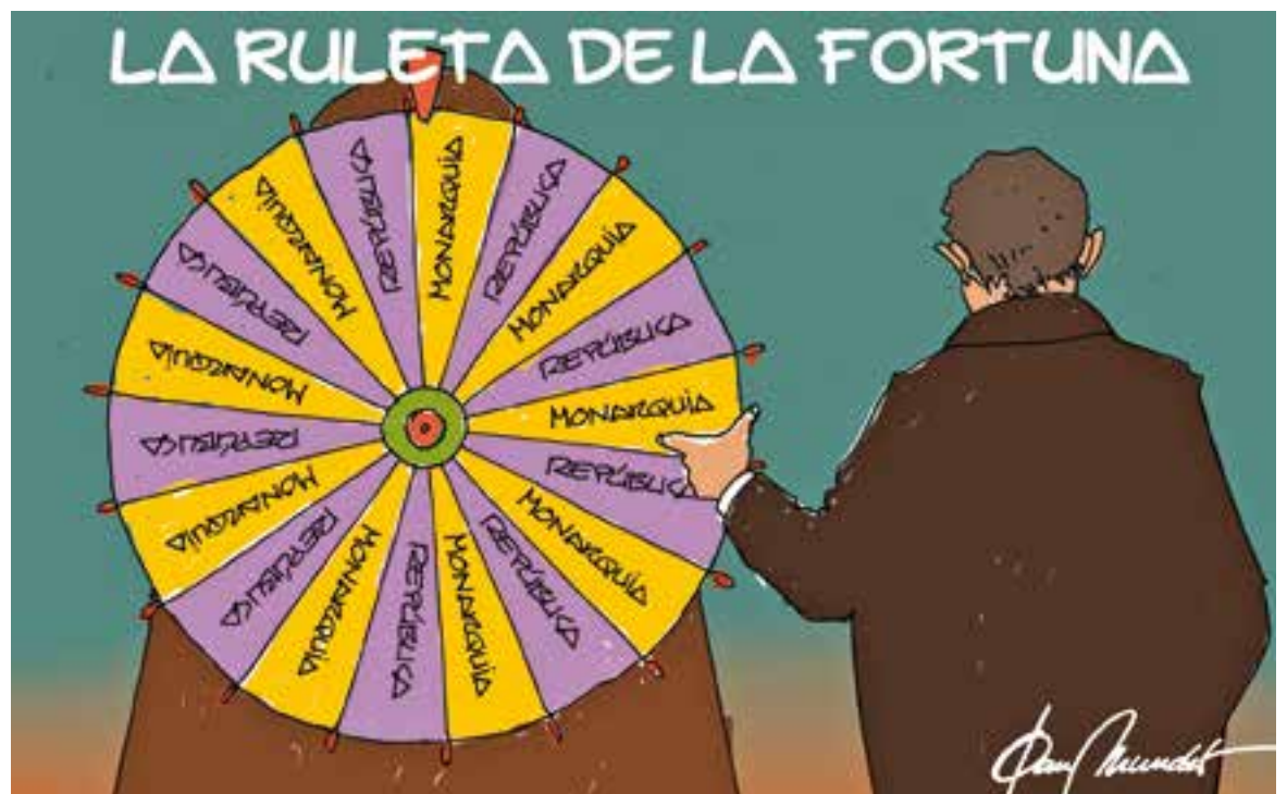
© La ruleta de la fortuna. || JOAN MUNDET

“Durant els dies foscos del genocidi contra Catalunya van ser les úniques escoles que van continuar el seu funcionament”