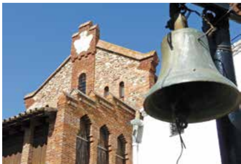
Una de les perspectives de la masia de Ca n'Oliver.