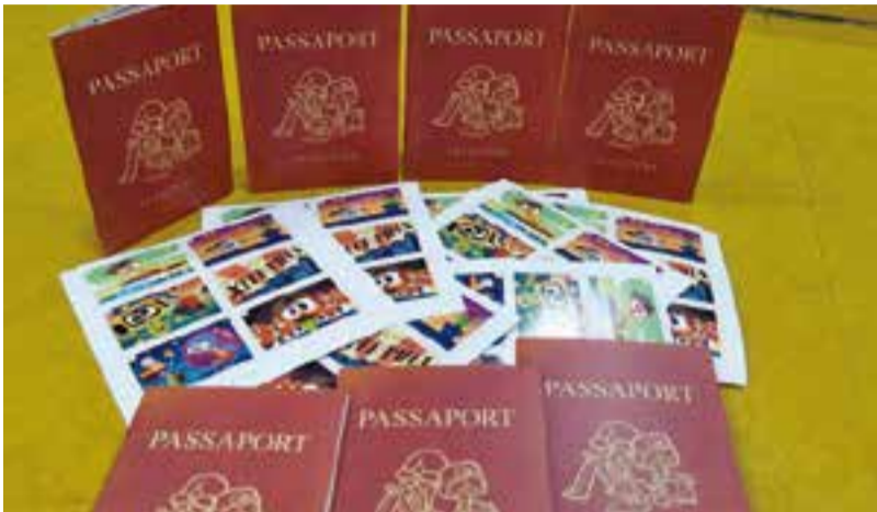
Passaports Gènius que ha editat la Xarxa de Biblioteques Municipals.

La Biblioteca Municipal Antoni Tort com altres biblioteques de Catalunya, està portant a terme una campanya de foment a la lectura dirigida als infants. L'eix d'aquesta iniciativa és el Passaport de lectura Gènius, un material editat per la Gerència de Serveis de Biblioteques-Xarxa de Biblioteques Municipals sota el paraigua de la Diputació de Barcelona amb la intenció d'incentivar la lectura des d'un vessant més lúdic i amè entre els infants d'entre 8 i 10 anys.