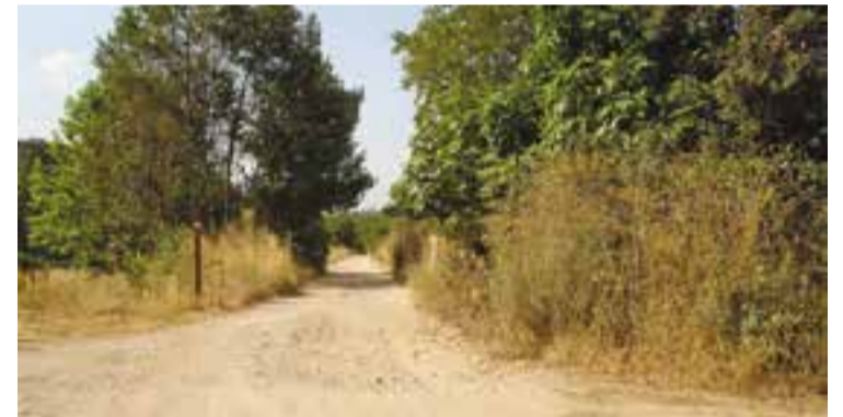
El gual del Molí al camí del riu Ripoll a l'alçada de Can Messeguer.

Durant l’any 2016, els ajuntaments van demanar l’ajut per arranjar algun dels seus camins d’acord amb uns criteris establerts com, per exemple, la urgència de les obres, ja sigui per reduir riscos imminents, estabilització de talussos o restitució de la vialitat. + || REDACCIÓ