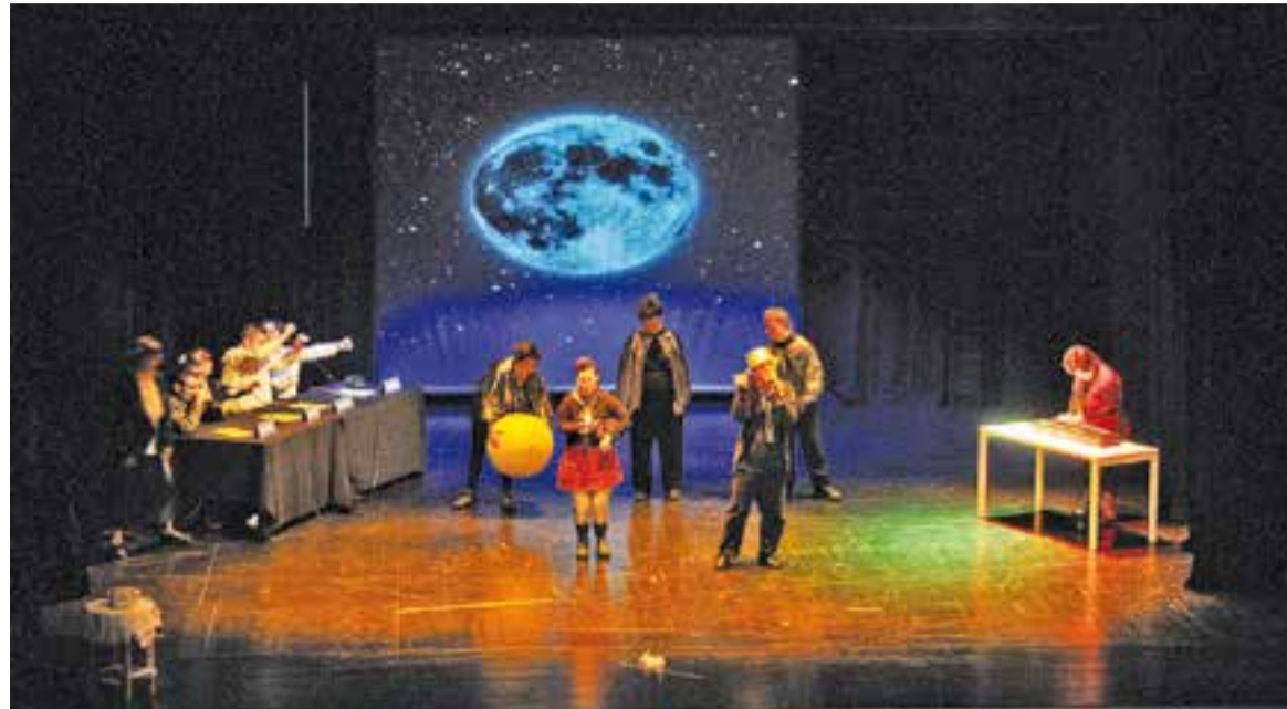
Una imatge d'una representació d'una anterior obra del TEB, 'Zapping'.

L'obra comptarà amb la participació de 35 actors i actrius dels grups del Servei de Teràpia Ocupacional i el Servei de centre de dia Ocupacional d'Inserció per a persones amb discapacitat intel·lectual del TEB Castellar. En total hi intervindran més de 50 persones davant i darrere de l'escenari, entre persones usuàries,