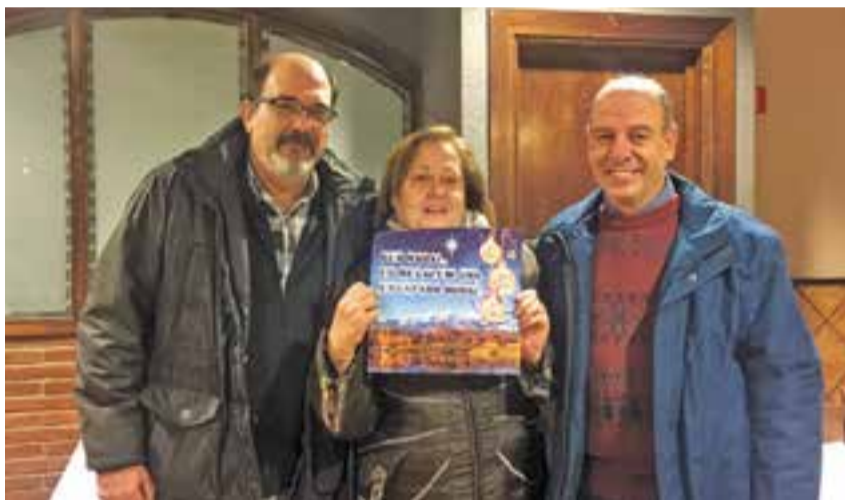
El propietari del restaurant Frutos amb el premiat i la seva dona. || COMERÇ CASTELLAR

L'associació de comerciants de Castellar del Vallès celebrarà el 26 de febrer la fira Fora Estoics i Molt Més. L'any passat, hi va haver una participació de 16 parades i a més hi va haver diferents tallers i activitats. Durant la fira, els visitants van poder dipositar unes butlletes per participar al sorteig d'entrades pel BRAM! ✦ || REDACCIÓ