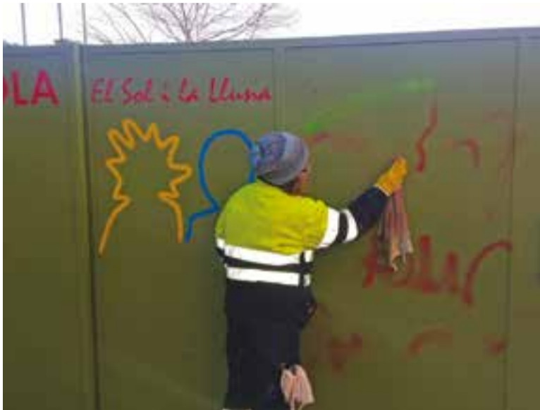
Una treballadora treu les pintades a l'entrada de l'escola.

La comunitat educativa de l'escola pública d'educació primària El Sol i la Lluna vol fer saber a tots els castellarencs i castellarenques que el darrer cap de setmana van patir “un acte de vandalisme que va afectar l'estètica de l'escola (la porta principal)” . També informen que parlant amb els veïns i les veïnes els van fer saber que, “fa poc, l'Ajuntament va canviar totes les plaques de les places públiques i l'endemà van aparèixer pintades amb “grafitis”, com la porta i les parets de l'escola” . L'escola es refereix a la substitució de les plaques dels carrers que s'està fent des de fa algunes setmanes