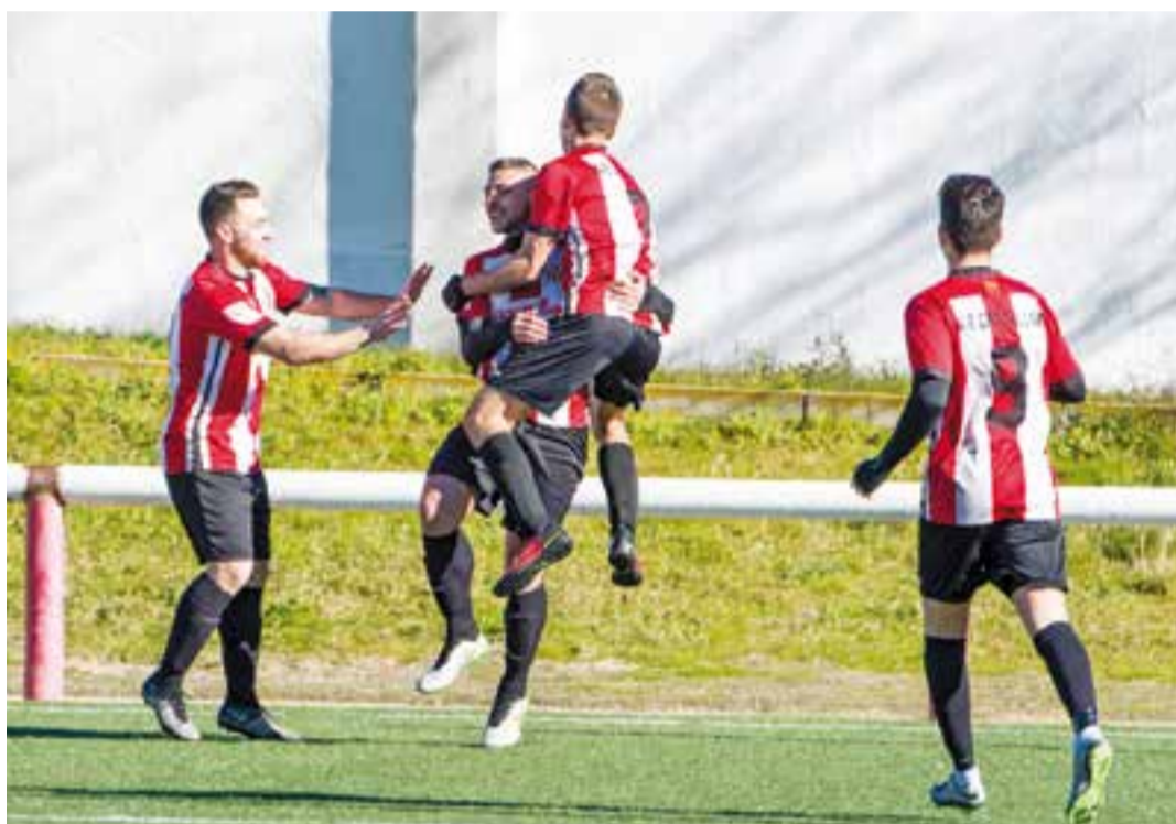
Els jugadors de la UE Castellar celebren el primer gol del partit enfront del Bellavista Milán.