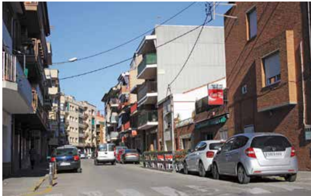
Aquest és el tram del carrer Santa Perpètua que serà objecte de remodelació.

S'habilitarà una única franja d'estacionament de bateria inversa a la dreta del carrer; per obtenir més places i contribuir així a una major seguretat a l'hora d'aparcar. D'altra banda, la vorera més ampla comparat amb un nou arbrat, Perera Borda ( Pyrus calleriana ), una espècie de creixement lent i que no fa fruit, i evitar d'aquesta manera les afectacions al paviment. A més, els escocells es protegiran amb material a base de resines per aprofitar l'aigua de la pluja. També es col·locaran jardineres amb reg per capillaritat amb plantes que siguin de baixa exigència hídrica.