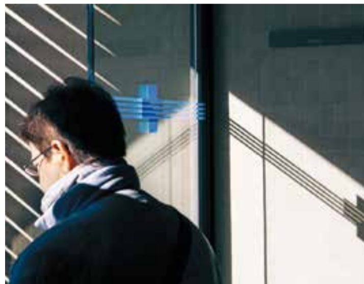
Una usuària dins del CAP. || Q. PASCUAL

L'ICS recorda als usuaris que tenen a la seva disposició el telèfon 061 CATSALUT respon, amb professionals sanitaris que atenen consultes i si cal, envien un metge o una ambulància al punt que ho necessiti. A més, des del Canal Salut també han elaborat tot un seguit de recomanacions per superar la grip que es poden consultar a canalsalut.gencat.cat + || ROCIO GÓMEZ