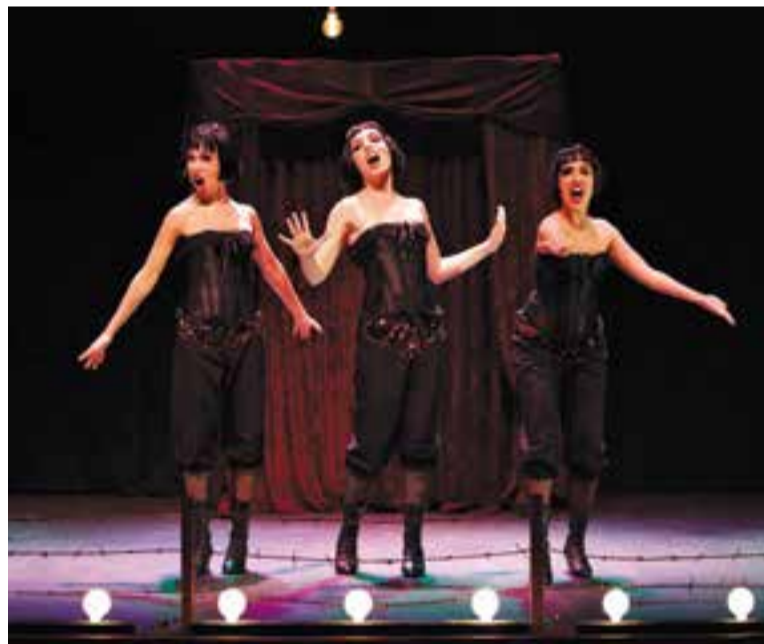
Les Divinas presenten 'Enchanté' a Castellar del Vallès, demà.

El vestuari és un disseny original de Glòria Duran, "està molt cuidat, amb tots els detalls, encaixa molt amb l'obra" . L'estètica de Divinas es fa palesa també en el maquillatge de les noies i l'escenografia que les acompanya en cada espectacle. ➔