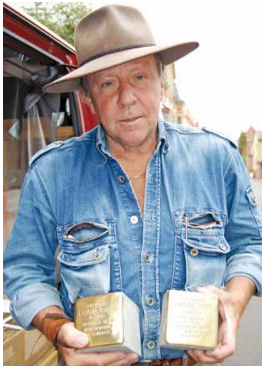
L’artista alemany, Günter Demnig, creador de les plaques.

Des de l’inici del projecte el 1993 s’han instal·lat més de 60.000 plaques a una vintena de països europeus