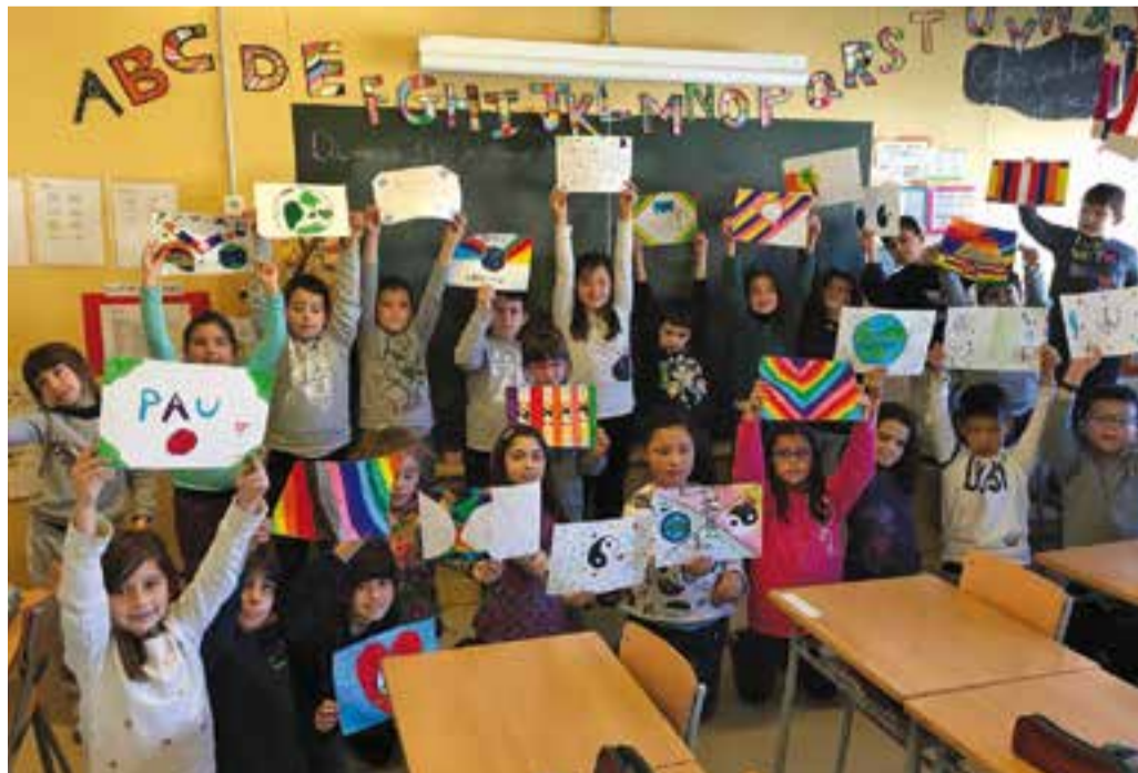
Els alumnes del Joan Blanquer han fet diverses tasques de sensibilització.

Des de fa uns anys, l’Escola Joan Blanquer se suma aquesta celebració i durant tot el mes de gener ha fet un treball de sen-