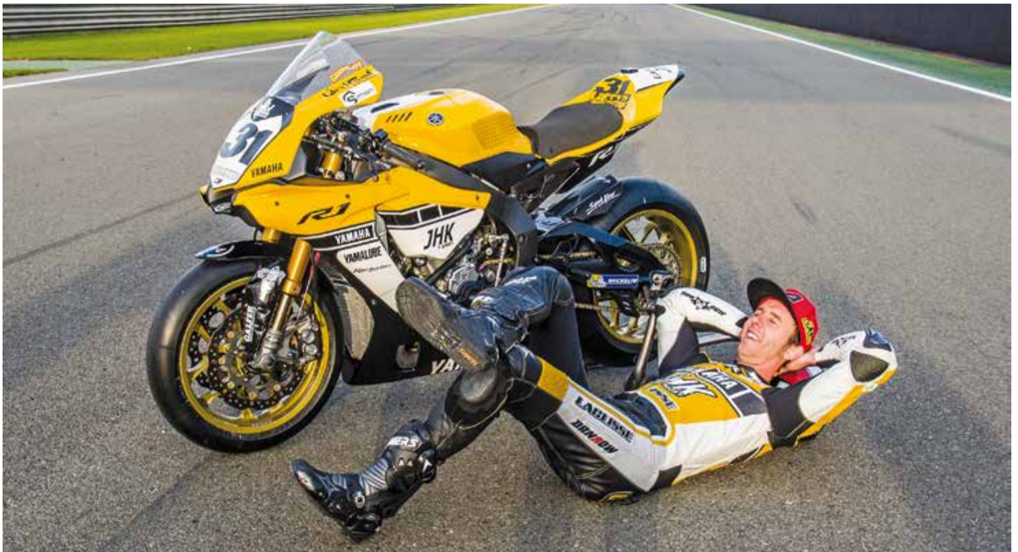
El campió d'Europa, Carmelo Morales, pren el sol a la recta de Xest en l'última cita del FIM CEV Repsol 2016, posant en exclusiva per L'Actual.