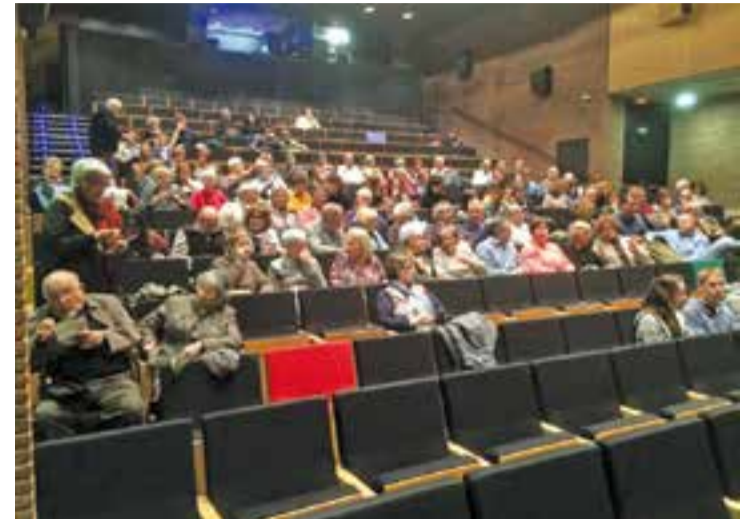
Abans de la projecció de 'La teoria sueca del amor' a l'Auditori Municipal.