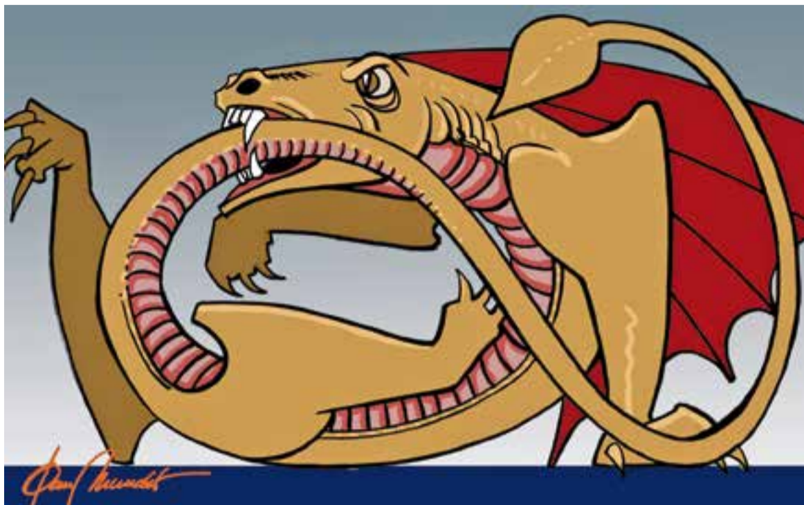
© Mossegar-se la cua. || JOAN MUNDET

mani de l'11 de setembre –dolça rutina de jove trajectòria–. També seguirem amb les rutines de caire ecològic. Aviat sentirem la crida d'omplir de brutícia i fer la nostra aportació a la destrossa de boscos, coneguda també com: anar a buscar bolets. El novembre ens caurà al damunt carregat de castanyes i panellets, que