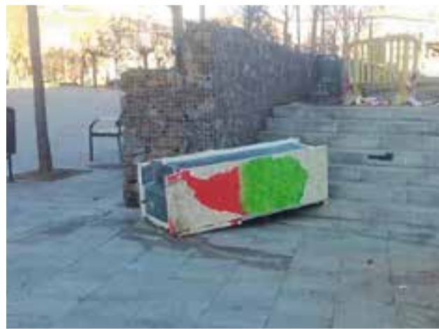
La nevera de la Biblioteca Comunitària a terra a la plaça Major. || CEDIDA

Des del col·lectiu de la vila denuncien la falta de respecte per aquest espai comú i públic i lamenten que s'hagi produït aquesta situació. La intenció de la proposta era poder oferir un intercanvi de llibres per fomentar-ne l'accés i la lectura. + || A. PARERA