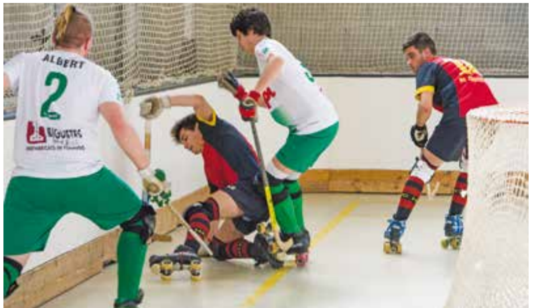
L'equip grana va caure plantant cara, aquesta vegada contra el potent Bell-lloc a Lleida. || A.SAN ANDRÉS

La represa del partit va ser homòloga en intensitat a la primera part. L'equip del Pla d'Urgell, però, va avançar-se a pilota aturada després d'un penal, xiulat per peus a dins l'àrea i també dubtós, però que aquesta vegada no va caure a favor del Castellar. Sergio Ruiz es va en-