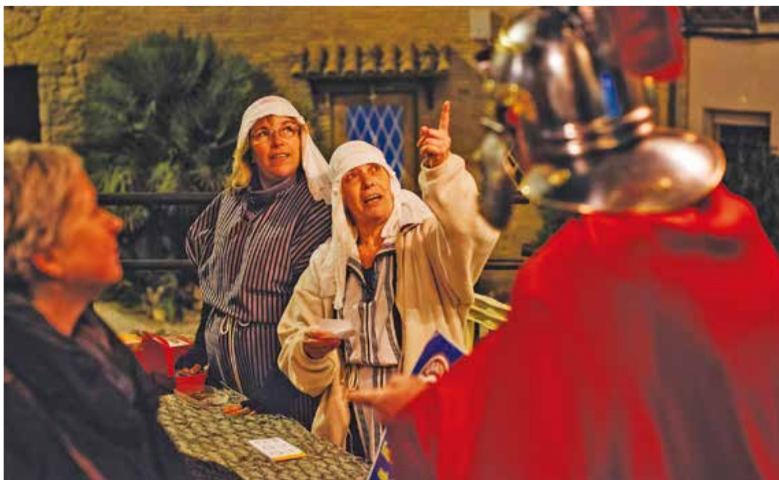
Acolliment i punt d'entrada al Pessebre Vivent de Sant Feliu del Racó, l'any 2015.

El Pessebre Vivent comptarà, un any més, amb la col·laboració de Caldo Aneto, “que ens regala 550 litres de