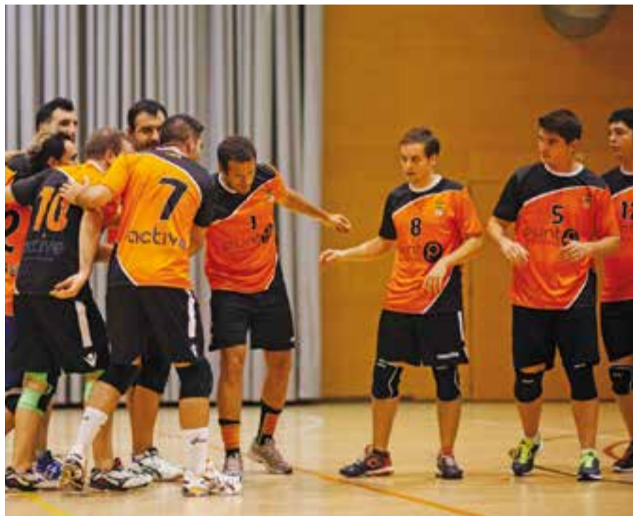
L'equip masculí va aconseguir la segona victòria consecutiva en lliga.