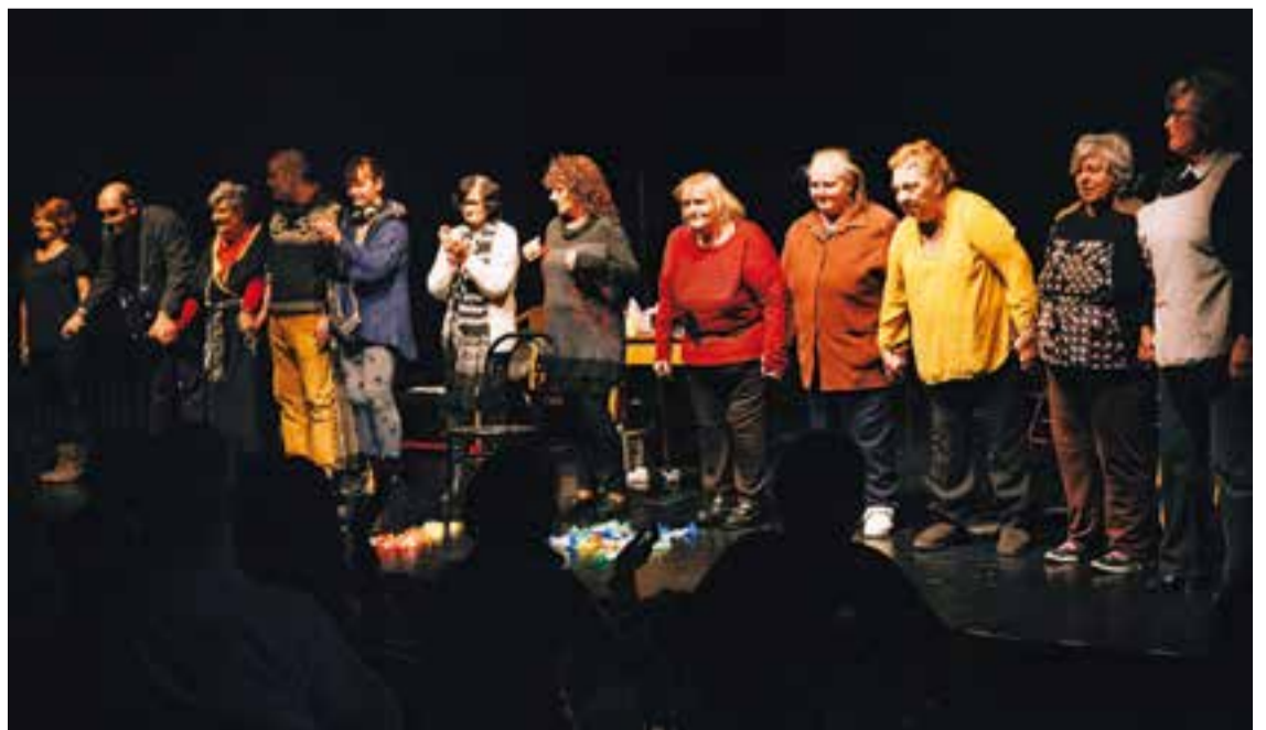
Moment final de la representació 'Quin embolic de veïns'

El grup de teatre forma part programa de salut Arc de Sant Martí que contempla una proposta integral d'acció envers les persones amb problemes de salut emocional o mental, i els seus familiars. Aquesta iniciativa ja suma 18 edicions. †