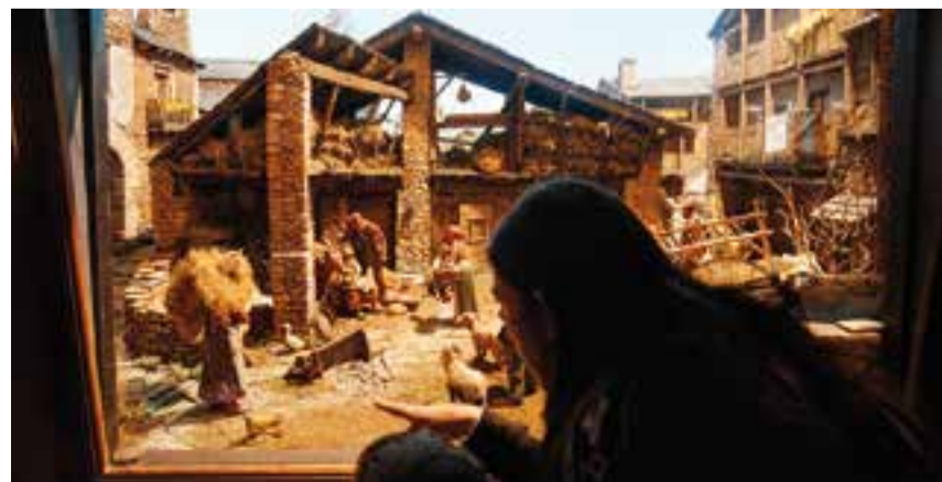
Un dels pessebres de la mostra de Sant Feliu, l'any 2015.

12.00 a 14.00 h i de 18.00 a 20.30 h, el 24 de desembre i 15 de gener, de 12.00 a 14.00 h i l'1 i 6 de gener, de 18.00 a 20.30 h. Des de fa més de 30 anys Sant Feliu del Racó manté viva la tradició dels pessebres. Enguany, l'exposició comptarà amb una desena de diorames i una exposició fotogràfica de la història de l'entitat. A més, per cinquè any consecutiu, els més petits podran jugar al joc “On és el caganer?”, que consisteix a trobar els diferents objectes amagats a cada pessebre. Els participants entraran el sorteig d'un regal sorpresa.