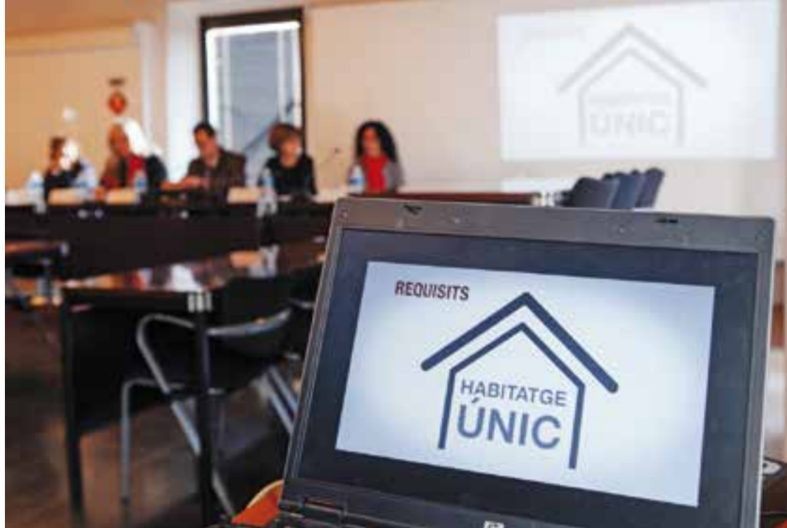
La presentació oficial del servei es va fer dimecres a la Sala de Plens de Ca l'Alberola.