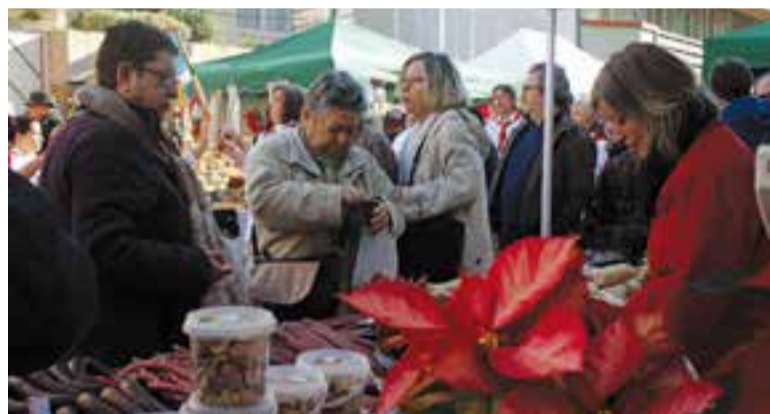
Ambient de la Fira de Nadal de l'any passat al centre de Castellar.

Aquest diumenge se celebrarà als carrers Sala Boadella i Santa Perpètua la Fira de Nadal, organitzada per Comerç Castellar. A l'esdeveniment hi participen establiments del petit i mitjà comerç de Castellar i també de fora de la vila, autònoms, artesans i entitats i associacions. En total hi haurà una trentena de parades. La novetat d'aquest any serà la presència d'un Tió gegant, que s'ubicarà davant de la Biblioteca Municipal, i que entre les 11 i les 14.30 h i de 16 a 18.30 h cagarà regals per a tots els nens i nenes que assisteixin a la Fira. A les 10.30 h hi haurà un tetatre en anglès a càrrec de l'escola d'idiomes Kids & Us. A les 17 hores també s'oferirà xocolata amb melindros per a tots els visitants i a les 18 h es comunicaran els guanyadors del concurs d'Aparadors fet als comerços locals. Tot seguit, es farà el sorteig de les paneres de Nadal amb obsequis dels comerços de l'Associació de Comerciants. La Fira tornarà a coincidir enguany amb la celebració de la Marató de TV3. Durant tot el dia, hi haurà un taller infantil de fanalets de Nadal i la participació de l'entitat Deejays del Revés. † || REDACCIÓ