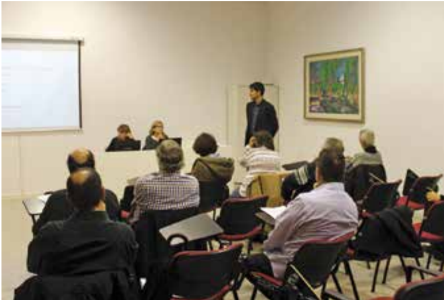
La Sala Lluís Valls Areny d'El Mirador va acollir la mesa d'ocupació el 23 de novembre || AJ. CASTELLAR

La taxa d'atur de Castellar -11,55%- es manté per sota de la mitjana catalana i de la comarca del Vallès Occidental