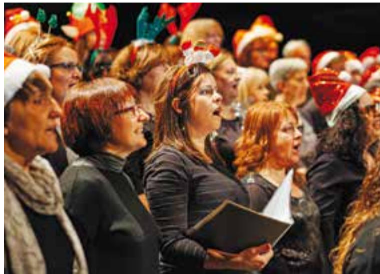
Concert de Nadal d'Espaiart, l'any passat, a l'Auditori Municipal.

Artcàdia ha previst diverses audicions protagonitzades pels seus alumnes. La primera serà de piano i