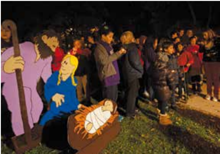
Plantada del Pessebre als Jardins del Palau Tolrà, any 2014.

L'entitat ha programat diverses propostes tradicionals i festives