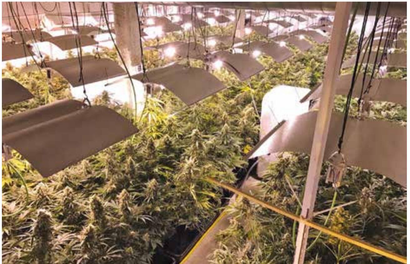
Una imatge de la nau del polígon del Pla de la Bruguera totalment preparada per al cultiu intensiu de marihuana.

L'interior de la nau estava compartimentat en diferents estances completament aïllades: 4 d'aquestes estances, de grans dimensions, es trobaven perfectament adequades per al cultiu intensiu de marihuana amb pantalles i bombetes de 600 watts per facilitar el creixement de les plantes, aires condicionats i ventiladors per controlar la temperatura, humidifica-