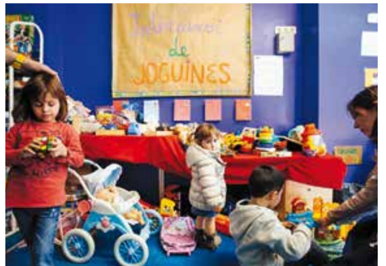
Una imatge d'una campanya passada de l'intercanvi de joguines. || Q. PASCUAL

Dissabte 26 de novembre, Sound 21 va preparar un gran show. Es tractava de l'espectacle Cocoloco, un número que ve des de Gandia, València, amb gogos i diversos discjòqueis. "Una festa que no deixa indiferent ningú" , va dir el propietari. Cocoloco va portar al nou local de Castellar animació, regals, jocs i un photocall, tot amenitzat amb la música del discjòquei Andrés Honrubia H Sound. ✦ || CRISTINA DOMENE