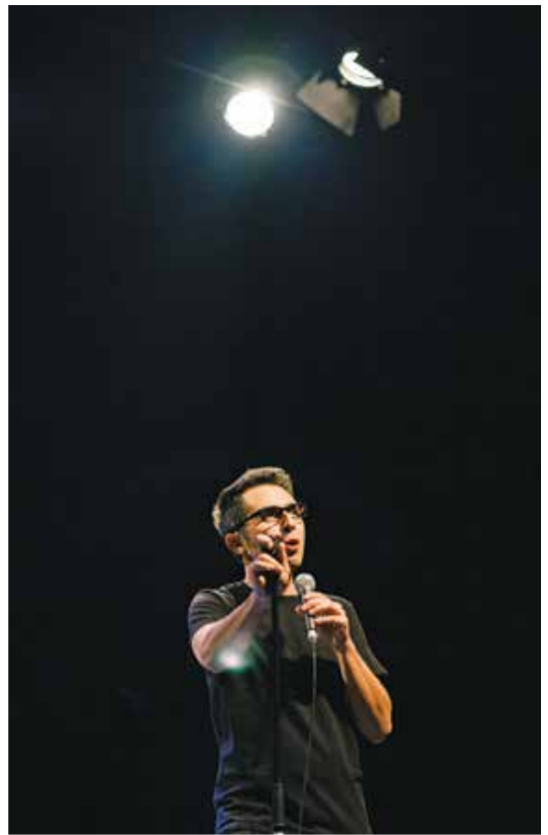
Berto Romero en un moment de l'espectacle a Castellar del Vallès

L'humorista aconsegueix fer riure també amb els silencis, ja que a més de la paraula, domina molt bé els gestos i el moviment dalt l'escenari. Així com la interacció amb el públic. La improvisació i la rapidesa a l'hora de respondre és un dels punts forts de Romero. Un espectacle, doncs, que no va defraudar els espectadors, que anaven predisposats a riure i passar una bona estona amb un showman que va acomplir amb les expectatives. +