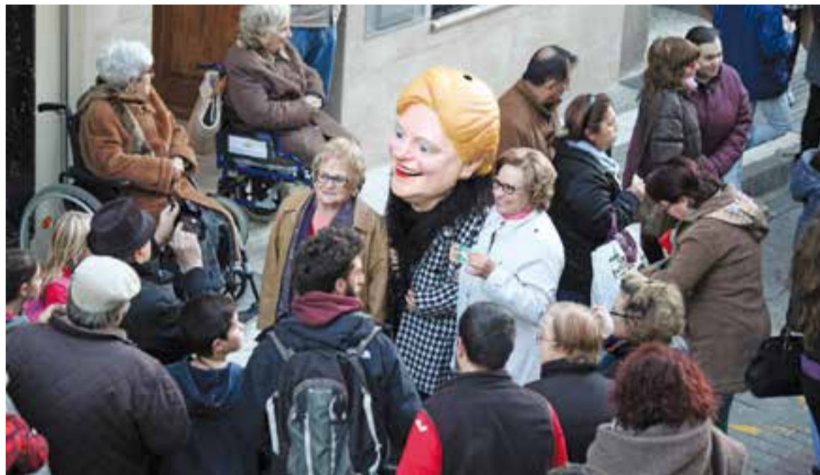
La 'Grossa' va ser la protagonista de la tarda de divendres passat al carrer Major || R. GÓMEZ

Aquest és el tercer any que se celebra el sorteig de la Grossa de Cap d'Any, que tindrà lloc el 31 de desembre. La Loteria de Catalunya repartirà cinc grans premis. La Grossa (primer premi) estarà valorada en 20.000 € per euro jugat (100.000 € per cada bitllet de 5 €). El segon premi atorgarà 6.500 € per euro jugat (32.500 € per bitllet de 5 €); el tercer, 3.000 € per euro jugat (15.000 € per bitllet de 5 €); el quart donarà 1.000 € per euro jugat (5.000 € per bitllet de 5 €); i, finalment, el cinquè de 500 € per euro jugat (2.500 € per bitllet de 5 €). Cal destacar que els beneficis de la venda de les butlletes es destinaran a programes socials a Catalunya. ✦ || ROCIO GÓMEZ