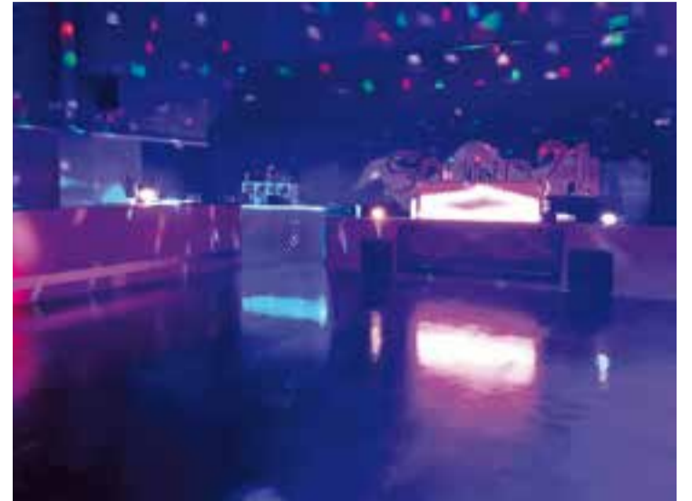
Imatge de la sala de la nova discoteca Sound 21. || Q. PASCUAL