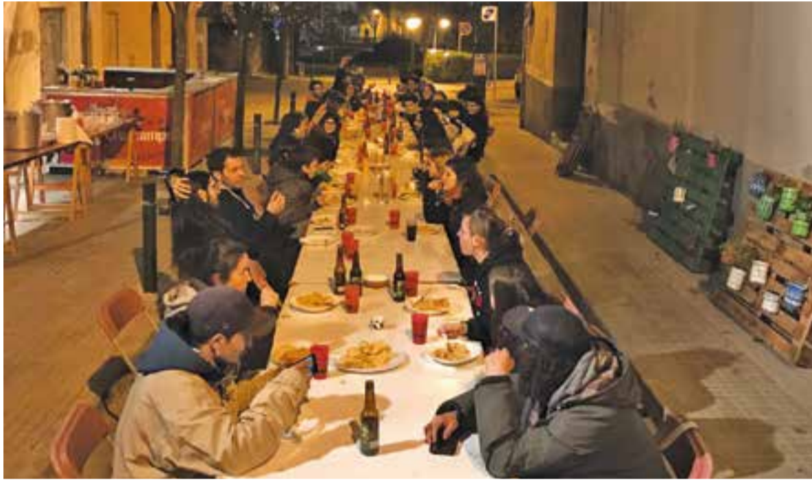
El sopar durant la festa d'aniversari al carrer del Centre