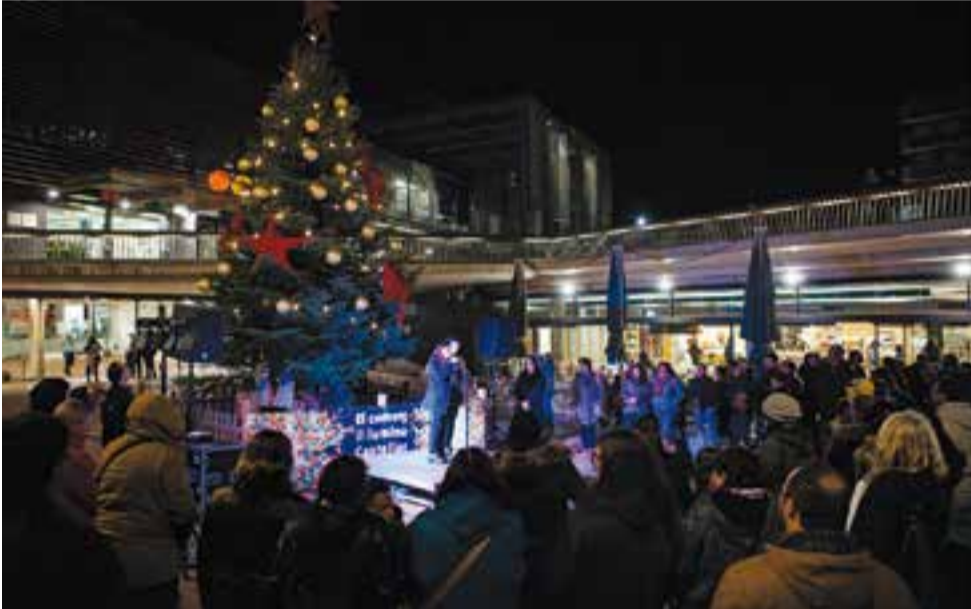
Moment de l'encesa de l'arbre de Nadal ubicat davant del Mercat municipal, divendres passat.

L'arbre de Nadal s'estarà a la plaça del Mercat fins l'arribada dels Reis d'Orient