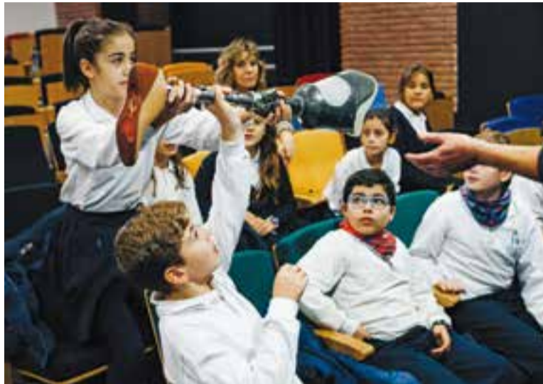
Alumnes de FEDAC Castellar tocant i observant una pròtesi de cama.

Com veuen els joves la discapacitat? Són conscients dels obstacles que es troben les persones amb diversitat funcional en el seu entorn quotidià? Aquestes preguntes va tractar de resoldre el taller que l'entitat Amputats Sant Jordi va realitzar dimecres en el qual suposa el primer acte dels diversos que es faran per commemorar el Dia Internacional de les Persones amb Discapacitat, que se celebra el 3 de desembre. Els assistents a l'activitat van ser els alumnes de sisè de FEDAC Castellar. L'activitat es va dividir en dues parts: “Una teòrica on intentem explicar què són les discapacitats, els tipus i l'amputació, que és l'autèntica discapacitat invisible” , explica la fisioterapeuta d'Amputats Sant Jordi, Míriam Aguilera, que afegeix que a la segona part “sortim al carrer i provem l'accessibilitat a l'entorn de l'escola on anem” . Una mica la intenció del taller és que “els nens es posin en la pell d'una persona que viu una discapacitat visual o anar en cadira de rodes” .