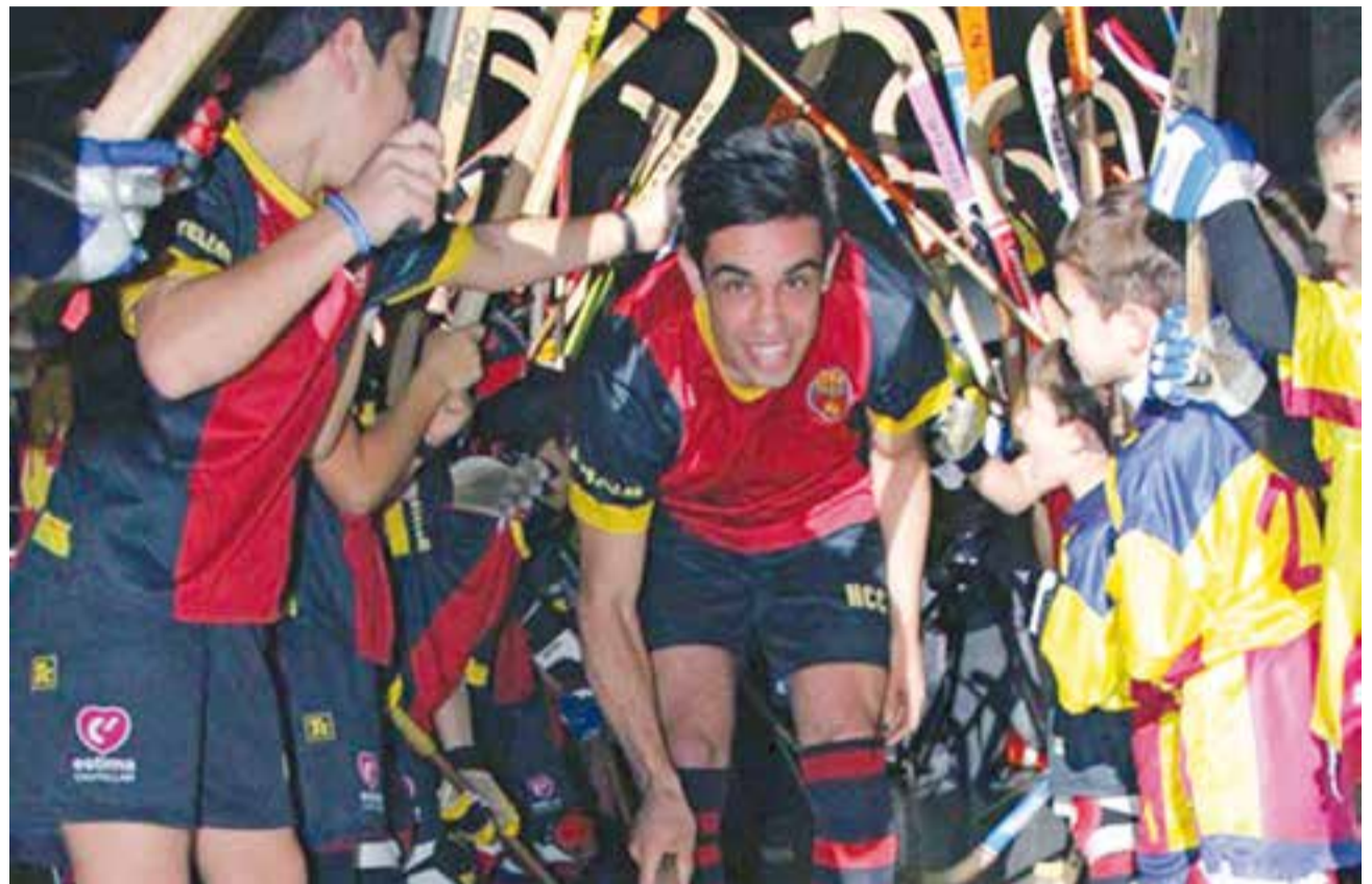
Les categories inferiors van fer passadís al primer equip, que en la jornada de divendres va superar per 3-2 al Juneda. || HC CASTELLAR

La jornada gran de l'Hoquei Club Castellar va celebrar-se aquest passat dissabte al vespre al pavelló Dani Pedrosa de Castellar. Tretze equips i més de 120 jugadors, van desfilar pel terratzo del pavelló, tancant la festa amb el sopar de germanor del club, amb l'actuació de DeeJays del Revés.