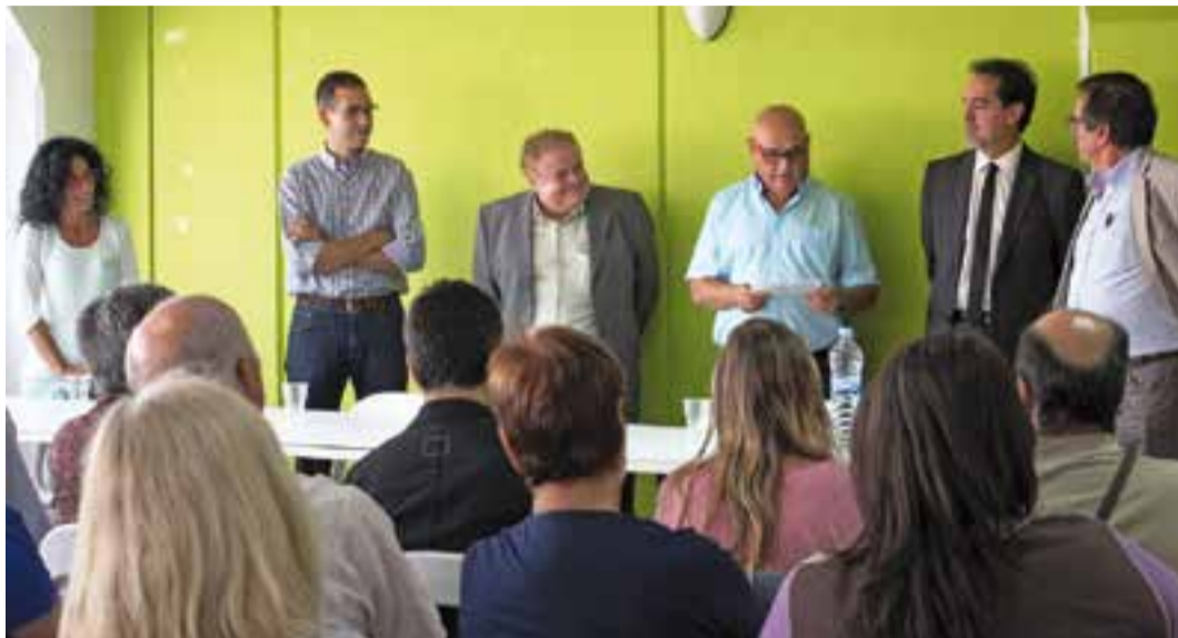
Representants institucionals a les noves instal·lacions del TEB. || R. GÓMEZ

El centre castellarenc forma part d'una xarxa de cooperatives que fomenta