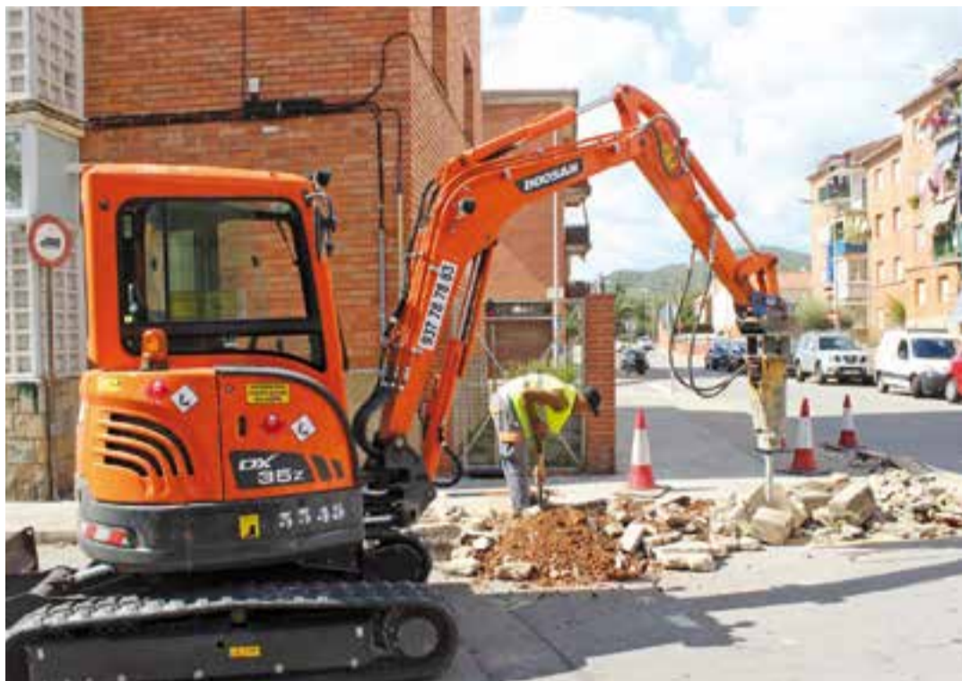
Un operari treballant dimecres al matí a la cruïlla entre la carretera de Sabadell i el carrer Trias de Bes.

Precisament, aquests dies també s'estan duent a terme treballs de pintura viària a 120 ubicacions. Aquestes feines, que són de renovació i de nova implantació, inclouen la senyalitza-