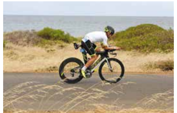
Un dels membres del nou club de triatló.

A banda de la presentació, el club posa a disposició dels interessats, una direcció d'email ( club@dimensiontri.com ) i una pàgina web ( www.dimensiontri.com ) i de Facebook ( https://www.facebook.com/nextdimensiontri ). +