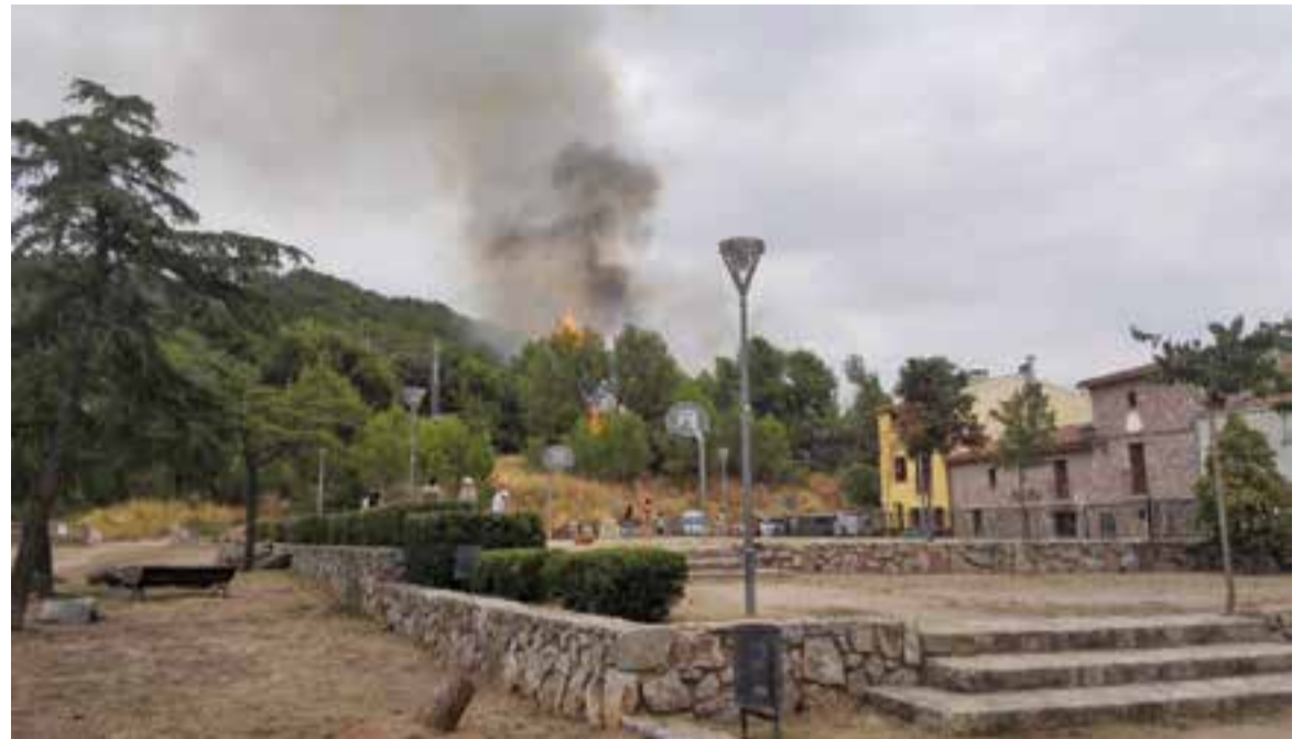
Primers instants de l'incendi que va tenir lloc el 5 de setembre, el moment més crític que s'ha viscut aquest estiu.

El foc de l'Era d'en Petasques no va ser l'únic incendi que es va pro-