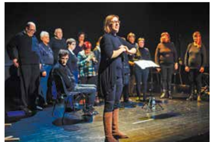
Moment del concert que la coral Pas a Pas va oferir durant l'hivern passat. || Q.P.

En el repertori triat hi trobarem 'Sonrisas y lágrimas', 'Em dones força', "que és la peça estrella de la coral", alguna de Txarango, d'Els Pets, la 'Cançó dels Esquirols', de Teràpia de Shock, d'ABBA, una versió veta per ells de 'Alegria' del Cirque du Soleil, etc. "coses que han anat sonant durant aquests 5 anys i coses noves". + || M.ANTÚNEZ