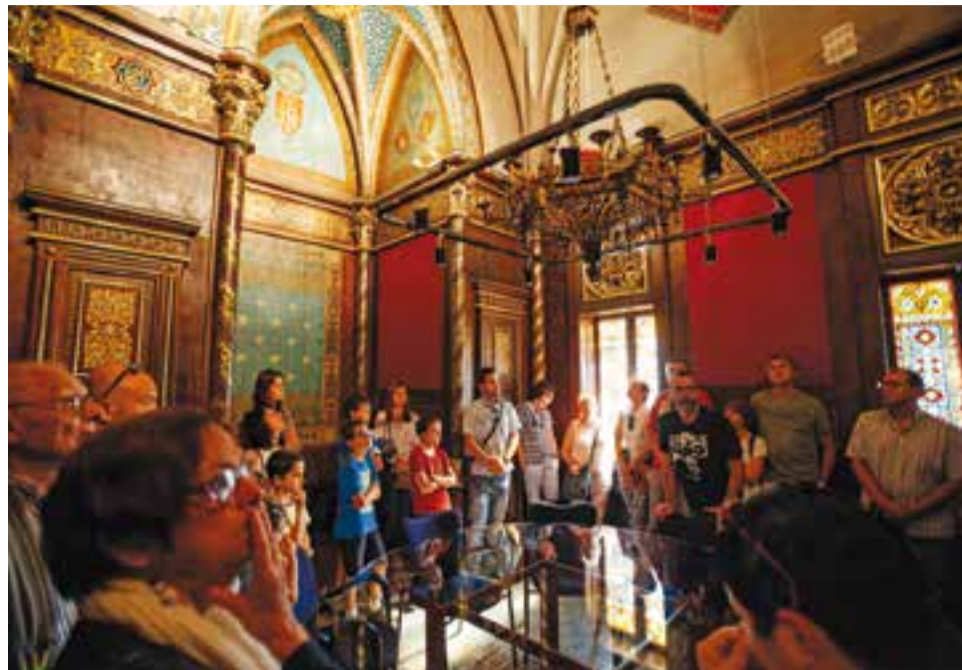
Visita a la sala de la Capella del Palau Tolrà.

La Parròquia de Sant Esteve va ser la segona part de la descoberta. Començant per la cripta de la família Tolrà, la terrassa de la Rectoria i seguint pel cor i els laterals del pis superior de l'Església fins arribar al moment estelar, l'accés al campanar. Per acabar, també hi va haver una darrera sorpresa, el pas pel passadís subterrani que uneix la parròquia i la Rectoria. +