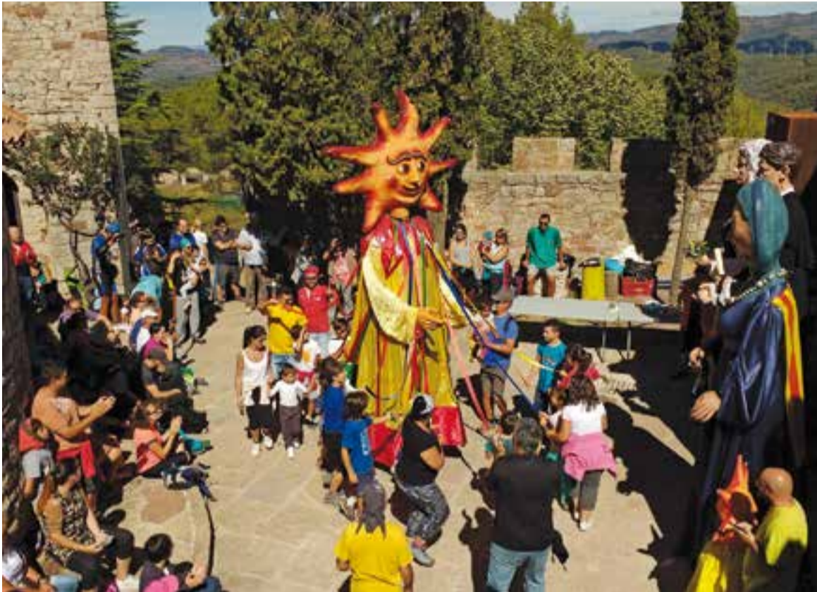
'El ball de les cintes' dels gegants de Castellar, una de les activitats a la Trobada de Tardor al Puig de la Creu.