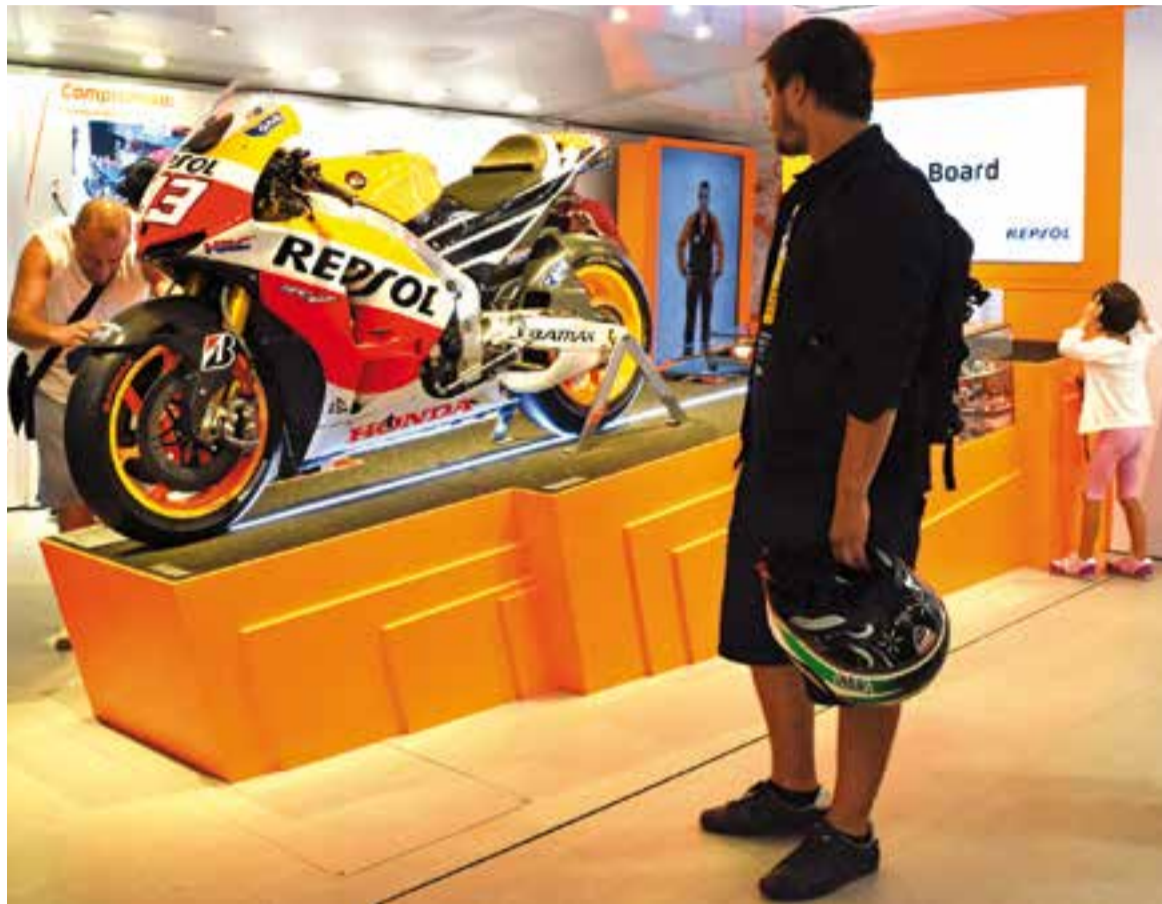
La moto de Marc Màrquez va fer les delícies de grans i petits durant el cap de setmana.

L'expectació creada entre els afeccionats al motociclisme de Castellar va quedar calmada una vegada que l'exposició itinerant va obrir portes de manera gratuïta i la interactivitat de l'esdeveniment, amb pantalles tàctils i cronologia dels fets esportius, repassaven la tradició de la marca del sol i els èxits dels seus pilots i principalment de l'equip Repsol Honda de MotoGp.