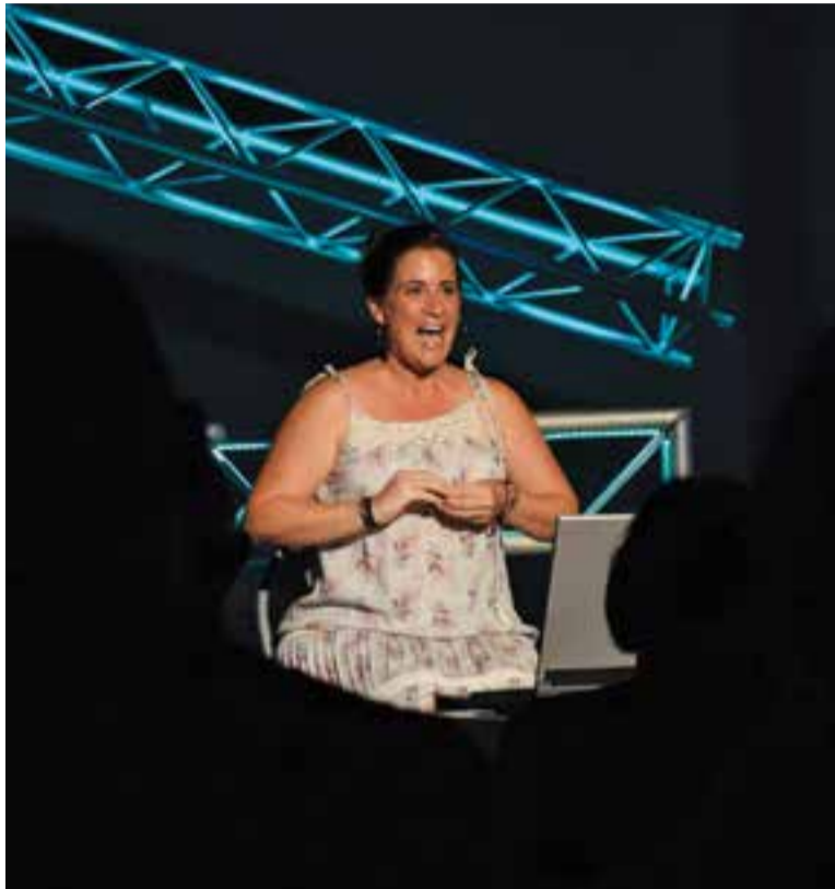
Un dels esquetxos de 'L'univers perdut'. || A.P.