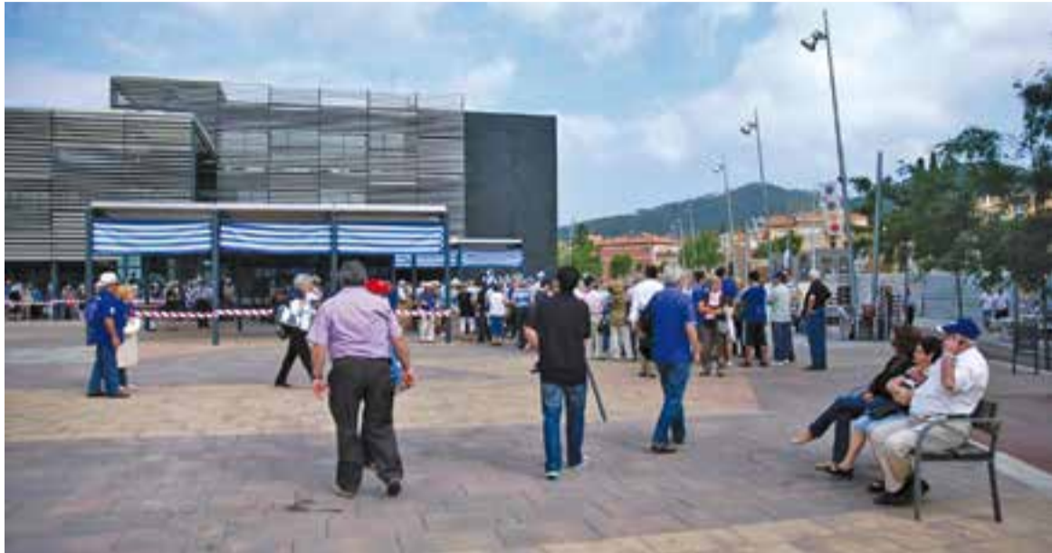
Imatge d'arxiu de l'aplec de Penyes del 2011 a Castellar del Vallès.