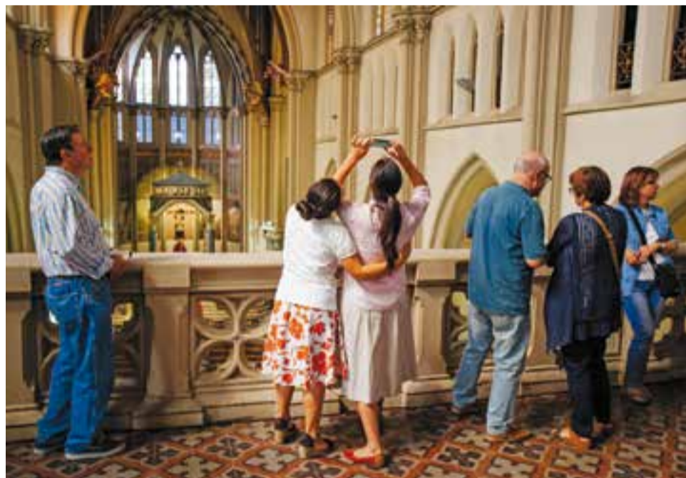
Visitants a l'Església de Sant Esteve durant les Jornades del Patrimoni. || Q. PASCUAL