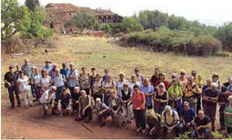
Els participants que van prendre part ahir a la sortida de Can Padró.

El cicle Vine i Camina +60 d'itineraris de natura per a gent gran va arrencar ahir amb una sortida a Can Padró amb un recorregut de 6,6 quilòmetres i dificultat baixa. En general, es tracta de caminades planeres, matinals, en grup i guiades per conèixer l'entorn natural i cultural de Castellar del Vallès i rodalies. Per