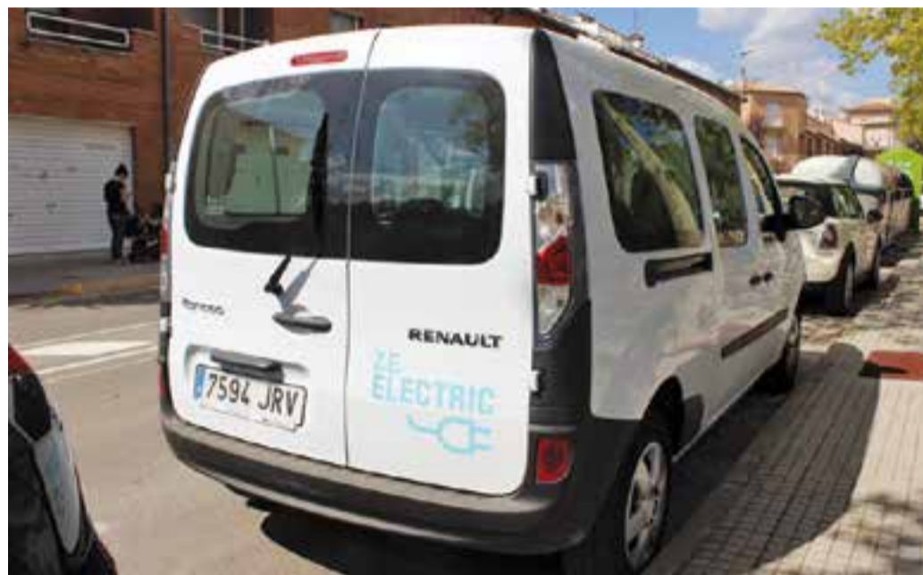
Imatge del primer vehicle 100% elèctric que incorpora l'Ajuntament de Castellar.

Una de les activitats tradicionals de la Setmana de la Mobilitat Sostenible i Segura són els tallers de mobilitat sostenible adreçats a les escoles de Castellar. Alumnes de quart de primària de les escoles FEDAC Castellar, Bonavista, El Casal, Mestre Pla, Joan Blanquer, Sant Esteve i El Sol i la Lluna han realitzat tallers d'educació viària i ambiental. Enguany, han estat prop de 300 els nens i nenes que han après nocions diverses sobre les normes de circulació, seguretat, protecció del medi ambient i mobilitat sostenible. El taller es dividia en dues parts: una primera que es feia a classe amb tots els alumnes junts i on se'ls explicava les diferents normes i una segona, que consistia en sortir al carrer, i observar conductes o elements gens respectuosos amb la mobilitat sostenible. La Setmana també ha inclòs dues caminades per a públic divers: el cicle Vine i Camina + 60, que va començar ahir el cicle, i la que forma part del cicle Camina i fes salut, que començarà a les 9.30 hores des de la porta de l'Àrea Bàsica de Salut dimecres 28 de setembre. + || REDACCIÓ