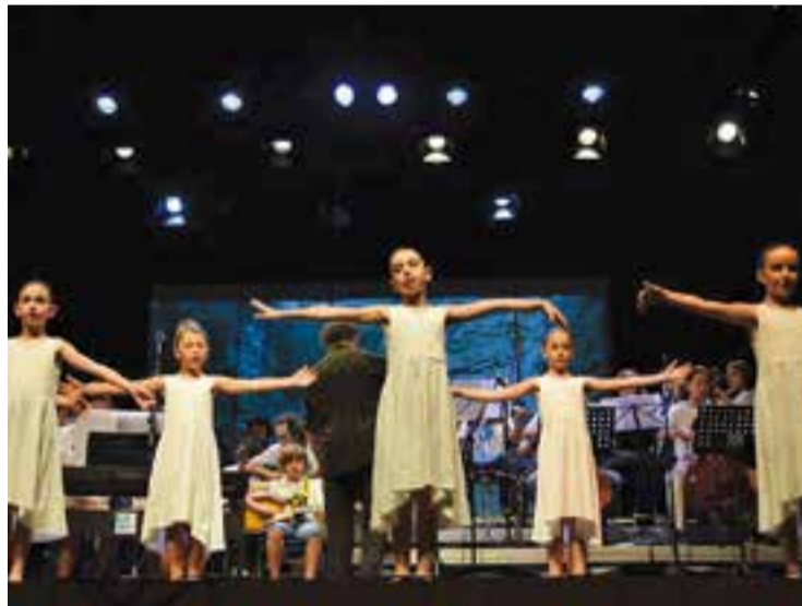
Grup de dansa d'Arctàdia en un moment del concert de dissabte passat.

El grup de dansa va ballar la 5a simfonia de Beethoven, amb final sorpresa inclòs "perquè ho vam fer rockero!". ➔