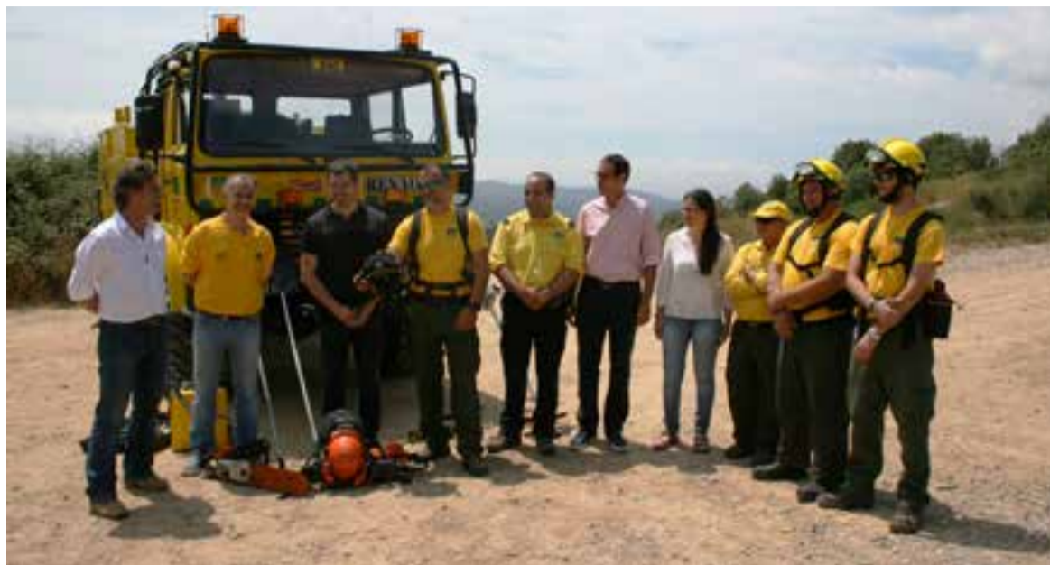
Presentació del nou vehicle de la Federació d'ADF, dilluns passat

tarà a la Regió d'Emergències Metropolitana Nord dels Bombers de la Generalitat a Cerdanyola del Vallès. L'objectiu és millorar la coordinació dels efectius per tal de ser més ràpids i eficients en l'extinció. A més, tant els Agents Rurals com el Pla de Vigilància contra Incendis Forestals de la Diputació de Barcelona destinaran efectius per a tasques de vigilància i sensibilització als boscos. En el cas de la Diputació hi haurà 9 Unitats de Vigilància, i 3 Punts de Guaita a la comarca.+