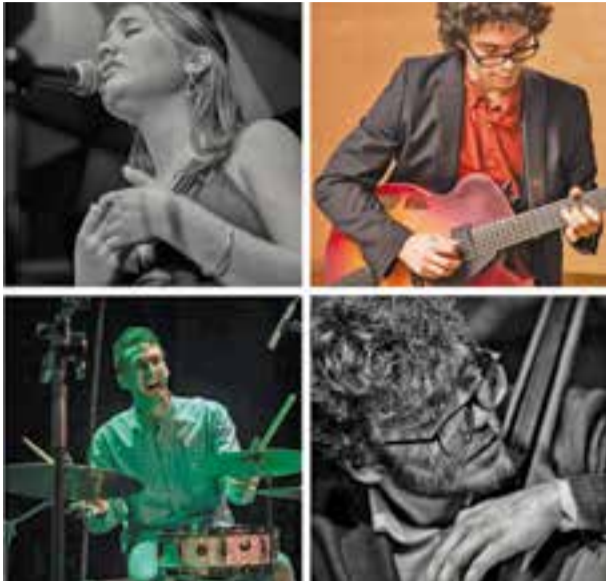
Els quatre components de 4 P's Quartet