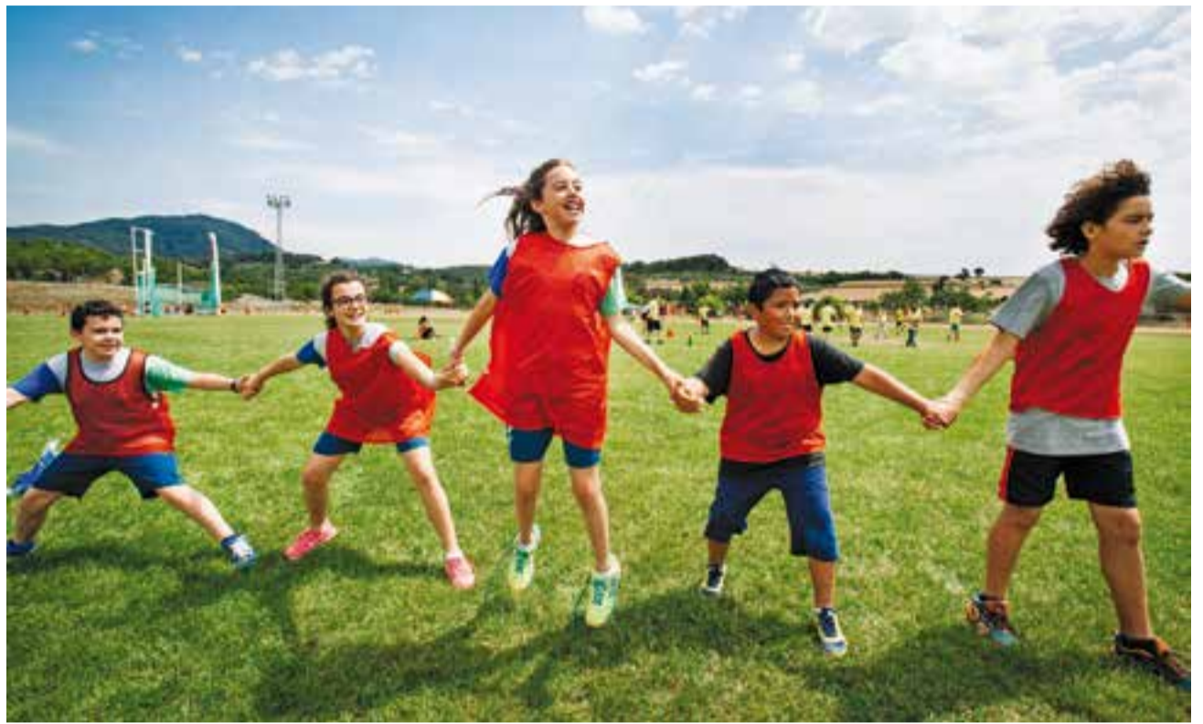
Infants d'una de les escoles de Castellar en les Jornades Esportives.

de cinquè i sisè de primària han participat en les jornades