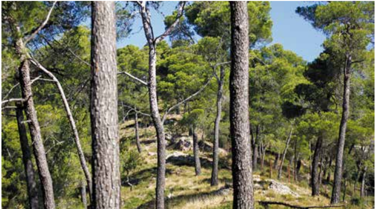
Imatge d'arxiu d'unes vistes dels boscos dels voltants de Castellar.

Des de l'any 2011, la vigilància en l'àmbit del Parc Natural de Sant Llorenç del Munt i l'Obac s'ha inclòs en el mateix programa a través de la ruta del PVI que es fa des del municipi de Sant Llorenç Sa-