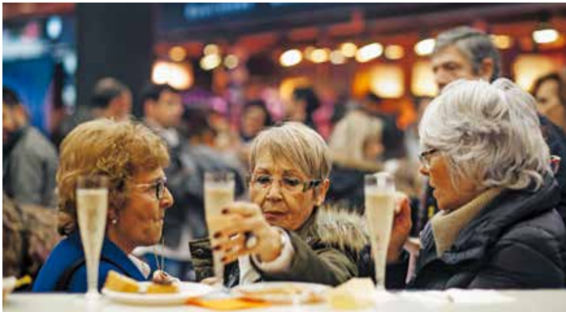
Diverses clientes del Mercat durant la passada de tapes del Mercat al febrer passat.

Els clients podran degustar diferents tapes acompanyades de beguda