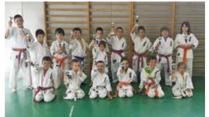
Els nois del Kyokushin amb els trofeigs guanyats a Hostalric.

Aquest tipus de combats no competitius serveixen per introduir als lluitadors més petits al món del karate i per establir relacions amb els diferents practicants de Kyokushinkai d'altres clubs i escoles.