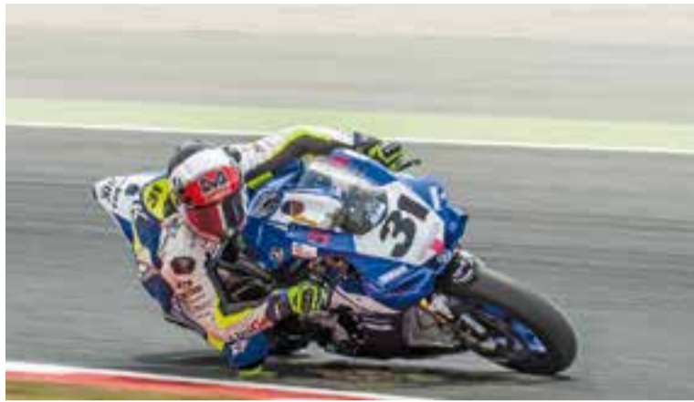
Morales a la segona part de la cursa de Superbike.

Al seu darrere, Scheib passava a Medina i marcava dues voltes ràpides seguides, quedant Medina i Climent despenjats del duet capdavanter.