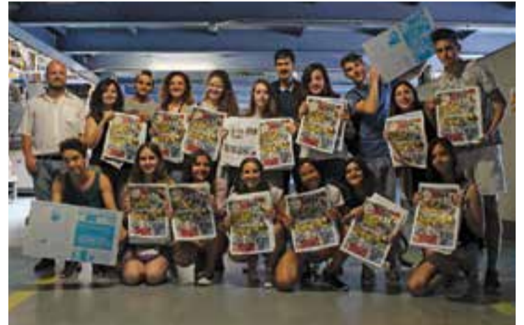
Estudiants que han elaborat L'ACTUAL Jove d'aquest any a la rotativa.

En el darrer número de L'Actual, anava incorporat L'Actual Jove, un suplement de 8 pàgines amb articles realitzats per 18 joves de Castellar. Enguany, en la tercera edició del projecte, han participat alumnes dels Instituts Castellar i Puig de la Creu, i per primer any també de FEDAC Castellar i El Casal.