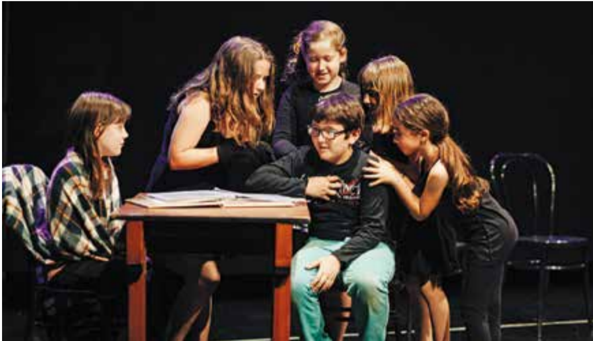
L'actuació dels alumnes de teatre musical amb 'Roald Dahl'.

L' Esbart Teatral de Castellar i Espaiart van organitzar el passat cap de setmana la 4a Mostra de Teatre Infantil i Juvenil a la vila. Des de dissabte 11 de juny a la tarda i diumenge 12 diferents actuacions teatrals van fer-se a l'escenari de la Sala de Petit Format de l'Ateneu.