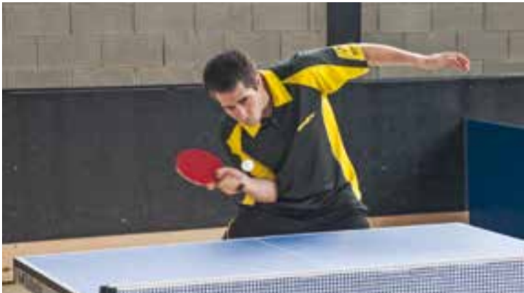
Un dels jugadors de l'ATT Castellar durant el Memorial.

Aquest dissabte va celebrar-se la setena edició del Memorial Carles Simón de tennis taula, organitzat per l'Associació Tennis Taula de Castellar, un torneig on cada any el nivell de joc dels jugadors va augmentant progressivament, tant en categoria absoluta, com en les inferiors, amb una sèrie de jugadors que en un futur marcaran l'esdevenir del grup palista castellarenc.