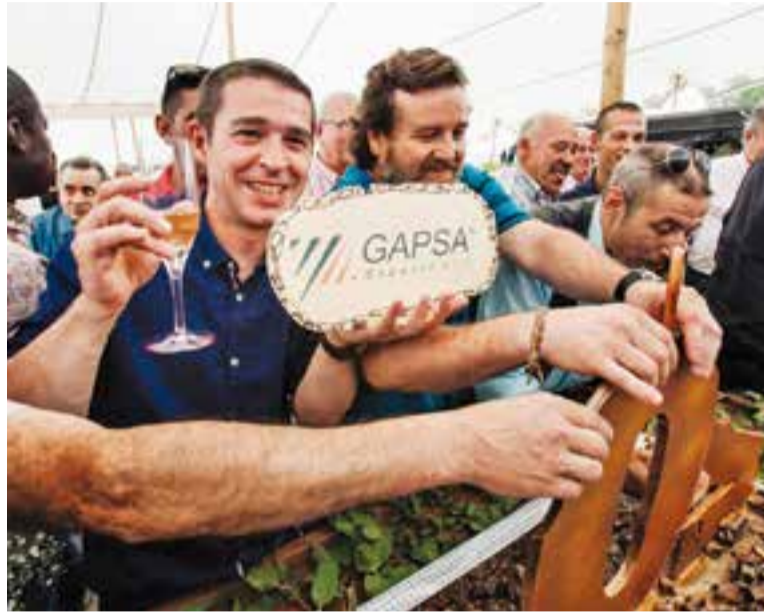
Dissabte passat, el personal de GAPSA va viure una jornada festiva.

GAPSA és líder en la fabricació d'armaris metàl·lics de persiana i ocupa el primer lloc en exportaci-