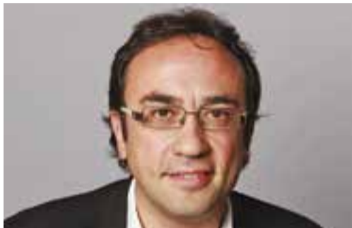
El conseller Josep Rull.