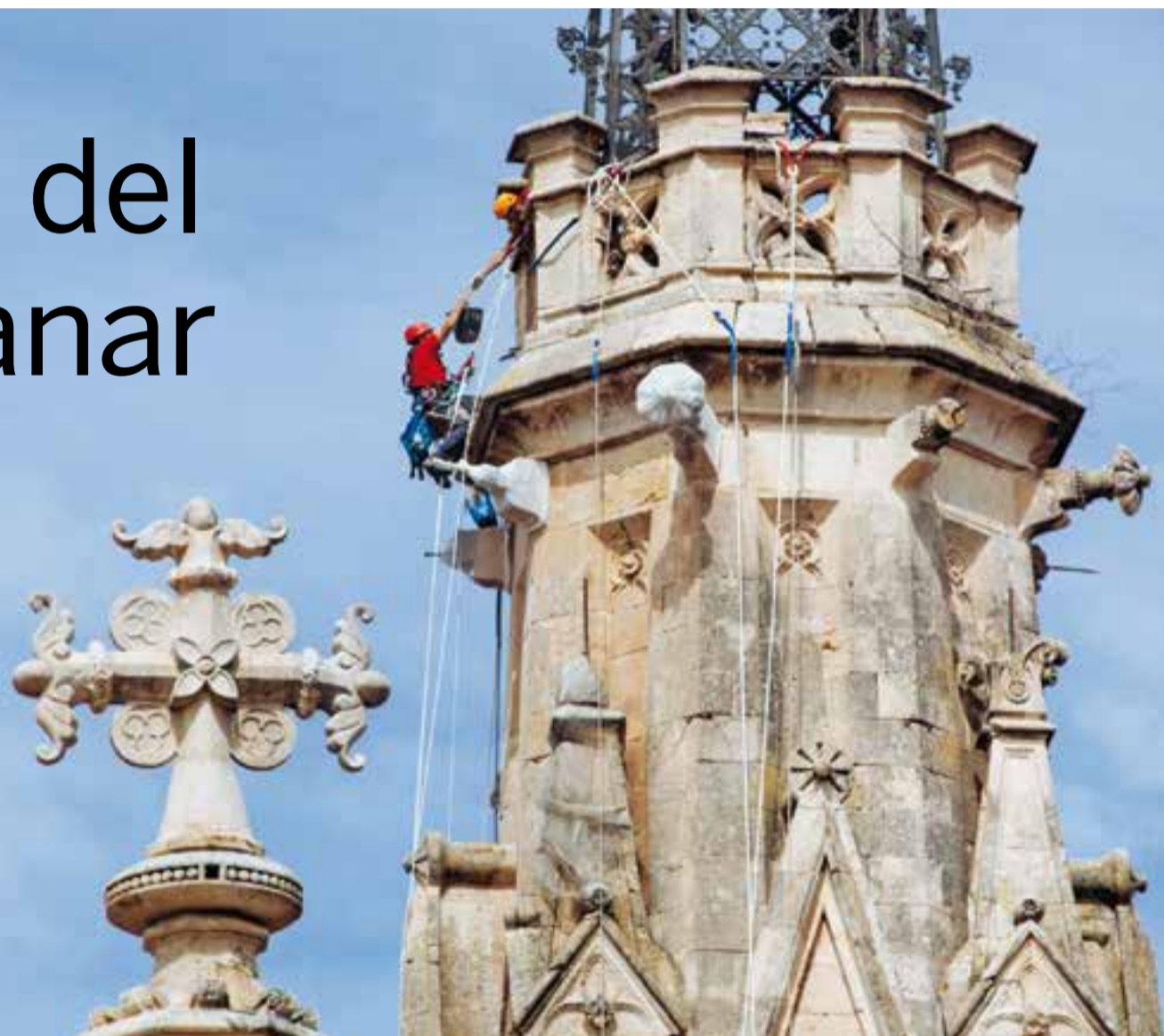
Operaris de l'empresa Trever, especialitzada en treballs verticals, actuant sobre una de les façanes del campanar de l'església de Sant Esteve.