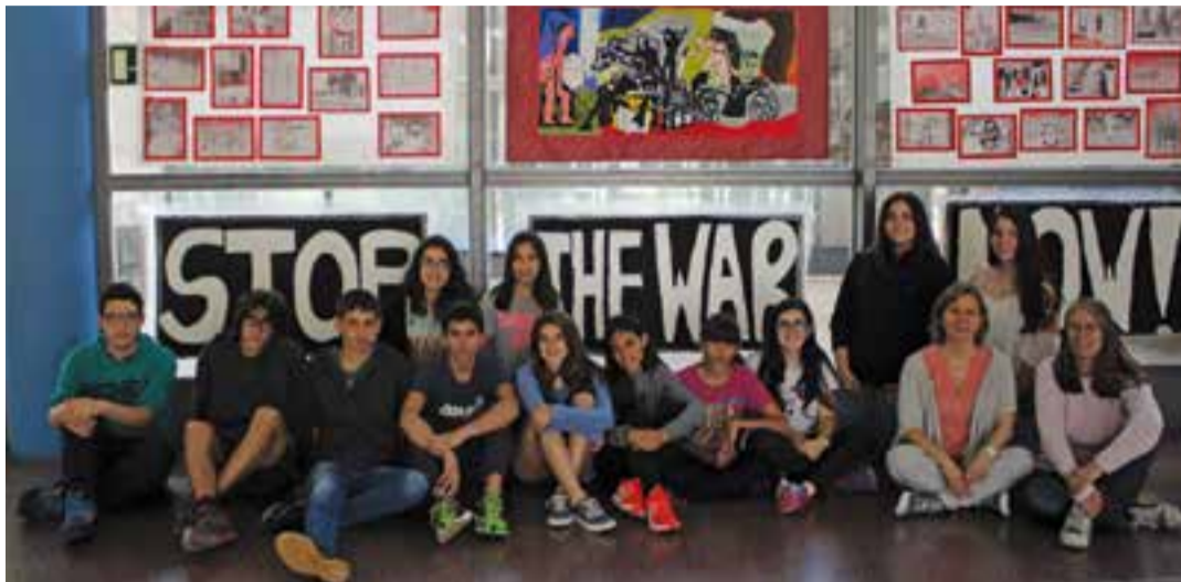
Alumnes i professorat de l'INS Castellar que han treballat en el projecte de l'assignatura Visual i plàstica.

El projecte va néixer en el si de l'assignatura de Visual i Plàstica: "Al llibre hi ha una imatge del Guernica de Picasso i ens