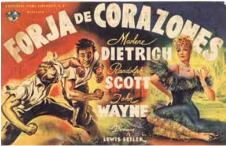
Programa de mà de la pel·lícula 'Forja de corazones'