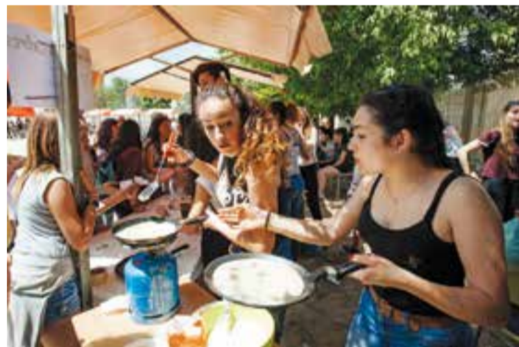
Una parada de la Festa de les Cultures al pati de l'institut.

Macedònia està preparant un nou rellengu generacional per escollir les cinc noves cantants que seran la imatge i veu del grup del 2017 al 2021. Des de dimecres, totes aquelles nenes interessades a formar part de la nova formada de les Macedònia, es poden inscriure al web del grup per a passar un procés de càsting. L'únic requisit per a presentar-s'hi és haver nascut entre els anys 2001 i 2005. Aquesta ja serà la quarta generació de les fruites del grup Macedònia des del seu naixement, l'any 2000, una proposta pensada per introduir els més petits de la casa al món de la música i dels concerts. + || REDACCIÓ