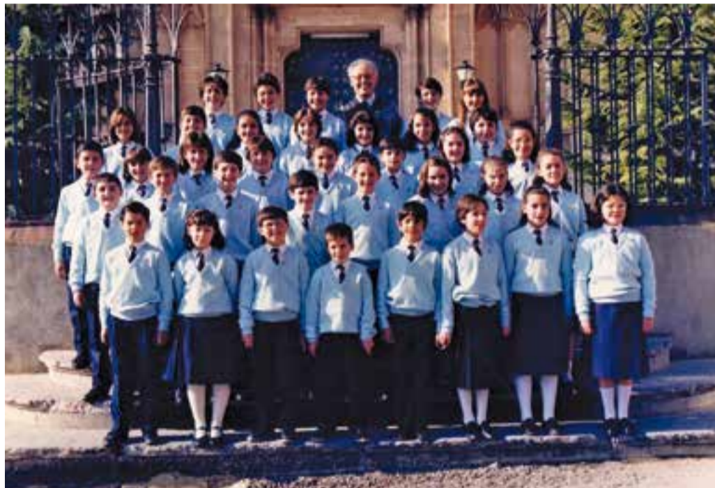
Primera formació del Cor Sant Esteve davant la façana de l'Església a mitjans dels anys 80.

El Cor Sant Esteve aprofitarà el concert per a presentar el projecte que comença i que es diu 'Cantem Àfrica', impulsat per l'Associació Afro-catalana d'Acció Solidària. Un dels camins que fa servir l'entitat és l'edició de cançons infantils d'allà, a més d'algunes d'adults, "melodies arran-