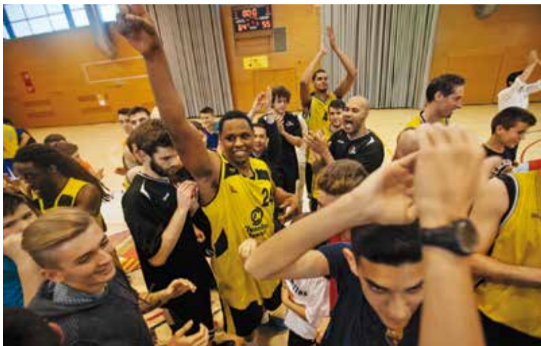
Els jugadors del CB Castellar celebren la victòria en un dels partits del play-out de descens.

Al tercer període, els castellarencs seguien amb la ratxa i tot i haver perdut el tanteig al segon quart (13-11), aquesta vegada superaven clarament al rival amb una renda de cinc punts, que pràcticament sentenciava el partit, arribant al terme dels deu minuts 14 punts per sobre a l'electrònic.