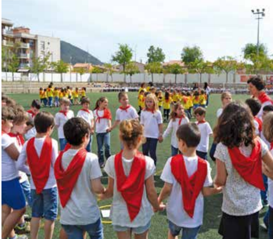
Els alumnes ballant una de les danses al camp de futbol de Pepín Valls.

Al voltant de 800 alumnes de 1r i 2n de primària de totes les escoles de Castellar del Vallès (Bonavista, El Casal, El Sol i la Lluna, Emili-Carles Tolrà, Joan Blanquer, Mestre Pla, Sant Esteve i FEDAC-Castellar) i les escoles Can Sorts, de Sentmenat; El Calderí, de Caldes de Montbui i Folch i Torres i Can Periquet, de Palau-solità i Plegamans van participar el divendres 27 en la 8a edició del Dansem Plegats que es va fer al camp de futbol de Pepín Valls. L'entrada i la sortida dels balladors es va fer amb les notes del Ball de gitanes del Vallès, acompanyat sempre del picar de mans del públic. Els alumnes de 1r van ballar les danses El Rogle (Catalunya) i La Fira (Israel). Els de 2n, La Bolangera (Catalunya) i el Vals Mexicà (Centre Amèrica). I tots plegats van acabar ballant Oh Susana (Estats Units). El Dansem Plegats és el fruit del treball dels mestres de música de les escoles. Serveix per mostrar i compartir la feina feta a l'aula de música de cada escola. La dansa és una activitat d'escola que afavoreix la motricitat, la coordinació i l'expressió corporal. És una activitat de formació integral que posa en joc les tres àrees de la personalitat dels infants: l'afectivo-social, la motriu-física i la intel·lectual-cognitiva. L'activitat està organitzada pel Grup de Treball de Mestres de Música, vinculat al Servei Educatiu del Vallès Occidental VIII, del Departament d'Ensenyament, conjuntament amb l'Ajuntament de Castellar del Vallès. + || REDACCIÓ