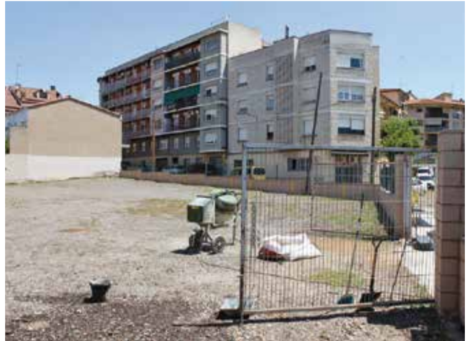
L'aparcament està situat a la cantonada entre els carrers de Clavé i Pedrissos. || CEDIDA

Tant l'accés com la sortida de vehicles es farà pel carrer de Pedrissos. ➔ || C.D.