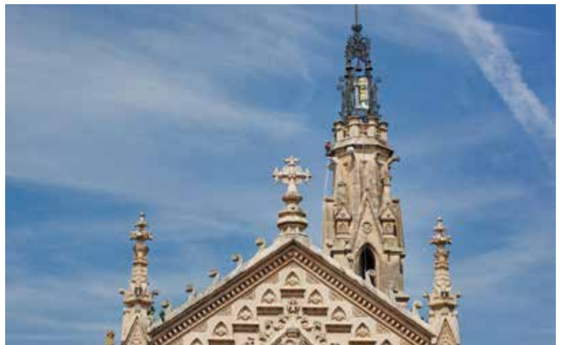
Els operaris de Trever fent les tasques de neteja del campanar.

La restauració i recuperació total del campanar és un dels objectius que s'ha proposat la comissió d'arxiu i patrimoni de la parròquia atenent el que representa el mateix campanar com a símbol del