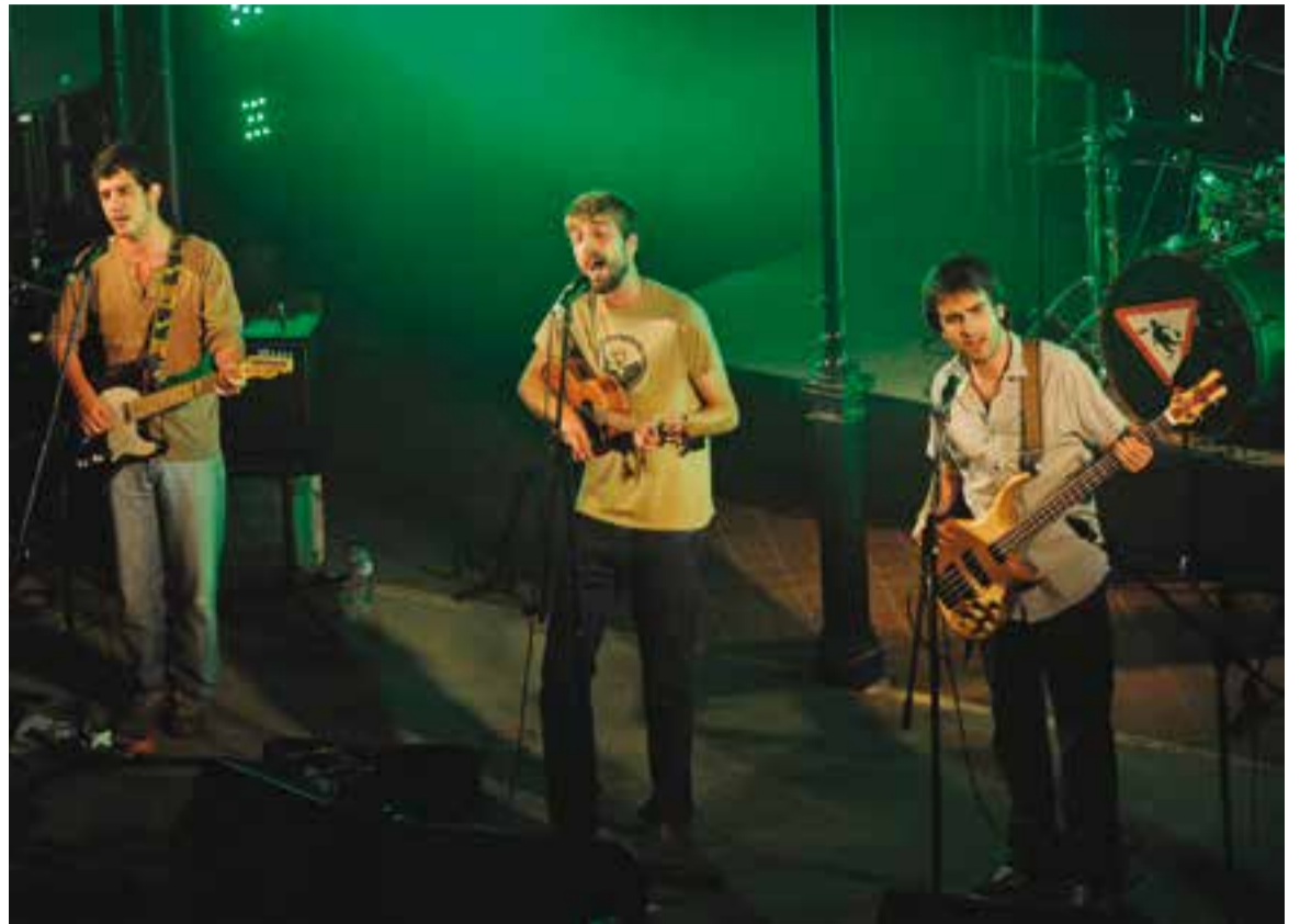
Els Manel van actuar als Jardins del Palau Tolrà al cicle Nits d'Estiu, al juliol de 2009, presentant el primer disc.

Com acostuma a passar des del seu primer disc -ja en porten quatre-, la novetat discogràfica de Manel és tot un fenomen per la quantitat de fans incondicionals que segueixen la popular banda barcelonina, considerats 'gent normal' i que tants bons moments ha donat al pop català dels darrers anys gràcies a hits com 'Al Mar!', 'Teresa Rampell', 'Benvolgut' o 'Ai Dolors'. Ara, amb 'Jo competeixo', els Manel ofereixen un so diferent i noves sensacions rítmiques inèdites fins ara i que ja han mostrat als primers singles 'Les