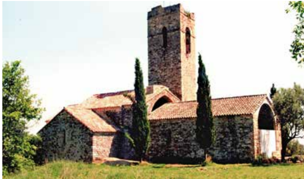
Castellar Vell es va unir a la Basílica de Santa Maria del Pi a través d'una agregació canònica.

FONS DOCUMENTAL DE LA PARRÒQUIA DEL PI La història d'aquest fons documental comença l'any 1561, quan Castellar Vell es va unir a la Reverent Comunitat de Beneficiats de Santa Maria del Pi mitjan-