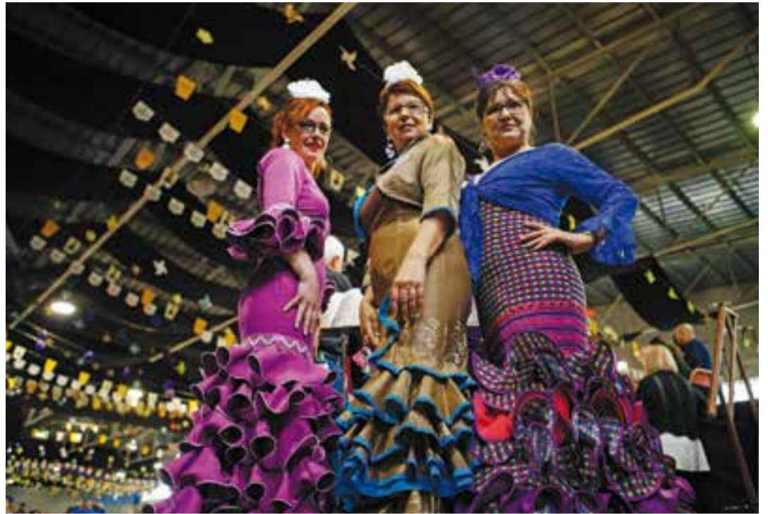
Feria de Abril de l'any 2015.

Diumenge 17 d'abril, a les 10 hores, s'estrena una altra novetat rociera. Es tracta de la Misa Rociera cantada per l'A.C.A. Aires rocieros Castellarencs a l'Espai Tolrà. Després de la missa, a les 11 hores, es donarà el tret de sortida a l'esperada Rua andalusa, que circularà