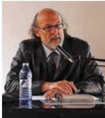
Souvirón a la xerrada a Cal Calissó || M.F.

En el fons es tracta de vendre rentadores i cotxes a la Xina i l'Àfrica mentre s'extreuen les matèries primeres d'Àsia i Àfrica amb el treball d'esclaus. Gràcies