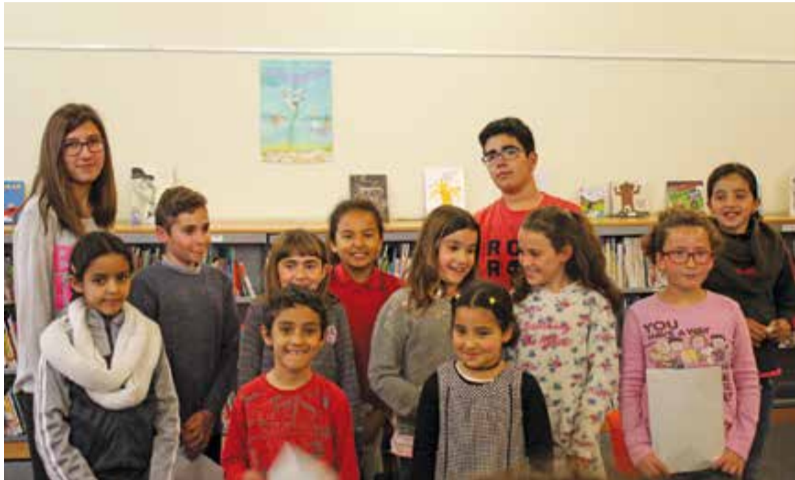
Els dotze infants que van protagonitzar la celebració del Dia Mundial del Llibre Infantil a la biblioteca