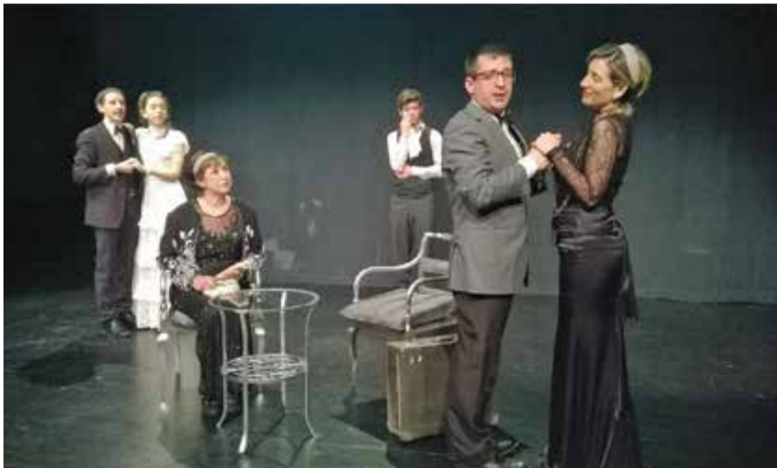
Assaig de l'obra 'La importància de ser Frank' d'Oscar Wilde || ETC

L'ETC estrena a la Sala de Petit Format 'La importància de ser Frank'