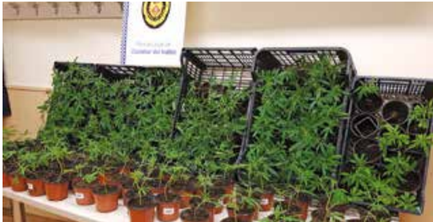
L'estupefaent a les instal·lacions de la policia local, aquesta setmana.

La Policia Local de Castellar del Vallès va comissar la matinada del passat 4 d'abril un total de 259 plantes de marihuana que es trobaven a l'interior d'un vehicle estacionat al carrer de Llivia, a la urbanització de l'Aire-Sol D.