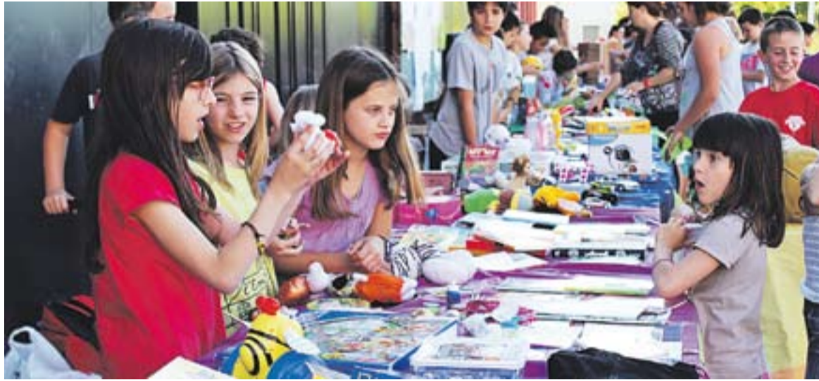
© Una de les activitats més concorregudes va ser el mercat d'intercanvi de puzzles i joguines. || R. GÓMEZ

Amb un sol de ple estiu, com a convidat estrella, al punt de les 5 de la tarda i fins a les 8 del vespre, es van instal·lar a la plaça Major una mercat d'intercanvi d'objectes, amb una trentena de parades, jocs inte-