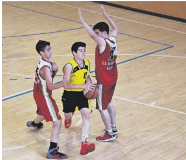
Una acció del partit del Fair Play entre el cadet B i el Sant Nicolau.

El cap de setmana al pavelló Puigverd va estar marcat pels amistosos del Fair Play, que van involucrar tots els partits del club; i, sobretot, pel sopar de cloenda de la temporada. Es va fer balanç i hi van haver moments molt emocionants: tots els jugadors en etapa de formació, des de l'escola fins als cadets, van rebre un diploma personalitzat pels seus entrenadors; es va poder veure un vídeo sorpresa elaborat per Sergi Sabando amb imatges divertides de tots els equips; i el cadet B va poder explicar el seu projecte "Aspiraciones-Cambia tu Mundo", amb epíleg audiovisual inclòs. L'endemà, els dos sèniors van vèncer: el masculí, contra el Cardedeu (66-52); i, el femení, contra el Ripollet (50-33). +