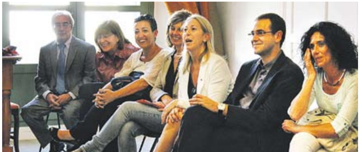
© Munté amb autoritats municipals i del seu departament a l'Antic Ajuntament. || R. GÓMEZ

ran beques a les entitats que durant l'estiu duguin a terme activitats socioeducatives i que incloguin àpats durant la jornada