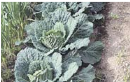
El nostre hort ecològic Autora: Antònia Ramón

Envia'ns fotos fetes amb el mòbil: lactual@castellarvalles.cat