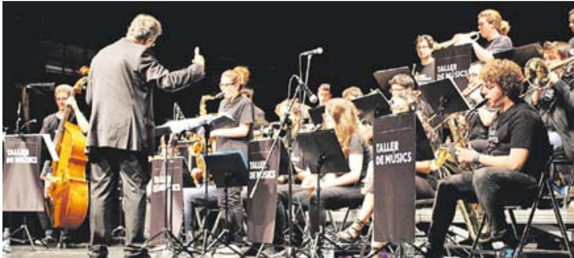
La Jove Big Band del Taller de Músics va tancar el curs de L'Aula amb un repàs a la història del Jazz.