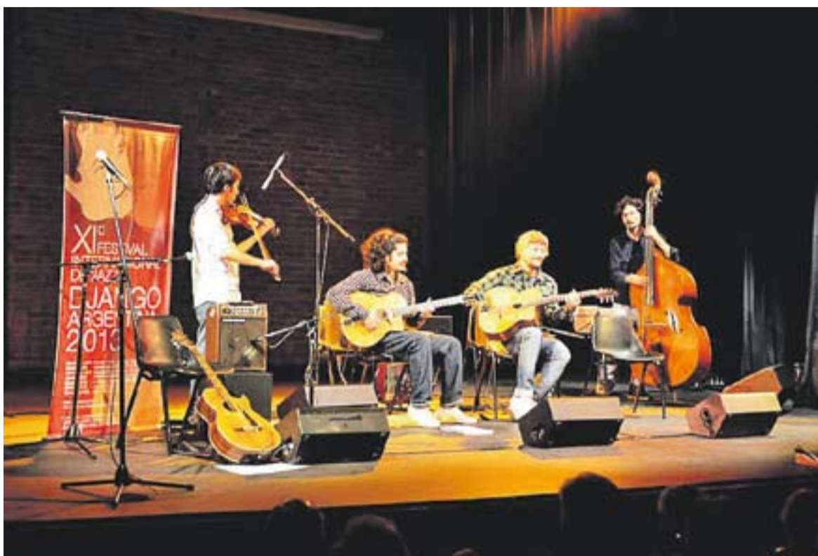
Els quatre membres de Jazz Moustache durant un dels seus concerts.