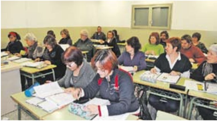
Alumnus de l'Escola d'Adults en una de les classes del centre

L'Escola Municipal d'Adults obre el proper dilluns dia 16 de juny el període d'inscripcions a les disciplines de l'oferta formativa que s'impartirà al centre el proper curs 2014-2015. "Durant dues setmanes rebrem a les persones interessades en conèixer l'Escola d'Adults i la formació que oferim", ha explicat la directora del centre, Antònia Pérez. L'oferta per al curs 2014-2015 és com la del curs passat i inclou els següents àmbits: Formació instrumental de primer, segon i tercer nivell, Ensenyaments inicials, Graduat d'Educació Secundària (GES), Preparació per a les proves d'accés a cicles formatius de grau mitjà o superior, Preparació per a l'accés a proves de majors de 25 anys i de 45 anys, Curs per a novinguts, Necessitats educatives especials i Literatura. La directora del centre, Antònia