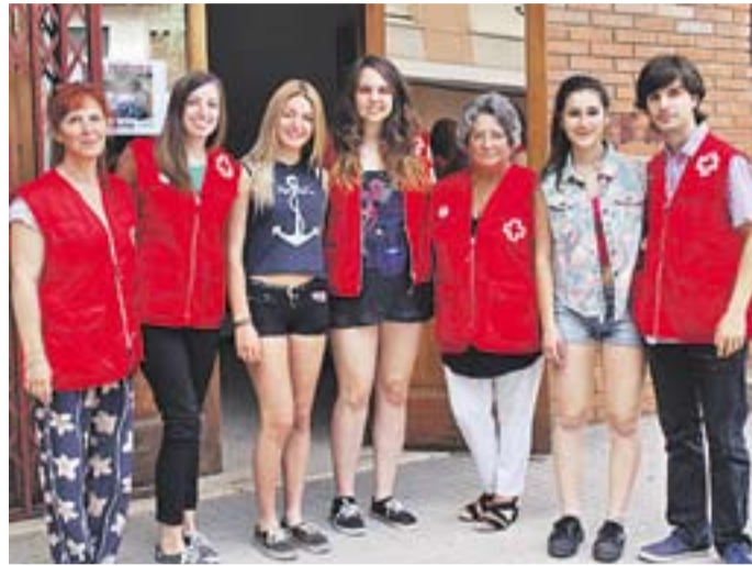
© Voluntaris de Creu Roja a la porta de la nova seu. || C. DOMENE