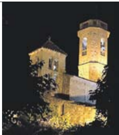
Campanar "la nit" Autor: Àngel Pastor