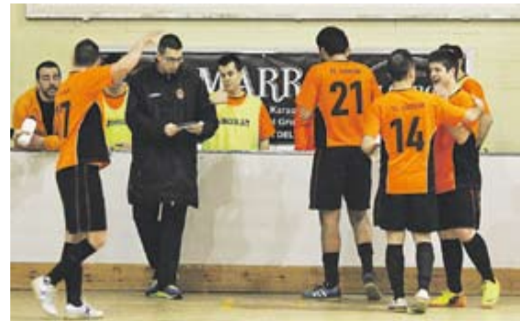
© Jiménez -amb la jaqueta negra-, en un temps mort aquesta temporada. || M. CORNET