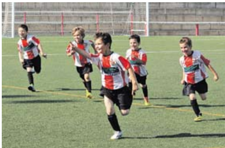
Imatges de les competicions prebenjamina, d'escola i femenina.