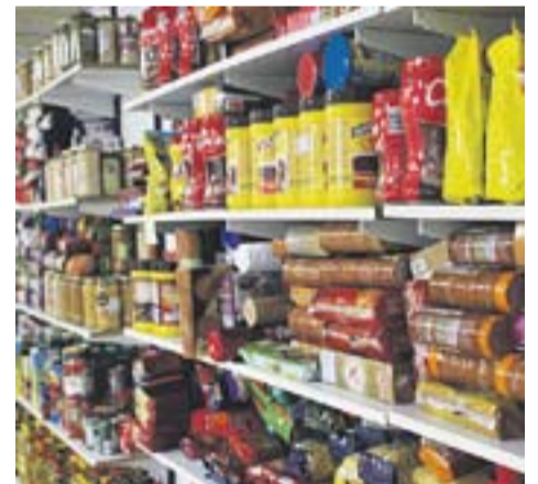
© Aliments recaptats a la 3a edició. || C. DOMENE

Aquest òrgan ha iniciat aquesta mateixa setmana la tasca de classificació, ordenació i elaboració dels lots. Per a aquesta feina es tornarà a comptar amb la col·laboració de voluntaris que han estat mobilitzats per Càritas-Via Solidària i Creu Roja Castellar. Els lots es distribuïran entre unes 200 famílies amb necessitats socioeconòmiques usuàries de la Regidoria de Serveis Socials i les entitats de la vila. ➤