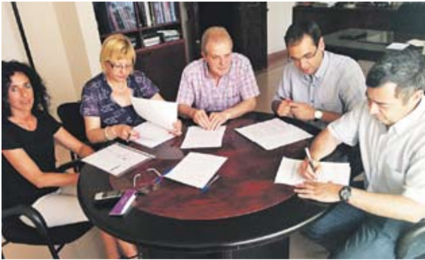
Moment de la signatura del conveni a l'Ajuntament.

L'Ajuntament cedeix l'equipament de la plaça de la Llibertat perquè es converteixi en el seu nou local