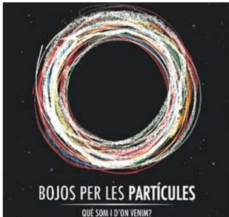
© Cartell del documental 'Bojos per les partícules'. || CEDIDA

El Documental està dirigit per Mark Levinson i ha rebut tres premis l'any 2013. La projecció a Castellar és possible gràcies a la col·laboració de Cal Gorina, L'Aula d'Extensió Universitària i el CCCV. +