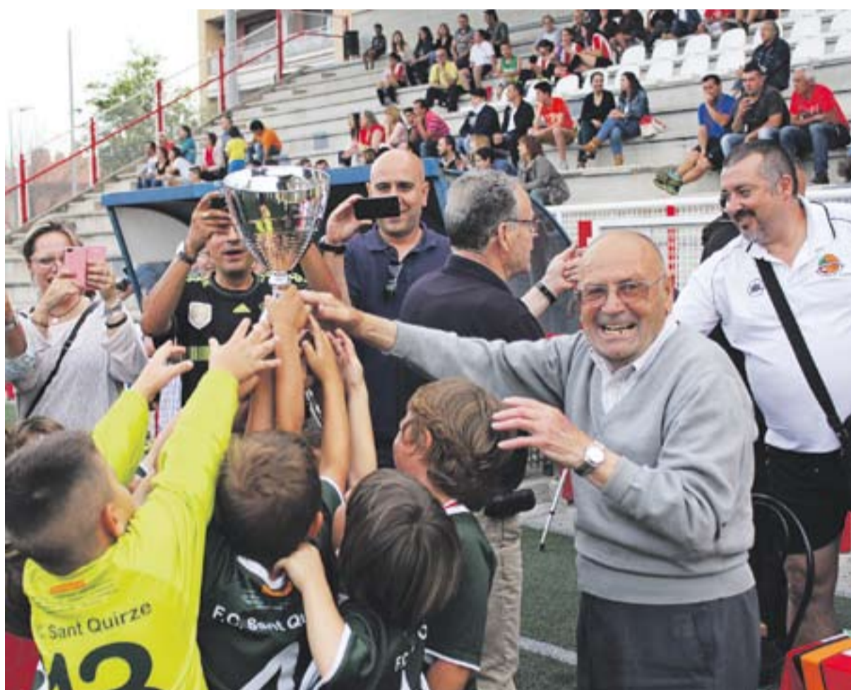
© Joan Cortiella lliura la copa als guanyadors del torneig de Prebenjamí A al Sant Quirze. || M. CORNET ESPORTS P21