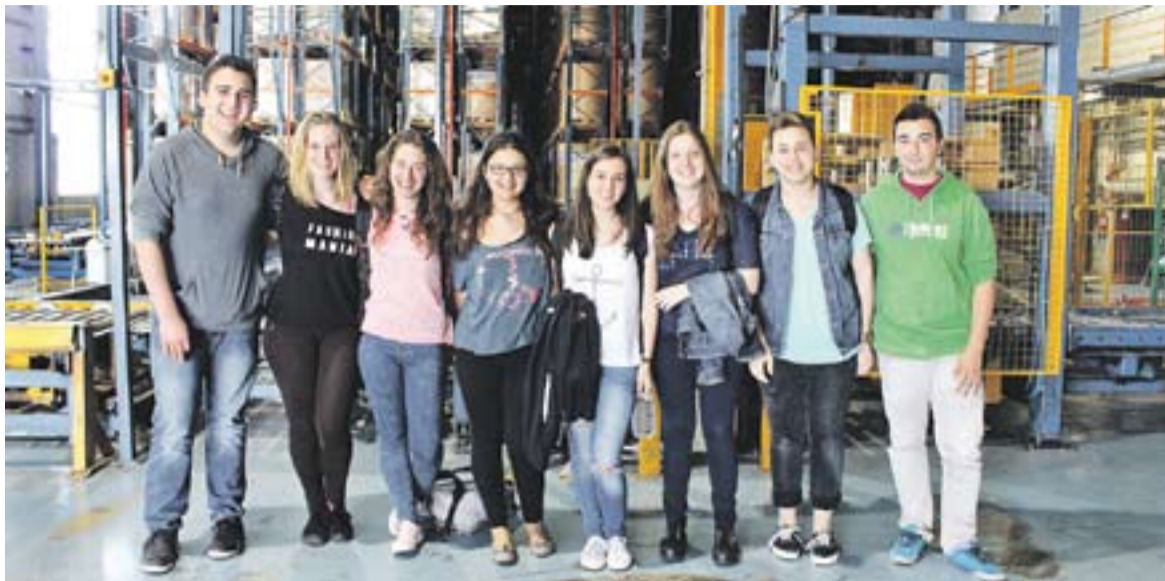
© Alguns dels participants de L'Actual Jove durant la visita que van fer a la rotativa on s'imprimeix L'Actual. || R. GÓMEZ