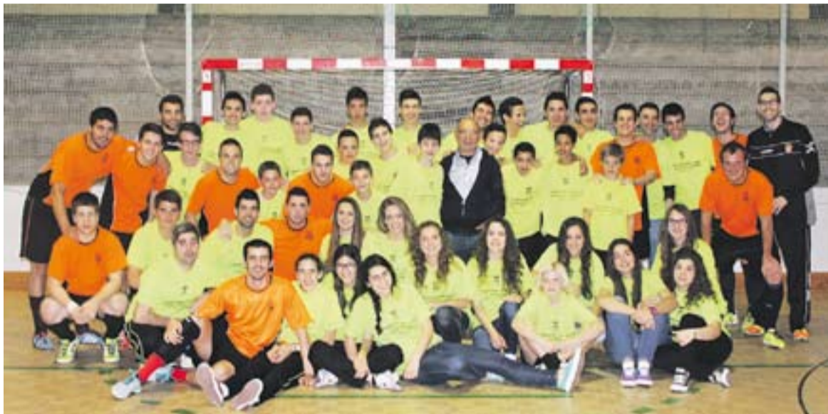
© Foto de família dels jugadors del sènior A, del juvenil, del juvenil-cadet femení i de l'aleví A del FS Castellà. || M.C.B.