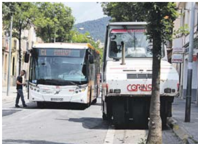
El transport públic mantindrà el seu recorregut habitual.