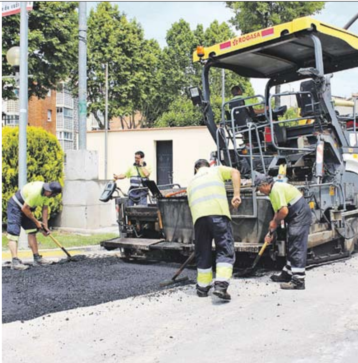
Obres de reparació de l'asfaltat al Passeig, dimecres passat.

La reparació de l'asfaltat és el segon paquet d'actuacions que es posa en marxa dins el POMU 2014, iniciat el passat mes de març amb l'arranjament de 275 guals de vianants. Una vegada finalitzi la campanya de reparació, en començarà una altra de senyalització horitzontal de vials.