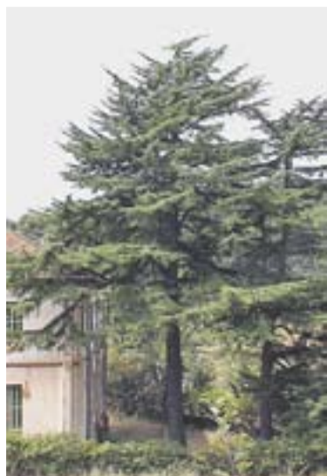
© Cedre centenari. || A. CAMPO

cultural. A l'any 2000, es va crear un llistat a partir d'aquestes primeres fitxes. El 2004 es va portar a terme una actualització i digitalització del catàleg, es va crear un fitxa de cada arbre o arbreda, es van fotografiar i es van localitzar amb GPS, confeccionant un plànol del terme amb les diferents espècies. També es proposaven una sèrie de rutes per tal de conèixer part d'aquest arbres. Així, el llistat consta d'un centenar d'arbres i unes 9 arbredes. Les diferents espècies estan agrupades per paratges. Respecte a les espècies, les alzines són les més catalogades, seguit dels pins blancs, i els pins pinyers. || REDACCIÓ