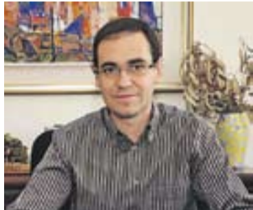
© Ignasi Giménez, alcalde. || A.

Segons l'alcalde, un dels temes que s'haurien de tractar en aquest congrés és el posicionament pel dret a decidir. “Cal explicar d'una manera molt clara que estem a favor del dret a decidir. Molts alcaldes