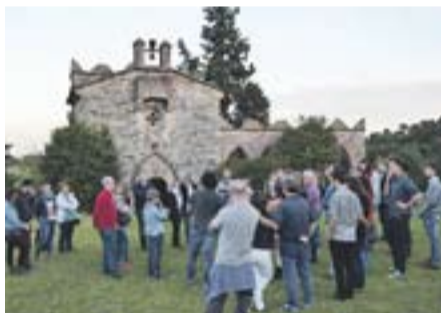
Visita al Castell de Clasquerí Autor: Óscar Moreno