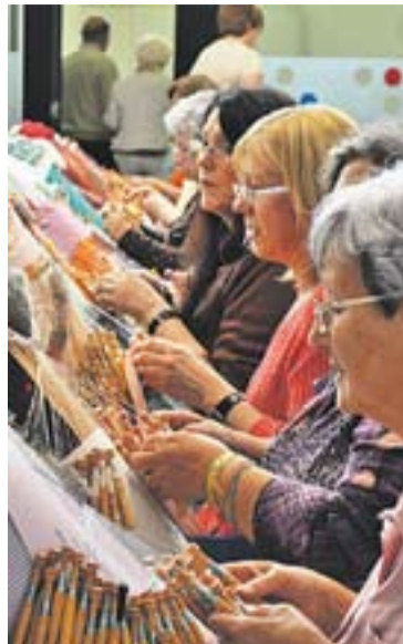
Trobada de puntaires.

temps, l'acte es va traslladar a l'Espai Sales d'El Mirador. Dins d'una de les sales es va fer l'exposició de treballs fets pels alumnes de l'escola i, en una altra, hi van preparar tots els obsequis que van recollir dels comerços de la vila per a poder fer el tradicional sorteig. Els regals que encara no s'han recollit són el 6201, 7741, 5741, 6241, 4721, 5971, 6171 i 6411. Qui els tingui pot trucar al 93 714 89 87 o bé al 93 714 27 41 i se'ls convocarà per fer l'entrega. Tothom va coincidir que va ser una tarda molt agradable i les puntaires ja esperen la de l'any que ve. ➔