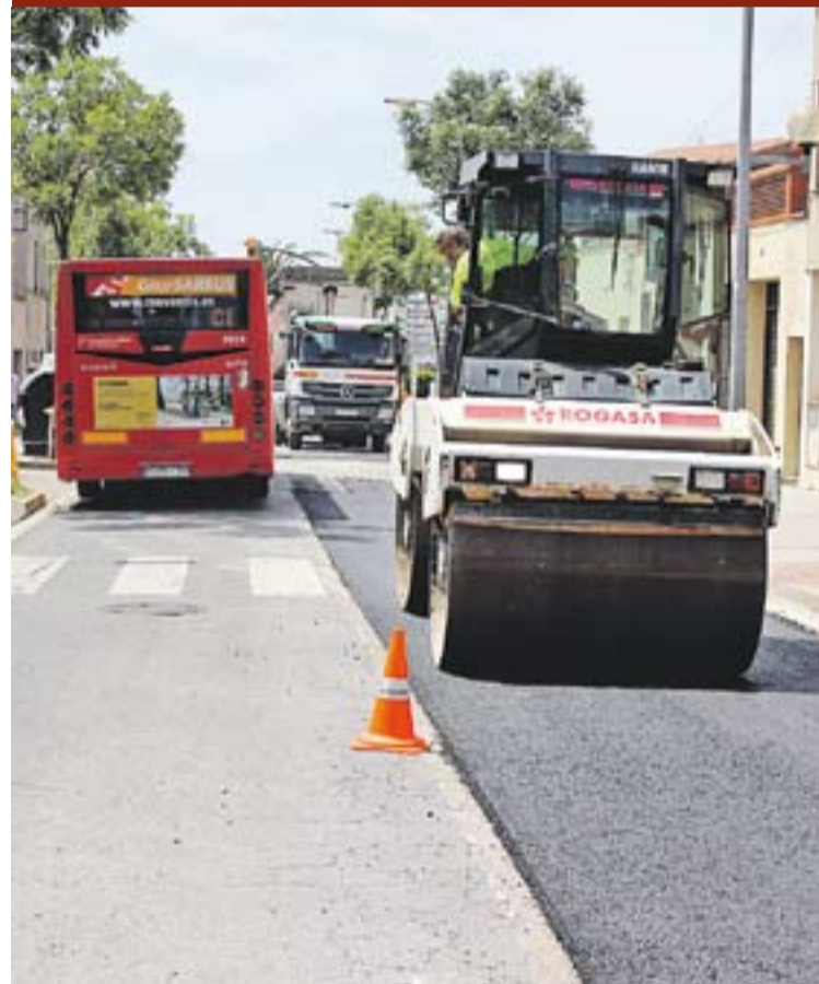
Les obres de pavimentació del carrer Passeig van començar dimecres.