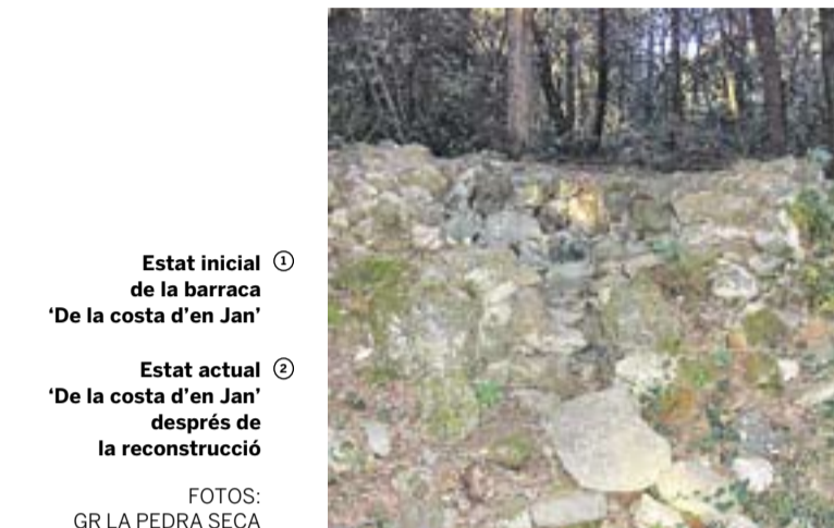
① Estat inicial de la barraca 'De la costa d'en Jan'

El grup, que ja ha indexat 132 barraques de vinya i altres 280 elements de pedra seca, considera excel·lent la idea d'incloure en un catàleg aquests elements. “És una manera de conservar les coses, si està dins el Catàleg, vol dir que es protegirà. Si per exemple, una persona demana permís per tallar arbres, li podran avisar que en aquella zona hi ha dos o tres barraques i que per tant, haurà d'anar en compte i no fer-les malbé”.