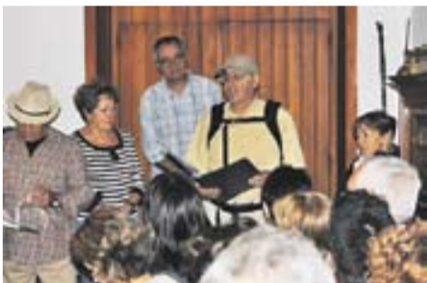
Iniciant la passejada literària Autor: Sergio Ruiz

Envia'ns fotos fetes amb el mòbil: lactual@castellarvalles.cat