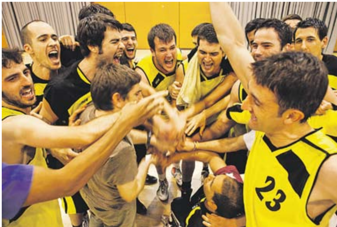
Els jugadors i el tècnic del Club Bàsquet Castellar celebren al mig de la pista el decisiu triomf contra el Sant Fruitós.

El segon quart va ser el millor del Sant Fruitós, que va riobar a guanyar de vuit (28-36). Tot i això, Murúa, amb nou punts, va mantenir viu el Castellar, i un altre triple en l'últim instant, ara de Cadafalch, va capgirar el factor moral abans del descans (36-40).