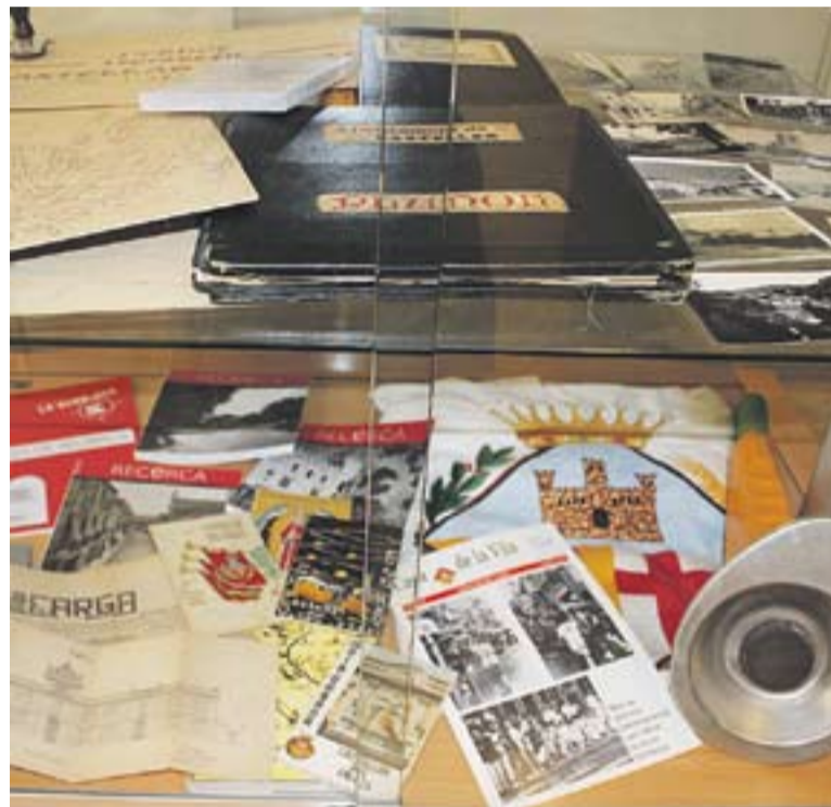
© Material de l'Arxiu Municipal exposat per al Dia Internacional. || M. ANTÚNEZ

Quan la documentació arriba a l'Arxiu, s'organitza, es classifica i es posa a disposició de l'usuari i del mateix Ajuntament. "La consulta es pot fer via instància a través dels diferents departaments o bé la podem consultar presencialment, al mateix arxiu", comenta l'arxivera. A més, també es pot demanar per correu electrònic, tot i que en cap cas se cedeix en presència, com sí que es fa amb els do-