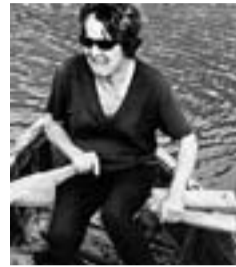
Remei Company remant una barca