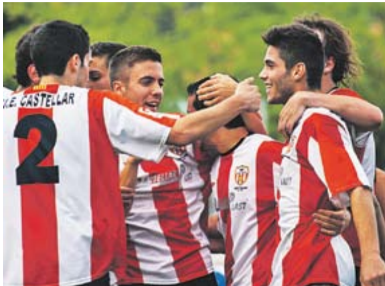
Els jugadors del filial de la Unió Esportiva, en plena celebració.

Diversos castellarencs van assistir en directe a la gesta, tot viatjant en els dos autocars que