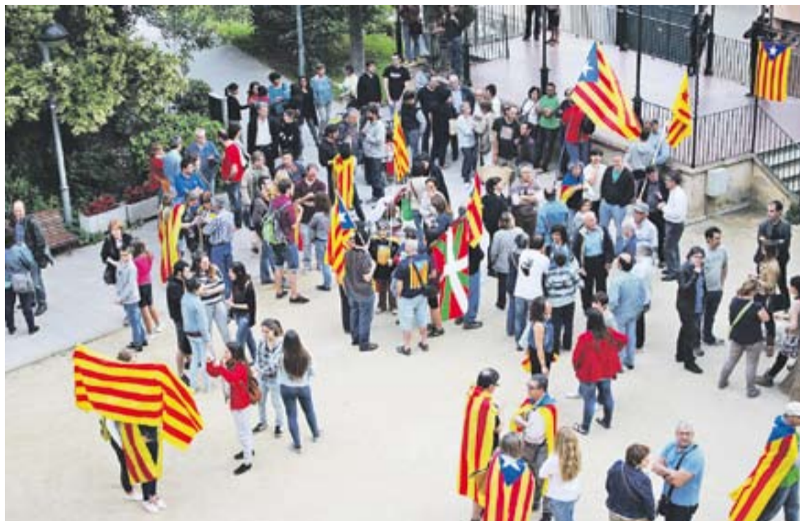
Concentració per la República Catalana als jardins de Palau Tolrà, dilluns passat.

Al punt de les 8 del vespre, un degoteig constant de castellarencs, molts d'ells amb estelades i fins i tot alguna ikurriña, es van apropar als jardins del Palau Tolrà, punt de trobada per a la concentració en suport a la república catalana que els partits de L'Altraveu i la secció local d'ERC havien convocat just després de la notícia del dia: l'abdicació del rei Joan Carles I. Fins a 150 persones es van concentrar durant poc més de 30 minuts davant de l'ajuntament, on en algun moment puntual es van escoltar crits com "Visca la República!", "Visca Catalunya!" o "Independència!".