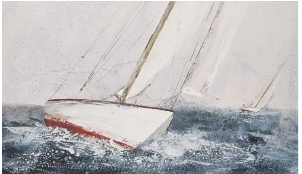
© Un dels quadres de l'exposició de l'Enric Aguilar on s'observa un veler a la mar brava. || E. AGUILAR

composició de quadres on es representen, amb la tècnica mixta de l'oli i l'acrílic, la imatge idíl·lica d'unes barques reposant vora el mar o en plena acció sobre les onades.