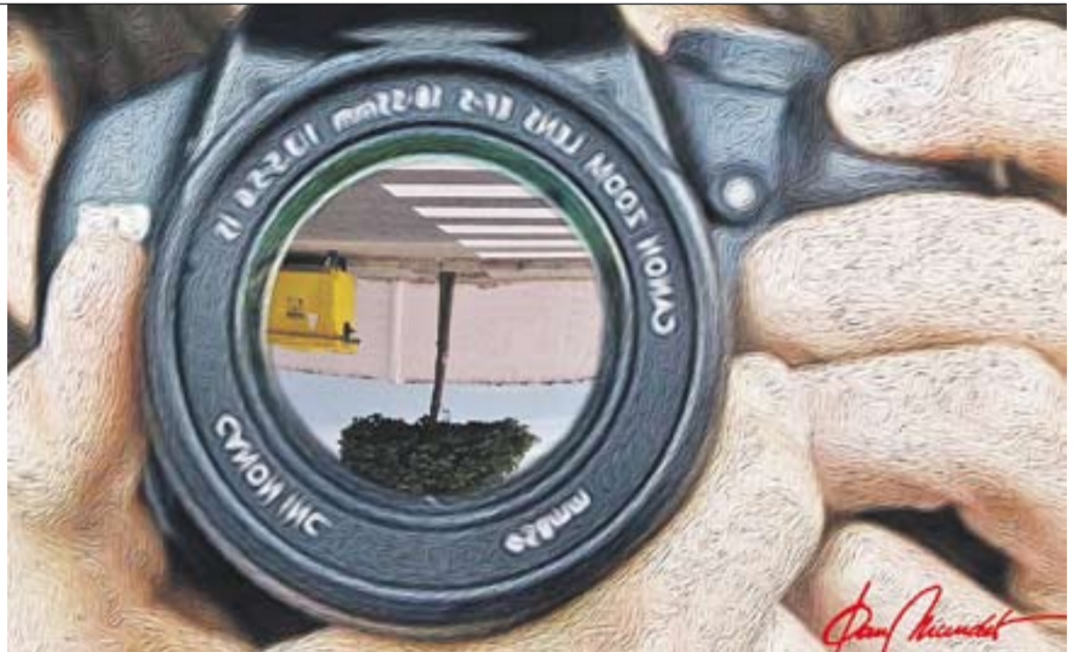
© Passejant pel carrer. || JOAN MUNDET

Si ja ens arribem fins el carrer Major, comprovarem que, sense que sigui tampoc el més petit, de major no en té res. Anem a parar al Mirador, i des de dalt podem gau-