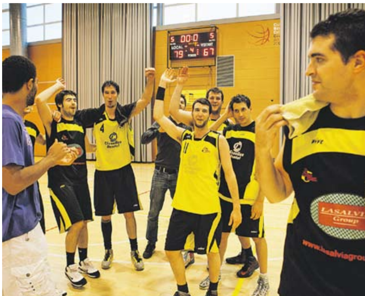
© Els jugadors celebren la salvació amb entusiasme després de guanyar 79 a 67 al Sant Fruitós. || Q. PASCUAL ESPORTS P21