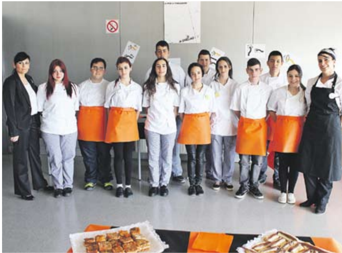
© Els alumnes del PQPI de Cuina de l'INS Puig de la Creu, amb la tutora del curs, Sara Fornés || C. DÍAZ

De fet, aquest és l'objectiu del PQPI, que els joves que hi participen, que no tenen el graduat en ESO, puguin trobar una nova oportunitat per reprendre l'itinerari acadèmic i laboral. A banda de les classes de cuina, també es van desenvolupar a El Mirador aprenentatges bàsics per a la transició al món laboral o per a la continuació educativa. El PQPI també ha inclòs pràctiques a empreses. El càtering del proper divendres serà la festa de final de curs, una