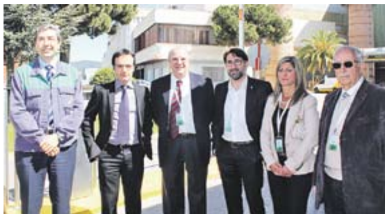
© Fisas, al centre, amb representants de Vidrala i del PP. || C. DOMENE

Santiago Fisas, candidat del PP a les Eleccions Europees i eurodiputat des del 2009, va passar divendres, 2 de maig, per Castellar. Fisas va visitar l'empresa Vidrala i unes hores després va passar pels micròfons de Ràdio Castellar: “M'ha agradat molt conèixer Vidrala perquè, a més de ser important per a Castellar, és important per a Catalunya i per a tot Espanya, perquè exporta molt i perquè les principals marques de begudes són clients d'aquesta empresa”, va afirmar el candidat, que va afegir que les empreses són fonamentals per al PP i que, per això, en el seu programa hi ha un suport explícit a les PIME i als autònoms: “Aquestes empreses poden generar molta ocupació, que és el principal repte que tenim sobre la taula”. Segons Fisas, també és de vital importància per a Catalunya l'aposta que s'ha fet pel Corredor del Mediterrani: “Aquest projecte està