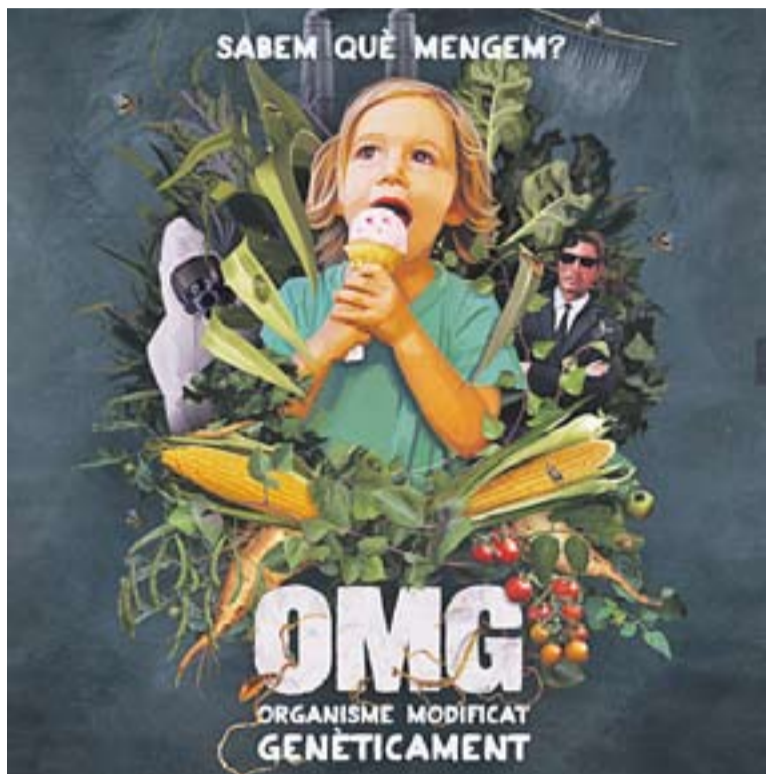
© Cartell del documental "OMG: Organisme Modificat Genèticament". || CEDIDA

Aquest divendres, el Documental del Mes reflexiona sobre el que mengem