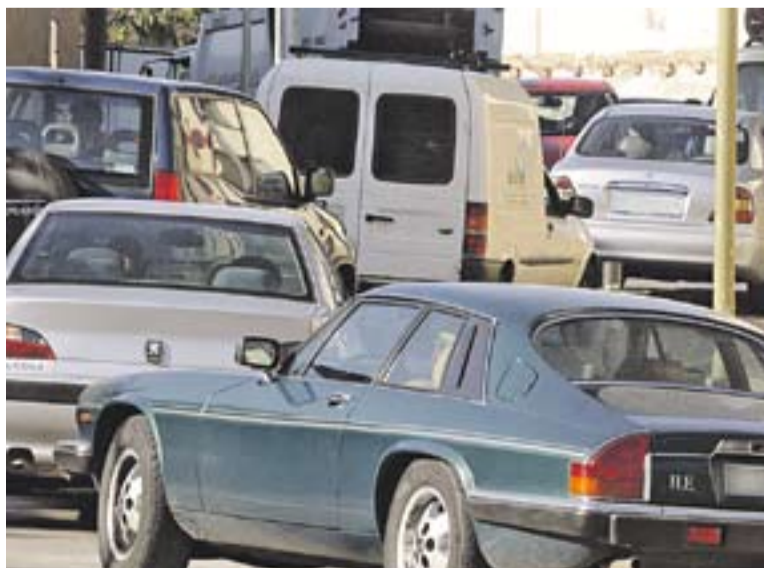
© En els últims tres anys el parc ha augmentat en 92 unitats, un 0,56%. || ARXIU

Castellar compta amb un total de 16.554 vehicles, segons dades del padró fiscal d'aquest 2014 facilitades per l'Organisme de Gestió Tributària de la Diputació de Barcelona. Pel que fa a la tipologia, 11.698 són turismes, fet que equival a una ràtio d'un cotxe per cada dos habitants. La resta de vehicles es distribueixen en 2.397 motocicletes i ciclomotors, 1.923 camions, 290 remols, 238 tractors, i 8 autocars. El parc de vehicles de Castellar és pràcticament el mateix que el dels darrers tres anys, ja que només ha augmentat en 92 unitats, amb un increment del 0,56%. Hi ha 259 turismes, 75 ciclomotors i motocicletes i 15 remols més, mentre que hi ha 206 camions, 44 tractors i 7 autocars menys. † || REDACCIÓ