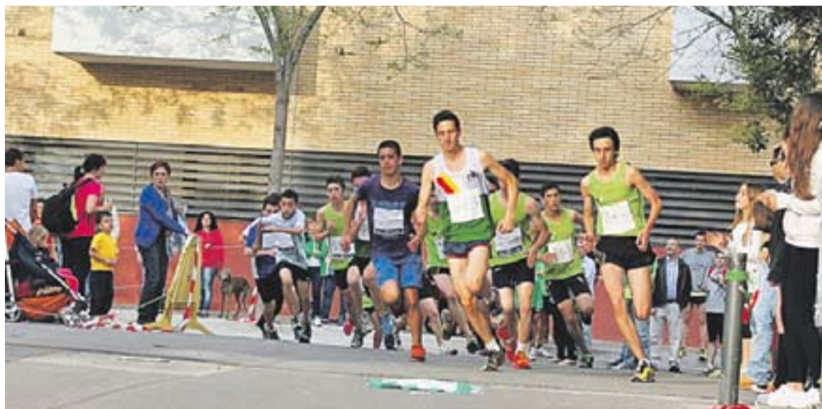
CLUB ATLÈTIC CASTELLAR