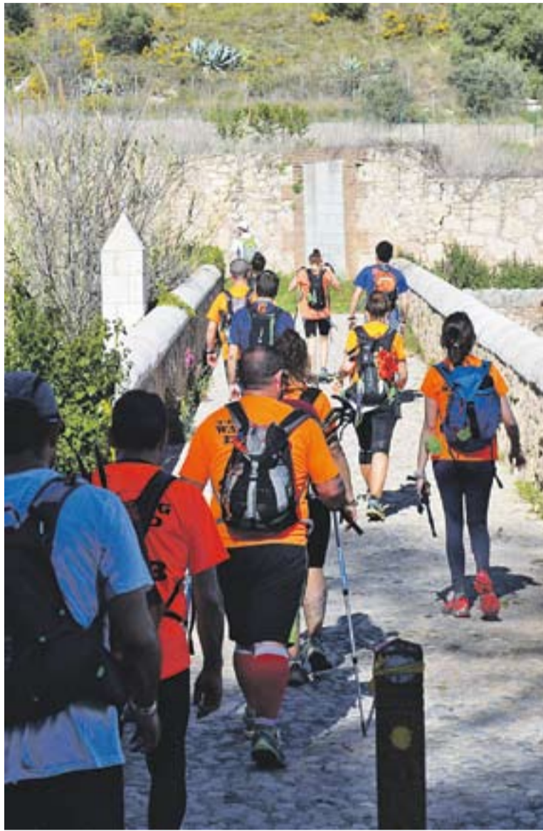
© El CEC, la 2a entitat amb més socis, ha fet fa poc la Ruta de les Ermites. || O. MORENO

TIPUS D'ENTITATS || Pel que fa a la tipologia de les entitats, quasi una tercera part correspon a l'àmbit de Cultura i Lleure (31%), amb 52 entitats i 2.792 associats. L'àmbit social constitueix pràcticament una altra tercera part del registre (31%), amb 52 entitats i un pes considerable d'associats: 5.918. En aquest