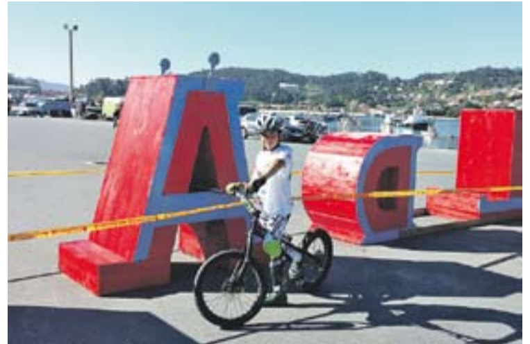
© Alan Rovira, en la competició disputada a Cangas del Morrazo. || CEDIDA

CICLISME | CAMPIONAT D'ESPANYA DE BIKE TRIAL