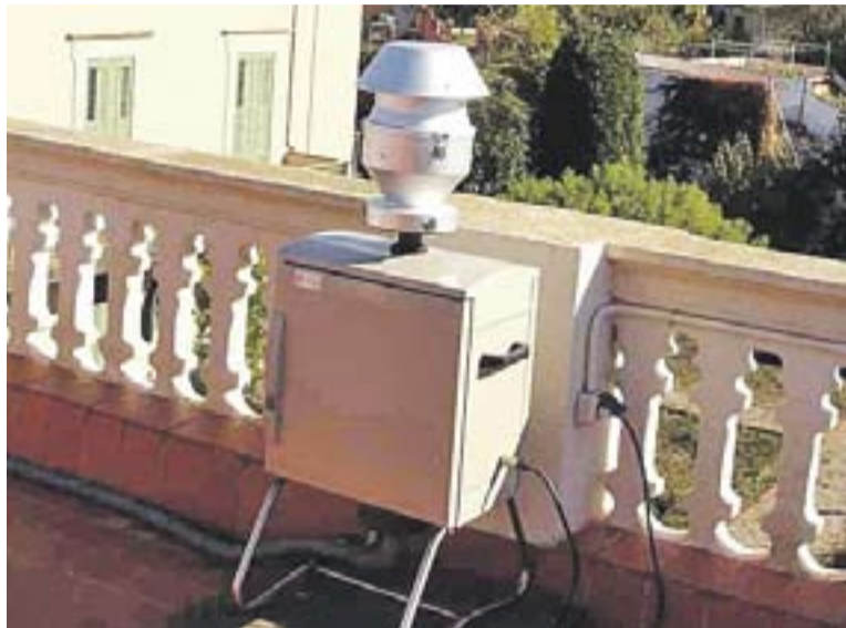
Captador de partícules instal·lat a la teulada de la Casa Massaveu.

Quant a l'estudi de la Diputació, s'ha centrat en mesurar la contaminació atmosfèrica a través de