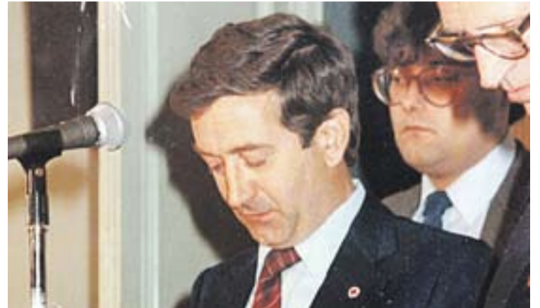
© Mas el dia de la constitució de l'Ajuntament al juny de 1983. || ARXIU