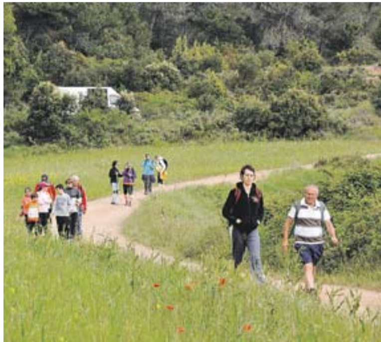
Una imatge de la Caminada de l'any passat.

La Caminada Popular de Castellar del Vallès, una prova esportiva sense caire competitiu organitzada per l'Ajuntament de la vila i el Centre Excursionista, celebrarà el proper diumenge, dia 11 de maig, la seva 27a edició. Enguany, la sortida oficial es podrà fer de manera lliure entre les 7.30 i les 8.30 hores des del vestíbul de l'Auditori Municipal, previ segellat de la butlleta d'inscripció. Des d'aquí, els participants hauran d'anar fins al control de la sortida, situat a l'església de Sant Esteve, per començar a recórrer els 18 km de la prova. Els controls de pas se situaran enguany a Can Messeguer, la Torre Turull, els safareigs de Ca n'Ametller i l'Hípica Castellar (a la carretera de Sentmenat), per acabar a l'església de Sant Esteve, on es tancarà el control d'arribada a les 15 hores.